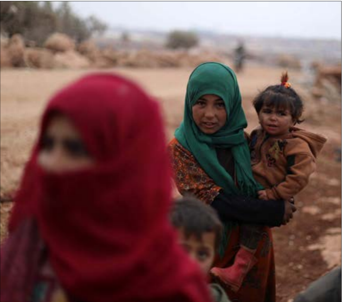
تريد «قسد» تحلّل الطيران السوري، بوجه تركيا، فيما ترفض إطاء أيّ من مساحات سيطرتها

بخصوصيتها العسكرية، أي بوجود إمكانيّة افتتاحه بإدارة مشتركة مع الحكومة السورية، فينبع حديث «قسد» عنه من احتياجها إلى استرجار المزيد من المساعدات الإنسانية للمخيمات التي تسيطر عليها، والتي