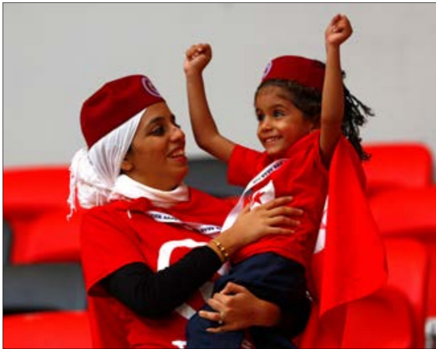
حققت تونس فوزاً كبيراً في المباراة الافتتاحية على حساب موريتانيا

في ظل ضرورة الموازنة بين إيرادات الأندية ومدفوعاتها، ووضع الكثير من العوائق أمام نوع الإيرادات التي يتطلع إلى استبدال FFP بحد أقصى للراتب ووضع ضريبة على التحويلات، لكن الاتحاد رفض فكرة الإنهاء مشيراً إلى أن «التكثيف» هو الوجهة المقبلة. عقد المسؤولون داخل الاتحاد الأوروبي اجتماعاً واستقروا