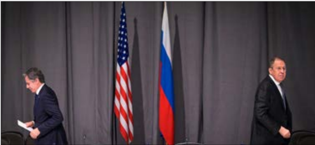
اللقاء لفرووف بيلينك على هامس اجتماع منظمة الأمن والتعاون في أوروبا، في ستوكهولم