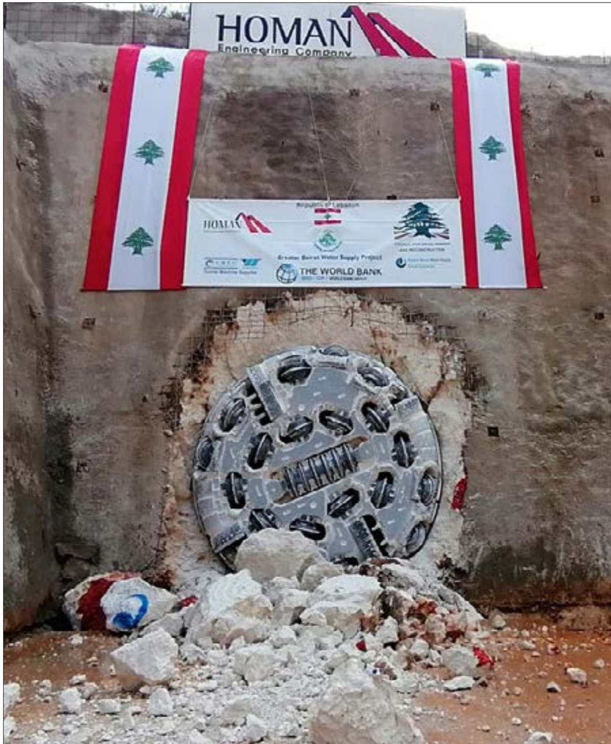
رغم «تفضيك» الاستشاري عدم إقامة المقلع لم يوص، الإنماء والإعمار، بإلغاء المشروع كلياً (الأخبار)

قانوناً، يرأس المجلس الوطني للمقلع وزير البيئة المعني بطبيعة الحال بهذا الموضوع. في اتصال مع «الأخبار»، اكتفى وزير البيئة ناصر ياسين بالإشارة إلى وجوب مراجعة الملف، لافتاً إلى أن المقلع لا يحصل على رخصة في حال كان له تأثير على مصادر المياه. «لكن هذه الحالة لا تتعلق بالتأثير على مصدر المياه وإنما تتعلق بالتأثير على أنفاق جرّ المياه وهي منشآت هندسية وليست مصادر طبيعية»، وفق المصادر نفسها، مُضيفاً: «أما