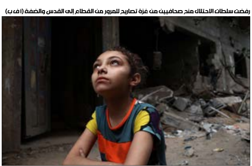
رفضت سلطات الاحتلال منح صحافيين من غزة تصاريح للمرور من القطام إلى القدس والضفة

يتعرض الصحافيون الفلسطينيون في الضفة الغربية المحتلّة وقطاع غزة لعمليات ابتزاز من قبل مخابرات الاحتلال، تستهدف التضيق عليهم