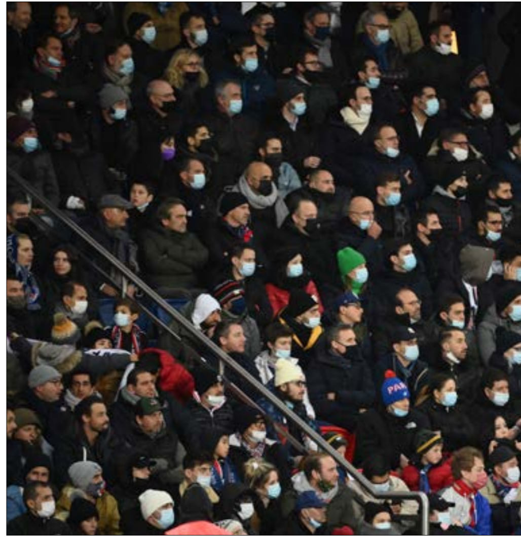
دائماً ما يكون باريس سان جيرمان تحت جهر الملاعب بالارام

انخفض الدخل بشكل كبير مع دم تمكن المشجعين من حضور المباريات