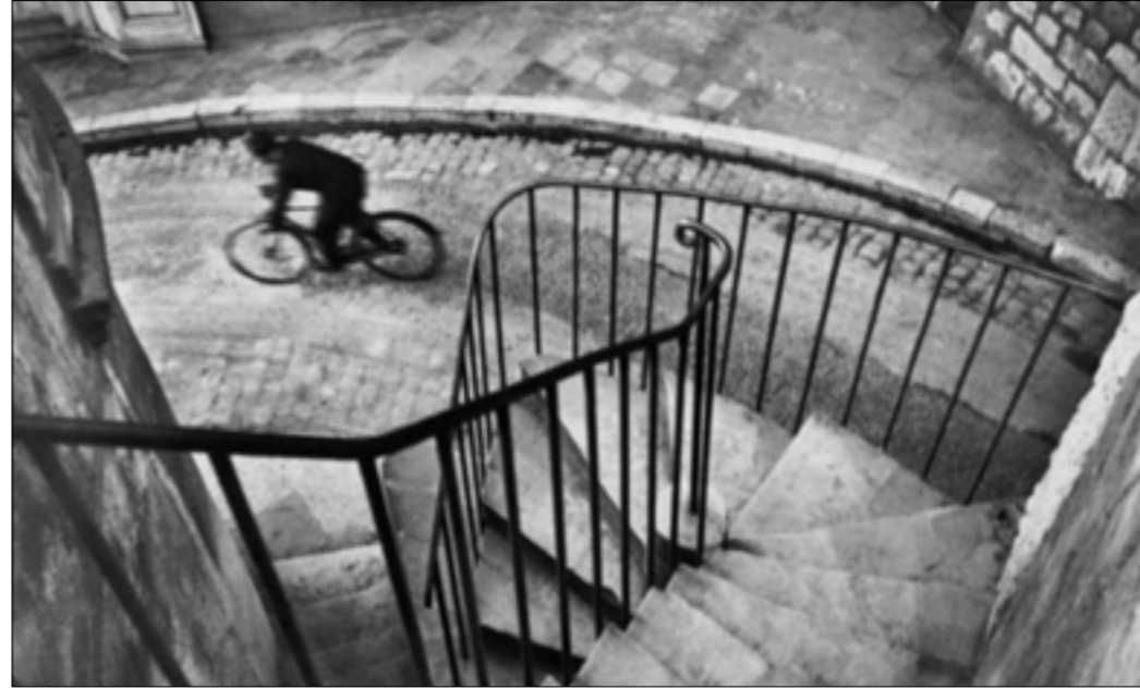
أبير - فرنسا (1932)