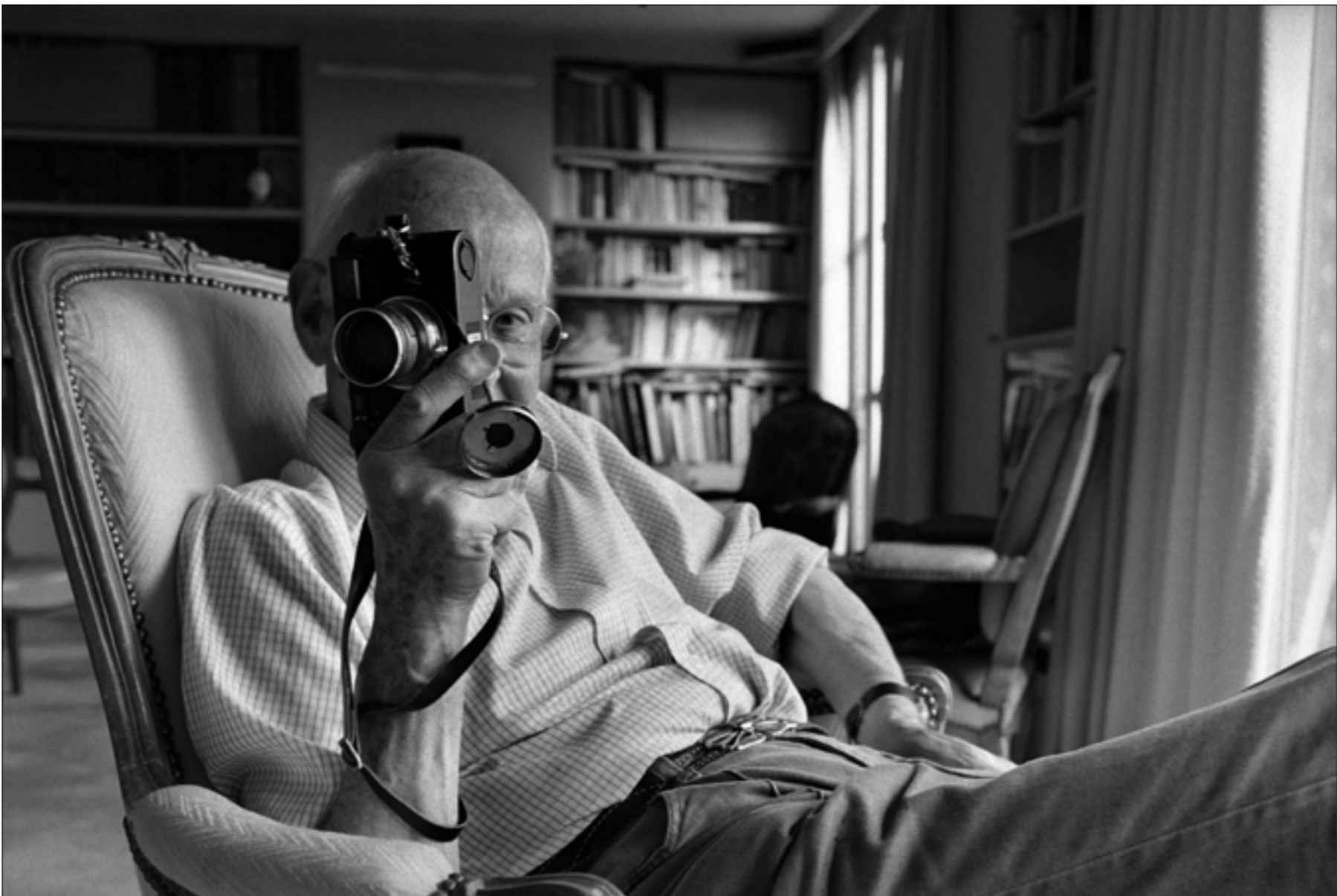
يطرح هنري كارتييه بروسون سؤالاً مكرباً يتصل بملاحة الفوتوغرافيا بالتاريخ