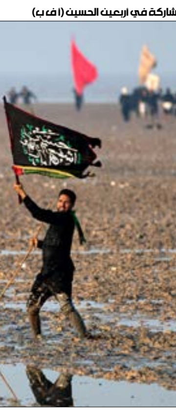
عراقي يلوح بعلم على شاطئ الخليج قبل بدء رحلة السير من مدينة الفو إلى كربلاء للمشاركة في ارميت الحسين

من جانبها، تقول المتحدثة باسم المفوضية، جمانة غلاي، لـ«الأخبار» إن «التحالفات والأحزاب، سواء كانت قديمة أو جديدة، لديها نشاط كبير لخوض الانتخابات المحلية. وهذا ما دفع الكثير منها إلى الاستعداد المبكر من خلال التحالف أو ضمان جماهيرها من خلال عدة برامج».