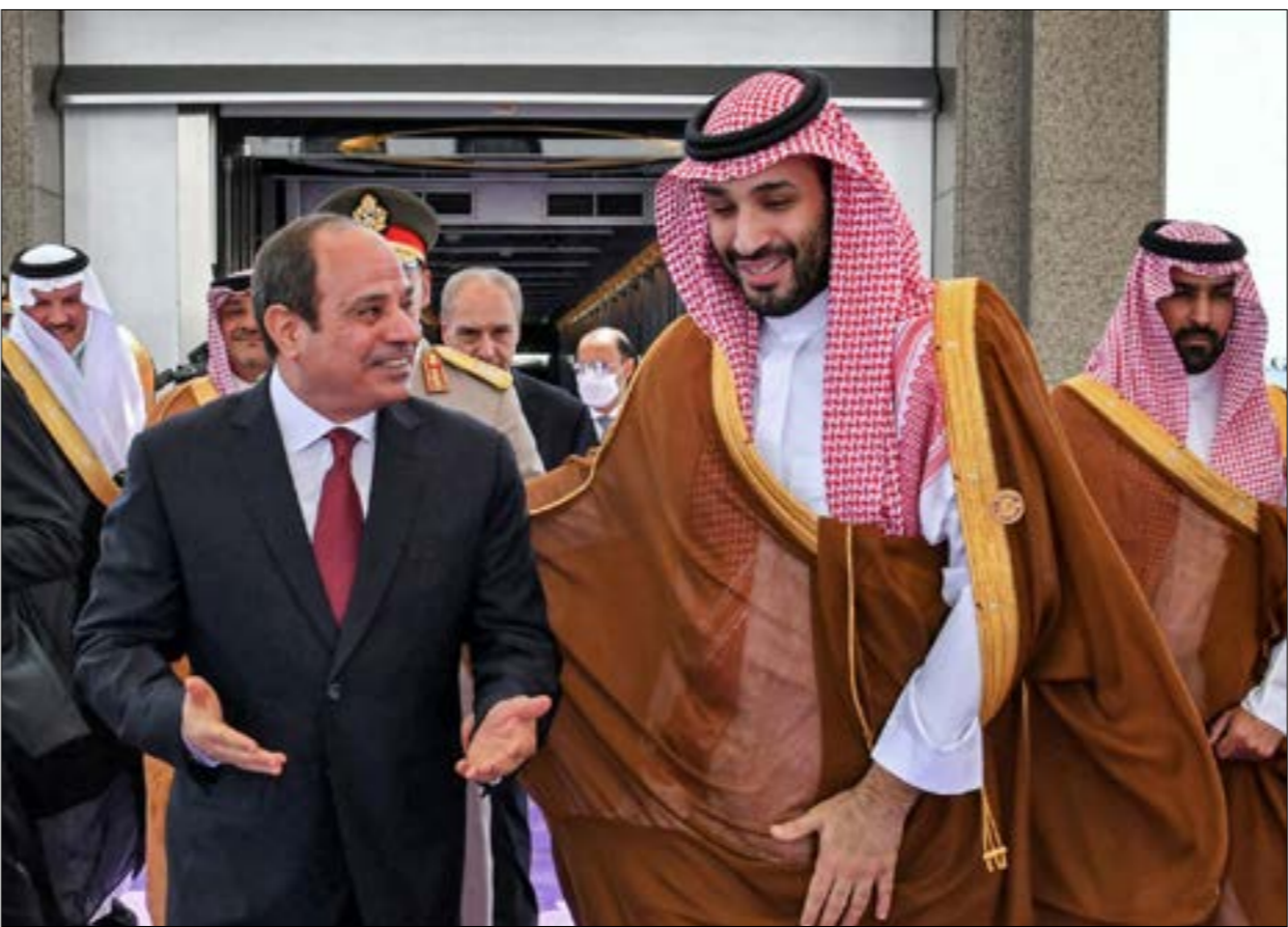
تعلّ صفقات استحواد دول خليجية على شركات حكومية مصرية