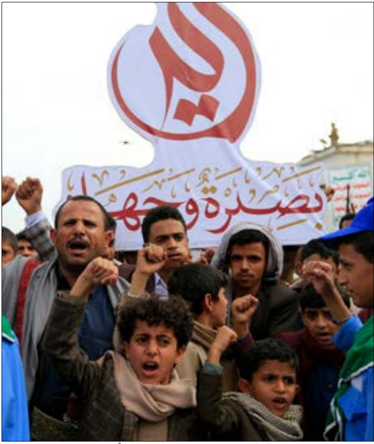
أشار الحولي إلى انه صنعاء تدرك كل المحطات التاريخية التي تحاك ضدّها