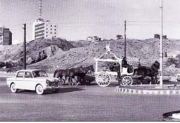
تلفزيون لبنان عام 1959