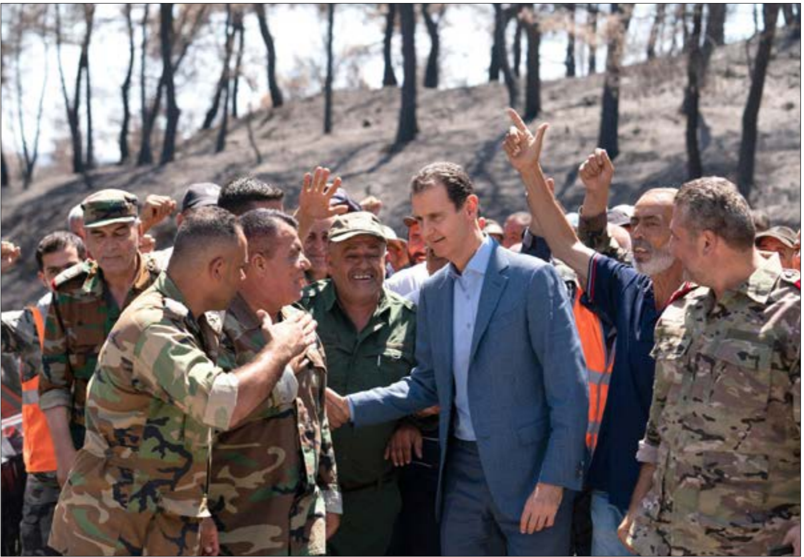
ظاوله الهجوم حافلة مبيت عسكرية في ريف دير الزور، وادى الى مقتل وإصابة عشرات الجنود

الاستطلاعي والحربي، فضلاً عن إقدام موسكو على توجيه ضربات صاروخية من البحر، في رسالة مفادها بأن بعث الحياة بالتنظيم الإرهابي من جديد أمر غير مقبول. ووفق وسائل إعلام روسية، فإن البوارج الحربية الروسية المتمركزة قبالة السواحل السورية، أطلقت مجموعة من الصواريخ الدقيقة في اتجاه مواقع تابع لمسلحي داعش