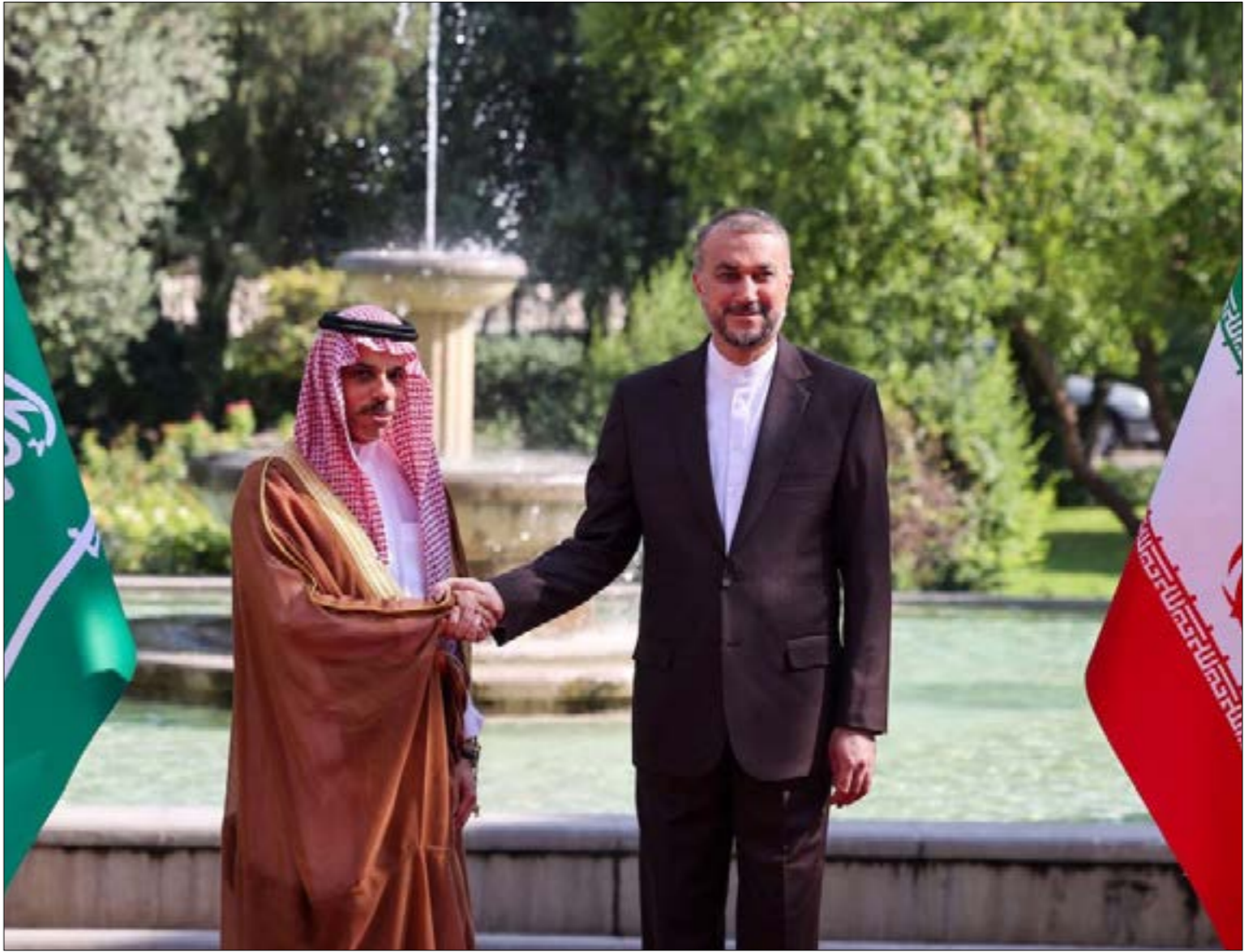
لم يرغم الطرفان سقف الامك بنات الملفات الإقليمية العالقة (مف الوهبي)