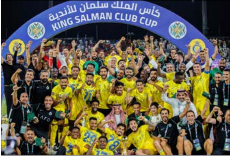
ساعده رونالدو ناديه النصر للفوز بلقب البطولة العربية

الماضي، من دون إغفال كوكبة من النجوم التي تزيّن الدوربين الألماني والفرنسي في سن متقدمة... الكثير من الأسباب جعلت هؤلاء اللاعبين قادرين على الاستمرار في أعلى مستوى، أبرزها الاستفادة من تقدم العلوم مع اعتماد أنماط حياة ملائمة. تحسنت العمليات الجراحية في العصر الحديث وبرز العلاج الطبيعي لتصبح بعض الإصابات قابلة للعلاج بعد أن كانت في السابق تنهي مسيرة الرياضيين. وعلى الصعيد الشخصي، زاد اهتمام اللاعبين بالحفاظ على لياقة مرتفعة أملاً بتحصيل أجور عالية جداً لأطول فترة ممكنة. من هنا المنطق كثرت مراكز العناية الشخصية وبرز خبراء التغذية واللياقة