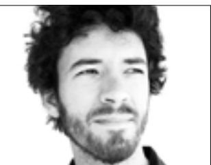
زينة رزق: «دروس خرايط»

بدءاً من 18 نيسان (أبريل) الحالي، تعرض منصة «أفلامنا» وثائقي «دروس خرايط» (2020 - 61 د) لفيليب رزق (الصورة). وعبره، يأخذ المخرج المصري الجمهور في رحلة عبر الزمان والمكان إلى الشرق الأوسط أثناء استعمارهم. يضع هذا الشريط المثالي الصراعات ضمن أحداثها، من بدايات المجالس العمّالية (الاتحاد السوفياتي)، مروراً بإسبانيا عام 1936 والمقاومة الفياتنامية، والثورة الفرنسية الرابعة، وصولاً إلى سوريا عام 2011. وكل هذا بهدف «تحضيرنا للمرة المقبلة والزمن المقبل»، وفقاً للنص التعريفي الخاص به.