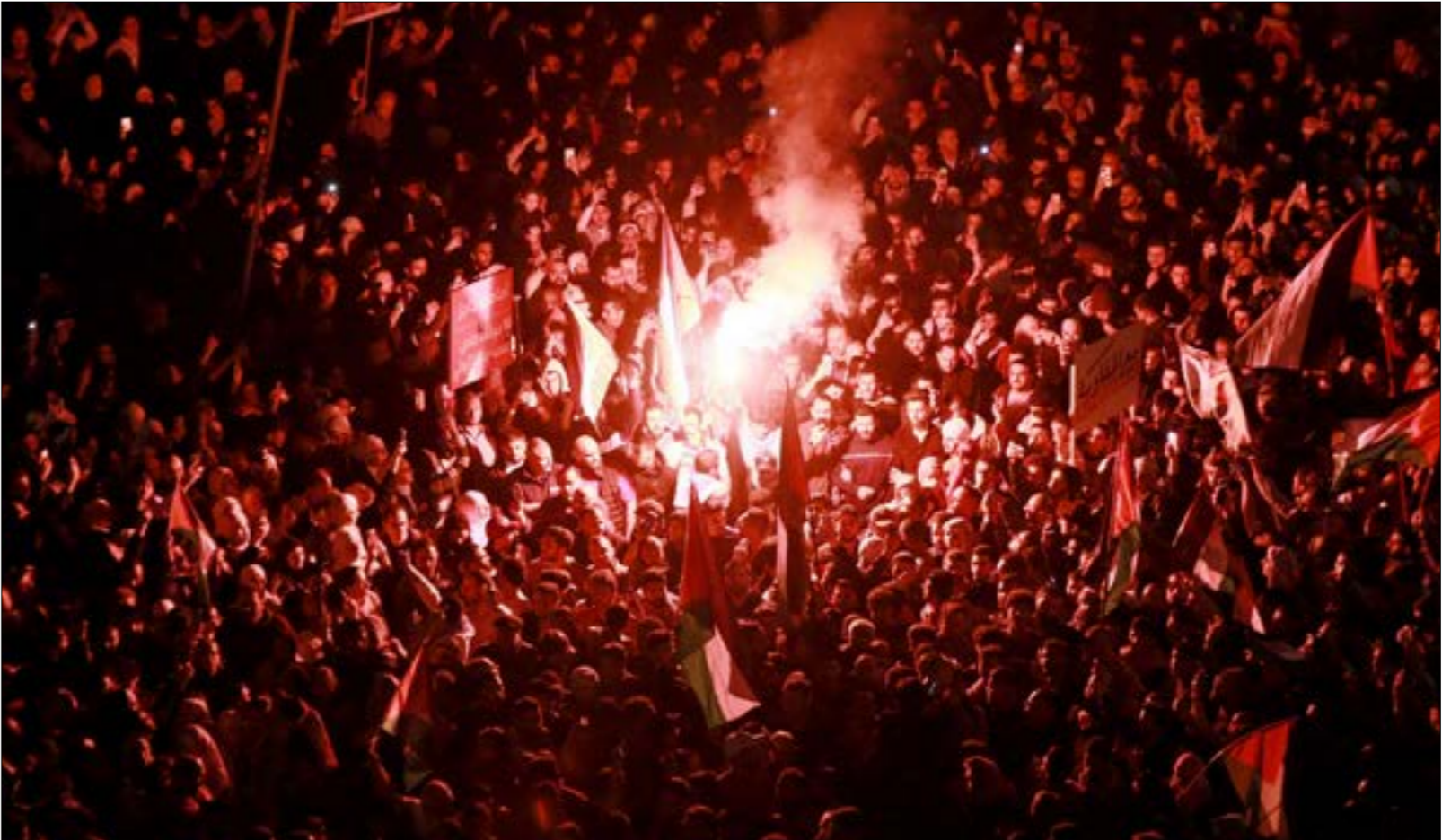
لا ترى سلطة رام الله في التظاهرات الأردنية سوى «الفوضى والتخريب»

مستقراً»، وأن «الأمن والاستقرار في الأردن هما مصلحة فلسطينيّة عليا». وإذ دخلت السلطة الفلسطينية في مختبر الإصلاح الأميركي، المشتعب مناهم الثلاثاء، بالملك الأردني عبد الله الثاني، ليؤكد له وقوفه والقيادة والشعب الفلسطيني، إلى جانب الضفة، ويقضه التأيّد لكلّ «محاولات العبث بامن الأردن واستقراره أو محاولة استغلال معاناة شعبنا الفلسطيني في قطاع غزة للعبث بالساحة الأردنية، وفرض أيّ تدخلات خارجية في الشأن الأردني الداخلي»، مشدداً على ثقته بأن «الأردن، تحت قيادة الملك عبد الله الثاني، سيتجاوز كل الظروف وسيبقى بلداً أمنأ