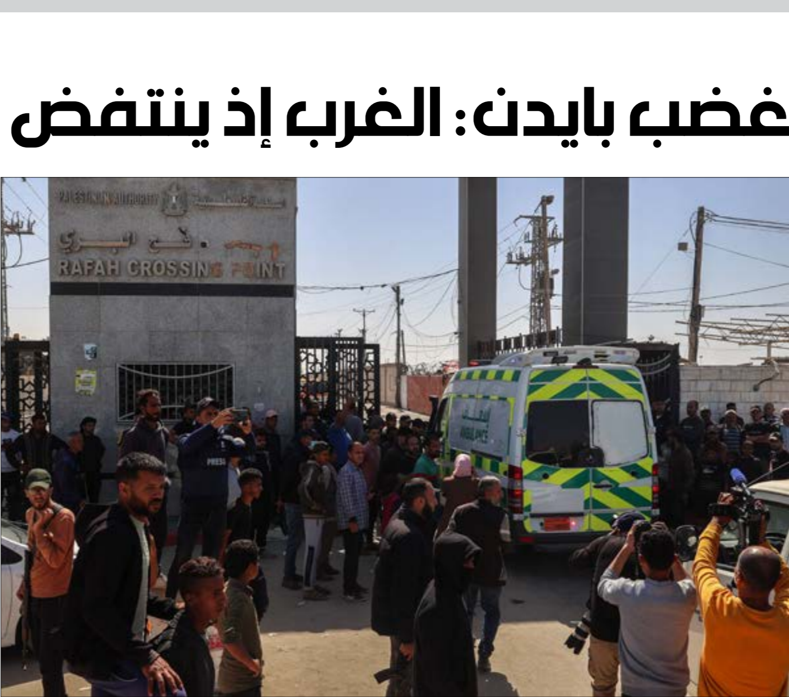
مجزرة المطبخ المركزي العالمي، نصفها هازم (ب) نتنياهو

وتلقت الصحيفة إلى الآلية التي تتبّعها الولايات المتحدة لفرض شروط على صدارتها من السلاح، والتي عادة ما تكون مقبولة من حلفائها الخارجيين، (كـاوكرانيا، على سبيل المثال، المزمرة بمعازة تلك الشروط)، ومستدركة بأن «إسرائيل كانت على الدوام مستعانة من الالتزام بشروط عدم استخدامها للمخاطر والأسلحة الأميركية الصنع». وتتستعرض الانقسامات الحاصلة داخل الحزب الديموقراطي في شأن الموقف من هذه القضية؛ ذلك أن شخصيات على غرار زعيم الأغلبية الديموقراطية في مجلس الشيوخ، السيناتور تشاك شومر، الذي، وعلى رغم إيمانه في التحريض على حكومة نتنياهو قبل أسابيع قليلة، تجنّب الدعوة