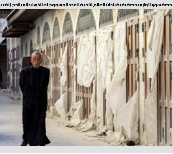
حصّة سوريا توارى حصّة بقية بلدان العالم لأجحة العدد المسموح له للذهاب إلى الحج

وفيما رُحّبت الرسالة بما سمّته «الدعوات المتزايدة من قبل قطاع «كارتي»، لافتين إلى أنه بعدما وجدت «محكمة العدل الدولية» أن هناك خطراً بارتكاب الجيش الإسرائيلي جرائم إبادة جماعية في القطاع، فإن المملكة المتحدة ملزمة قانوناً بالعمل على منعها بما يشمل وقف تصدير