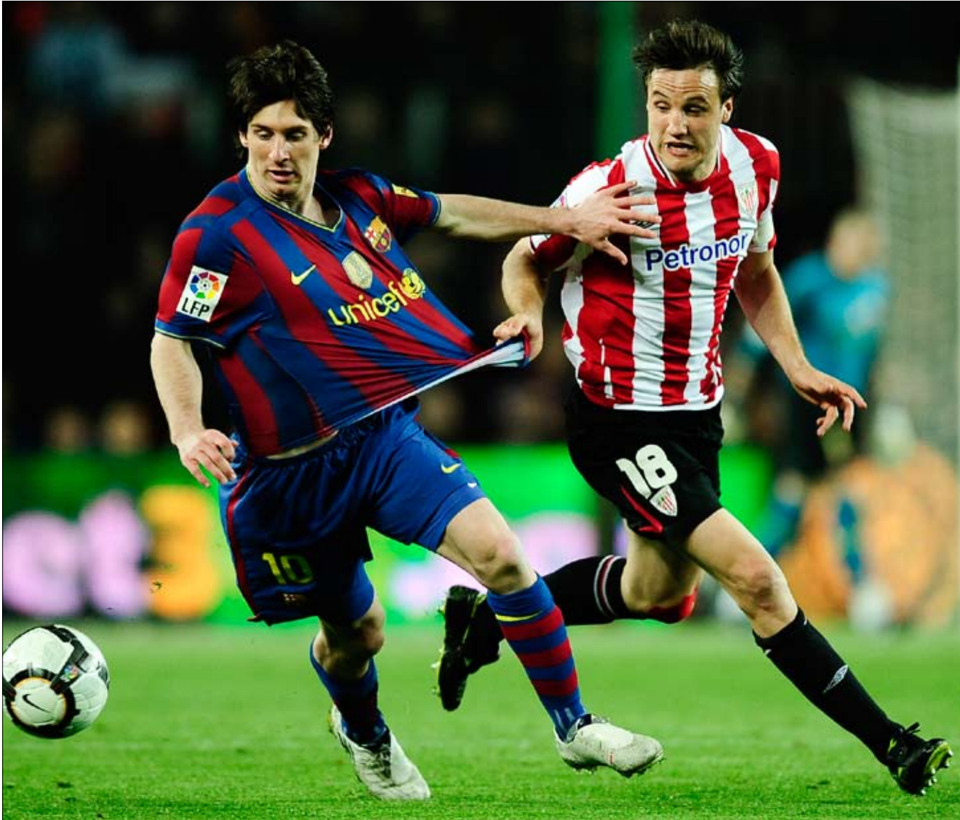
ارتكاب الأخطاء هو الطريقة الوحيدة لوقف انطلاقات ليونيل ميسي

بات السؤال المشترك بين منافسي برشلونة الإسباني ومنتخب الأرجنتين لكرة القدم هو: كيف يمكن إيقاف النجم ليونيل ميسي، وذلك بفعل الأداء الخارق الذي قدمه أفضل لاعب في العالم، في كل المباريات التي خاضها هذا الموسم