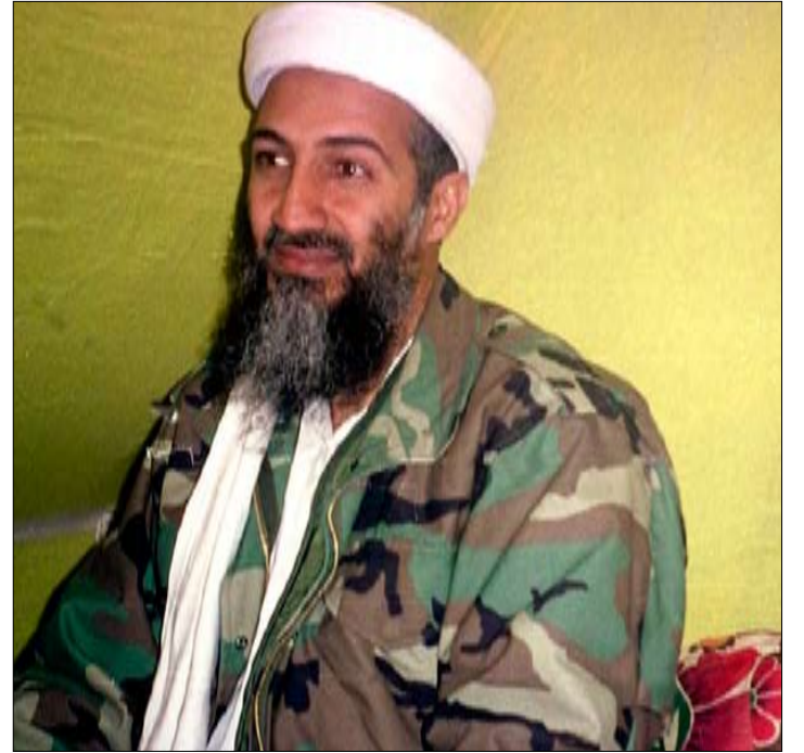
صورة لبن لادن تعود إلى العام 1998