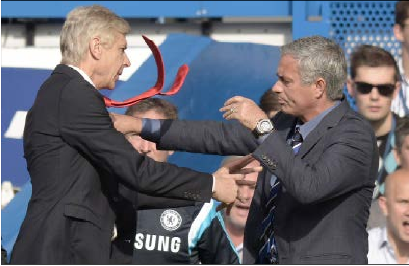
تجدد الممارك الكلامية التي تصل إلى الاحتكاكات الجسدية بين مديري الدوري الإنكليزي

يفتح كلام فابيو كابيلو حول خروج الأمور عن السيطرة في المعركة الكلامية المشتعلة بين أنطونيو كونتي وجوزيه مورينيو، الباب على أسباب جنون مديري الدوري الإنكليزي نحو هذه الصراعات التي لا يمكن أن تجدها بهذا الشكل في أي بطولة وطنية أخرى في أوروبا