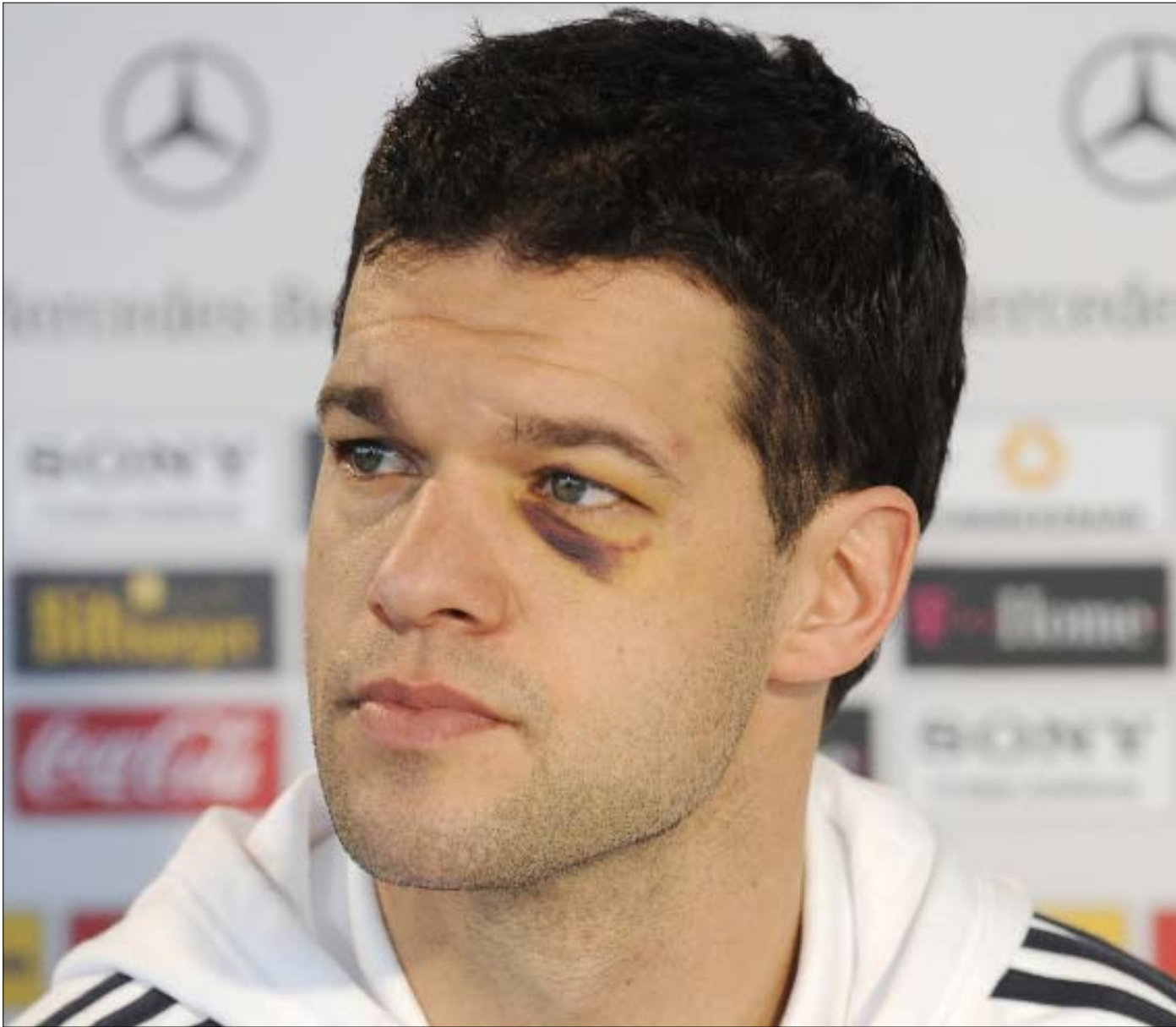
قائد منتخب ألمانيا ميكائيل بالاك خلال مؤتمر صحفي قبل المواجهة مع الأرجنتين

ألمانيا - إيرلندا الشمالية 21,45 الجزائر - صربيا 20,15 أنغولا - لاتفيا 22,00 أرمينيا - بيلاروسيا 17,00 النمسا - الدنمارك 21,30 بلجيكا - كرواتيا 21,45