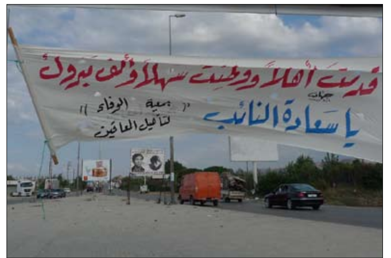
تهاني بالعودة من شهر العسل في دير عمار (الخبار)

بالمباركة، فما دخل مفوضية كشف المنية، وجمعية الفكر والحياة، وجمعية التوعية والعمل الخيري، وتيار المستقبل أيضاً، حتى تتفتق إبداعاتهم عن لافتات تتنافس في توصيف المأثرة، واحدة تبارك وأخرى تدعو بالرفاه والبنين وثالثة تهنيئ بالعودة من السفر؟ هكذا، يبدو أن مناطق عكار والمنية - الضنية الياثسة من مؤسسات الدولة، ما عاد لها من باب للرزق إلا أبواب «أولي الأمر»، وياتت الجمعيات الأهلية غير مفهومة الأهداف، والنوادي «غير الرياضية» تبت مثل الفطر على موائد أهل الخير. وربما كان وجودها حول تلك الموائد، وعدم تحركها لرفع لافتات تندد بالاستهتار بالسلامة العامة، التي قتلت الضحايا الثلاثة، تلخيصاً للأهداف الحقيقية من خلف إنشائها.