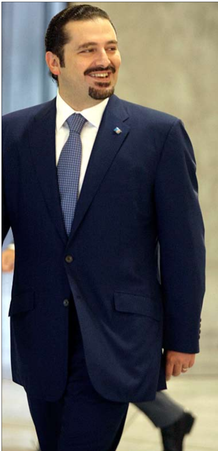
قد يخرج الحريري من الجلسة عند التصويت على ملف شهود الزور

عقد رضائي مع شركة تركية لاستئجار بواخر لتوليد الطاقة الكهربائية. وقد بوشر البحث في الاقتراح، إلا أن رئيس الحكومة سرعان ما قال إن الوزراء قد تعبوا من طول الوقت المخصص للجلسة، مقترحاً تأجيل البحث في ملف البواخر إلى جلسة لاحقة، وهو ما حصل، ثم رُفعت الجلسة. وقبل ختام الجلسة، كان أحد الوزراء قد طلب التعاقد في وزارته مع شخص لبناني، فكانت مناسبة لإشادة من رئيس الحكومة سعد الحريري ووزيرة المال ريا الحسن بدور مكاتب برنامج الأمم المتحدة الإنمائي في الوزارات اللبنانية، فلفت في هذا السياق هجوم