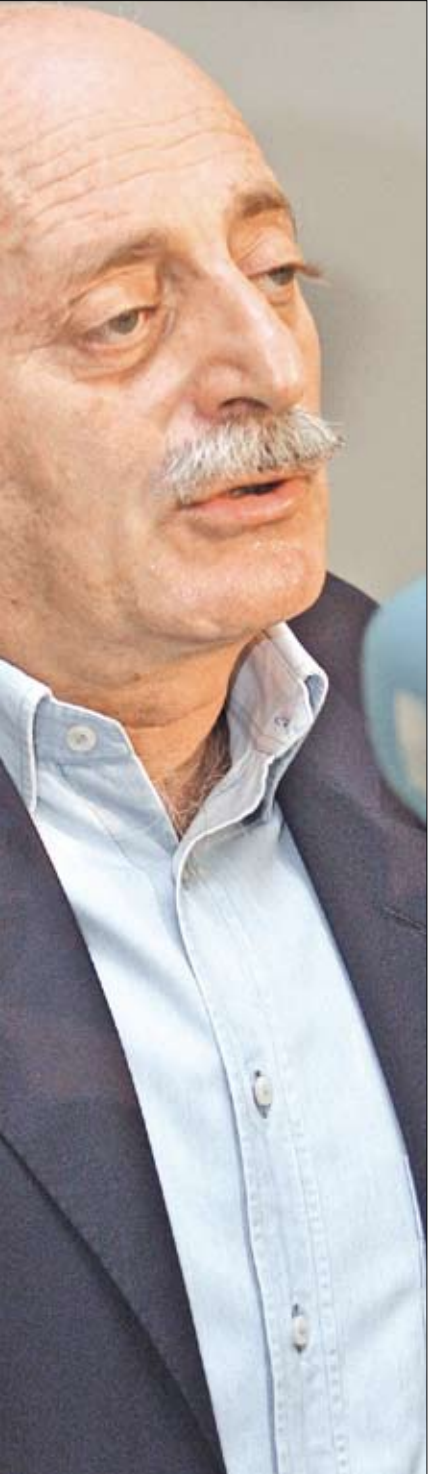
لم يلمس جنبلاط احتمال زيارة قريبة للحريزي لدمشق

والاستقرار في أيدنا نحن، والموقف منهما شأن لبثاني ويُقرّر في لبنان. العدالة من أجل الرئيس رفيق الحريري في كشف القتل والمجرمين، وليست في إهدار الدماء. من أجل رفيق الحريري وإنصافه يقتضي تجنب الدم.