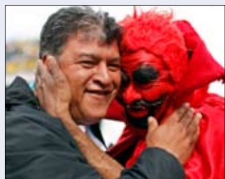
مشجع يرحب بمدرب بوكا