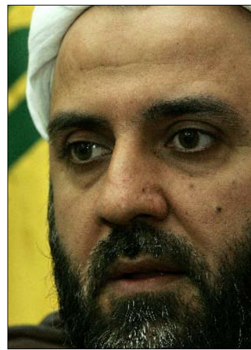
الشيخ نبيل قاووق

إلا أن القاعدة الشعبية لا تنعم بالهدوء الذي يتظاهر به بعض المسؤولين. واللافت أن المؤيدين للأقراء سريعاً ما يستدرجون الصغيرة والفردية لرجها في أزمة القرار الاتهامي، فتصبح كرة تلج تهدد الجنوب. فبينما يتهم فريق بأنه متواطئ مع القرار الاتهامي عليه، يحزم الفريق الآخر رزمة من الاعتراضات ليضعها على الطاولة. ومنها الحوادث التي وقعت بين عدد من عناصر حزب الله وشبان من بلدي مروحين ويارين الحدوديتين خلال الأشهر الماضية على خلفية رفض