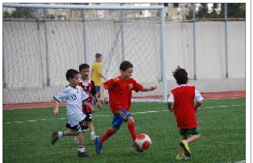
لقطة من مباراة في الأكاديمية والمهارة واضحة