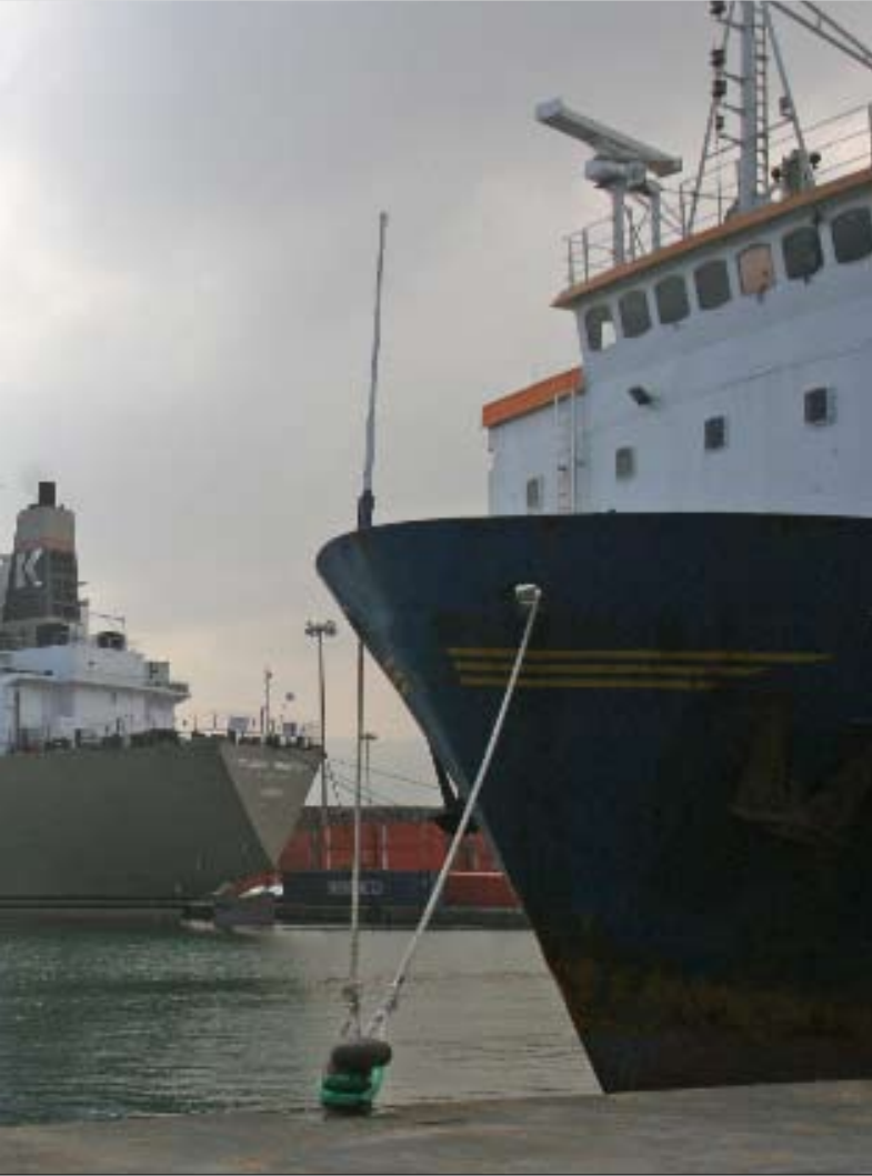
سفينة كهرباء تركية في مرفأ بيروت

باسيل: الشركة التركية ستسلم أول باخرة خلال ثلاثة أشهر