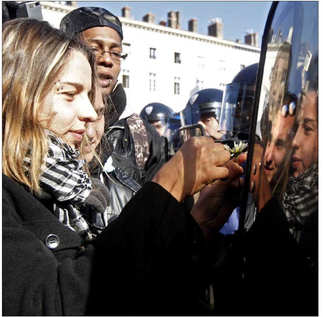
من تظاهرات باريس قبل أيام