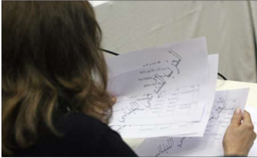
من اللقاء اليساري العربي الذي عُقد الأسبوع الفائت في بيروت (بلال جايويش)

كما أنه ليس ذلك الذي لا تكون قضية التحرر الكامل للشعب الفلسطيني، وعودته الكريمة وغير المشروطة إلى وطنه الأصلي، في مقدمة اهتماماته، وتغلبه الشاغل اليومي. على أن يكون ذلك من ضمن سيرورة تخرج تماماً من أوهام حل الدولتين، ويتم النضال في إطارها من أجل تفكيك الدولة الصهيونية وإحلال