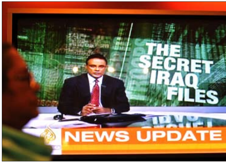
«الجزيرة الإنكليزية» تعرض وثائق «ويكيليكس»