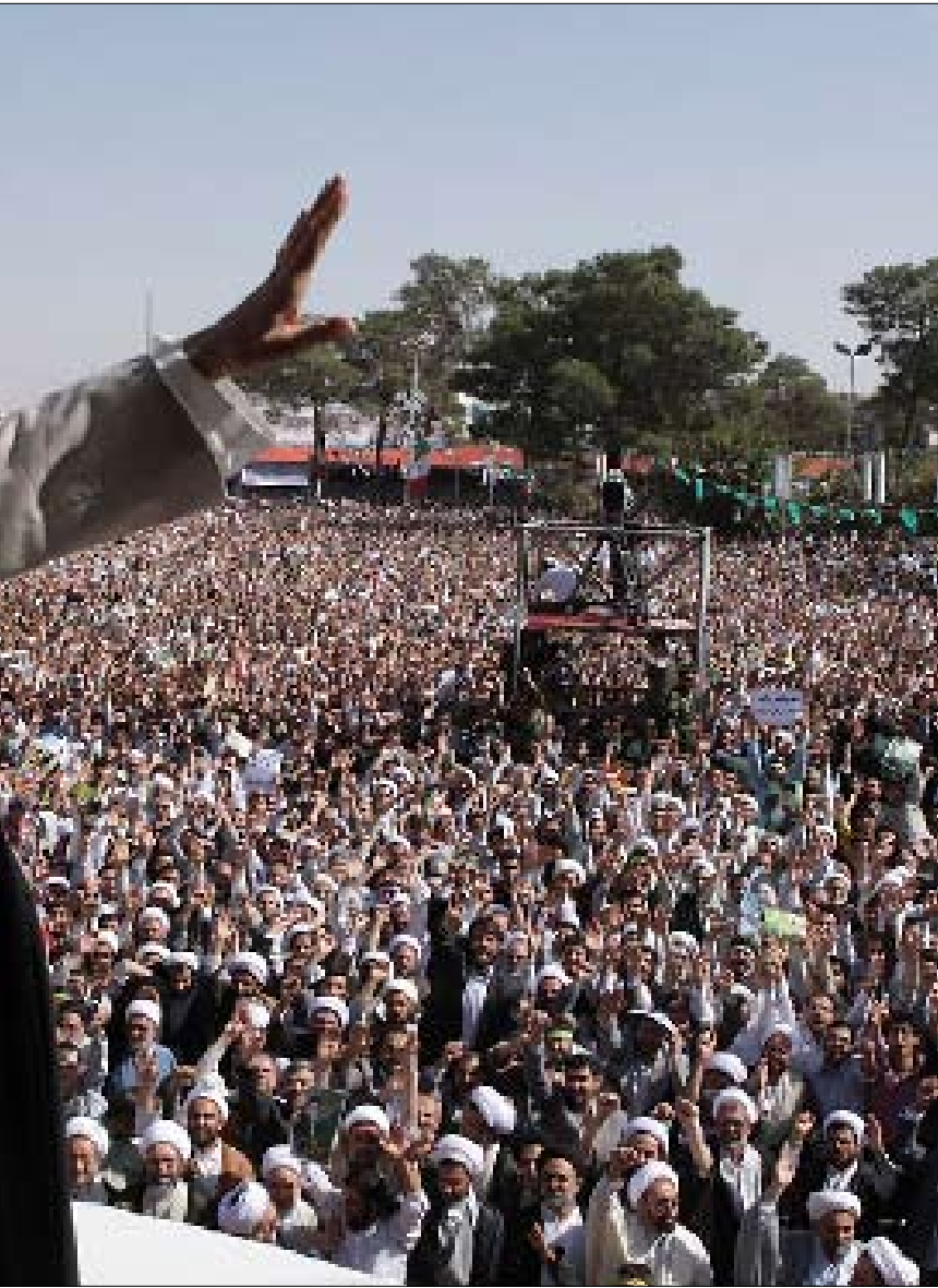
خامنئي في قم (أ ب)

وتتابع المصادر «هذا من ناحية. لكن هناك فارقاً آخر، وهو أن خامنئي ذهب إلى قم زعيماً وقائداً مكرساً لها في الشقين الحوزوي الديني والسياسي. دخل خامنئي قم وفي رصيده لائحة طويلة من النجاحات في الداخل والخارج، من النووي إلى فلسطين ولبنان والعراق وغيرها، ومعها لائحة أخرى من المواقف النهضوية،