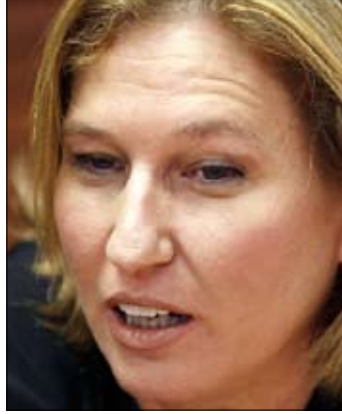
ليفني: تركيا سعت إلى منح الشرعية لحركة «حماس»

وفي السياق، قالت رئيسة «كديما» تسيبي ليفني، في شهادتها أمام لجنة تيركل، إنه في غياب «عملية السلام» وعدم وضوح سياسة إسرائيل في الشأن الفلسطيني، نشأ فراغ سياسي دخلت إليه تركيا، ورات فيه فرصة خلق استفزاز، ومنح شرعية لحركة «حماس». واتهمت ليفني رئيس الحكومة بنيامين نتنياهو، من دون أن تسميه، بالقصور، وحملته النتائج التي وصفها بـ«الدمرة»، مشيرة إلى أن تركيا سعت إلى منح الشرعية لحركة «حماس». وقالت إن هدفها لم يكن إدخال البضائع إلى قطاع غزة، بل كان الهدف عملية سياسية تتناقض مع القرارات الدولية، على حد تعبيرها.