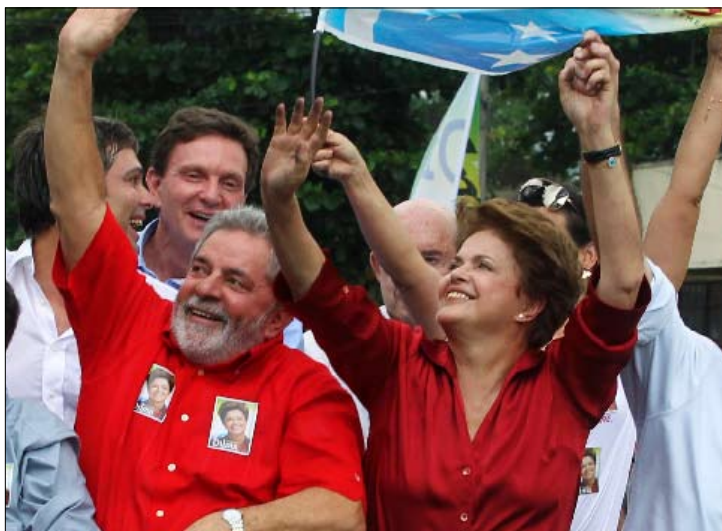
روسيف وعرابها السياسي لولا في ريو دي جانيرو

بقليل، كان ربما بمتناول سيرا أن يطلق دينامية جديدة لو التحقت به فوراً مرشحة «الخضر» مارينا سيلفا، التي مثلت مفاجأة الدورة الأولى الحقيقية، ونالت 20 مليون صوت. غير أن تربت هذه الأخيرة أسبوعين قبل اختيارها موقع الحياض، ساهم في تبريد احتمالات الانقلاب الانتخابي. وصار همة سيرا خلق «حدث» قادر على قلب الطاولة، فحاول الأسبوع