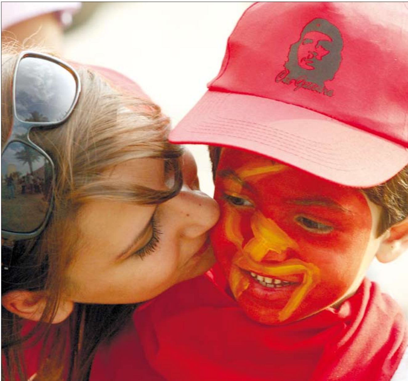
الاشتراكية باقية ما بقي استغلال وحرمان وفوارق بين الطبقات