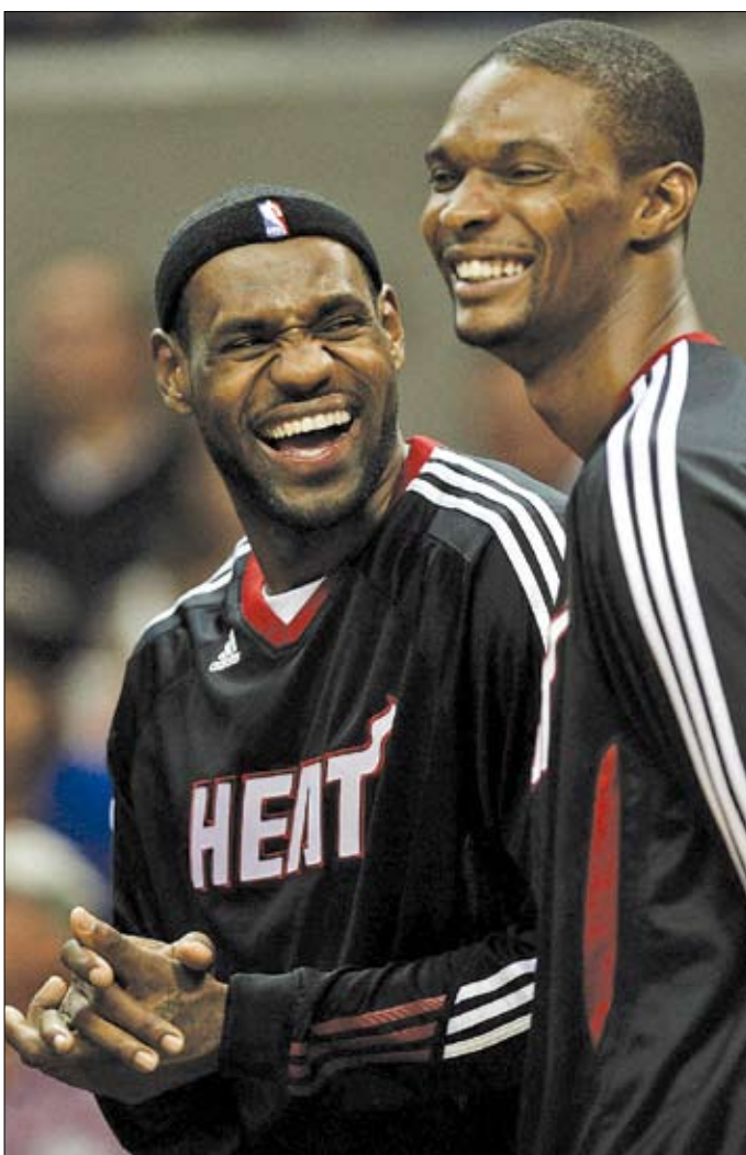
الثلاثي الجديد في ميامي هيت كريس بوش وليبرون جيمس

وفي المنطقة الشرقية حيث يتوقع أن يحسم ميامي غالبية مواجهاته من دون مشكلات جمة، يبرز أورلاندو ماجيك وبوسطن سلتيكس، إذ