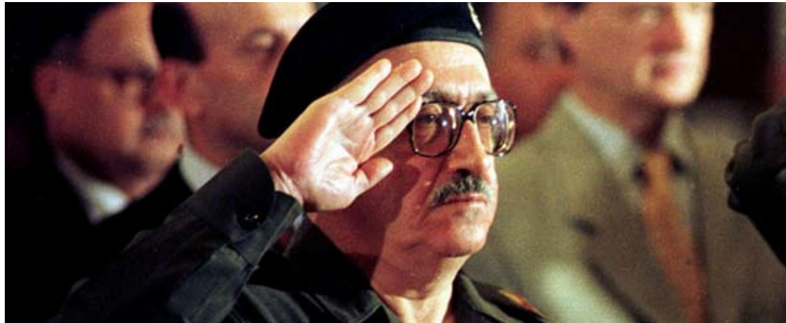
جلال الطالباني «لن يوقع أبداً» قرار اعدام طارق عزيز

وفي مقابلة تلفزيونية أخرى، طمان الطالباني الحرساء على مصير القيادي الأسبق في نظام صدام حسين طارق عزيز، إلى أنه «لن يوقع أبداً» قرار اعدامه، مبرراً قراره هذا بالقول: «لن أوقع أمر إعدام عزيز لأنني اشتراكي». وتابع: «أنا متعاطف مع طارق عزيز لأنه مسيحي عراقي. وعلاوة على ذلك، فهو رجل تجاوز عمره السبعين». تجدر الإشارة إلى أن موافقة الرئيس العراقي لضرورة لتنفيذ حكم الإعدام.