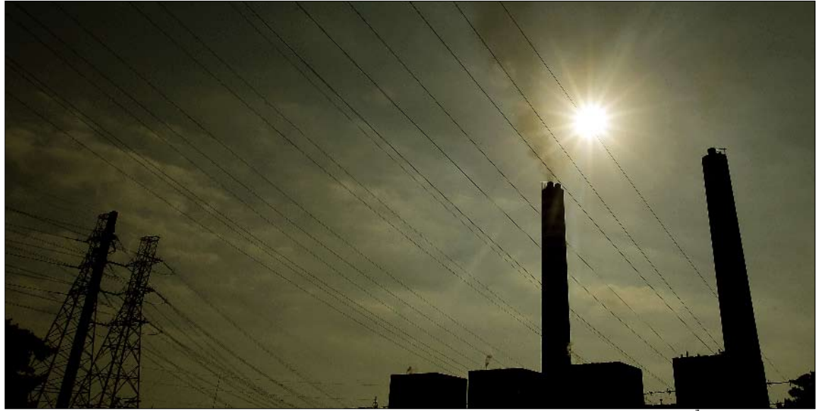
استعمال الإنارة الموفرة لا يمكنه أن يخفض القدرة القصوى