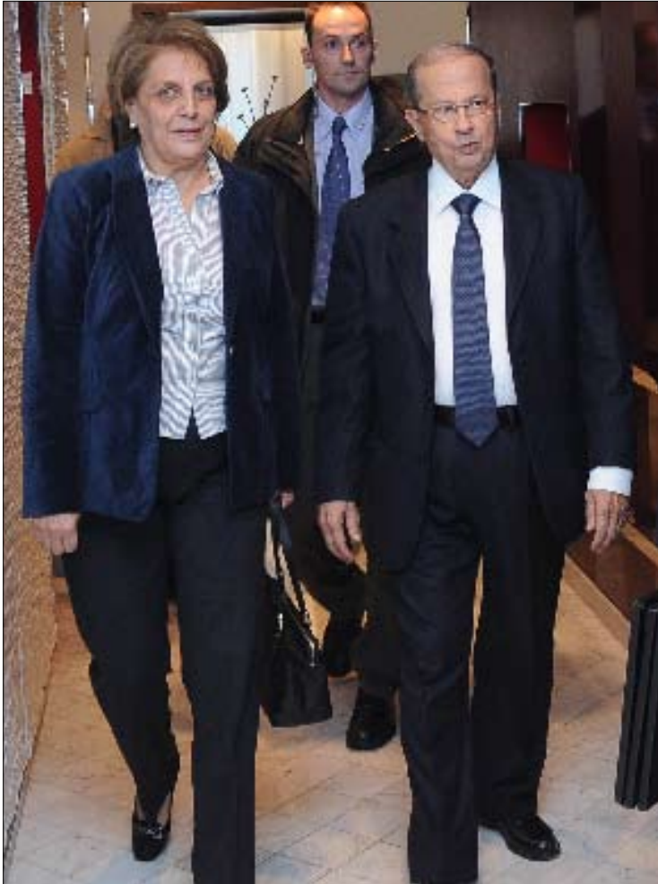
نحن هنا نحاول إجلاء القضية، أملين أن تحصل إعادة نظر بالموقف الدولي»

حيث يجب، أملين أن تحصل إعادة نظر بالموقف الدولي لتصحيح المسار القضائي وإعادة الأمور إلى نصابها». وختم الجنرال بالإشارة إلى أن الاجتراء في التحقيق يشوش الأدلة، وبالنسبة إلى كثيرين، هناك حق مشروع في الدفاع