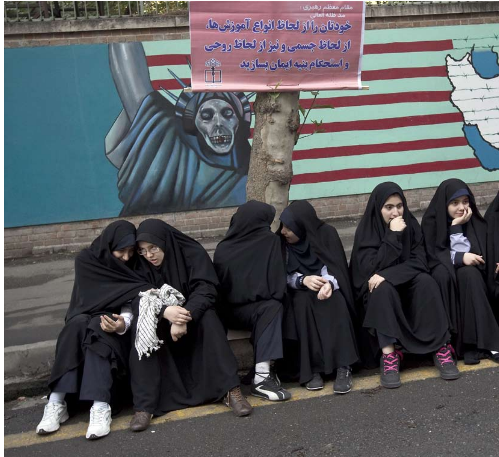
طالبات إيرانيات يشاركن في الذكرى الحادية والثلاثين لاحتلال السفارة الأميركية في طهران

بما أنّها الدولة الوحيدة في مجلس الأمن التي لا تتمتع بقناة تواصل مباشر مع إيران، فإنّ الولايات المتحدة تواجه عائقاً هاماً. يعترف مسؤولو إدارة أوباما ببروز عدد من الفرص في الخريف الماضي في مناسبات عدة لحل قضية