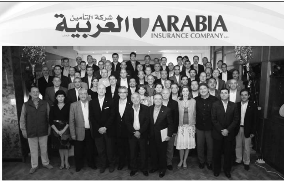
بعض أعضاء مجلس إدارة ومدراء مجموعة شركة التأمين العربية

2 - لأن التدخّل الأميركي يقف حجر عثرة في طريق جهود الملك السعودي، لا يرى الرئيس السوري بدأ من الانتظار وتجميد الأزمة الناشبة بين اللبنانيين حول القرار الاتهامي والمحكمة الدولية،