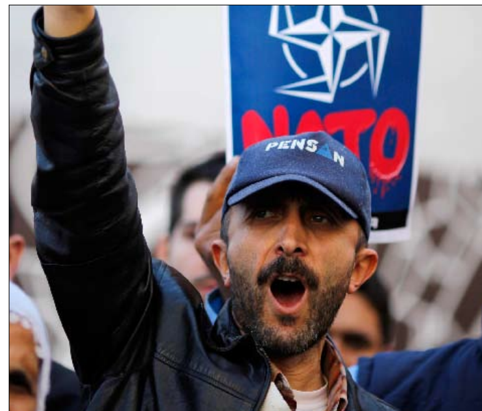
متظاهر تركي ضد مشاركة بلاده في «الدرع الصاروخية»

وسبق لوزير الخارجية أحمد داوود أوغلو أن هيا الأجرأة للتوصل إلى اتفاق في لشبونة، عندما أكد أن تركيا لا تعد قرارها بمثابة اختيار بين إيران والولايات المتحدة، من دون أن ينسى التلويح بأنه، في النهاية، تركيا