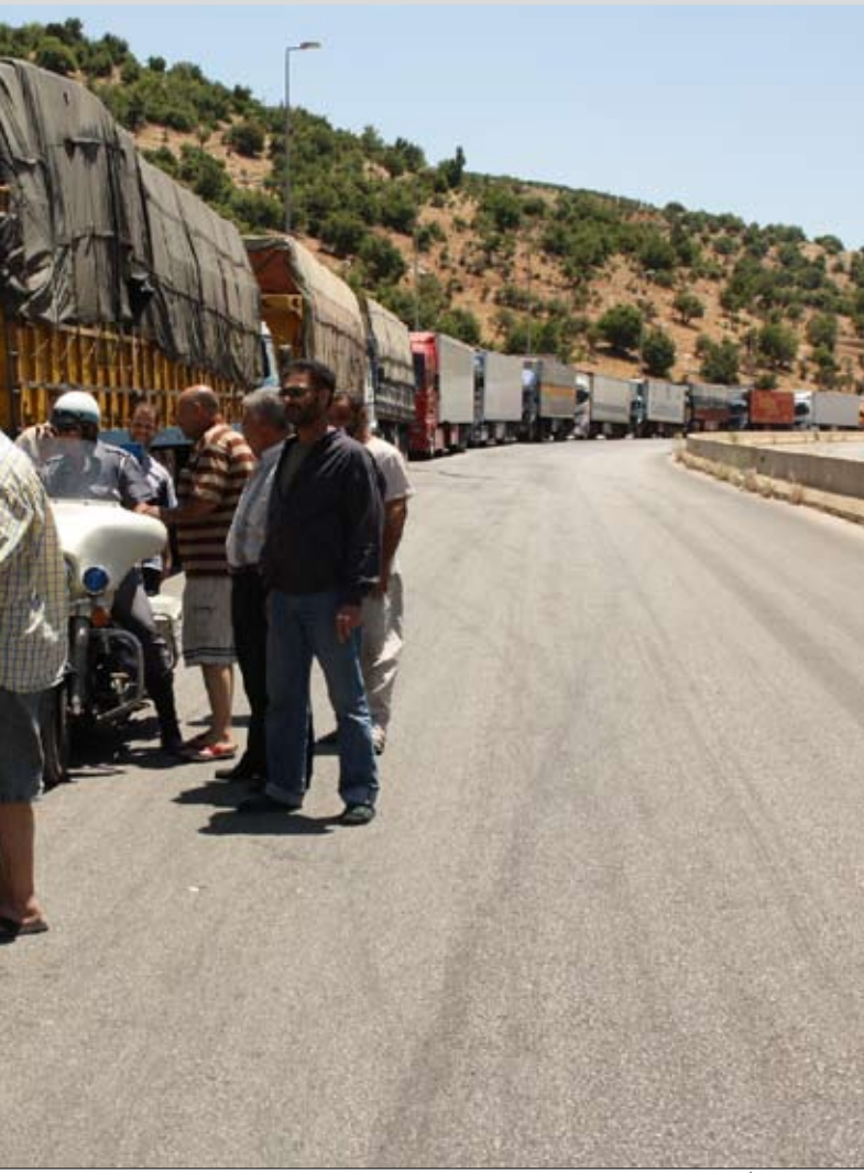
منذ 20 يوماً تسجل عمليات سلب سيارات على طريق شتورة - حمص (أرشيف)

تراجم النشاطات ينعكس سلباً على اقتصاد المناطق الحدودية