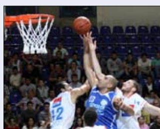
محاولة لسماحة للتسجيل (بروفوتو)