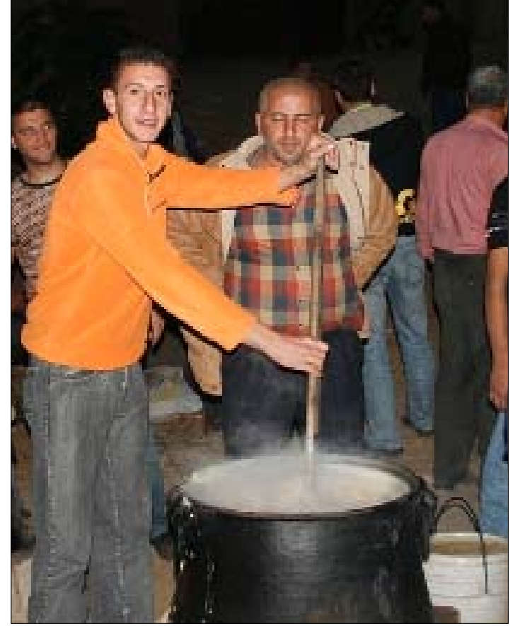
جري شراء 12 دستاً معدنياً من الحجم الكبير استعداداً لطبخ «الهريسة» (الأخبار)

إذا كان لكل عيد طقوسه الدينية والاجتماعية عند أتباع كل دين أو مذهب، فإن أكلة «الهريسة» أصبحت جامعة بين هؤلاء في لبنان وخصوصاً في الأرياف، كما في بلدة بيت الفقس في الضنية مثلاً