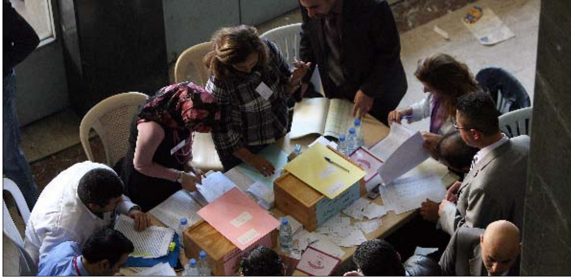
من انتخابات نقابة المحامين العام الماضي (أرشيف - مروان طحطج)

تنتخب نقابة المحامين في بيروت بعد غد الأحد أربعة أعضاء جدد في مجلسها، في ظل خلاف داخل قوى المعارضة السابقة على هوية المرشح الشيعي بين حركة أمل وحزب الله. أما قوى 14 آذار، فلم يقلل بعض أطرافها الباب أمام مرشح حركة أمل، فيما بدأت معركتها منذ الآن على موقع النقيب في العام المقبل