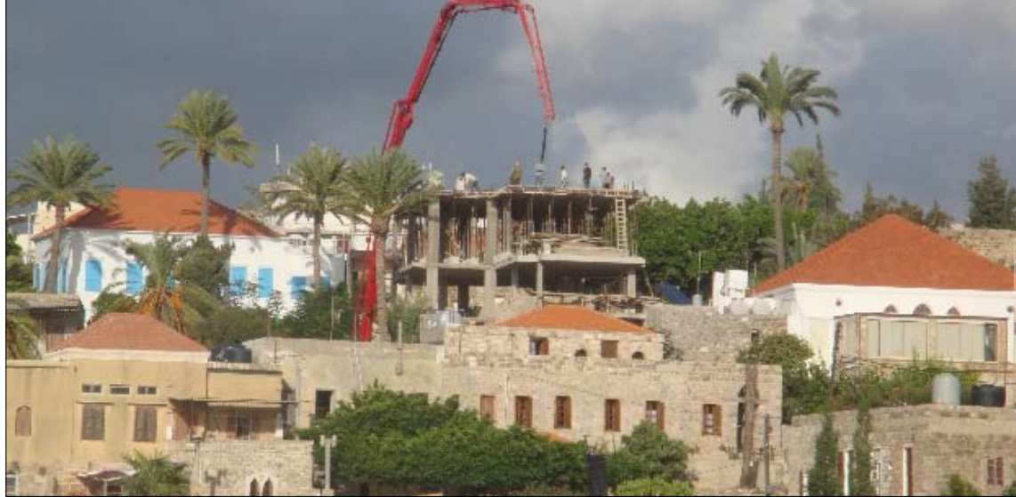
سيحدث ارتفاع المنزل إلى 10 أمتار صدمة ضمن محيطه في جبيل القديمة