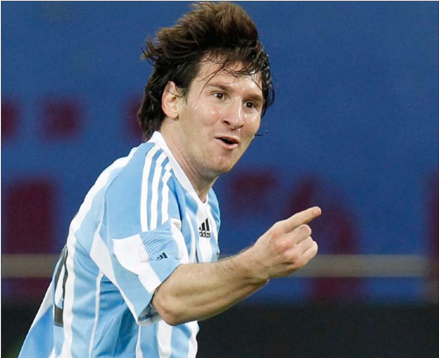
ميسي محتفلاً بهدفه في مرمى منتخب البرازيل

سجل ميسي هدف الفوز للأرجنتين في مرمى البرازيل ودياً، بالطبع فإن لهذا الهدف انعكاساته على ميسي التي ستظهر تجلياتها مستقبلاً وتمحو الانتقاد الذي كان يوجّه إليه لأدائه مع «التانغو» بعكس ما يقدمه في برشلونة