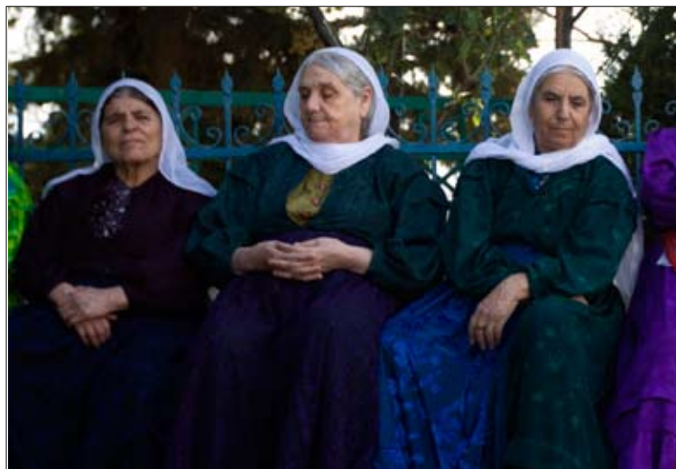
عبر أهالي الفجر عن انزعاجهم من تقسيم بلدتهم

في توقيت يثير غير تساؤل بشأن أبعاده واستهدافاته، وبعد أربع سنوات من صدور قرار مجلس الأمن الدولي 1701، قررت إسرائيل أن تقدم نفسها كمن ينفذ متطلبات القرار من خلال سحب قواتها من الشطر الشمالي من قرية الفجر بالاتفاق والتنسيق مع قوات اليونيفيل. وإذا كان واضحاً أن «الصحة الإسرائيلية المتأخرة»، لا يمكن فصلها عن حسابات تتناغم مع السياسة الأميركية في لبنان، فإن السؤال الذي يطرح نفسه هو عن ماهية هذه الحسابات في توقيت يتميز بأن العنوان الأبرز للصراع الدائر، بين قوى تتكى إلى تجربة المقاومة في تحرير الأرض والدفاع عن لبنان في مواجهة التهديدات والاعتداءات الإسرائيلية، وأخرى تراهن على عواصم القرار الدولي الداعمة لتل أبيب، يتمحور حول تمرير قرار «قضائي» دولي يتهم المقاومة باغتيال