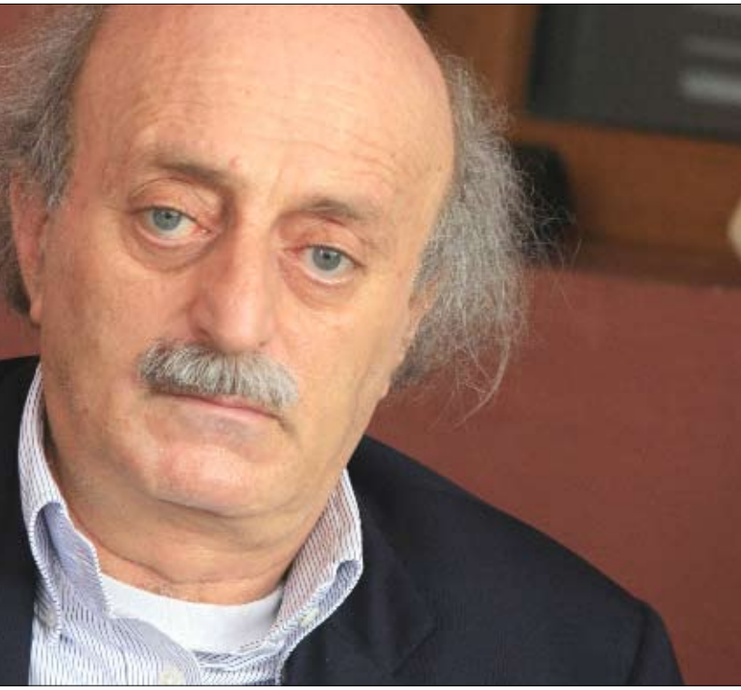
يقطع سيد المختارة الوقت بينما تنجز الرياض جهدها لمعالجة الأزمة

يكاد لا يمرّ يوم إلا يصدر موقف يعلّق الآمال على جهود السعودية وسوريا اللتين تملكان، في الغالب، سرّ الحلّ لتجنّب النزاع الداخلي الوصول إلى المواجهة. لكن التسليم اللبناني لا يلقى، في الظاهر على الأقل، حماسة مماثلة في دمشق والرياض، إذ تؤثّران الصمت