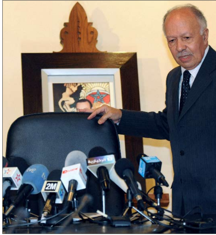
وزير الاتصال المغربي خالد الناصري خلال مؤتمر صحافي لفضح مغالطات الإعلام الإسباني

لعل أحداث مدينة العيون الصحراوية التي اندلعت مطلع الأسبوع الماضي بين قوات الأمن المغربية وناشطين صحراويين، هي القشة التي قصمت ظهر البعير بين المغرب والإعلام الإسباني. المواجهات التي أودت بحياة أكثر من عشرة أشخاص، جذبت وسائل الإعلام الإسبانية التي خصّصت لها مساحة واسعة من تغطيتها. لكن هذه التغطية لم تخل من المغالطات. مثلاً، استعملت قناة «أنيتينا 3» صوراً فوتوغرافية قالت إنها تعود إلى أحداث مدينة العيون. لكن سرعان ما اتضح أن هذه الصور نشرتها سابقاً يومية «الأحداث المغربية»، وتعود إلى جريمة تعرّضت لها أسرة مغربية في شهر كانون الثاني (يناير) الماضي في الدار البيضاء وأودت بحياة عدد من أفرادها. وقد قرّرت صحيفة «الأحداث المغربية» رفع دعوى على القناة أمام القضاء الإسباني، مطالبة بتعويض تبلغ قيمته... يورو واحداً. كذلك، أعلنت الأسرة التي تعرّض أفرادها للجريمة