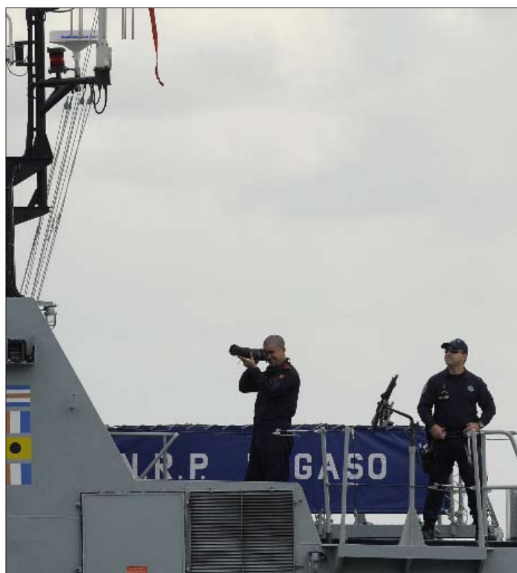
تعزيزات أمنية بحرية حول موقع اجتماع القمة

ويقول خبير في هذا الشأن إنه جرى «تفاسم المهمات بين واشنطن وأوروبا»، إذ تتحمل الولايات المتحدة مسؤولية نشر شبكة صواريخ عابرة للقارات، بعد أن تصل إلى توافق عليها مع موسكو، بينما تتكفل الدول الأوروبية بشبكة صواريخ متوسطة المدى يمكن «تبريرها بالدفاع عن النفس»، وهو ما يمكن أن تقبله روسيا. ويشير الخبير إلى أن «نشر هذه الشبكة في تركيا هو