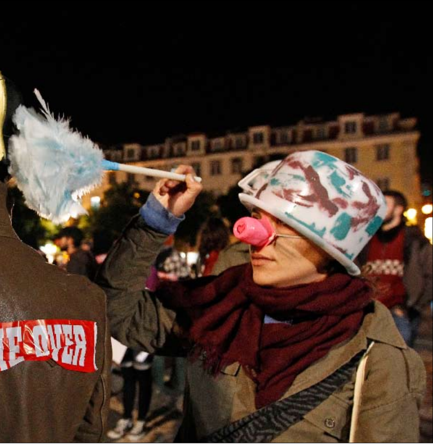
متظاهرون ضد القمة

العسكري، فهم لا يلتحقون بالجيش بل يعودون إلى منازلهم وقرانهم في مقابل مبالغ مالية. ولا يستبعد الخبير إمكان أن يعودوا للانضمام تحت لواء «طالبان» في أي وقت. إلا أن القائد السابق لكتيبة «لافايت» الفرنسية المشاركة في أفغانستان، الجنرال بيار شافانسي، ذكر لـ «الأخبار» أن القوات الدولية «تربح حرب المساجد» في إشارة إلى حصول «تغيير في خطاب أئمة المساجد»، وتجدد مسارات تجنيد أفراد في «طالبان»، إضافة إلى اتباع سياسة جديدة من جانب القوات الدولية تقضي بفرز «قطعة أرض ومد أقنية الري وتأمين مصدر رزق عبر شراء المحصول»، ما وثقت «الفلاحين الأفغان في أرضهم»، عوضاً عن الالتحاق بـ «طالبان». رغم هذا، فإن الإعلان «شبه اليومي» عن ضحايا في القوات الدولية يدل على أن الأمور لا تزال بعيدة جداً عن الصورة المثالية التي يمكن أن يضعها الجنرالات أمام القادة اليوم في لشبونة. كما أن جميع المراقبين يتفقون على أن الوضع الأفغاني له امتدادات شرقاً نحو باكستان، وبالتالي يمس التوازن مع