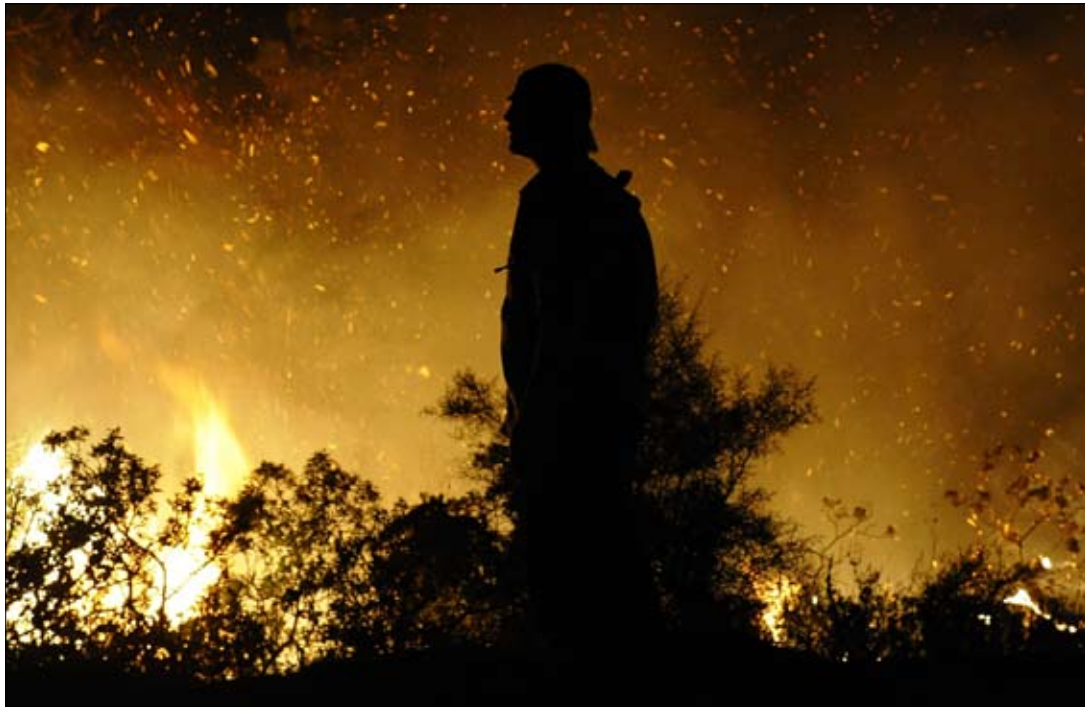
السنة اللهب في أحراج جبل الكرمل أمس

الإطفاء بالحرك بسهولة. وأعلنت «سلطة الطبيعة والحدائق» حال الطوارئ واستدعت طواقمها للمساعدة على إخماد الحريق الذي اتسع نطاقه وسبب أضراراً كبيرة. وفيما لم تعرف الأسباب الحقيقية لنشوب الحريق، تحدثت بعض التقديرات عن عوامل طبيعية تقف وراء الحريق في أحراج الكرمل، فيما أفادت مصادر الشرطة الإسرائيلية بأن أسباب الحريق قد تعود إلى مكان تجمع