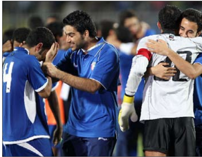
لاعبو الكويت يحتفلون بالتأهل الى النهائي

ولم ينتظر المنتخب العراقي طويلاً لاعادة الامور الى نصابها، فجاء هدف التعادل بعد خمس دقائق حين