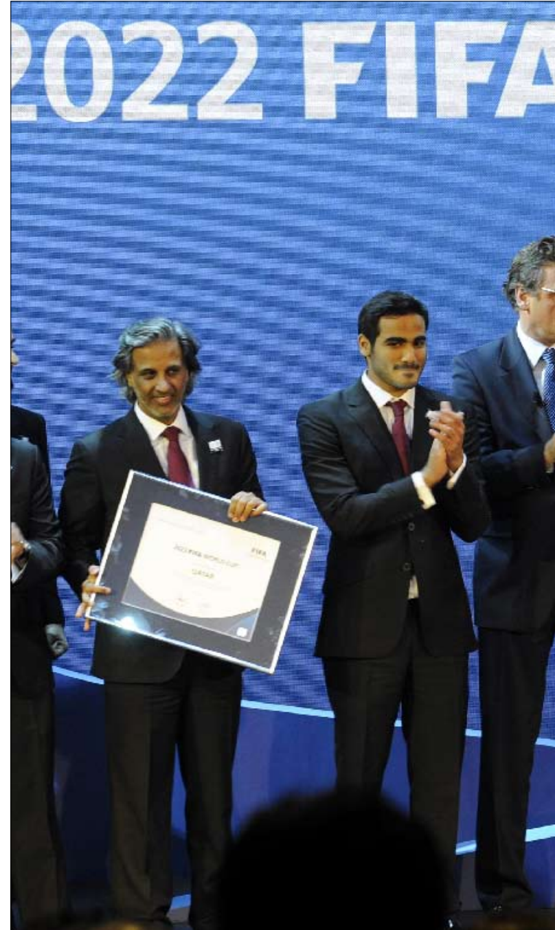
الشيخ محمد

بدوره «فوز قطر باستضافة نهائيات كأس العالم 2022 هو فوز لكل الخليج، بل فوز لكل العرب، والمطلوب حالياً من الاتحادات العربية على وجه العموم والاتحادات الخليجية وحكوماتها الوقوف إلى جانب قطر في كل ما يدعم استضافتها، لنباهي العالم بأسره».