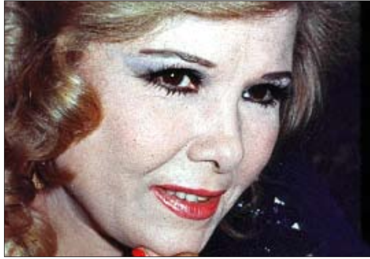
برلنتي عبد الحميد تركزت فنانة إغراء مع فيلم «رنة الخلال»

ماذا لو لم تلتق برلنتي عبد الحميد في بدايتها بالمسرحي الكبير زكي طليمات؟ هل كانت ستنفذ رغبتها الأساسية وتلتحق بقسم النقد في معهد الفنون المسرحية؟ يصعب تخيل تلك الفاتنة في صورة ناقدة مسرحية متجهمة، كما يصعب تخيلها محللة نفسية بعدما درست علم النفس. على أي حال، أقنعها طليمات بالتمثيل. لكنها لم تنس رغبتها في أن تكون كاتبة، وإن لم تكن تعلم أن كتابها اللذين سيصدران بعد عشر سنوات سيكونان عن مأساتها الشخصية المتقاطعة مع مأساة نكسة مصر بصورة لا يمكن فصمها. ماتت الفاتنة عن 75 عاماً وقد عانت إلام المرض، بعدما عانت إلام السياسة والفقدان والترمل. لكنها ظلت في صورة الجمهور تلك الجميلة التي ترقص الـ«هילה هوب»... الرقص التي «بتشعل نار الحب» (من فيلم «سر طاوية الإخفاء» لنيازي مصطفى - 1959). كم كانت المنافسة صعبة في فن الإغراء زمن هذ رستم.