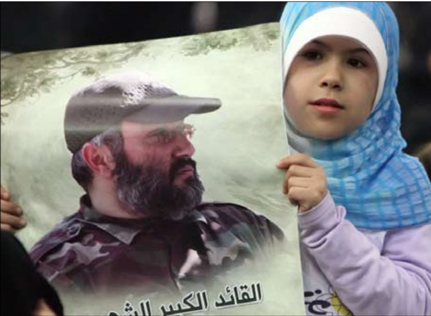
من تشييع القائد عماد مغنية في الضاحية (أرشيف)

نشط أركان فريق 14 آذار والسفارة الأميركية لحل لغز اغتيال المسؤول العسكري السابق في حزب الله، في العاصمة السورية، كأهم محققون دوليون