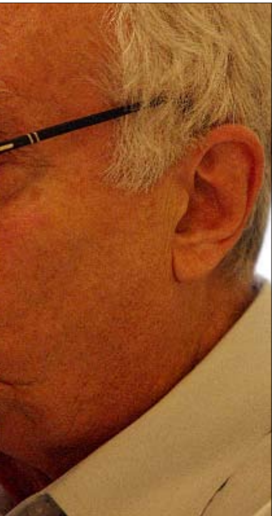
الدكتور جورج قرم

وهي أيضاً رحلة عابرة للمكان، لأنّ هذه الأفكار وتلك البيئات الثقافية المتنوعة قد صُدرت في ركاب الغزوات والفتوحات أو، في أئمة حال، قد استخلبت إلى كل مكان من العالم تقريباً. وهي سرعان ما أوجدت أهل الفكر والثقافة أو نجماً جديدة، كان لهذه الأفكار الآتية من الخارج أن أنتجت لديها الآثار والمفاعيل الأكثر تناقضاً. وفي بعض الأحيان الأكثر عنفاً. وفي كل مكان من العالم تقريباً، من ألمانيا إلى روسيا ثم الشرق الأوسط والشرق الأقصى، كان لهذه الأفكار أن أبقت الحماسة والرفض في آن واحد، وأن أثارت الأفتتان والتفاني كما الأشمئزاز والبغضاء. وكما سنرى في اللاحق من فصول هذا الكتاب، عندما تنظر ثقافات ومجتمعات أخرى بعضها إلى بعض وينتقد بعضها بعضاً، أو ترى نفسها ضحية للغرب، فإنها تفعل ذلك في أكثر الأحيان في ضوء الواحدة أو الأخرى من الأفكار الرئيسية القوية والدافعة التي أنتجت الثقافات الأوروبية الكبرى: الأصالة، والتجذّر، والوفاء للتراث، وصبون القيم، والتفوق في الإدراك الميتافيزيقي للعالم كما لتاريخه، والرسالة الروحية التي ينبغي إهداؤها إلى العالم. من هنا، تصبح الوظائف التخيلية والأسطورية التي يحتاج إليها كل مجتمع، ووظائف مدوّلة على نحو خطير، عاكسة لصدام الأفكار التي كان لها في ما مضى أن هزّت الثقافات الأوروبية المختلفة بعنف بالغ، لدرجة أنهت معها في تججير الحربين العالميتين اللتين ضجّ بهما القرن العشرون. لهذا السبب، ترانا قادرين الآن، عند مشاهدة التشنجات الهويّة المرتكزة على