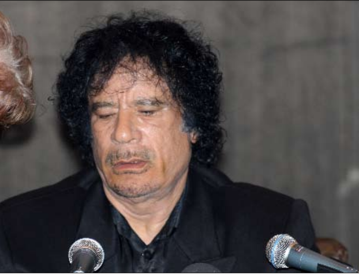
القذافي ومدير مراسمه نوري المسماري

ستبقى من دون تغيير (في الخطة) منذ أن توفقت الشحنة المقررة إلى روسيا. وأشار الخبراء الأميركيون إلى تزايد واضح في عدد الحراس المسلحين حول المفاعل. وقال السفير الأميركي، في إحدى الوثائق، إن العلاقة مع ليبيا شهدت تقدماً (وفي الوقت نفسه) إخفاقات جديدة عديدة، منذ آخر زيارة قام بها سيف الإسلام إلى الولايات المتحدة. ومن الأمور التي سببت إخفاقات في العلاقات موت فتحي الجهمي (معارض ليبي توفي في 20 أيار 2009 في العاصمة الأردنية عمان). لكن في أي حال، تشير الوثيقة إلى أن الولايات المتحدة وليبيا وجدتا طريقاً منتجة إلى الإمام لتأسيس حوار ثنائي بشأن حقوق الإنسان.