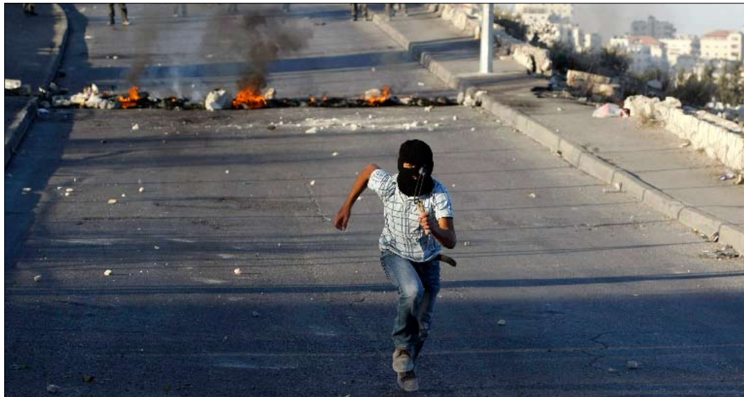
أثناء المواجهات في القدس الشرقية الثلاثاء الماضي

استشهاد فلستينيين من «سرايا القدس» في غزة