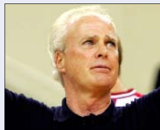
كوفتر تغلب على فويانيتش ذهاباً وإياباً