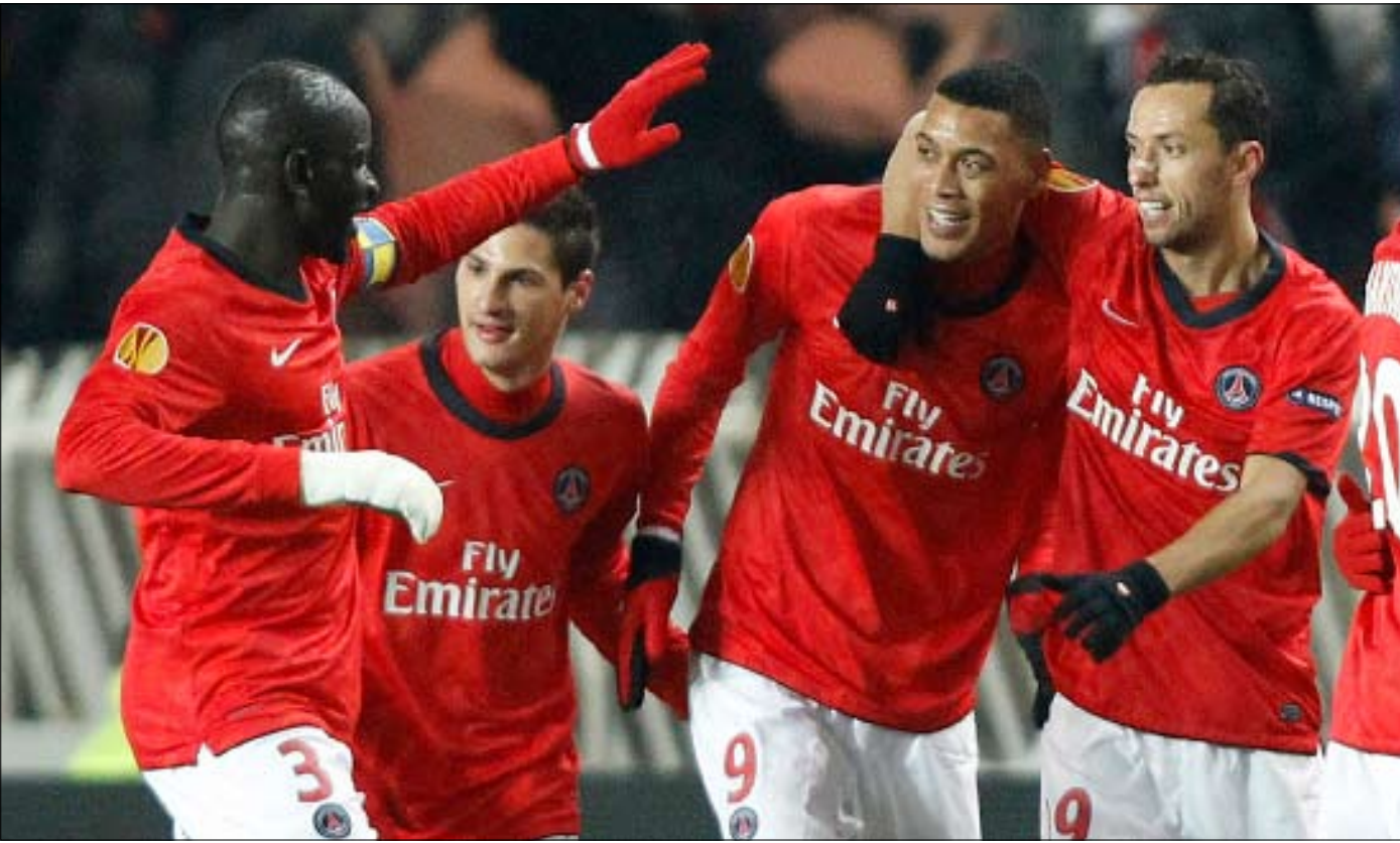
مهاجم باريس سان جيرمان غيوم هوارو (في الوسط) يحتفل ورفاقه بأحد أهدافه في مرمى اشبيلية

تأهلت فرق فياريال ودينامو كييف وسبارتا براغ وباريس سان جيرمان وليفربول وبشيكطاش الى دور الـ 32، بعد نهاية الجولة الخامسة قبل الاخيرة في دور المجموعات لمسابقة «يوروبا ليغ» لكرة القدم