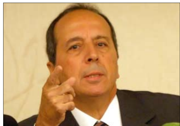
جميل السيد

تنحى رئيس الغرفة لدى محكمة التمييز القاضي الياس بو ناصيف عن النظر في الملف الذي أحيل إليه حول طلب اللواء جميل السيد بتنحية النائب العام التمييزي القاضي سعيد ميرزا عن منصبه. وأحيل الملف إلى رئيس الغرفة السادسة القاضي جوزف سماحة للنظر فيه. وكان قد صدر عن المكتب الإعلامي اللواء الركن جميل السيد بيان تعليقاً على قرار رئيس محكمة التمييز القاضي الياس أبو ناصيف بالتنحي عن النظر في طلب تنحية مدعى عام التمييز القاضي سعيد ميرزا، فأبدى اللواء السيد أسفه واستغرابه لتنحي القاضي أبو ناصيف نتيجة الضغوط التي قد يكون تعرض لها،