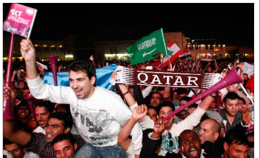
امتزجت الفرحة القطرية مع الجاليات العربية في الدوحة

كأس العالم 2022 حلت في «دوحة» العالم العربي لتتحول الإمارة الصغيرة الى قبلة عشاق كرة القدم بعد 12 سنة. وتأتي هذه الاستضافة لتؤكد أحقية وطن لغة الضاد في تنظيم أهم بطولة رياضية، وخصوصاً في قطر التي ما فتئت تنظم دورات وبطولات مبهرة على غرار أسياي الدوحة 2006 ومباريات عالمية لعل أبرزها دربي الأرجنتين والبرازيل قبل شهر تقريباً. المغرب كانت أول من فتح باب الترشيح من بين الدول العربية والأفريقية عندما «تجرت» وتقدمت لاحتضان مونديال 1994 الذي ذهب إلى الولايات المتحدة بنيلها 10 أصوات مقابل 7 للمملكة المغربية،