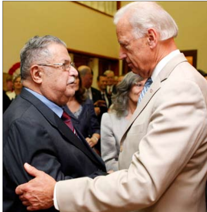
سجلت محاضر السفارة الأميركية مواقف سلبية للطالباني إزاء إيران

أن نصحه بعدم إقالة أحد لأن ذلك «سينظر إليه على أنه تعميق للأزمة». وهكذا حصل. ويبدو أن المشورة وطلب المساعدة من عادات الرئيس الطالباني المزممة، وهو لا يوفر لقاءً أو اجتماعاً مع المسؤولين الأميركيين إلا يختمه بالشكر على مساعدة سابقة، وطلب مساعدة جديدة، في الانتخابات والأمن... والطالباني، المعروف بأنه أحد أكبر حلفاء إيران في العراق، يتفوه أمام الأميركيين، وتحديداً الجنرال دايفيد بيترابوس