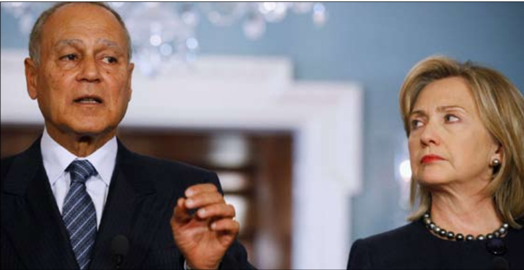
كلينتون وأبو الغيط خلال مؤتمر صحافي في واشنطن أوائل الشهر الماضي

هو مسألة أمنية ووطنية، لأن أسلحة من إسرائيل تتجه إلى شمال سيناء. وقال إن التهريب لن يتوقف إلا إذا كان مصر شريك على الحدود الأخرى في غزة. وأضاف أن لدى «حماس» مشروعاً ضد مصر، الأمر الذي أدى إلى ضغط على الحكومة المصرية ومشاكل كبيرة مع بدو شمال سيناء وجماعة الإخوان المسلمين. يجب على إسرائيل أن تدعم إما المصالحة بين حماس والسلطة الفلسطينية، وإما العودة إلى ممر فيلادلفيا للمساعدة في السيطرة على التهريب. وأشار إلى أن قبائل سيناء التي تعيش في مصر وإسرائيل تجعل من المستحيل على مصر وحدها السيطرة على الأعمال والأنشطة غير المشروعة.