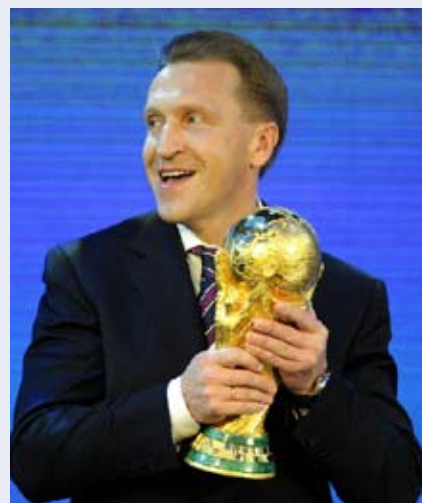
نائب رئيس الوزراء الروسي إيغور شوفالوف حاملاً الكأس

ويعد نجاح روسيا صفقة قوية لانكلترا، مهد كرة القدم، رغم الملف القوي الذي قدمته.