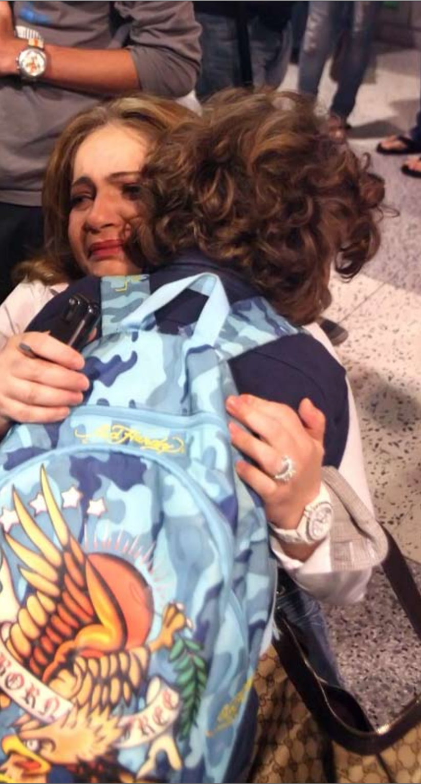
دفعت إحدى الأمهات 10 ملايين ليرة لأولادها الثلاثة عن الفصل الأخير (بلال جاويش)

الوزارة ربما لاستيعاب صدمة حلت على حين غفلة. فكل ما تستطيع فعله في مثل هذه الظروف هو «ألا نترك تلميذاً خارج الصف»، يقول يرق. يختصر المدير العام «خطة الطوارئ» بجملة بسيطة: «تلحق الوزارة الطلاب بالمدارس استناداً إلى إحدى الأوراق التي يقدمها الطالب والتي