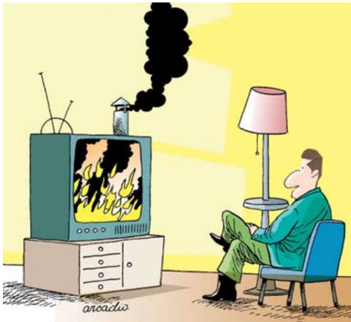
انكاديو - بنما