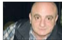
اكتشفوا وصفات «الشيّف» وجيه Otv ■ 20:30