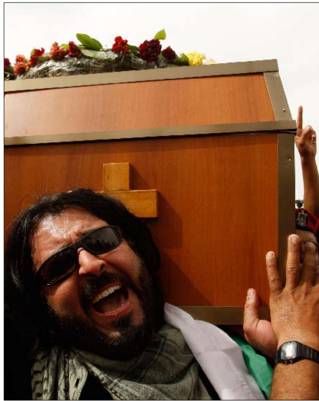
خلال تشييع أريغوني رمزيا في غزة أمس

من جهتها، نشرت وزارة الداخلية في غزة على موقعها الإلكتروني صوراً لثلاثة أشخاص ملتصحين، قالت إنهم مطلوبون على خلفية ضلوعهم في