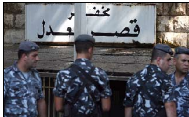
قصر العدل في بيروت (مرورا طحاح)

في معظم المؤسسات في لبنان، وليس بالضرورة الضخمة منها، يُخصّص على مدخلها مكان اسمه «الأمانات». يضع الزائر في هذا المكان الأشياء التي يحملها، وخاصة تلك التي لا تسمح المؤسسة بإدخالها لأسباب أمنية أو غير ذلك. هذا الأمر لا يبدو أنه ينطبق على قصر العدل في بيروت، علماً بأن المكان ليس مجرد مركز لمؤسسة أو شركة، بل هو صرح يضم كبار القضاة وعنوان لسلطة قائمة بذاتها. لا يوجد في قصر العدل المذكور مكان مخصص للأمانات، وبالتالي فإن سئى الحظ من يذهب إلى هناك وهو يحمل جهاز كومبيوتر محمولاً (لاب توب)، أو أي شيء آخر مما تمنع القوى