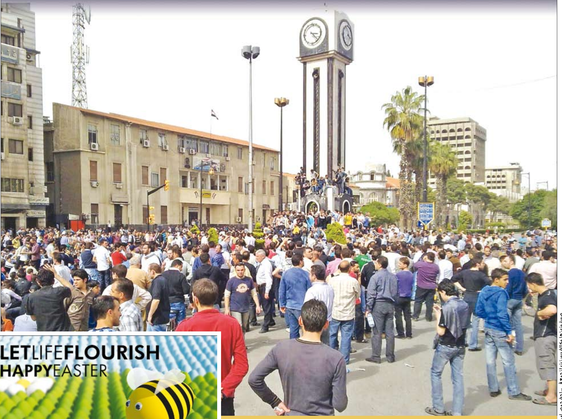
لتجمع في ساحة حصص أمس

دمشق، تتهم السلفيين بتمرد مسلح ووقائع قتل ضباط وجنود