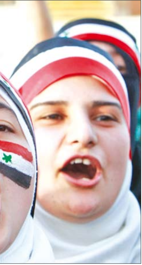
منظارات معارضة للنظام في عمان

العلنية، التي تدين قمع المعارضين لا تكفي، وأن مصادر السفارة في دمشق أكدت هذه النقطة، وطلبت فعل المزيد. وبعد تعداد الوسائل الكلامية التي يمكن هولستروم استخدام صندوقين لتوزيع الأموال عبرهما. الأول هو صندوق مكتب الديمقراطية وحقوق الإنسان والعمال (DRL)، والثاني هو صندوق مبادرة شراكة الشرق الأوسط (MEPI)، التابعان لوزارة الخارجية. ونقترح السفارة أن يكون ذلك عبر استخدام المنظمات غير الحكومية العالمية، مثل «فريدم هاوس». هذا في ما يتعلق بأول وسيلة مساعدة.