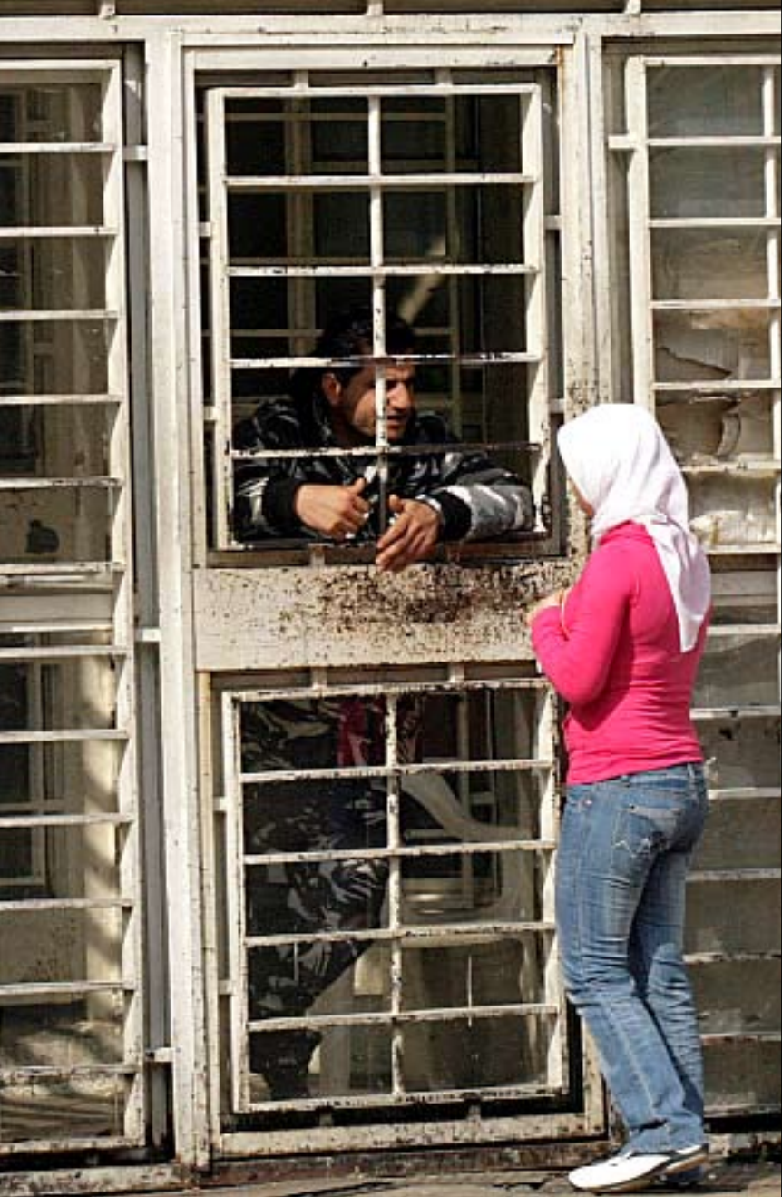
من خلف القضبان في السجن المركزي