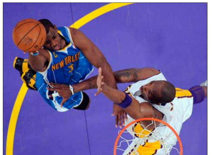
بول مسجل من فوق براينت