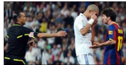
بول مسجل من فوق براينت

◀ احتضن ملعب «ميسيتا» في فالنسيا مرتين «إل كلاسيكو» بين برشلونة وريال مدريد، الأول فاز فيه المردييون 2-1 في 21 حزيران 1936، والثاني حسمه الكاتالونيون 2-0 في نيسان 1990. ◀ التقى برشلونة وريال مدريد 27 مرة في «كأس الملك»، ففاز الأول 13 مرة، والثاني 9 مرات مقابل 5 تعادلات. ◀ حسمت ركلات الجزاء مرة واحدة «إل كلاسيكو»، وفاز فيها ريال مدريد 1-4 عام 1985. ◀ «الذقيقتان الذهبيتان» في تاريخ «إل كلاسيكو» هما 35 و68، إذ سُجّل خلالهما مناصفة 28 هدفاً. ◀ 3 لاعبين فقط في تاريخ «إل كلاسيكو» سجلوا «هاتريك» ولم يفز فريقهم في المباراة هم «أسطورة» ريال مدريد سانتياغو برنابيو، وأفضل هداف في تاريخ برشلونة الفيليبيني المولد باولينو ألكانتارا (357 هدفاً في 357 مباراة)، وليونيل ميسي. ◀ لم يتواجه برشلونة وريال مدريد مرتين في 4 أيام أو أقل منذ 14 عاماً: ريال مدريد - برشلونة 2-1 في 20 آب 1997، وريال مدريد - برشلونة 4-1 في 23 آب 1997. ◀ للمرة الثالثة في تاريخ «إل كلاسيكو» لم يخسر برشلونة أمام ريال مدريد في 6 مباريات متتالية. وفي المرتين السابقتين توقفت «السلسلة النظيفة» في المباراة السابعة.