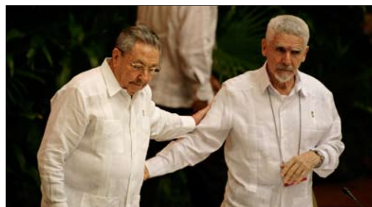
كاسترو يرحب بقائد الثورة راميرو فالديز في مؤتمر الشيوعي في هافانا

«ما كان يهمني مضمون ما سمعته بقدر الشكل الذي كانوا يعبرون عنه، كم كانوا معدّين، كم كانت مفرداتهم غنية لدرجة أنني لم أكد أفهم (...). الجيل الجديد مدعو، دون تردد، إلى تصويب وتغيير كل ما يجب تصويبه وتغييره، والاستمرار في إثبات أن الاشتراكية هي أيضاً فن