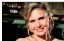
يسرا تمثّل أيضاً «أبو ظبي الأولى» ■ 20:00