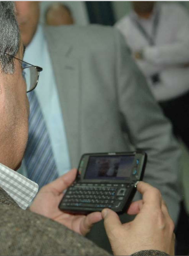
شربل نحاس خلال التجربة الأولية لشبكة «الجيل الثالث» في مبنى «الفا»

عند الساعة الثانية من بعد ظهر أمس، وداخل قاعة تحت الأرض، في مبنى «ليباتيل» في سن الفيل، حيث تضع شركة «الفا» تجهيزاتها التقنية، جرى تاريخ زمان ومكان أول اتصال «فيديوي» ناجح عبر تقنية الجيل الثالث (3,5G) في لبنان. حصل هذا الاتصال بين وزير الاتصالات، شربل نحاس، ورئيس مجلس إدارة شركة «الفا» ومديرها العام مروان الحايك، بحضور رئيس الهيئة المنظمة للاتصالات عماد حب الله وعدد من أعضاء هيئة المالكيين (الخلوي) التابعة لوزارة الاتصالات ومجموعة من الإداريين والتقنيين في «الفا» وشركة «أريكسون»، التي تتولى تجهيز شبكة MIC1 بالمعدات اللازمة وتركيبها.