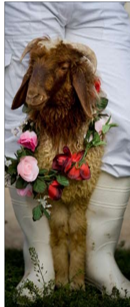
خروف ينتظر التضحية به لمناسبة عيد الفصح اليهودي

* محاميتان في مركز «عدالة» الحقوق في حيفا