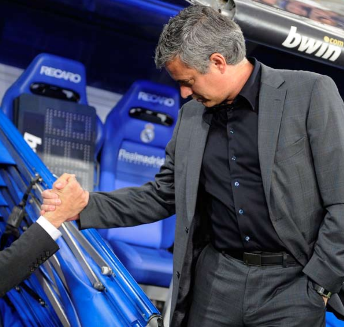
أدرك مورينيو أن غوارديولا لن ينجز إلى الدخول في دوامة المشادات الصحافية غير المجدية

على راوول البيول لتسببه بركة الجزاء، إذ نقل عن أحد المشجعين قوله: «البيول ميت بالنسبة إلي». «عصر الدماغ» الذي قام به مورينيو أفضى إلى نتائج ملموسة من حيث الأداء على أرض الملعب، فكان جاهزاً في كل لحظة ولكل الأحداث الطارئة، والدليل أنه لعب ورقة الألماني مسعود أوزيل في الوقت المناسب، فأجبر الأخير برشلونة على تقديم مجهود مضاعف، في الوقت الذي كان فيه الكاتالونيون يحاولون عدم وضع ثقلهم أمام عشرة لاعبين وتوفير جهودهم لليلة الأربعاء التي ستنتقل فيها الاحتفالات من فالنسيا إلى «بلانكا كاتالونيا» و«لا رامبلا» في برشلونة أو إلى ساحة «سبيليس» في العاصمة الإسبانية. أما في لبنان والعالم العربي فسيكون «التزيك» عنوان المرحلة بالنسبة إلى طرف، وخلق الحجج لتبرير الخسارة بالنسبة إلى طرف آخر.