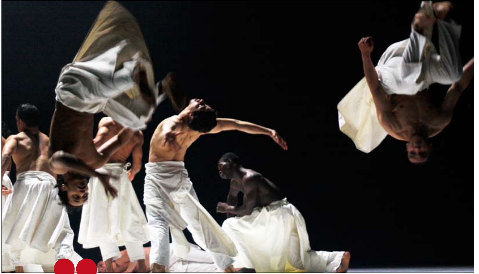
من عرض «الدين: دين النهار لليل» لهيرفي كوبي (أحمد دغلس)