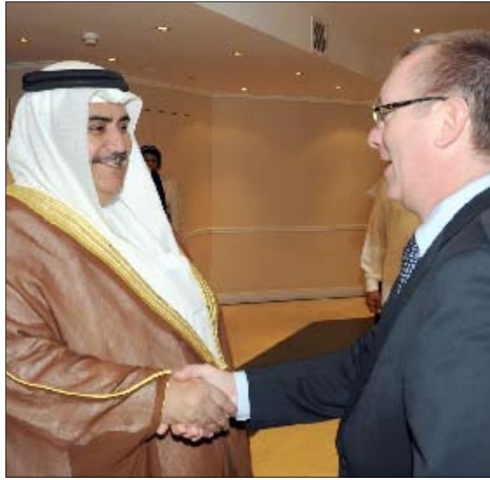
فيلتمان ووزير الخارجية أس

من جهة ثانية، أعلن شباب «ثورة 14 شباط» في البحرين إضراباً عن الطعام منذ السادسة من صباح أمس، احتجاجاً على حرب الإبادة التي يشنها الاحتلال السعودي والخليفي، والتي أدت إلى استهداف العشرات، وسيستمر الإضراب 4 أيام، بحسب بيان صادر عن ائتلاف شباب «ثورة 14 شباط».