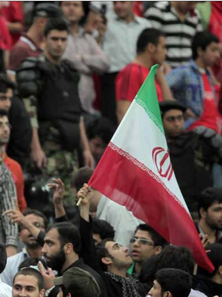
كانت مباراة بين فريق إيراني وآخر سعودي في طهران الأسبوع الماضي مناسبة لخروج تظاهرات ورفع شعارات مؤيدة للبحرين ومنددة بالتدخل السعودي

وفي السياق، دعا الصدر «ملوك وأمراء ورؤساء وسلطين دول الخليج»، من النجف، إلى ما سماها «وثيقة عهد وسلام»، قائلاً إن مجلس التعاون الخليجي يحمل البصمات الإسلامية