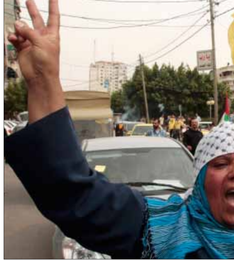
من احتفالات قطاع غزة بالمصالحة الفلسطينية

السادات. كلام يورده وزير الخارجية لضيافته الأميركي ليخلص إلى تبرير سعي الحكومة المصرية إلى فعل أقصى ما يمكنها فعله لعزل حركة «حماس» ووقف التهريب إلى قطاع غزة. وطمان أبو الغيط المسؤول الأميركي إلى أن حكومته، لتعزيز إمكانياتها على الحدود مع غزة، قد تسير بمشروع شراء التجهيزات الأميركية البالغة قيمتها 23 مليون دولار لمنع التهريب، وفق ما طلبته الولايات المتحدة من خلال فريق مهندسيها الذين أجروا دراسة عن هذا الموضوع.