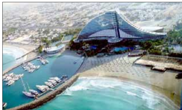
يدرس الملتقى تأثير مدينة دبي على السياسات المعمارية العربية