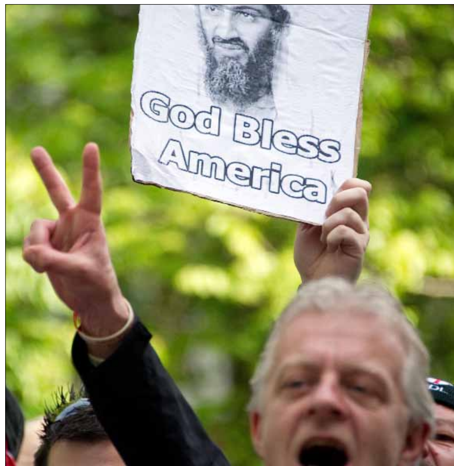
بريطانيون يتظاهرون بتأييد لقتل بن لادن

* مفكر أميركي وأستاذ فخري في قسم اللسانيات والفلسفة في معهد ماساتشوستس للتكنولوجيا، عن مجلة «غيرنيكا» الإلكترونية (ترجمة ديماس شريف)