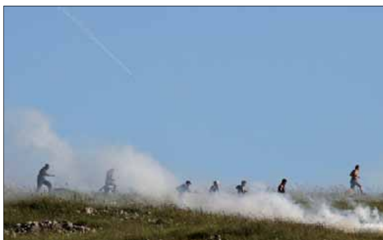
غاز مسيل للدموع ضد فلسطينيين في الضفة الغربية

تجري أجهزة الأمن الإسرائيلية، وخصوصاً الجيش، استعدادات لمواجهة نشاطات في يوم ذكرى النكبة الفلسطينية الذي يحييه الفلسطينيون في 15 أيار.