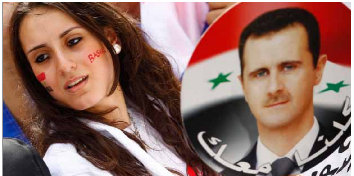
مناصرة للرئيس السوري في لندن

من الواقعية، لكن المعاناة تكبر باستمرار، وتكبر مع هذه المعاناة الأسفلة والتأفف والقلق المتعدد الأشكال والاتجاهات. ويقودنا ذلك إلى طرح السؤال الكبير أيضاً، الذي يتردد همساً أو علانية: أين أصبح التحرك تحت شعار إسقاط نظام الطائفية السياسية؟ لماذا يتولد انطباع متزايد، بأن هذا التحرك قد توقف كلياً أو جزئياً؟ لقد استجاب مواطنون بعشرات الآلاف، في العاصمة ومدن أخرى، لدعوات التظاهر والاحتجاج، وبحماسة بعثت أوسع الأمل في النفوس، بإمكان النهوض بعد تراجع وخيبات متلاحقة.