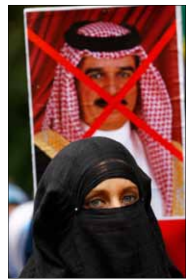
من تظاهرة أمام السفارة السورية في لندن

من جهة ثانية، جدد رئيس تجمع الوحدة الوطنية الشيخ عبد اللطيف المحمود اتهاماته لإيران وحزب الله وأحزاب عراقية وشخصيات من دول عربية وشقيقة بالضلوع في مؤامرة طائفية تستهدف البحرين. وقال من