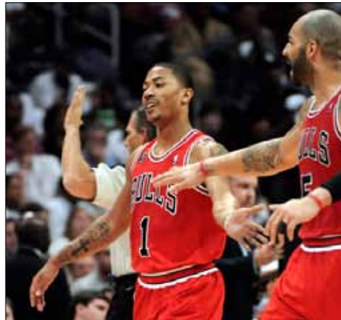
بوزر وروز (1) فرحان بفوز شيكاغو

يقف شيكاغو بولز على مشارف بلوغ نهائي المنطقة الشرقية إثر تقديمه على أتلانتا هوكس 2-3 بتغلبه عليه 95-83 في المباراة الخامسة بينهما 2-3، ضمن «بلاي أوف» دوري كرة السلة الأميركي الشمالي للمحترفين