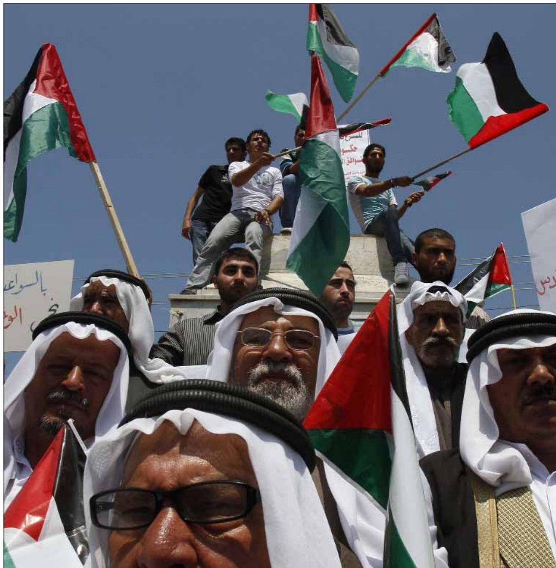
الحكومة الإسرائيلية تريد معاقبة الموظفين الفلسطينيين بعد توقيع المصالحة

وبعض النظر عن الأسباب والمسببات، تبقى الحقيقة أن أكثر من مليون ونصف المليون مواطن فلسطيني، وهم عائلات الموظفين، لا يزالون بانتظار رواتبهم التي لم يحدد موعد لصرفها، ما يزيد احتمالات تحرك نقابات العمال الفلسطينية لصالح موظفي السلطة واللجوء إلى إضرابات عن العمل، الأمر الذي سيعطل الكثير من مجريات الحياة اليومية، وهو سيناريو حدث قبل ذلك أكثر من مرة.