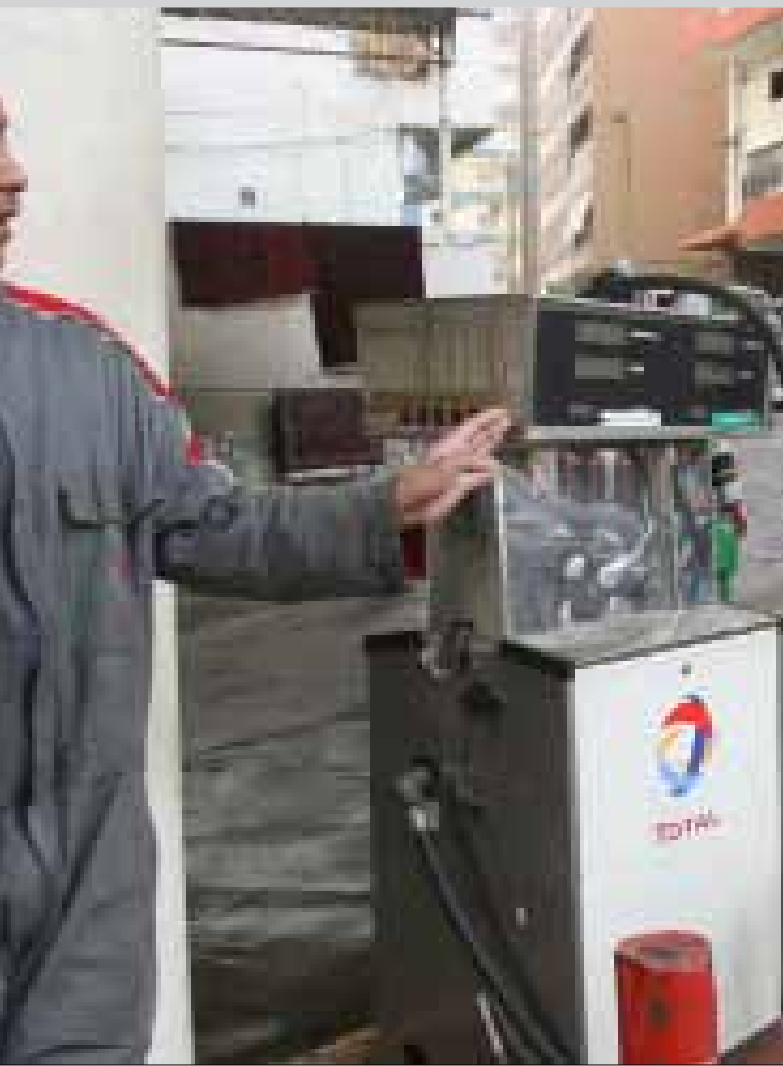
هل هذا النوع من الدعم مجد في لبنان؟