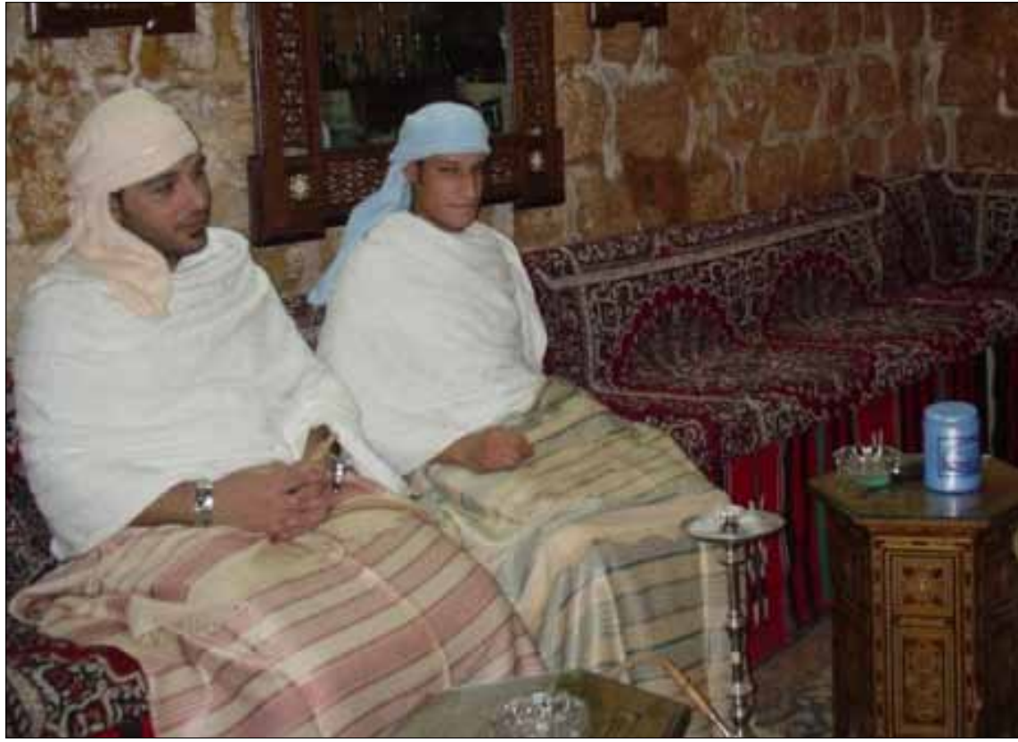
قاعة الاستقبال في حمام العبد: مكان للاسترخاء والاستراحة

كان في طرابلس 12 حماماً تستقبل سكان المدينة وزوارها يومياً. لكن تطور الحياة وتأمين المياه الجارية سبباً اندثار لعادة التوجه إلى الحمام أسبوعياً، التي لا تتوقف أهميتها على النظافة، بل تتوسع لتناول الارتخاء والاندماج في المجتمع. أقفلت الحمامات مع تضائل عدد الزوار وبيات القسم الأكبر منها مواقع أثرية (حمام عز الدين والحمام الجديد) تفتتح أبوابها أمام الزوار ليتعرفوا إلى هندستها، لكن حمام العبد، الذي تصل إليه من سوق الصاغة، والذي يعود بناؤه إلى 1620، لم يتوقف العمل فيه منذ سنوات، ولا تزال جدرانها تبقى الوجود لعادة الحمامات التي يزيد عمرها على أكثر من 2500 سنة. في الحمام تلمس خصوصية المكان، فالجدران تعبق بالدفء والبخار وروائح الصابون المعطرة. تتوسط القاعة الأولى بركة خريف مياهها يريح أعصاب الزوار الجالس على المقاعد الطويلة المغطاة بالوسائد والأقمشة الشرقية الطابع، وثمة موقد نحاسي كبير وضعت على جنبائه مصبات القهوة العربية يرخب بالزائر. كل هذه العناصر تميز هذه الغرفة المسماة المشلح، لأنه هنا يترك الزبون