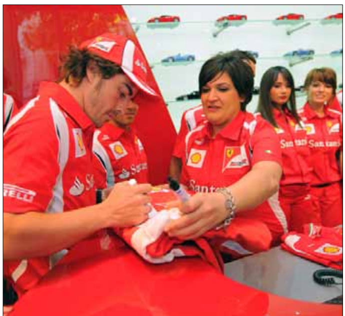
سائق فيراري فرناندو ألونسو يوقع لإحدى المعجبات في برشلونة

لكن الوضع قد يتغير هذا الموسم مع الجانج المتحرك، أو ما يعرف بـ «دي آر أس» (دراغ ريداكشن سيستم)، الذي يعطي السيارة القادمة من الخلف فرصة أكبر للتجاوز من خلال تخفيف قوة احتكاك الهواء بهيكليها