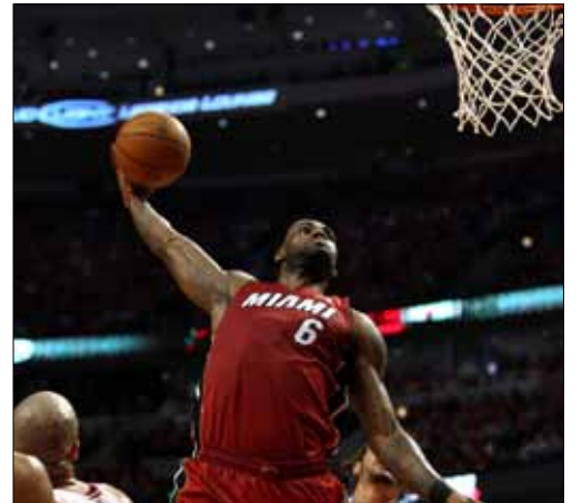
جيمس صاعداً إلى سلة شيكاغو

تعملق «الملك» ليبرون جيمس ليقود ميامي هيت إلى معادلة السلسلة مع شيكاغو بولز 1-1 في مقر دار الأخير، في مباراة كانت مثيرة في معظم فتراتهما