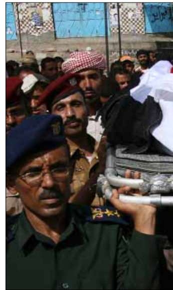
عناصر أمنية تشارك في تشييع جثمان اهد المحتجين في تعز أمس

أن وزراء مجلس التعاون الخليجي سيعقدون جلسة طارئة لبحث أزمة اليمن بعد انهيار اتفاق توصلت فيه بلدانهم لانتقال السلطة في اليمن رغم التعديلات التي ادخلت عليه، مرجحاً أن يعقد اللقاء اليوم. وفي السياق، كشفت صحيفة «الأولى» اليمنية في عددها الصادر أمس تفاصيل اللحظات الأخيرة التي سبقت مغادرة الأمين العام لمجلس التعاون الخليجي، عبد اللطيف الزباني، صنعاء، موضحة أن الرئيس اليمني قال للزباني وسفراء دول الخليج عند امتناعه عن التوقيع على المبادرة الخليجية لحل الأزمة السياسية في اليمن «لن أوقع على قطع رأسي». ونقلت الصحيفة عن مصادر وصفتها بالموثوقة قولها «إن الزباني وسفراء الخليج أبلغوا الرئيس صالح في نهاية اجتماع يوم أمس، أن أمامه مهلة يومين إضافيين إذا أراد الموافقة على توقيع المبادرة، وإلا فإنهم سيتخذون قراراً بسحبها». وفيما تحدثت مصادر يمنية عن أن التوتر بين الزباني وصالح ظهر من خلال عدم توديع أي موفد رسمي للأمين العام لمجلس التعاون لحظة مغادرته بعدما أمضى خمسة أيام في صنعاء، محاولاً إقناع