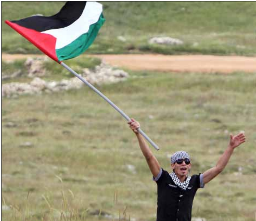
في مارون الراس الأحد الفائت (حسن بحسون)

لقد استمر الفرنسيون والبريطانيون في أداء أدوار نيو - كولونيالية مهمة في المنطقة، اقتصادياً وعسكرياً، لا سيما في مجال «التعاون» الأمني. وقد عززوا موقعهم هذا من خلال زيادة «مساعدهم» الأمنية والدبلوماسية لحلفائهم من الطغاة العرب. إن القمع المدعوم أميركياً في البحرين والسعودية وعمان واليمن والأردن والمغرب والجزائر والإمارات متوافق