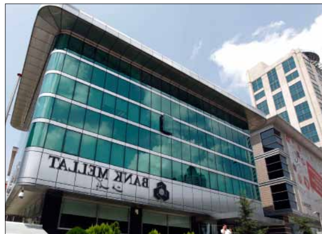
المصارف التركية أيضا قطعت علاقاتها مع مصرف ميلت الإيراني

وأضافت الوثيقة أنه خلال المحادثات، أبلغ كيرينكو فرانك أن الروس سيؤخرون تسليم إيران الوقود الإضافي لمحطة بوشهر «لأسباب فنية»، بأوامر شخصية من الرئيس الروسي السابق بوتين نفسه. وتضيف الصحيفة، نقلاً عن وثائق «ويكيليكس»، أن الروس اتخذوا هذا القرار لأن الإيرانيين هددوهم بقدرتهم على إثارة اضطرابات في الشيشان.