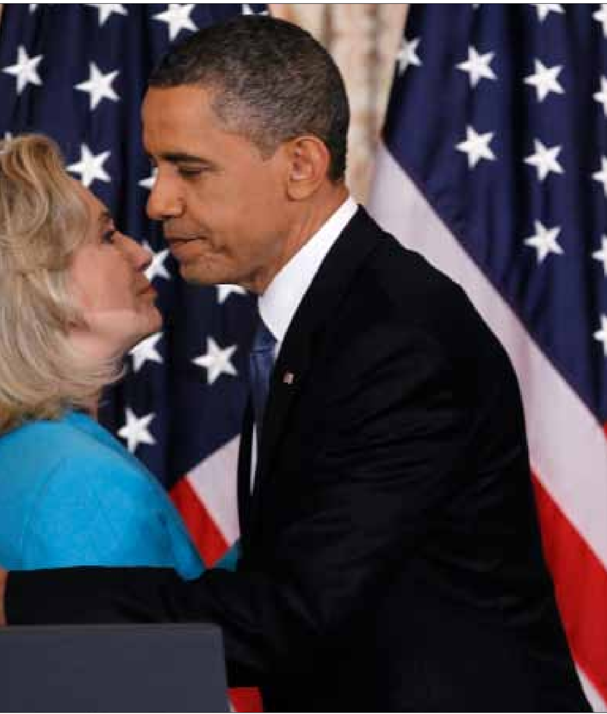
أوباما يعانق كلينتون بعد تقديمه لآراءه في مقر وزارة الخارجية في واشنطن أمس

شدد على أمن إسرائيل «يهودية»... وقدم رؤية لدولة على حدود 67 «منزوعة السلاح»