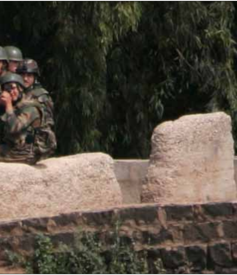
جنود سوريون يتمركزون داخل منطقة العريضة على الحدود مع لبنان

ورأى أوباما أنه «في الآونة الأخيرة، اختار النظام السوري طريق القتل والاعتقالات الجماعية لمواطنيه»، مشيراً إلى أن «الولايات المتحدة أدانت هذه الأفعال، وبالعمل مع المجتمع الدولي كففنا عقوباتنا على النظام السوري، بما في ذلك العقوبات المعلنة على الرئيس الأسد ومن حوله». وبعدها أشار إلى أن الشعب السوري عبر عن شجاعته بالمطالبة بالانتقال إلى الديمقراطية، أوضح أوباما أن الرئيس الأسد لديه الآن خيار «يمكن أن يقود هذا التحول، أو الابتعاد