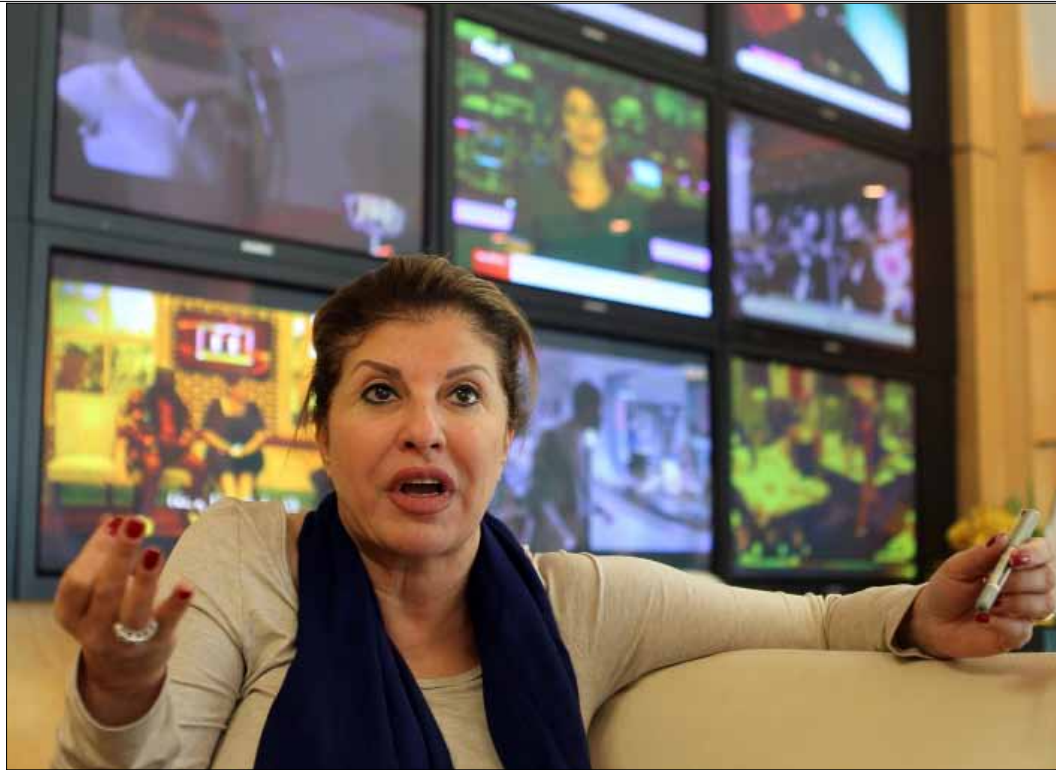
تقدّم سرحان برنامج «ناس بوك» على «روتانا مصرية»

عادت هالة سرحان إلى القاهرة حيث استقبلت استقبال الفاتحين بعد سنوات على إبعادها القسري عن أرض الكنانة، إثر حلقتها الشهيرة عن «فتيات الليل»، التي قدّمتها ضمن برنامجها الشهير «هالة شو» على «روتانا سينما» في نهاية 2006. ومن بيروت، قدّمت الإعلامية المصرية مع المخرج سيمون أسمر برنامجاً رمضانياً بعنوان «قناة 5 نجوم» على «روتانا موسيقى». يوماً، كانت «روتانا» بقيادةها تذهب نحو استغلال الضجة الكبيرة التي أثارته مغادرة سرحان المحروسة، لكنها فشلت أيضاً في تجربتها، وانتهت بعودة سرحان إلى دبي والولايات المتحدة حيث يقيم زوجها. مع ذلك، ظلت الشركة السعودية تساندها، وحظيت بدلال خاص من الأمير الوليد بن طلال، الذي كان ولا يزال يراهن على حضورها في قنواته كمفتاح إعلامي مهم في دخول القاهرة، بعدما فشلت سياسة «روتانا» في التعامل مع نجوم الغناء المصريين. لكن سرحان العائدة إلى القاهرة تستعد اليوم لإدارة محطة «روتانا مصرية».