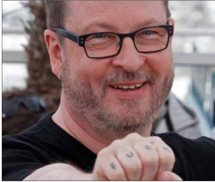
استدرك فون تراير معلنا تعاطفه مع اليهود، لكنه نعت إسرائيل بـ«الغراء»

السينمائي الملعون الذي يعدّ من عباقرة الفن السابع، أشعل النيران مجدداً في المهرجان بنكاته الاستفزازية. الكروازيت لا تحتل المزاح في قضايا اليهود، فكيف حين يصل الأمر إلى شتم إسرائيل