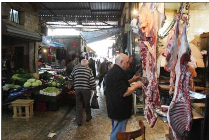
تشمل الرقابة إجراء فحص منتظم لاماكن الطعام

راجحاً». وستنظم دورات تثقيفية وتاهيلية للعاملين في المطاعم تزوّدهم بالمعلومات الأساسية لصناعة الطعام بصورة صحيّة، على أن يحصلوا بعدها على شهادة كفاءة. ويهدف المشروع إلى جعل جبيل عنواناً للغذاء السليم، ما يزيد من نسبة الزائرين إليها ورؤاد المطاعم فيها. اللجنة ستقوم «بكبسات» مراقبة للمطاعم والفنادق من دون سابق إنذار، على أن توجه الإنذارات الخطيّة إلى المخالفين بالدرجة الأولى، وحتى