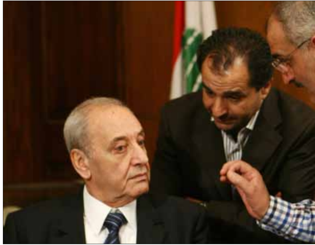
تعترض قوى 14 آذار على نية بزي عقد جلسة تشريعية

لكن ضرورات التوازن المذهبي أولاً، والبعيد السياسي لأي عملية مشابهة ثانياً، سيمنعان هذا الخيار في المدى القريب، إضافة إلى أن هناك من بدأ يقر بأن المشكلة ليست في رئيس الحكومة المكلف، الذي يبدي تعاوناً ضمن الأطر المتعارف عليها، ولا في رئيس الجمهورية الذي يمكن ضبط إيقاعه ومطالبه ومطامحه، بل في أطراف أخرى باتت تطلب أكثر مما يمكنها أن تتحمل.