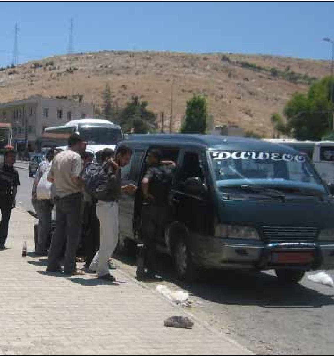
توقف بعض السائقي عن العمل بانتظار عودة الهدوء في سوريا

سائق، فقد طلب منهم هوياتهم الشخصية لمعرفة من أي منطقة في درعا هم. فرد عليهم «أخي درعا المحطة، وإزرع وإنخل وجاسم والصنمين، ما فيكم تدخلوا سوريا حالياً». لم يقنعهم رد السائق، لأن الإعلان الرسمي السوري قال إن الحياة في درعا عادت إلى طبيعتها، فاعتمد العمال الثلاثة أسلوب انتقالهم إلى السوق الحرة، ومن هناك يعبرون إلى الأمن العام لمعرفة ما إذا كان سيسمح لهم بالدخول أو تُطلب منهم العودة.