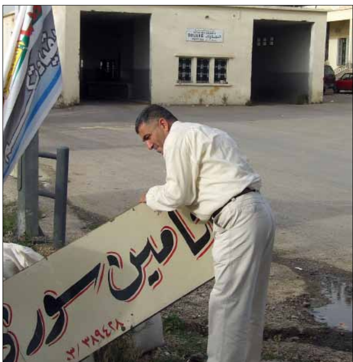
أصحاب شركات التأمين ينتظرون العابرين في القاع (رامح حمية)

لأن قاسم متزوجة بسوري. وفي بلدة البيرة التي تؤوي في منازلها عدداً من العائلات السورية، لا شيء يلفت الانتباه لولا تجمع بعض السيارات قبالة المبنى القديم للتأشيرة الرسمية حيث تقيم عائلة سورية واحدة، وقد لوحظ تردّد مجموعة من الشبان السوريين إليه. وفي الأثناء، كان اجتماع في إحدى غرف الثانوية يضم ممثلين عن مفوضية الأمم المتحدة لشؤون اللاجئين (الأونروا)، والهيئة العليا للإغاثة، ووزارة الشؤون الاجتماعية،