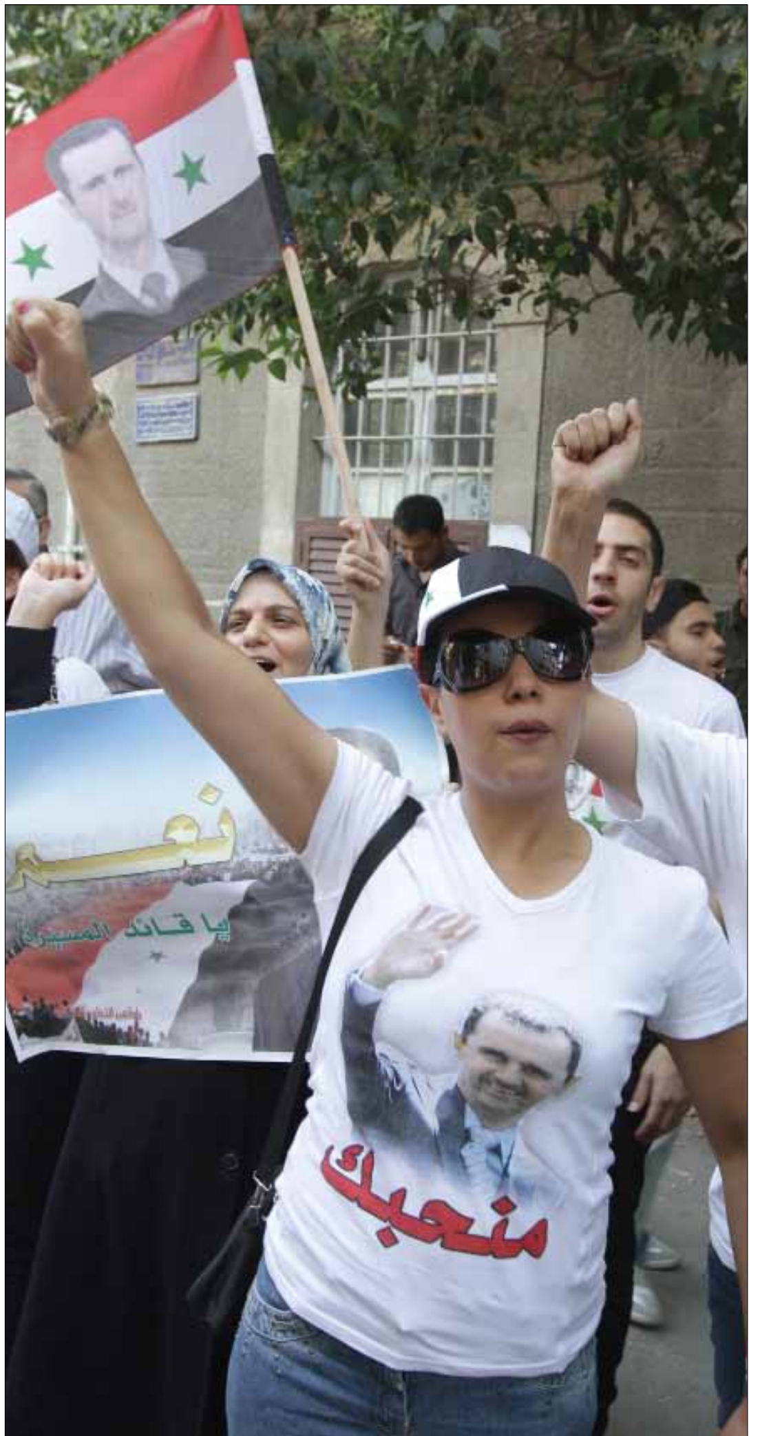
مشاركون في حملة «منحبيك» أمام السفارة الفرنسية أمس

جديدة المشاورات في «اللقاء التشاوري» الذي نظمتها هيئة الحوار الوطني حالت دون تمكن المجتمعين من الاتفاق على بيان ختامي في الموعد المحدد، فانبثقت من اللقاء لجنة من عشر شخصيات يفترض أن تجتمع اليوم لتضع النقاط على حروف البيان الذي ترفض «تنسيقيات الثورة» قراءته