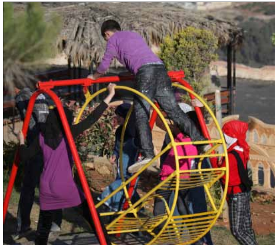
أصبحت «حديقة إيران» معلماً في البلدة