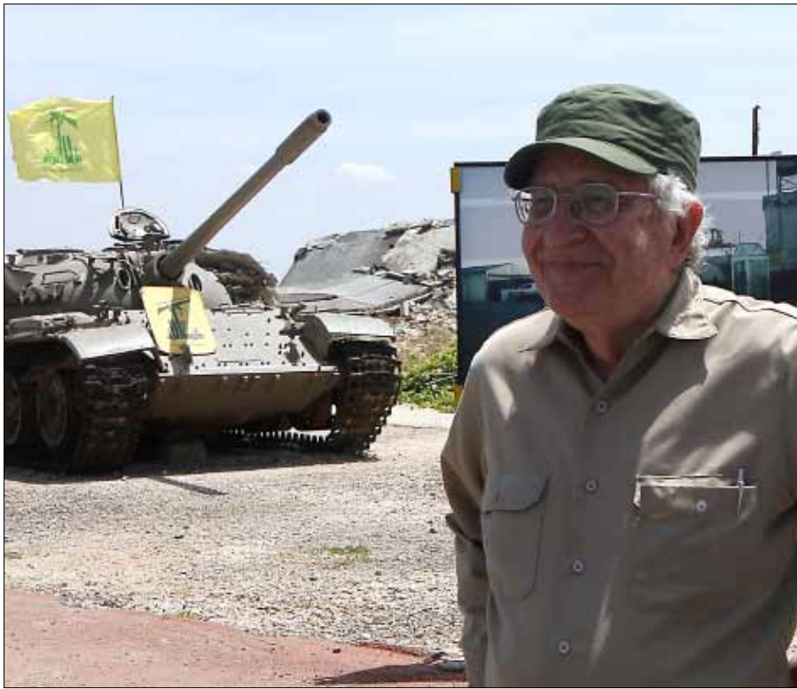
نوام تشومسكي في مارون الراس

لا يثر ارتوازية واحدة في مارون الراس. ينتظر الأهالي تجمع المياه في بركتين طبيعيتين، من شتاء إلى شتاء. ووفقاً لرئيس البلدية، إبراهيم علوية، فإن الكهرباء «في أسوأ حالاتها أيضاً». وإذا استثنينا «التقنين القاسي» الذي تعانيه مثل جميع قرى بنت جبيل، فإن القرية بحاجة إلى «محوّلات متطورة»، إذ إن الموجودة حالياً، توفر في أحسن الحالات «170 فولت فقط». في الليل، يسقط الظلام على القرية، شبحاً أسود مرعباً، بينما تسرق أضواء مستوطنة «أفيغيم» المقابلة النظر. الكهرباء لا تنقطع في «اسرائيل». والجدير بالذكر، أنه لا مولدات أو اشتراكات بديلة في القرية الأخيرة على الحدود، ما يعني أنه لا بديل من الظلام «يوم إيه يوم لا». أما المدارس،