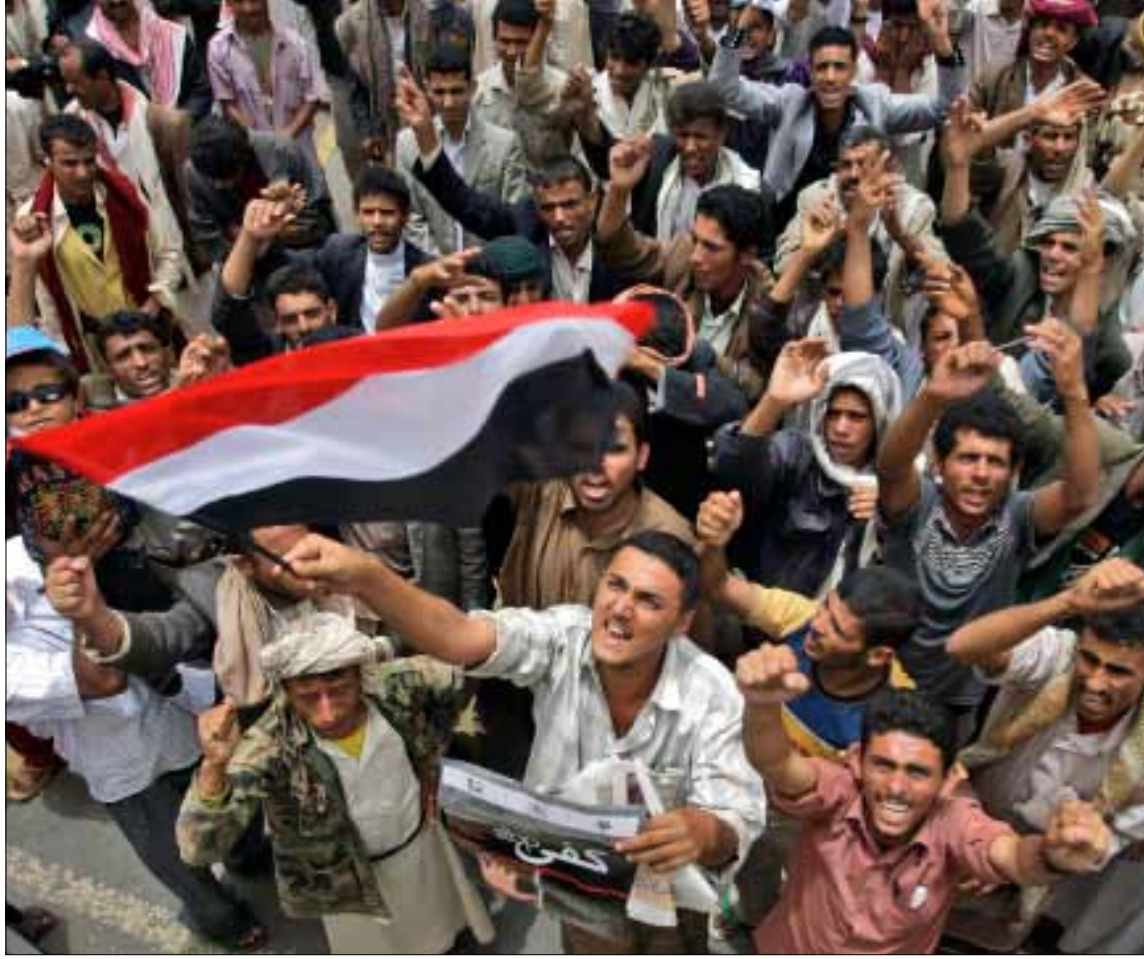
الهوة تزداد بين مطالب المحتجين وأفعال احزاب اللقاء المشترك

كثفت الولايات المتحدة تحركاتها على خط الرياض - صنعاء، سعياً وراء إقناع الرئيس اليمني، علي عبد الله صالح بإتمام عملية نقل السلطة، في ظل استمرار حالة التخبط في أوساط المعارضة اليمنية