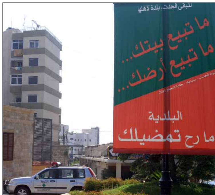
وزعت بلدية الحدث اللافتات في أرجاء البلدة