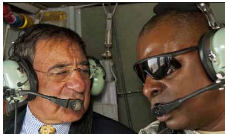
بانيتا يجول فوق بغداد بال مروحية أمس

العراقيين التي تحمل زمام المسؤولية لمحاربة تلك المجموعات الشيعية وملاحقة كل من يستخدم أنواعاً كهذه من الأسلحة». وشدد بانيتا على أن «هناك حاجة كذلك للضغط على إيران حتى تتخلى عن