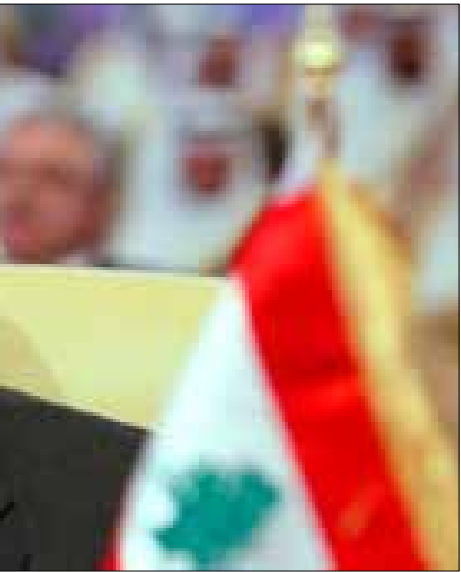
يحاول سليمان جني مكاسب سياسية فزط بها سلفه (أرشيف)

رسائل متبادلة بين رئيس الجمهورية والأمين العام لحزب الله السيد حسن نصر الله الذي دعم ترشيح نائب مدير المخابرات، رغم طمأنة سليمان الحزب إلى مواصفات مستشاره العسكري، فضلاً عن استمرار المنصب في الطائفة الشيعية.