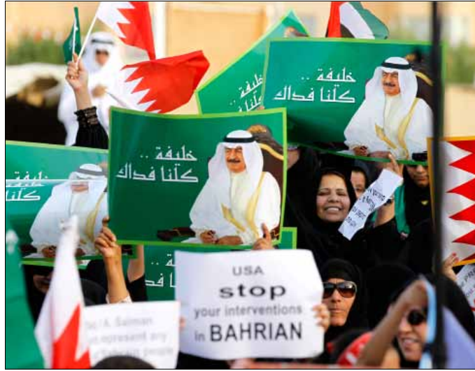
ضد التدخل الأمريكي مع التدخل السعودي!

منذ أن بدأ الحوار، تفرج السلطة عن المعتقلين كبادرة حسن نية، بانتظار استكمالها بإخلاء سبيل رموز المعارضة. ويتوقع أن تنتهي الجولة الأولى اليوم على أن تبدأ الجولة الثانية الخميس