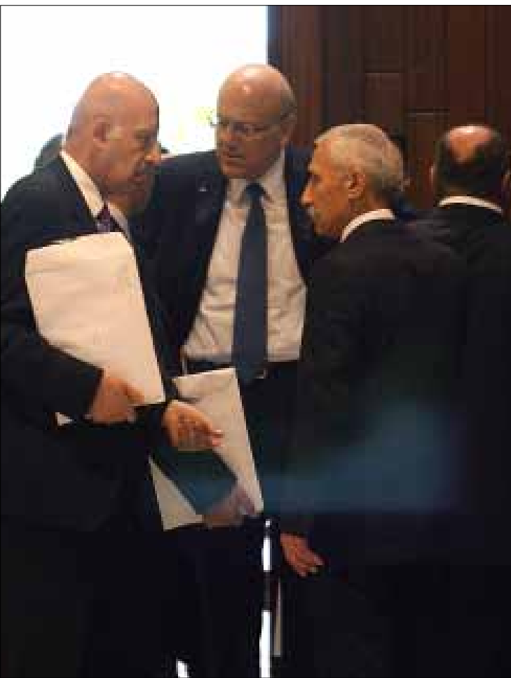
الجلسة الأولى للحكومة: جدول أعمال ضخم ولا بنود جذابة

وقد أكد وزير الخارجية والمغتربين عدنان منصور أن وزير الطاقة والمياه جبران باسيل، سيقدّم ملفاً عن هذه القضية إلى مجلس الوزراء في جلسته الأولى، مشدداً على ضرورة التحرك بجدية وسرعة. وأعلن رفض لبنان لمحاولة إسرائيل فرض أمر واقع وتكريس خرقها للمنطقة الاقتصادية الخالصة له، وكذلك اعتراضه