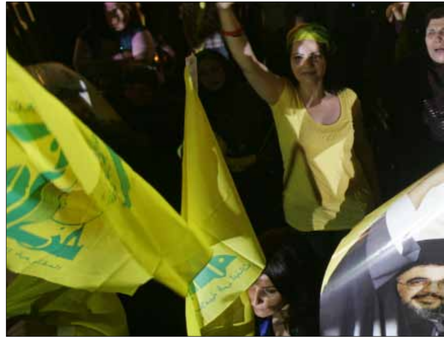
الإسرائيليون يستخدمون أسلوب المقاومة للحديث عن مفاجآت في الحرب المقبلة (هيثم الموسوي)

الحكومة اللبنانية مطالبة بتسريع الخطوات التنفيذية التي تؤدي إلى بدء التنقيب عن النفط واستخراجه