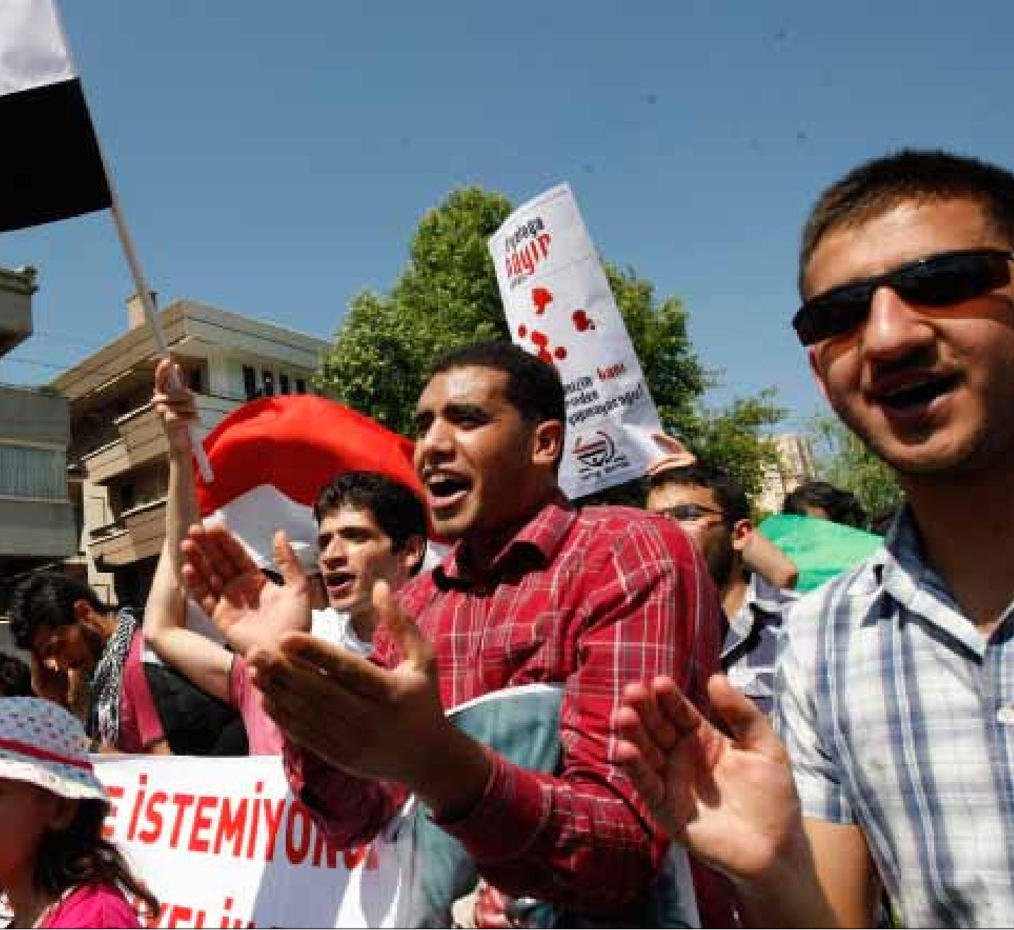
من تظاهرة أمام السفارة السورية في انقره

سعى الغرب إلى تحقيق مصالحه ودعم الأنظمة الفاسدة، ما قضى على الليبراليين العرب