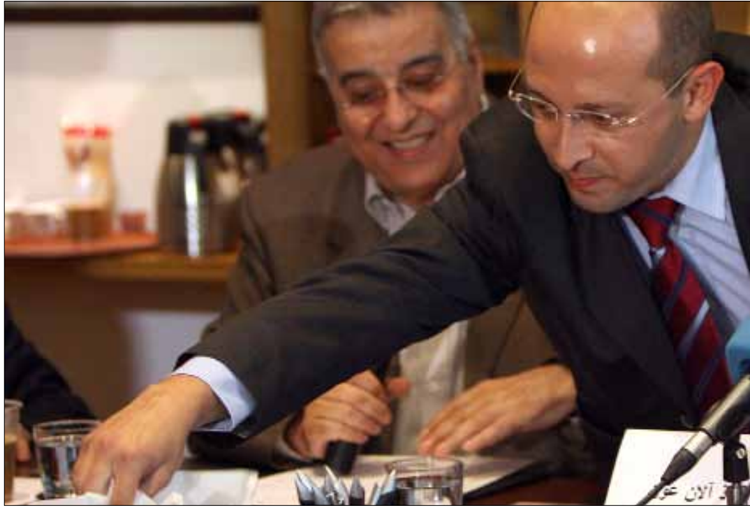
تحول «المركز» مكتباً حزبياً نتيجة غياب النقاشات داخل الأحزاب

لمن تجاوز السبعين عاماً لا يمكن أن يكون في ندوة كهذه من دون استحضار «الندوة اللبنانية» التي أسسها ميشال أسمر عام 1946. فالأفكار التي بلورها ميشال شيجا وجواد بولس وكمال جنبلاط وموريس الجميل وكمال الحاج وغيرهم على منبر أسمر، لا تزال هي الأساس في انقسامات اللبنانيين رغم مرور أكثر من أربعين عاماً على إقفال تلك «الندوة» أبوابها، ونحو عشرين عاماً على آخر إصدارات مؤسسها. من دور «الكيان» في الصراع العربي-الإسرائيلي، إلى واجبات اللبنانيين في الدفاع عن أرضهم، مروراً بمكانة رئاسة الجمهورية والإصلاحات الضرورية للنهوض بالوطن. «من ميشال شيجا إلى الآن عون