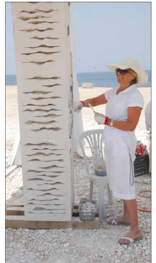
شارك عشرون نحاتاً في مهرجان عمشيت

اختتمت بلدية عمشيت السبت الفائت المهرجان الدولي للنحت، في احتفال حضره رئيس الجمهورية ميشال سليمان، وعرضت خلاله أعمال النحاتين العشرة المشاركين من لبنان، سوريا، تركيا، أوكرانيا، روسيا، إسبانيا، بلغاريا وأرمينيا