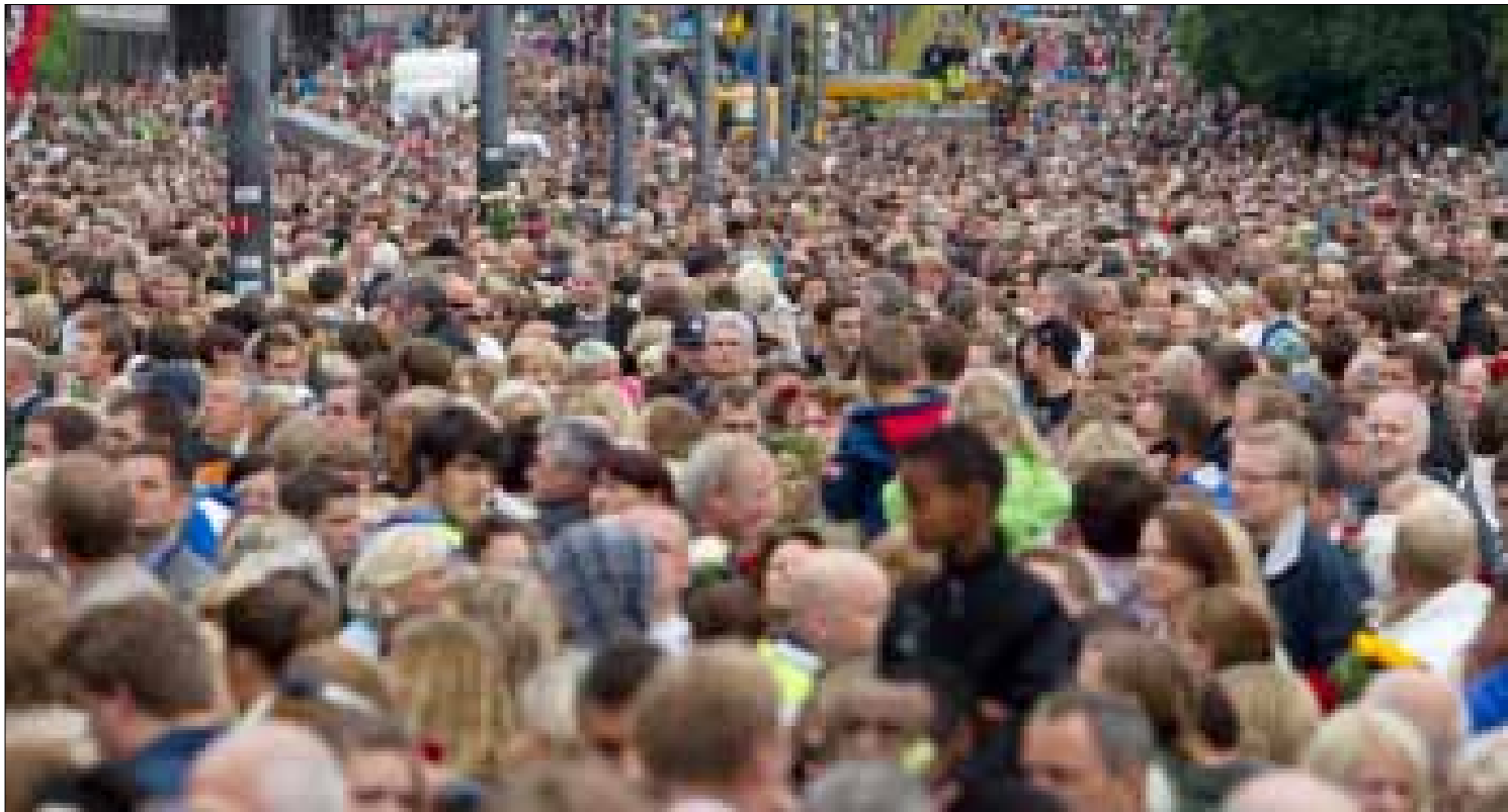
نرويجيون يشاركون في مسيرة الأرواح امس في اوسلو

إثر المجزرة التي ارتكبتها «قائد فرسان الحق» و«صائد الماركسيين»، اندرس بيرينغ برايفك، تكاثر الحديث لتحديد هويته ومعرفة الأسباب الكامنة وراء هذا الإرهاب. قد يكون الكتاب - المانيفستو، «إعلان استقلال أوروبي - 2083»، الذي وزعه برايفك قبل العملية خير دليل للإجابة عن العديد من التساؤلات. برايفك، الذي