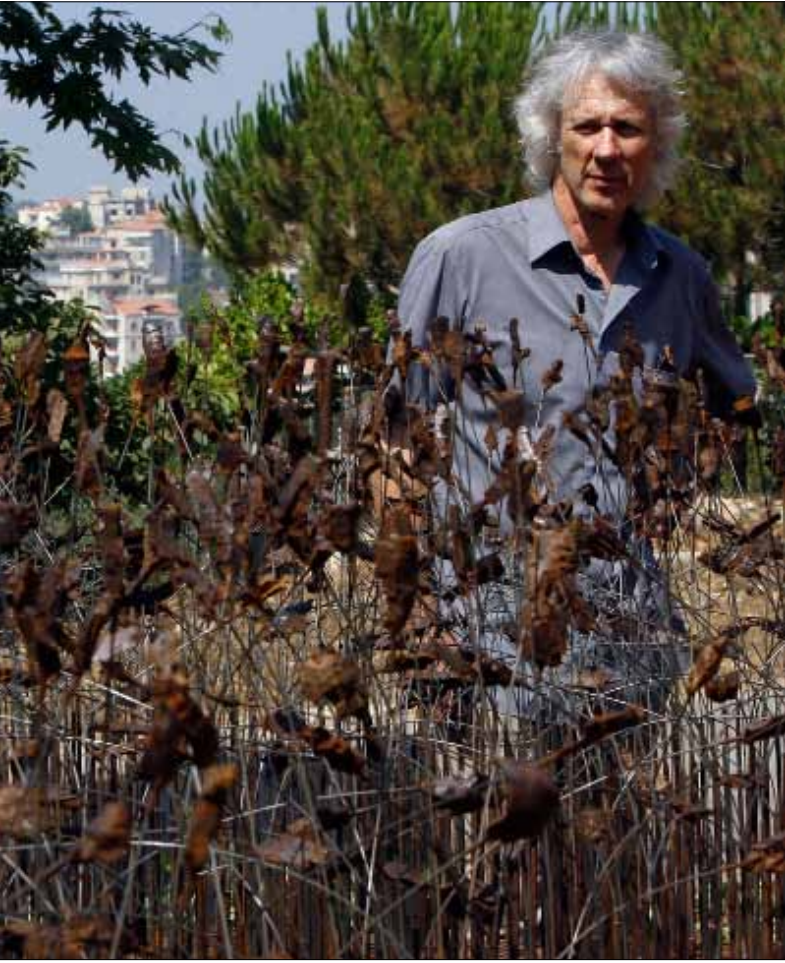
جال إتيين كراهينبول بمنحوتته عام 11 ثم أهداها إلى عاليه (مروان طحطح)

استقرار المنحوتة في عاليه «قرار كان يجب أن يتخذ يوماً ما. إن هذه المنحوتة تنتمي إلى هذا المكان، وهي ليست عملاً تجارياً». يقول لنا الفنان إتيين كراهينبول. الرجل الذي قادته الصدفة إلى عاليه قبل 11 عاماً أحب لبنان، وأحب عاليه.