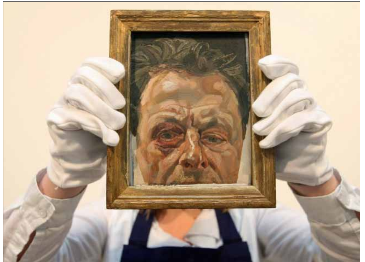
«أوتوبورتريه بعين مضروبة» لفرويد خلال طرحها للمزاد في صالة «سونيبز» في لندن عام 2010

من لحم ودم» كان يردد، معتبراً أن «اللوحة هي الشخص». هل رسم لوسيان فرويد في مرحلته الأخيرة، سوى الموت؟ أو بالأحرى، حالة القلق الميتافيزيقي الذي يستبطن تلك النهاية المعلنة. رسم التختر والتهدّل والترهل والقبح، وسط حالة من الانتظار الطويل والصمت والعنف المختزن. التقط الأجساد السافرة التي تنضح بعريها، وتظهر على حقيقتها تحت ضوء ساطع، لا يترك مجالاً لخداع أو اصطناع أو تنميق أو لياقة