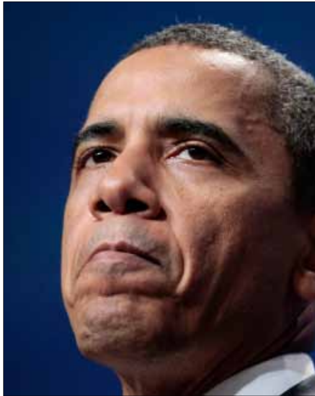
أوباما خلال المؤتمر السنوي للمجلس الوطني «أراز» في واشنطن أول من أمس

الاقتطاعات فقط، مقاربة لا تطلب من الأثرياء ومن الشركات الكبرى المساهمة في أي شيء على الإطلاق». وأشار إلى أنه بحسب «المقاربة المتوازنة لن يضطر 98 في المئة من الأميركيين الذين يجنون أقل من 250 ألف دولار إلى دفع ضرائب إضافية أبداً». وأوضح أن «رفع سقف الدين لا يسمح للكونغرس بإنفاق مزيد من المال، بل يعطي البلاد القدرة على تسديد الفواتير التي كدسها