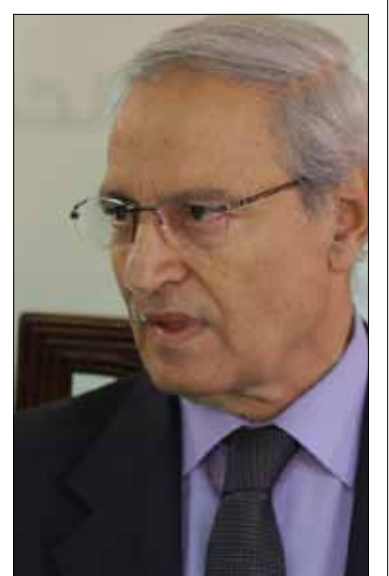
الشرع