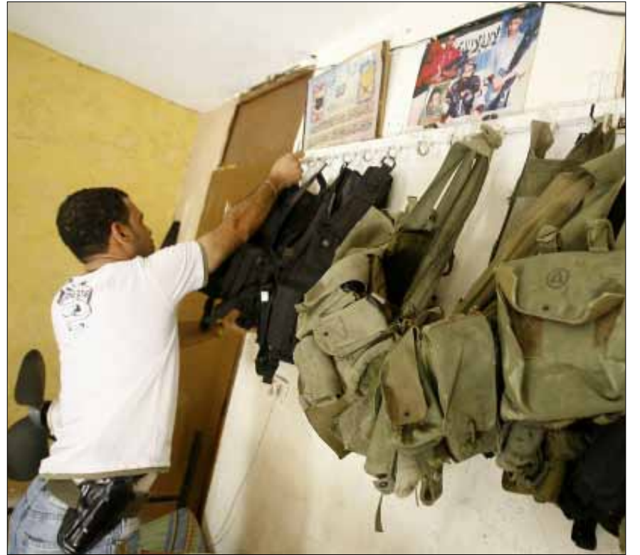
أكبر القضايا في المخيمات الفلسطينية بعد ملف المخبرين هو ملف المطلوبين