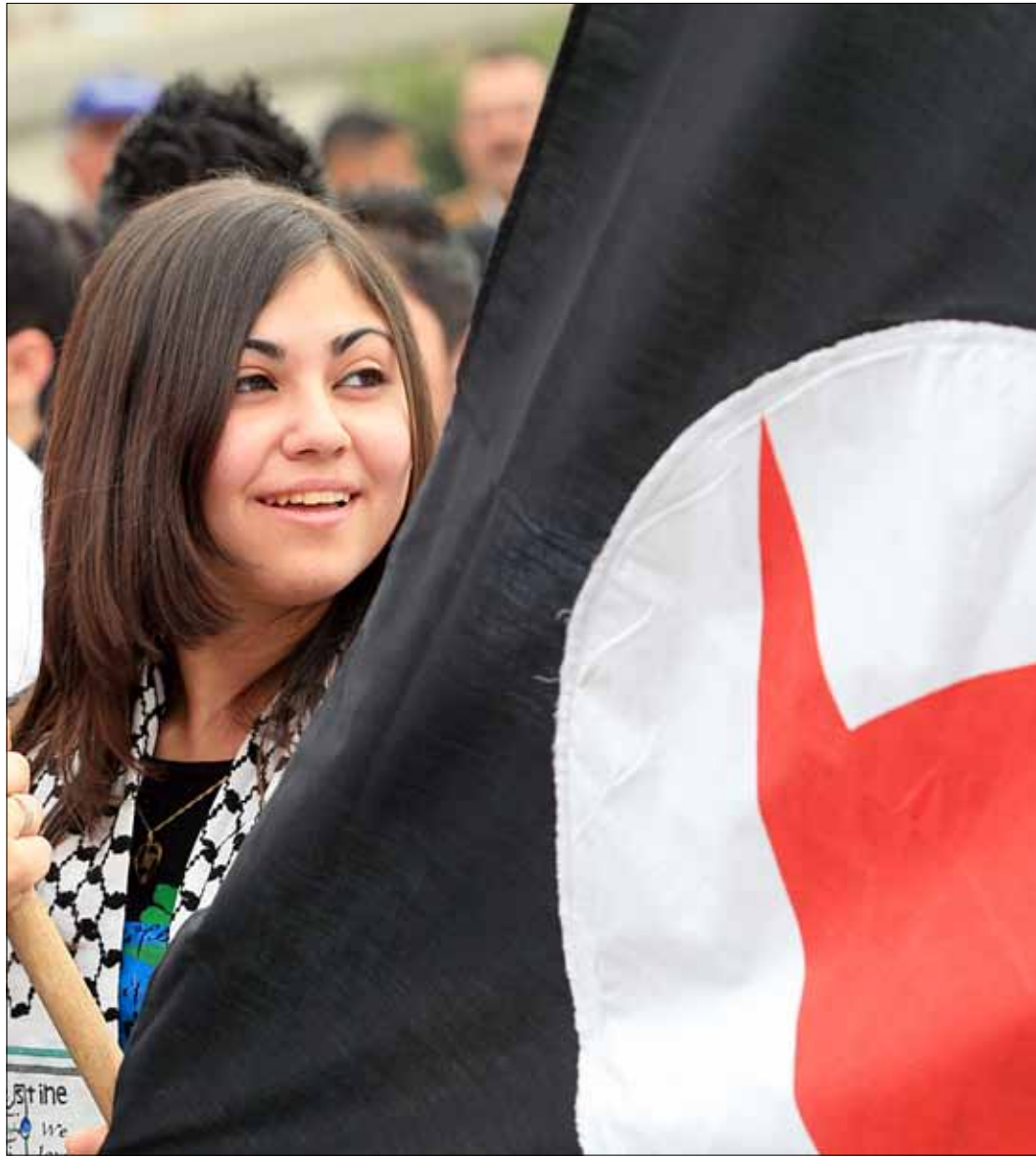
قيادة الحزب حاسمة في خيارها إلى جانب القيادة السورية

تفوح رائحة ولادة تيار ما من الصمت القومي. ثمة أطباء من دير الزور إلى حماه يعاينون الجرحى في مستشفياتهم. هؤلاء لا يمكنهم سوى أن يكونوا قوميين، كما لا يمكنهم إلا أن يكونوا جزءاً من مجتمعهم. وجدوا أنفسهم متعارضين مع نهج القيادة الحزبية، أو يسبقونها.