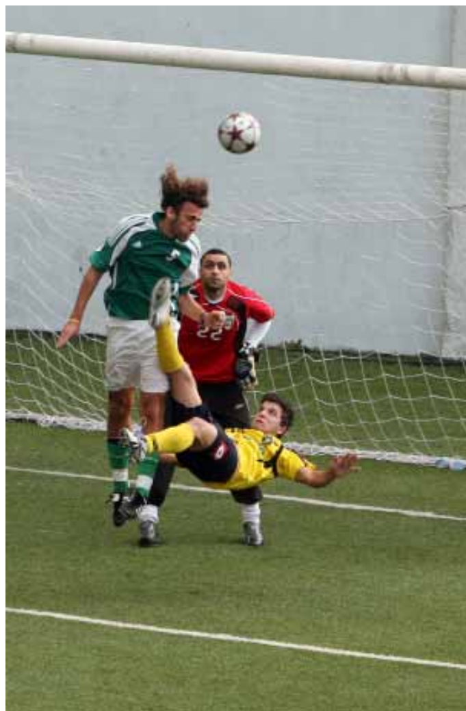
تبقى عودة حكمة - كرة القدم الى الدرجة الأولى الهدف الأهم (بلال جاويش)

ثانياً: أصبح القرار الآن بعهددة الجمعية العمومية للنادي التي يحق لها الدعوة الى عقد انتخابات وفتح باب الترشح مجدداً، ولكن بعد توقيع عريضة (طلب) موقعة من 25% من عدد أعضاء الجمعية