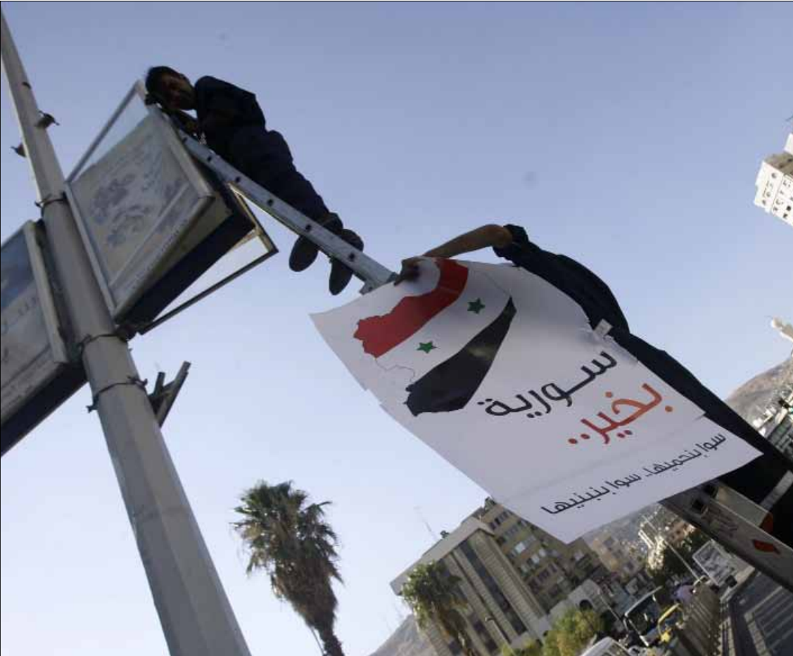
من ضمن حملة «سوريا بخير» في دمشق

أما سياسياً، فقد سجّل رئيس الحكومة التركية رجب طيب أردوغان موقفاً نارياً جديداً إزاء النظام السوري، إذ دعا مسؤولي النظام إلى وقف إراقة الدماء فوراً، محذراً إياهم من أن «من يبني سعاده على التسلط، فإنه سيغرق في برك الدماء التي يسيلها»، وذلك في كلمة ألقاها في افتتاح شبكة القطر السريع الذي يصل بين أنقرة ومحافظة قونيا. أما وزير خارجيته أحمد داوود أوغلو، فقد كشف بدوره أن جميع الاتصالات السياسية انقطعت بين أنقرة ودمشق منذ «فشلت القيادة السورية في تنفيذ