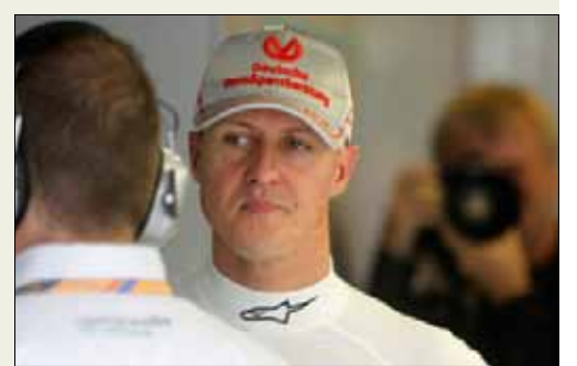
ميكائيل شوماخر

وجد البريطاني بيرني إيكليستون، مالك الحقوق التجارية في بطولة العالم لسباقات سيارات الفورمولا 1، وظيفة للألماني ميكائيل شوماخر، سائق «مرسيدس جي بي» بعد تقاعده من السباقات، إذ رأى الأول في «الأسطورة» شخصاً مثالياً ليكون رئيساً لأحد الفرق. وقال إيكليستون في هذا الصدد: «يستطيع (شوماخر) قيادة فريق. من خلال خبرته وموهبته،