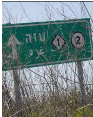
من أعمال رؤوف الحاج يحيى

أما اختيار موضوع المسابقة، فجاء أكثر ذاتية، بعدما كانت تيمات السنوات السابقة ترتبط أكثر بالسياق العام من «رمضان» إلى