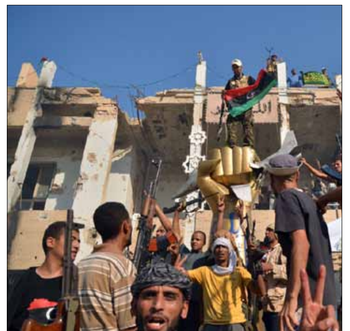
مقاتلون أمام منزل القذافي في باب العزيزية بطرابلس أمس

من جهة ثانية، أصدر النائب الديموقراطي الأميركي عن أوهايو، كوسينيتش، بياناً اتهم فيه الأطلسي بانتهاك قرار الأمم المتحدة 1970 و1973 و«السعى على نحو غير مشروع إلى تغيير النظام»، وقال إنه «تحتج وتدخّل في حرب أهلية». وقال «إن كان سيحتمل أعضاء في نظام القذافي مسؤولياتهم، فيجب أن يحتمل قياديون في الأطلسي مسؤولياتهم أيضاً من خلال المحكمة الجنائية الدولية، عن كل القتل المدني الذي سقطوا نتيجة القصف، وإلا سنشهد انتصاراً لعصابة دولية جديدة»، معتبراً أن تدخل الحلف الدولي يشكل سابقة في تحويله إلى «شرطي دولي». وطرح كوسينيتش أسئلة عن أداء وكالة الاستخبارات المركزية الأميركية دوراً في التخطيط لتغيير النظام في ليبيا قبل أحداث شباط، وما إذا كانت واشنطن تسعى من خلال المساهمة في إسقاط النظام الليبي إلى دعم شركات النفط الكبرى. (أ ف ب، رويترز، يو بي أي)