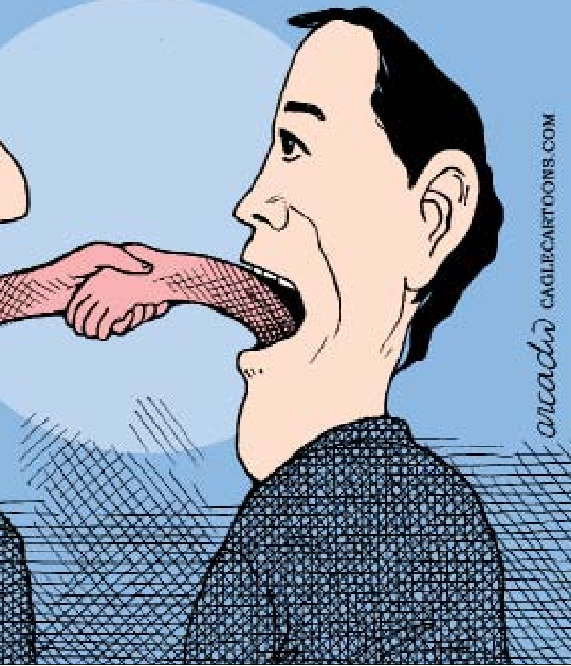
اركاديو - بنما

هذه «الموشحات» الكلامية الرئانة المذكورة أنفأ تحيل إلى عنصر آخر من مكونات خطابنا قوامه الأوصاف القاسية، على غرار صفة الوجه العبوس