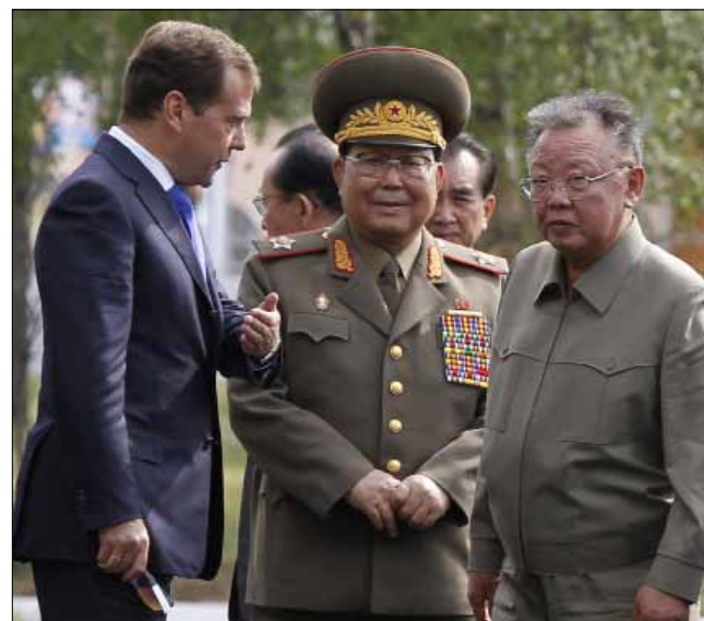
كيم ومدفيديف في اولان أوديه امس

الشمال يدعم مشروع الأنوب المعد لنقل الغاز الروسي إلى الجنوب