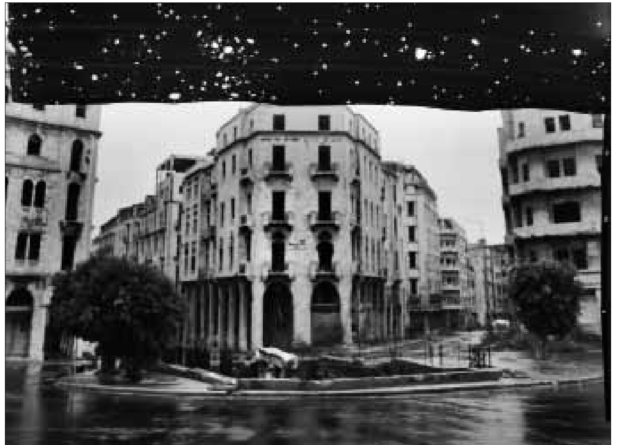
ساحة النجمة» (تفصيل، برومور على ورق) من كتاب «بيروت سيتي سنتر» (1991)

يتوقّف عن مساءلتها. انتهت الحرب، لكنها بقيت عالقة هنا، لم يشف منها أبداً. (سيستعيدنا خلال العدوان الإسرائيلي على لبنان في تموز 2006، في مشروع استثنائي بعنوان «عن الحرب والحب»). وهنا في الـ BAC، نقع على بصماتها في كل مكان، ليس فقط في العرض الكرونولوجي على الجدار الطويل، بل في كل ما التقطت عدسته عبر العالم. يحمل الحرب كالخطيئة الأصلية في زمن التحولات والانهيارات والقضايا الخاسرة، ويبحث عنها حتى في اللحظات الهاربة من الكاميرا. ذلك الحزن الذي يخيم على صور