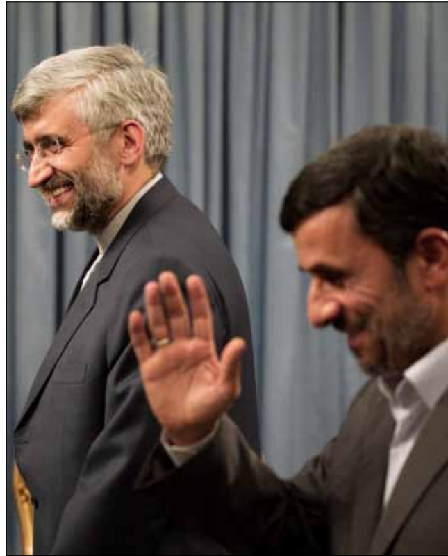
نجاد والمفاوض النووي الإيراني سعيد جليلي خلال اجتماع في طهران الأسبوع الماضي

سوداني «لا تؤكد المعلومات بشأن استئناف إيران استيراد الوقود»، قبل أن يضيف للتلفزيون الرسمي أن تصريحاته «أساءت وسائل الإعلام فهمها». وكان قد أعلن قبل يومين لوكالة «مهر» للأنباء أن إيران ستستورد الوقود مؤقتاً لتلبية حاجات الاستهلاك اليومي ولتعويض النوعية الرديئة للوقود الذي تنتجه. وقال إن «الوقود الذي يُنتج محلياً يفتقر إلى النوعية الجيدة بسبب