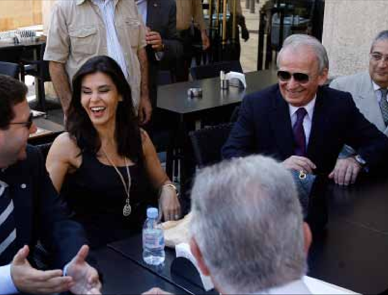
تأجلت الجلسة التشريعية فاجتمع نواب المعارضة في المطعم (مروان طحطح)

منذ تأليف الحكومة الجديدة كثر الحديث عن ورشة عمل حكومي وبرلماني، وعن التنسيق بين السلطتين التنفيذية والتشريعية. التنسيق حصل فعلاً أمس، بطريقة لم تخطر على بال أحد، فطارت جلستا مجلسي الوزراء والنواب بقرار واحد. والمعارضة كانت حاضرة لتطالب بإسقاط الحكومة