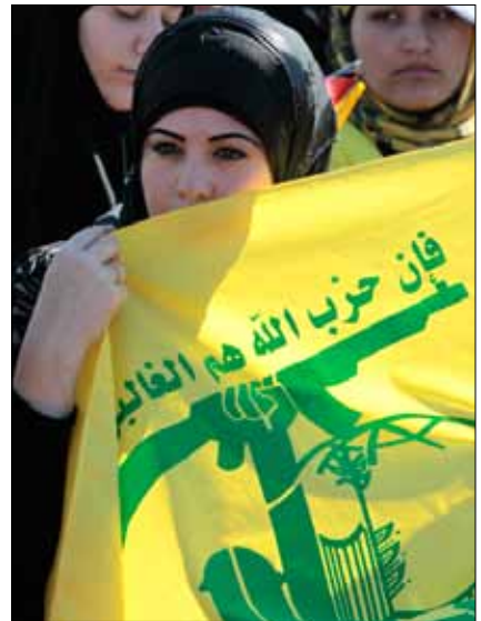
خلال مهرجان حزب الله الأخير في مارون الراس الأسبوع الماضي

لكن هذا ما لم يحصل في حولا مثلاً، عندما هاجم عناصر من الحزب محل الرجل الوحيد الذي يبيع الكحول في القرية، لإرغامه على الإقفال. سارع مسؤولون في الحزب عند سؤالهم، إلى إنكار علاقة حزبه بما حدث، وعلّقوا المسؤولية فوراً على شناعة «الأهالي». إشكال حولا ذلك، الذي أغفلت ذكره «الأخبار»، ذكرته جريدة «السير» بشيء من التورية الواضحة، فهي إذ ذكرت انتقال «مسلسل منع