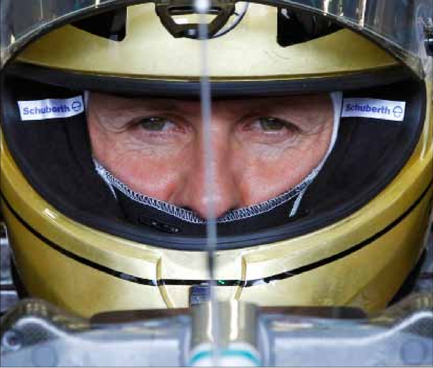
يرفض شوماخر اختتام مسيرته عبر ترك صورة سلبية تسقط الهالة التي رسمت حوله على أنه أفضل سائق في التاريخ

ردّ «الأسطورة» الألماني ميكائيل شوماخر على كل أولئك الذين دعوه إلى العودة إلى الاعتزال، وكل أولئك الذين نثروا التوقعات بشأن نهاية مسيرته في وقت قريب، متمسكاً ببقائه في الفورمولا 1 بحلوله خامساً في بلجيكا