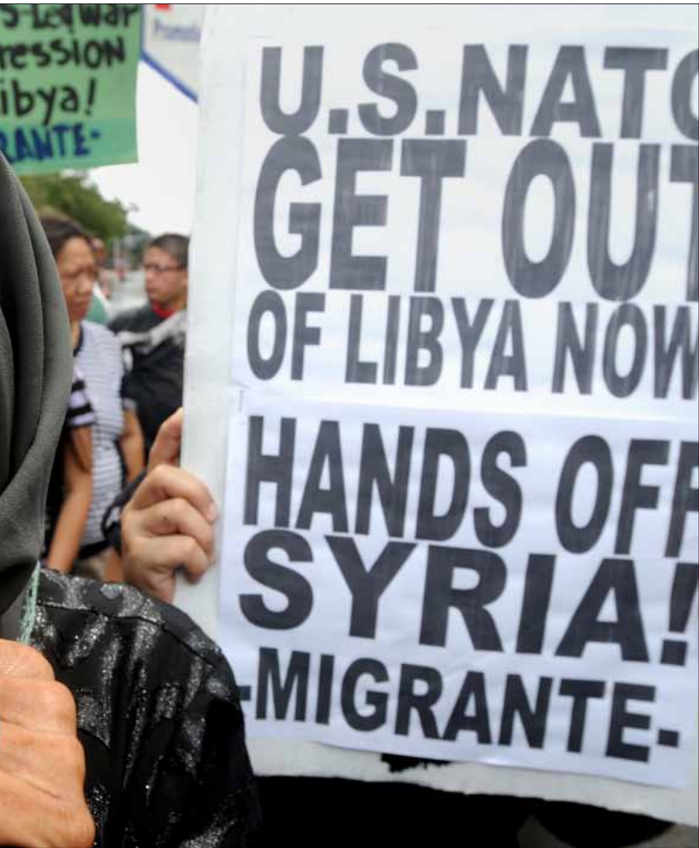
تظاهرة مناهضة لتدخل الناتو في ليبيا في مانيلا يوم امس

وقد أبدت صحيفة «تايمز» شكاً في شأن سيناريو المجلس الوطني الانتقالي في ضمّ أركان نظام القذافي إلى النظام الذي سوف يليه: «ذلك أمر ليس محفوفاً بالخطر فحسب، بل هو مثير للجدل أيضاً، في ظل وجود ثوار مقاتلين عازمين على التخلص من كل ما بقي من النظام». وكما أشارت صحيفة «وول ستريت جورنال» في تقريرها بشأن