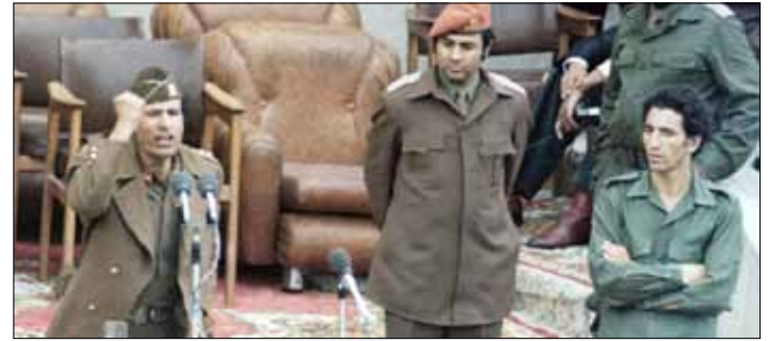
جلود إلى يمين القذافي في صورة من العام 1977

نسي العالم عبد السلام جلود كلياً، ولم يكن أحد يستطيع الجرم بما إذا كان الرجل لا يزال على قيد الحياة، أم أنه مات واندثر. والخبر الوحيد الذي تسرب عنه بعد 17 سنة من الاختفاء عن الأضواء كان في مطلع تشرين الأول الماضي، حين نشرت وكالة الأنباء الإيطالية معلومات تفيد بأن العقيد معمر القذافي يعمل على تسليم جلود موقع رئاسة الوزارة خلفاً للبغدادي المحمودي، وهو المنصب الذي شغله جلود في فترة تعد مهمة من تاريخ الحكم في ليبيا، أي ما بين 1972 و1977. وكان الرجل في ذلك الوقت واعداً وصاحب طروحات متقدمة على القائد معمر، الذي بدأ مسيرة مصادرة ثورة الفاتح والتخلص من رجالها الأساسيين. تعود بدايات ظهور جلود إلى الأيام الأولى لثورة الضباط الليبيين الأحرار، حينما رافق القذافي في زيارته إلى مصر وحضر لقاءاته مع الرئيس جمال عبد الناصر. ورغم أنه عسكري وكان برتبة رائد تظهره بعض الصور واقفاً باللباس المدني إلى يسار القذافي بالبدلة العسكرية، وهو يحاول أن ينضوي تحت كتف عبد الناصر