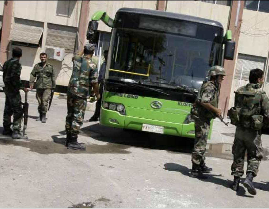
انتشار للجيش السوري أمام بلدية دوما في ريف دمشق أمس

لم يخرج عن لقاءات المبعوث الرئاسي الروسي إلى دمشق، سوى الموقف المعتاد بدعم الحليف السوري في معركته، مع تصعيد أوروبي جديد وكلام تركي نارياً أيضاً، بينما الشارع ظلّ مشتعلًا وسقط فيه عدد جديد من القتلى والجرحى والمعتقلين