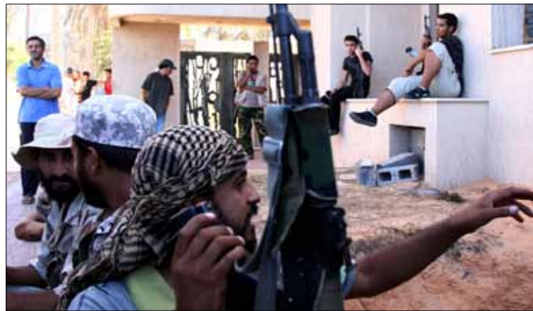
مقاتلون ليبيون في طرابلس أمس

وعن رؤيته لإخراج ليبيا اليوم، قال جلود في أحاديث صحافية بعد خروجه، القوى الوطنية الصادقة والجادة هي الأساس في هذه المرحلة، وهي التي ينبغي أن تشعر بمسؤوليتها، سلاحها الوحيد هو الإخلاص ونكران الذات. ثانياً المسألة ليست أن يتجه كل واحد إلى تأسيس حزب، فينظرون إلى ليبيا كأنها كعكة ناضجة للتقاسم بينهم، وكل واحد يريد أن يفوز بالنصيب الأكبر، إذا فكرنا بهذه الطريقة نكون قد خننا أرواح الشهداء ودماء الضحايا، وفشلنا. والشعب الليبي داس الخوف اليوم، ولن يستمع إلى هؤلاء.