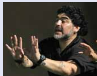
مارادونا خلال المباراة