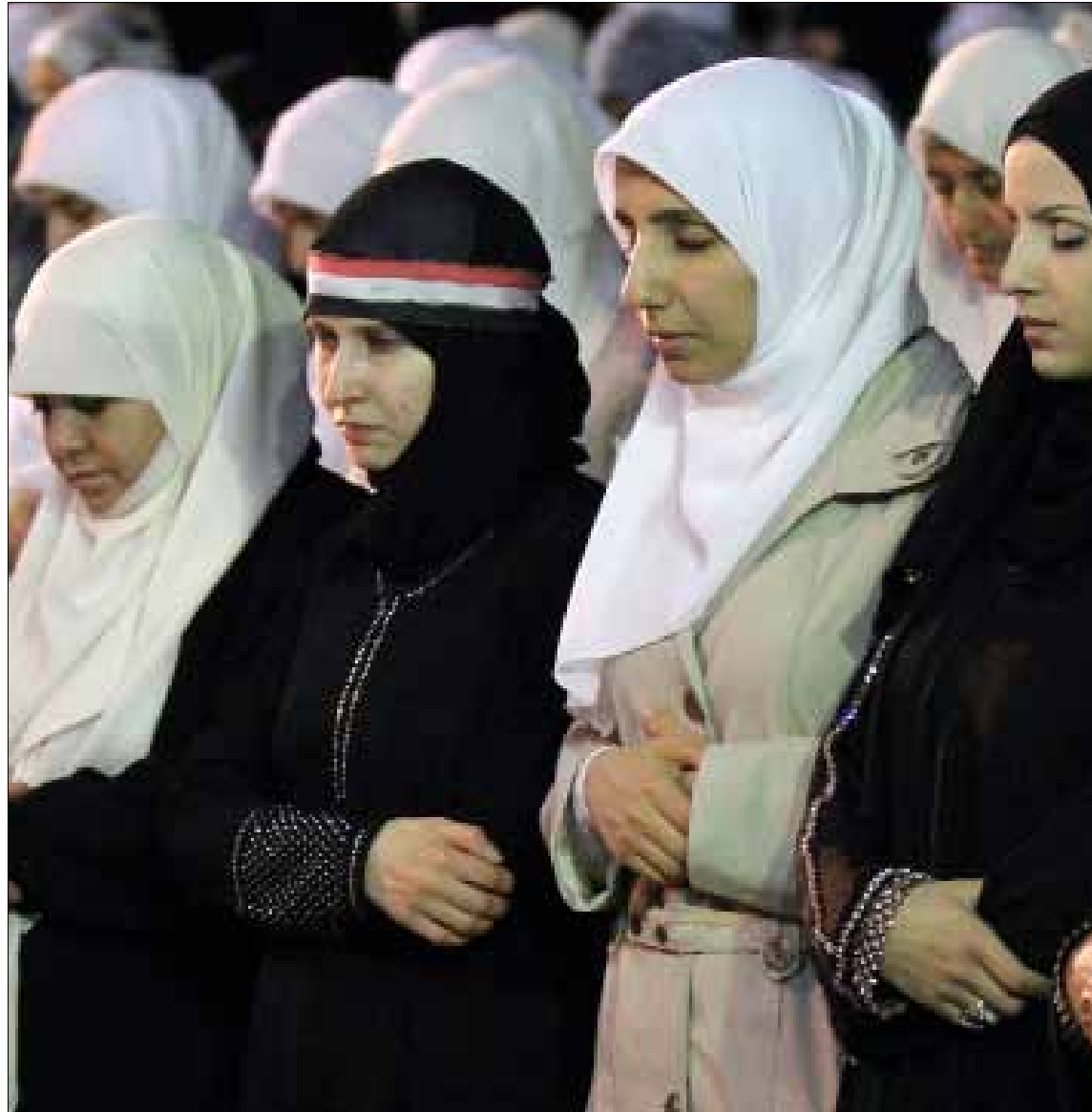
سوريات يصلين في مسجد بعمان قبل تظاهرة ضد النظام السوري الجمعة الماضي

وأشار التقرير إلى صلات القرابة القبلية والعائلية بين السوريين والأردنيين والدعم الذي تقدمه هذه العائلات والقبائل لأقارب في سوريا لمساعدتهم في انتفاضهم على النظام السوري. وحذر الأميركيون الملك من أن هذه المجموعات «بدأت بتنظيم نفسها لتمرد مسلح». وحذروه كذلك من جماعة الإخوان المسلمين، التي قالوا إنها «بدأت بالصعود في العالم العربي بعد اختطاف