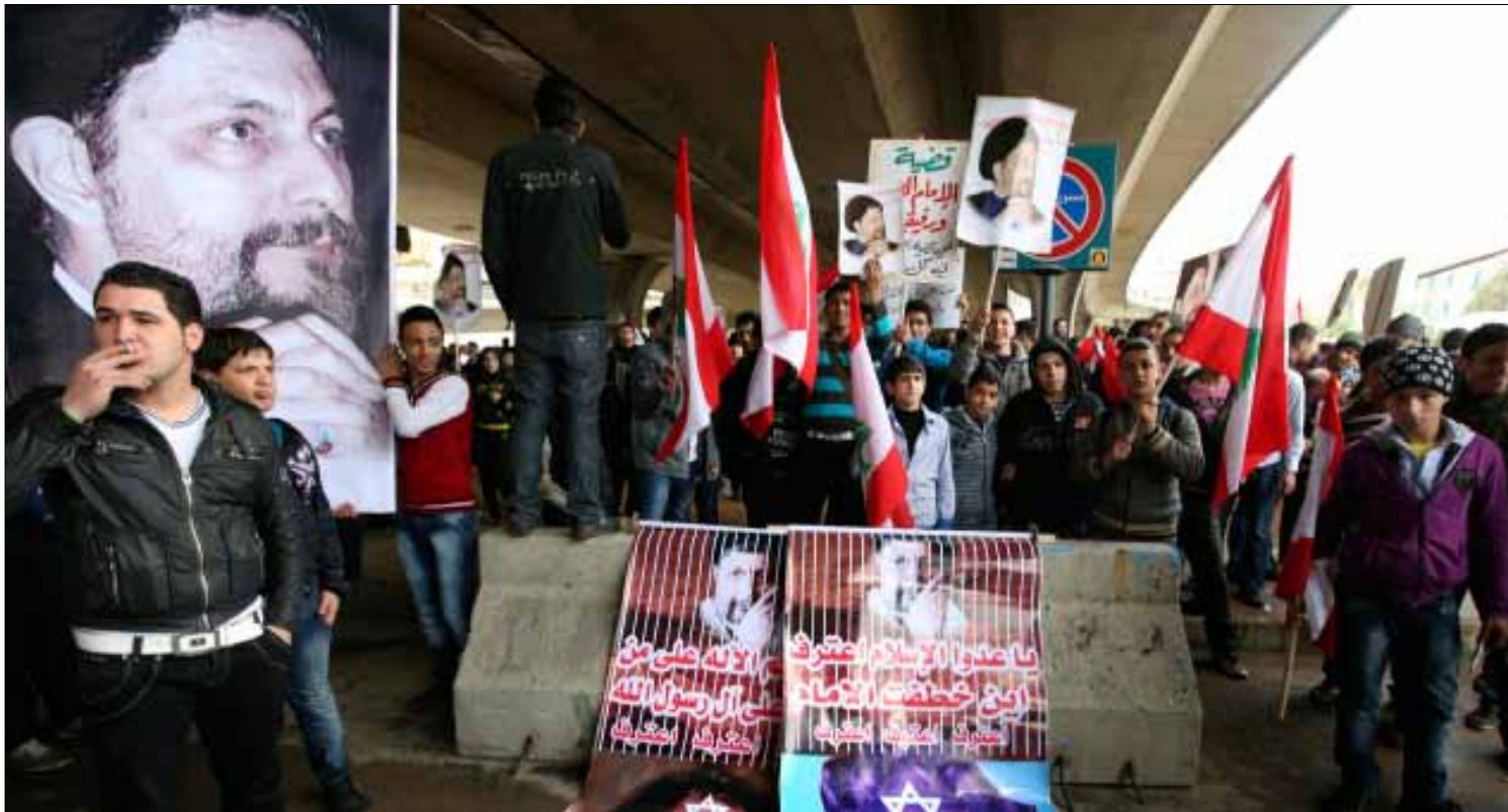
طلاب لبنانيون يتظاهرون ضد ليبيا في بيروت في شباط الماضي

نفي اللبنانيون في ليبيا وصول أي باخرة لنقلهم، واصفين وعود المساعدة بالكاذبة