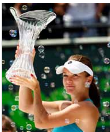
رادفانسكا حاملة كاس الدورة

الثاني عشر في الأولى، والعاشر في الثانية.