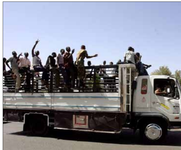
طلاب سودانيون في طريقهم إلى هجليج للمشاركة في القتال إلى جانب القوات السودانية

جددت حكومة جنوب السودان رفضها الانسحاب من هجليج، معتبرة أنها جزء لا يتجزأ من الدولة الوليدة، فيما أكدت السلطات السودانية أن تكلفة الدخول في صراع شامل مع جنوب السودان لن تمنعها من استعادة المنطقة