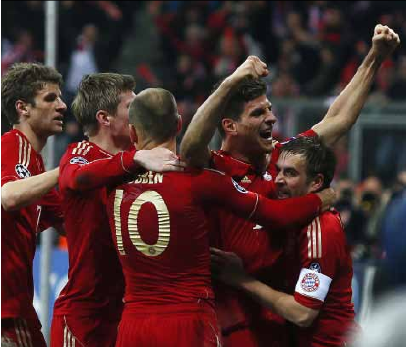
فرحة بافاريا بهدف غوميز القاتل

استمرت لعنة ملعب «أليانز أرينا» على ريال مدريد حيث لقي خسارة جديدة أمام أصحاب الأرض بايرن ميونيخ 1-2، في ذهاب نصف نهائي دوري أبطال أوروبا. مباراة سيطر عليها البافاري طويلاً وعرضاً مقابل ضياع ملكي قل نظيره