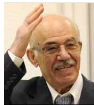
رئيس هيئة التنسيق الوطني السورية المعارضة حسن عبد العظيم في موسكو

في هذا الوقت، قال المتحدث باسم الأمم المتحدة خالد المصري إن مراقبي الأمم المتحدة في سوريا زاروا امس مدينة درعا واجتمعوا مع المحافظ وتناولوا في المدينة. وأضاف أن مجموعة أخرى من مسؤولي الأمم المتحدة اجروا محادثات في دمشق مع مسؤولين بالحكومة. ووصف رئيس فريق المراقبين الدوليين الموجود في سوريا، الكولونيل المغربي احمد حميش، في تصريح مقتضب للصحافيين مهمة البعثة بأنها «صعبة». في الدوحة، أكد رئيس الوزراء القطري الشيخ حمد بن جاسم آل ثان أن اجتماع اللجنة الوزارية العربية المعنية بسوريا لم يلمس أي «تغيير جوهري» في تعاطي دمشق مع الأزمة، فيما دعت اللجنة المعارضة السورية إلى اجتماع تحت