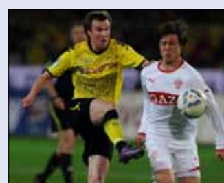
غوتوكو ساكاي