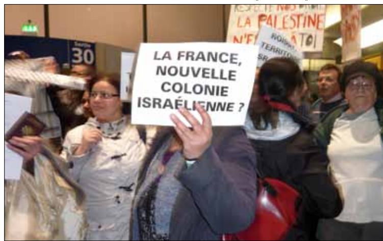
مؤيدون لفلسطين في مطار رواسي بعد منعهم من السفر إلى إسرائيل

منم النشاط جاء على أساس «قوائم سوداء» أعدها جهاز «شين بيت»