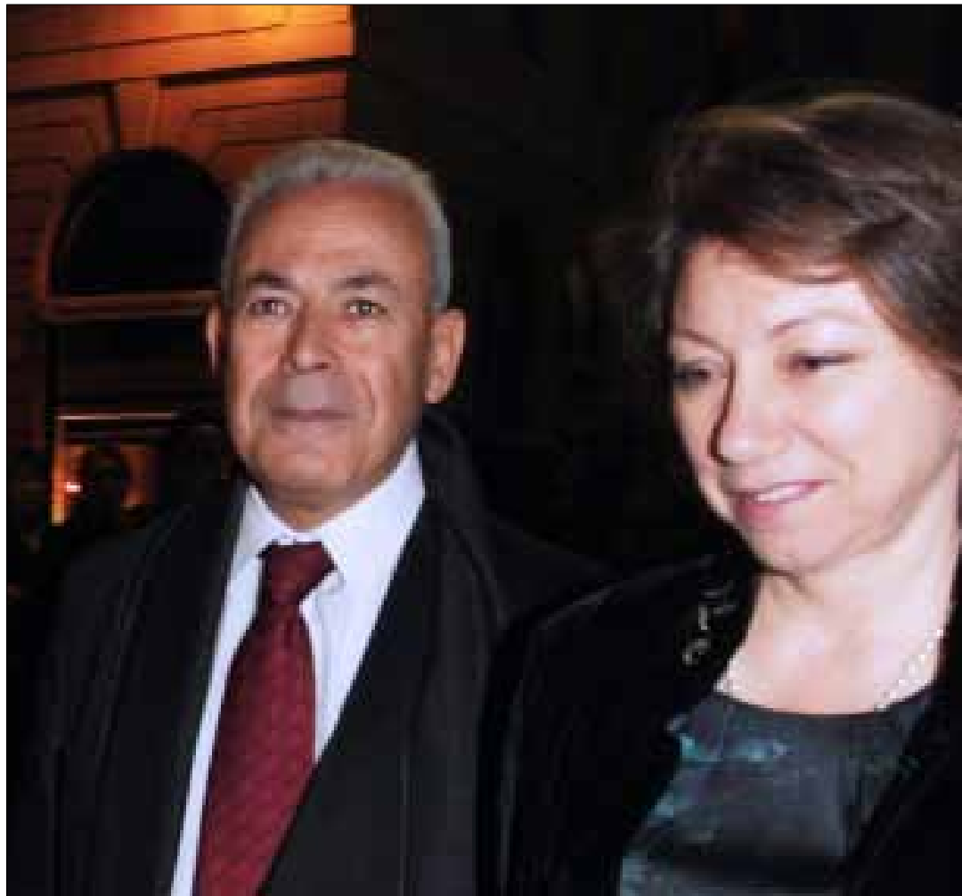
قضمانى وغليون (أرشيف)

مرغيلوف يجيد اللغة العربية بطلاقة، وهو امضى جزءاً كبيراً من طفولته في المغرب وتونس. لديه صلات جيدة بالرئيس ميدفيديف، ولديه اهتمام قوي بالمصالح التجارية لبلاده في سوريا. يُقال إن