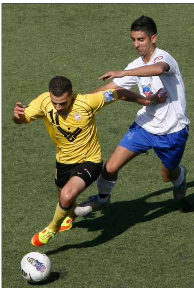
المبرزة استسلم بعد مواسم ممتازة وانضم إلى المظالم