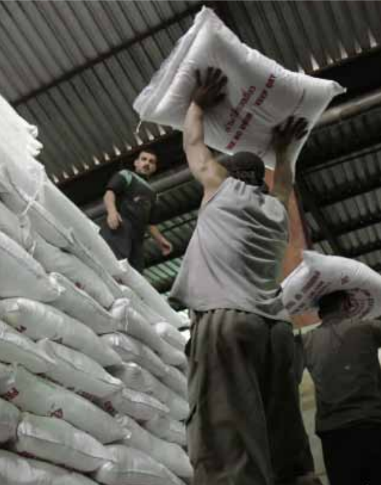
يجب التمييز بين المستهلك وأصحاب المصالح

بتحقيق الجزء الثاني. وكذلك نفذ تجار المحروقات إضرابهم قبل أسبوعين أيضاً، وعلقوا استكمال تحركاتهم استجابة لمطالب السياسيين، بعدما حصل جزء منهم (أصحاب الصهاريج) على زيادة الجعالة. أما السائقون العموميون، فقد علقوا إضرابهم الذي كان مقرراً غداً بعدما طلب رئيس الحكومة نجيب ميقاتي منهم أمس مهلة 48 ساعة لإعطائهم أجوبة نهائية في شأن مطالبهم، علماً بأن الاتصالات الجارية تنبئ ب«إيجابية ما»، بحسب ما يقول أحد رؤساء اتحادات النقل البري. وينفذ صانعو الرغيف، أي أصحاب المطاحن والأفران إضرابهم بعد غد، رغم أن وزير الاقتصاد نقولا نحاس