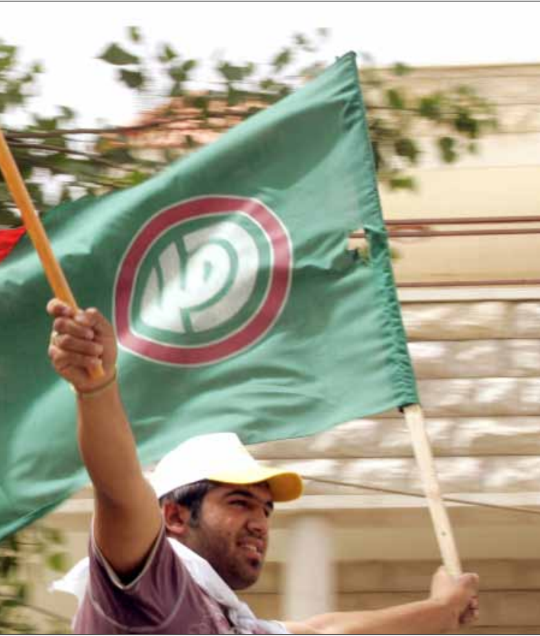
على نية الانتخابات، تعمر السهرات في البيوت حتى وقت متأخر

حتى مساء أمس، كان الهدوء لا يزال مسيطراً على مراكز تقديم الترشيحات إلى الانتخابات الفرعية البلدية والاختيارية في المحافظات والقائمقاميات. الملامح الأولى للإستحقاق، الذي حددت موعده وزارة الداخلية والبلديات على غفلة، في السادس من أيار المقبل، تشير إلى أن العائلات تريد استعادة نفوذها الذي «سحبته» السياسة