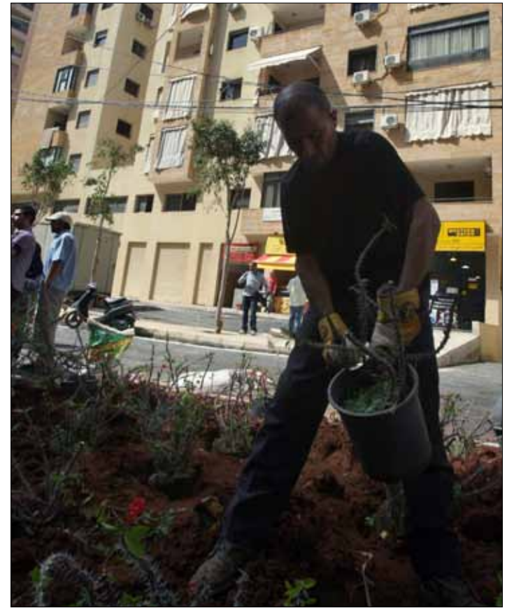
احتفال الأهالي بتدشين شارع الشورى في حارة حريك (هيثم الموسوي)

اختفت البوابة السوداء. لم يعد هناك من حراس لشارع الشورى في حارة حريك. لسنين طوال، ظلت وجوه الحراس، الذين تناوبوا على الوقوف أمام البوابة، مألوفة. أمس، تغيرت المباني، تغير كل شيء إلا الناس