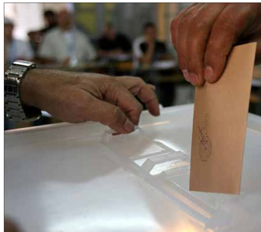
اتصالات لتحقيق إجماع مسيحي على المشروع قبل التوجه به إلى الحلفاء المسلمين

القانون يترجم الكلام عن المناصفة ويأخذ في الاعتبار العيش المشترك بحسب الطائف