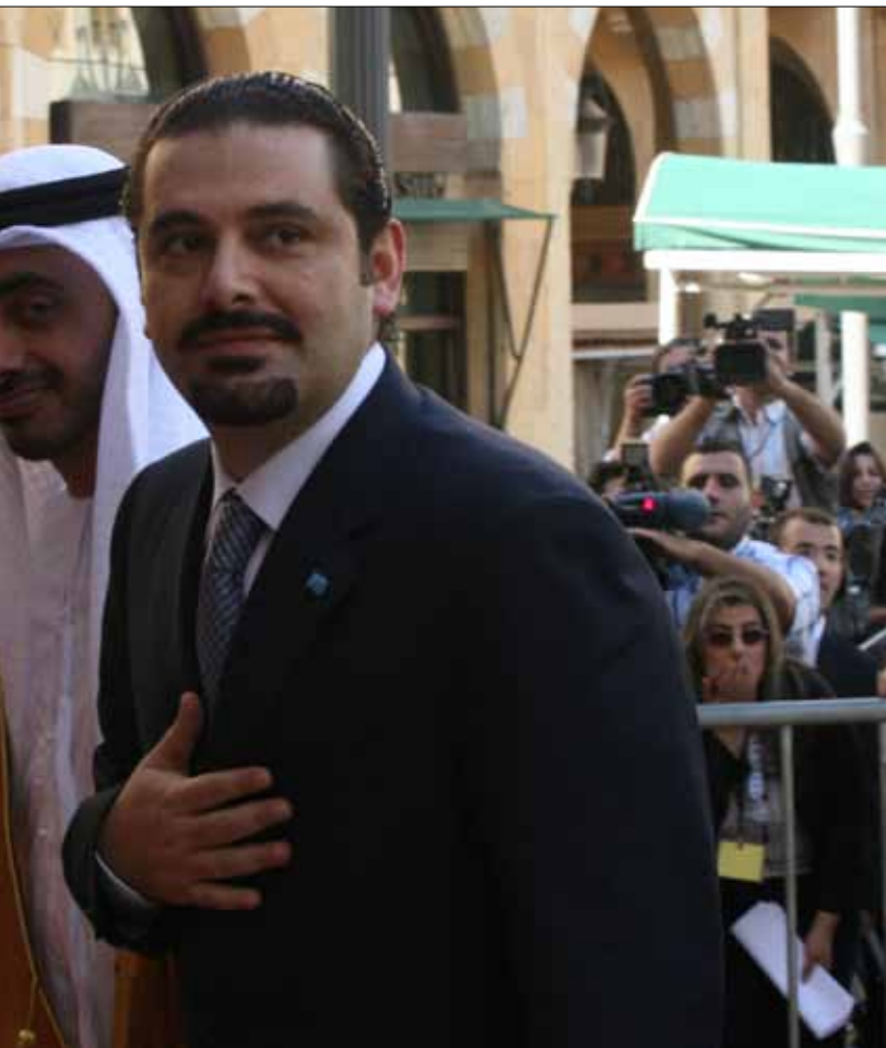
نسي الحريري أن القانون الانتخابي لن يقر إلا بموافقة الخصوم

إلى أن «إمكانيات خرق قوى 14 آذار داخل الطائفة الشيعية ستقل بنحو 5 أضعاف عن عدد الفائزين من نواب 8 آذار السنة»، أما المستشارون فيقدمون هذه الدراسات على الشكل الآتي: «خسارة تيار المستقبل لنحو 30 في المئة من النواب السنة ستجعل تمثيل الحريري منتقماً خلال مشاركته