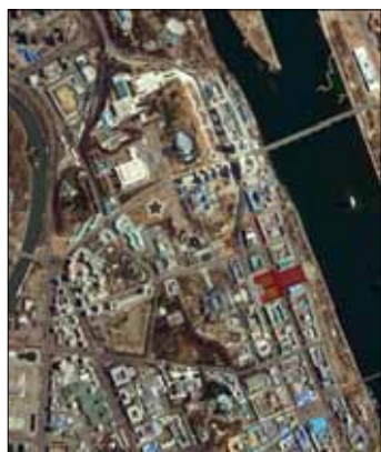
صورة اميركية جوية لبيونغ يانغ

ورداً على سؤال عن احتمال توجيه ضربات عسكرية لمواقع تجارب نووية أو قواعد إطلاق صواريخ في كوريا الشمالية، قال «ندرس كل الخيارات».