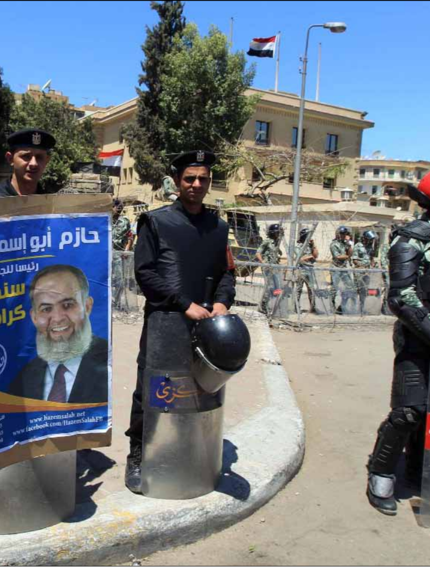
انصار ابو اسماعيل خلال اعتصامهم امام مقر اللجنة أمس

رسا السباق الانتخابي في مصر على 13 مرشحاً، بعد قرار اللجنة العليا للانتخابات رفض تطلعات المرشحين الذين سبق أن استبعدتهم، في مقدمتهم خيرت الشاطر وحازم أبو إسماعيل وعمر سليمان، معززة بذلك حظوظ موسى وأبو الفتوح وصباحي