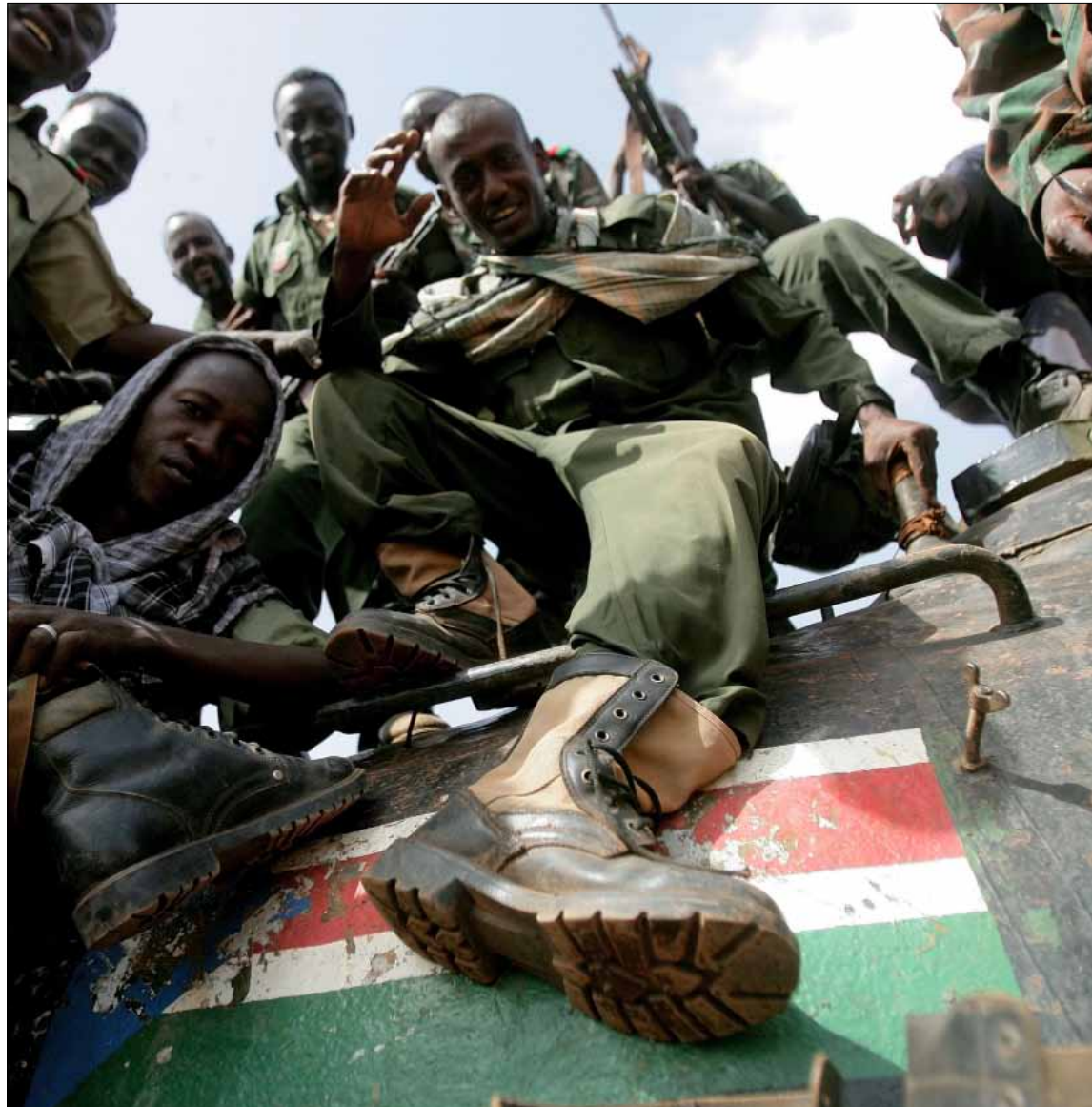
جنود سودانيون يعتلون دبابه مصارده للجيش الجنوبي في هجليج اول من امس

كير يتهم النظام السوداني بإعلان الحرب... وتحذيرات جنوبية من العودة لهجليج