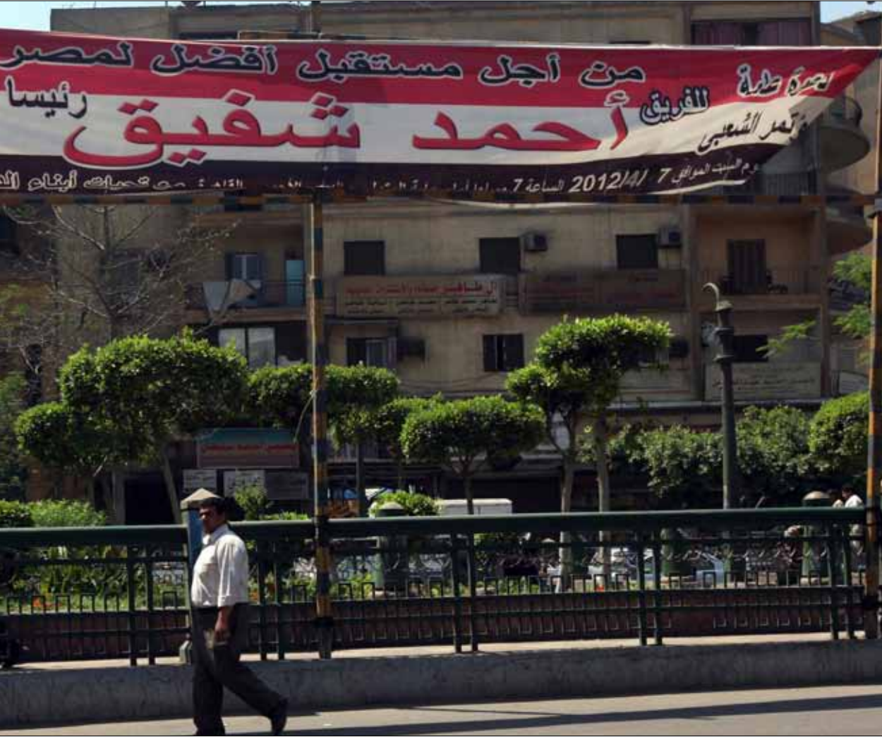
قرار استبعاد شفيق جاء بعد ساعتين فقط من تسلمه رمزه الانتخابي «السلم»

فئة الإسلاميين تضم مرشح جماعة الإخوان المسلمين محمد مرسي، إلى جانب مرشح حزب الوسط محمد سليم العوا. أما المرشحون المدعومون من القوى الثورية فيأتي على رأسهم عبد المنعم أبو الفتوح، رغم أنه يحظى في الوقت نفسه بتأييد من الإسلاميين بحكم كونه أحد أبرز نواب مرشد جماعة