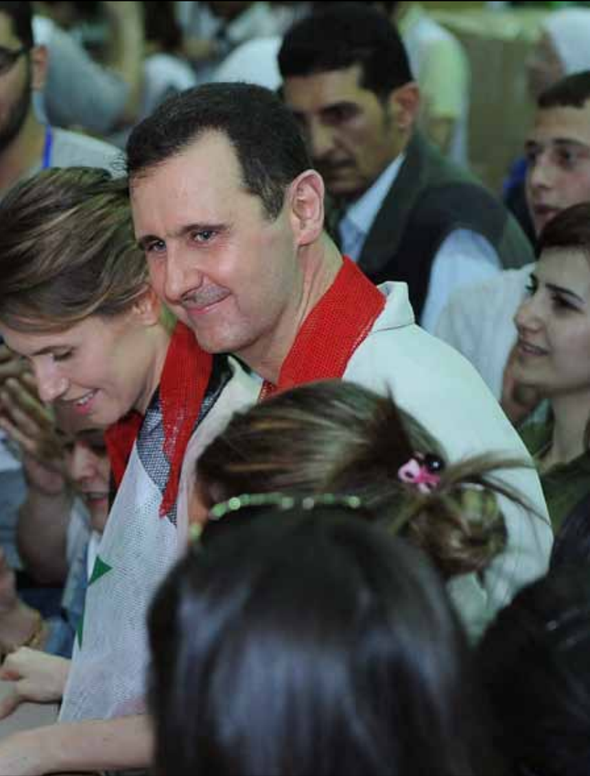
الرئيس بشار الأسد في مجمع الفيحاء في دمشق الأسبوع الماضي

بالتزامن مع زيارة وفد هيئة التنسيق الوطنية المعارضة لموسكو، التقى الرئيس السوري بشار الأسد بعيداً عن الأضواء أحد رموز معارضة الداخل السورية. «الأخبار» تكشف عن بعض ما دار في اللقاءين