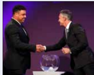
لينيكير مصافحاً رونالدو