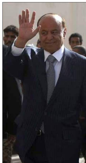
الرئيس اليمني

بحث مدير مكتب التحقيقات الفدرالي الأميركي «أف بي آي»، روبرت مولر، أمس في اليمن مكافحة تنظيم «القاعدة»، فيما أنهى الأخ غير الشقيق للرئيس السابق، أحمد صالح الأحمر تمرده