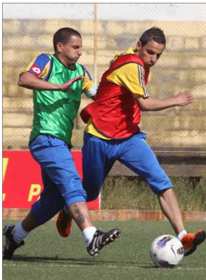
لاعبو الصفاء يسعون إلى الفوز رغم ضغط المباريات

تصدر غدار ترتيب الهادفين بسبعة أهداف، ورفع رصيده إلى 24 هدفاً