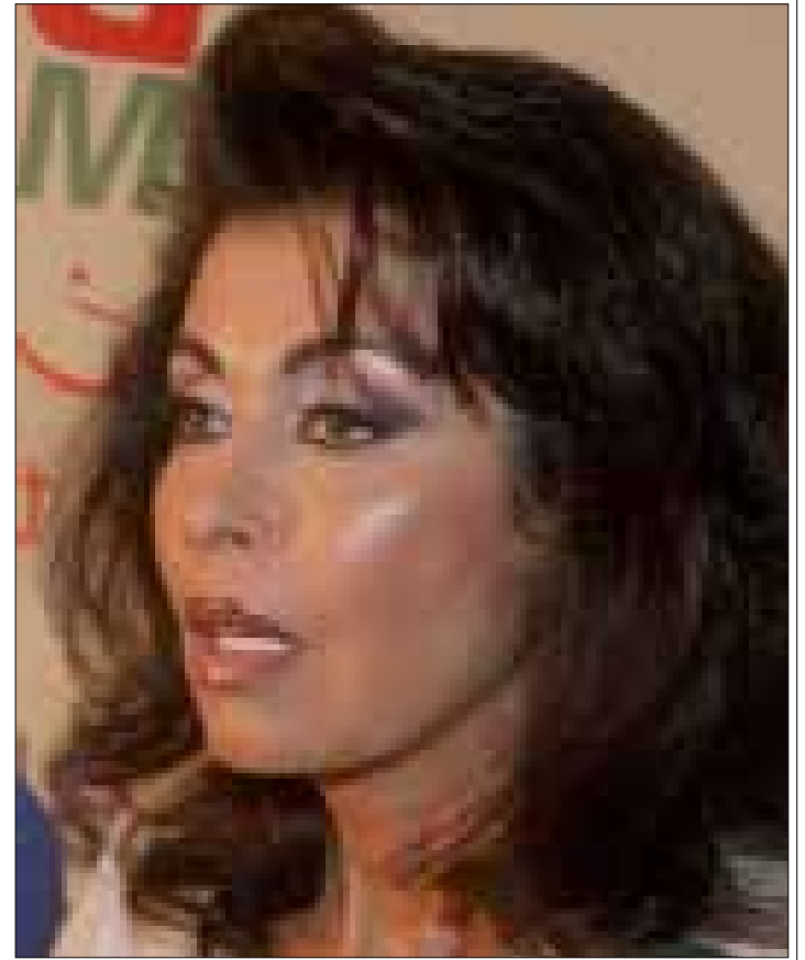
لم تر الجمعية نفسها مضطرة إلى الاعتذار (أرشيف)