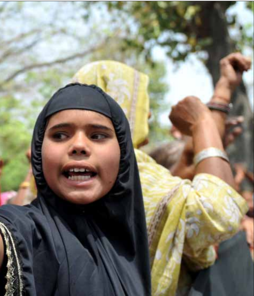
ضحايا وأقارب كارثة بوبال تظاهروا في الهند احتجاجاً على السماح لشركة داو كيميكال برعاية الأولمبياد (سج)

التفجيرات الانتحارية التي وقعت عام 2005، اليوم الذي تلا إعلان فوز لندن بالألعاب الأولمبية. هل «سيتسوق» الشبان مجدداً هذا الصيف؟ كما شرح أحد السارقين عندما سُئِلَ عن سبب اكتفائه بسرقة كيس ثلج فقط من متجر