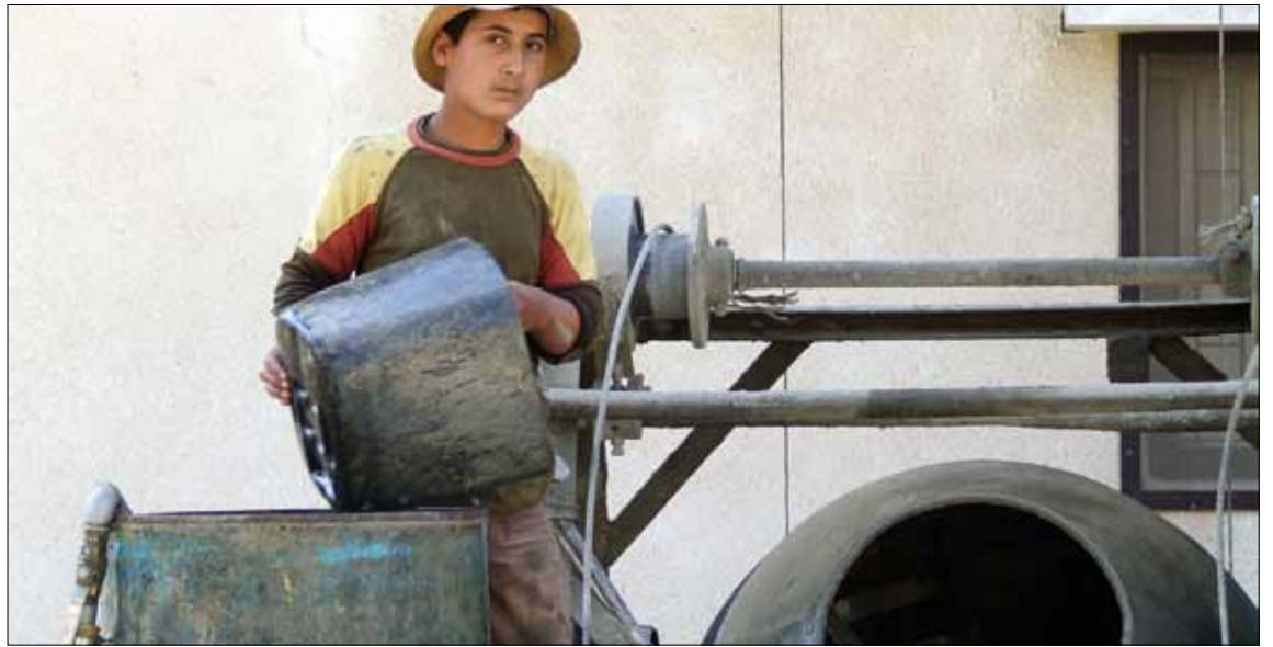
تعرّض بلديات المنطقة لضغوط من الأهالي للسماح بالبناء (الأخبار)