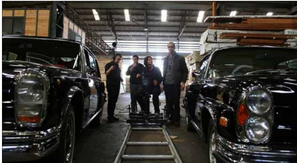
من شريط «مارسيدس»

إذا كان صاحب «لأجنون مدى الحياة» قد اختار سيارات المارسيدس لقراءة تاريخنا، فإنّ وسام شرف ذهب إلى الكليب والصورة والأغنية التي أنتجت بين عامي 1989 و2011. شريطان مهمّان تعرّضهما «متروبوليس أمير صوفيل» ضمن مهرجانها المخصص للسينما اللبنانية