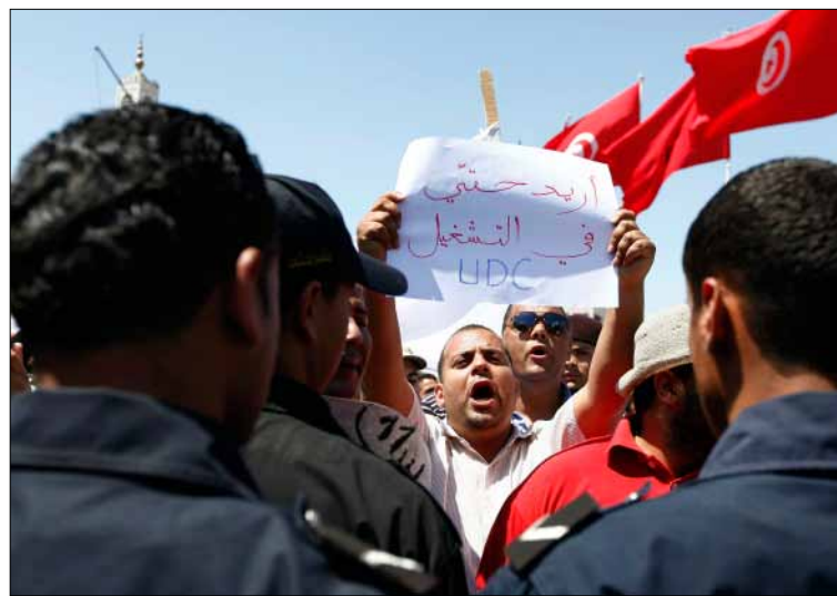
من تظاهرات تونس الأسبوع الماضي

من الوصول إلى «نقطة اللاعودة» في مواجهة مع التيار السلفي. «نقطة اللاعودة» عبر عنها وزير الداخلية التونسي علي العريض، في حوار مع صحيفة «لوموند الفرنسية» الشهر الماضي، حيث قال إن «الصدام مع السلفية الجهادية يبدو محتوماً»، في إشارة إلى