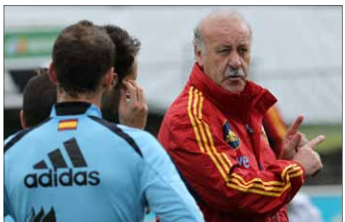
دل بوسكي في حصة تدريبية لإسبانيا

على عكس ما كان متوقفاً، استبعد فيسنتي دل بوسكي، مدرب منتخب إسبانيا، روبرتو سولدادو من تشكيلته الرسمية التي ستتدافع عن لقبها في نهائيات كأس أوروبا المقررة في أوكرانيا وبولونيا. وفاجأ دل بوسكي الجميع بعدم استدعائه سولدادو، حيث فضل عليه مهاجم إشبيلية الفارو نيجريديو، فيما ضم المدافع الأيمن لأتلتيكو مدريد خوان فران الذي استفاد من إصابة مدافع أتلتيك بلباو أندوني إيراولا.