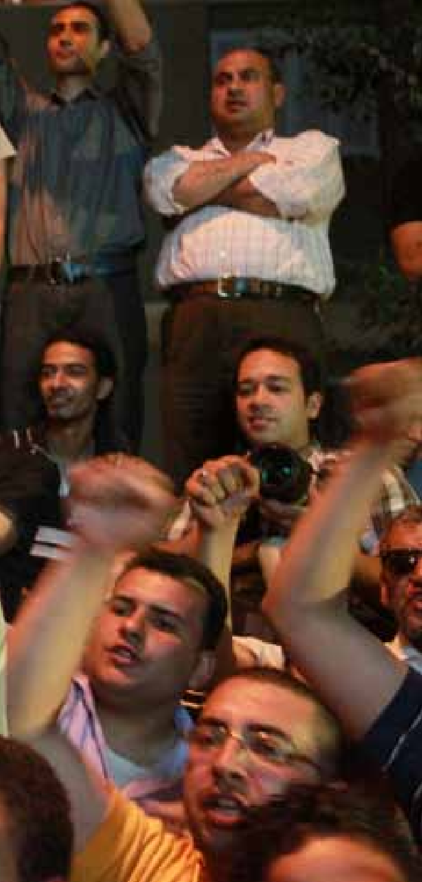
انصار صباحي خارج مقر الحملة الانتخابية للمرشح الناصري اول من امس

اللغة السلطوية المفرطة في الحديث عن نهاية الميدان بعد الوصول إلى البرلمان، وغيره التيارات الأخرى. من النجاحات الإخوانية، وكلها لغات السلطة وتبدياتها التي قامت بدورها في الهجوم على الثوار ونزع الغطاء السياسي عن المتظاهرين وتميرير القتل باسم حماية مؤسسات الدولة. لم تنس الكتلة الثالثة تحولات الإخوان وتغيير لسانهم عندما اقتربوا من مقاعدهم وجلسوا بالقرب من الجنرالات وأرسلوا تحيات إلى المجلس العسكري، بينما كانت ميليشياته تقتل في الشوارع. تصويت هذه الكتلة ضد الإخوان والفلول معاً، ضد نصفي الدولة القديمة كما اختارت الجماعة عندما تسلت من الميدان لتبحث عن مكانها في إعادة ترميم السلطة القديمة. مرسي ليس شفيق، لكنه يمكن أن يكون وباسم الله هذه المرة. مرسي ليس شفيق، لكنه ليس مرشح الثورة. مرسي أم شفيق؟ هذا هو مازق الكتلة الثالثة. حيرة، لكنها إيجابية. رغم كل شيء، وبعيداً عن النتائج. حيرة تدفع إلى الأمام.