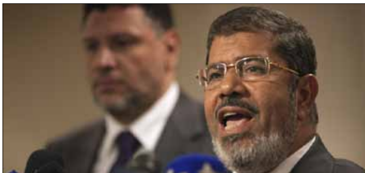
مرسي بعد الاعلان عن انتقاله للدورة الثانية من الانتخابات الرئاسية اول من امس (ا ف ب)

معها على أنها قطع يدخل صفقات مع العصاة أو الجماعة. هذه كتلة اختارت المرشح المسلم لا الإسلامي. راهنت على دولة لا تعامل أحداً بالتمييز الطائفي ولا بالتمييز الاجتماعي. كتلة ترفض