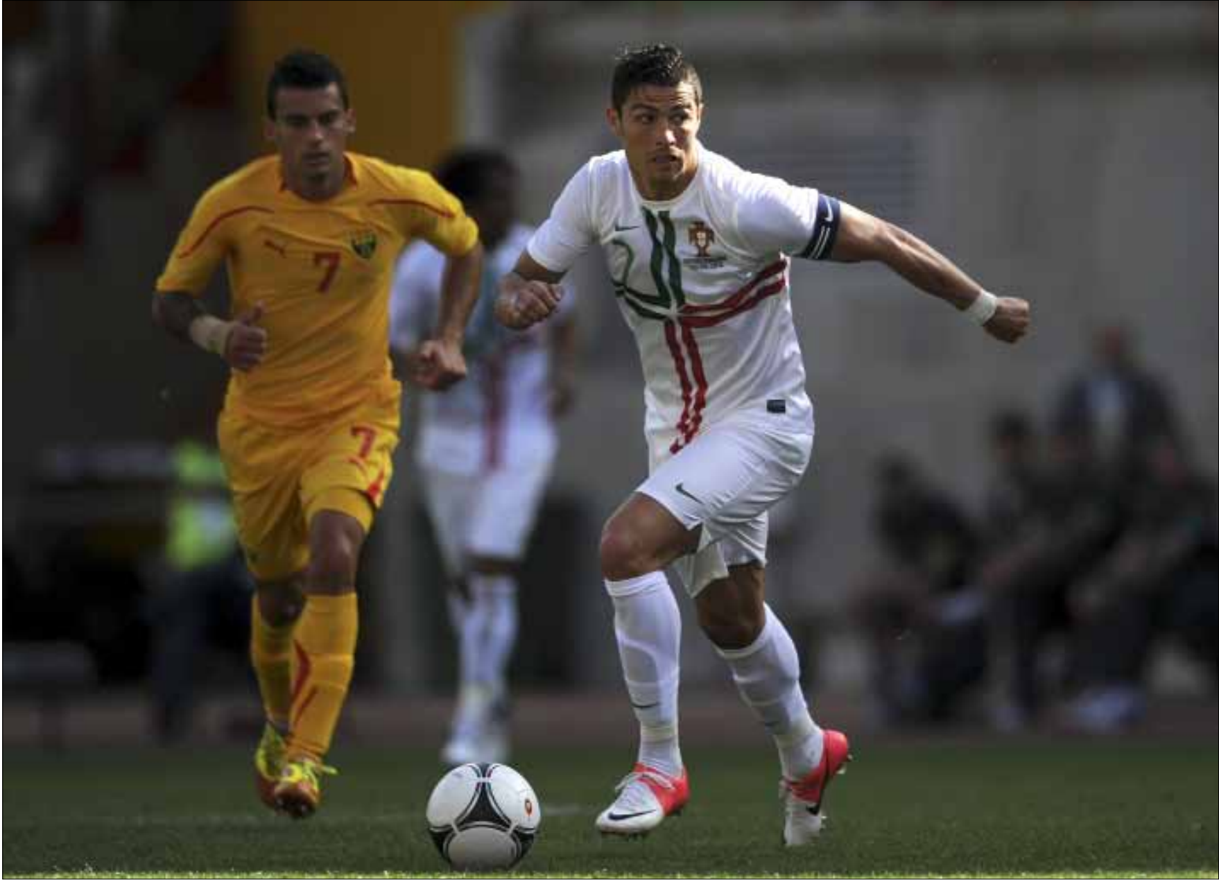
رونالدو في المباراة الودية الأخيرة للبرتغال أمام مقدونيا