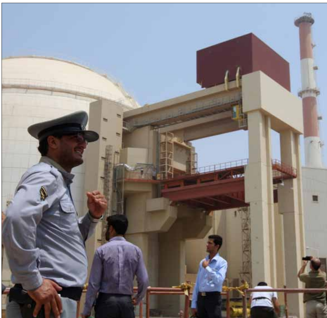
موقع بوشهر النووي جنوب إيران

من جهته، دعا الأمين العام للأمم المتحدة بان كي مون، إيران إلى «بناء الثقة» مع المجتمع الدولي لإقناعه بأن برنامجها النووي سلمي، ورحب بالإعلان عن جولة مفاوضات جديدة في موسكو الشهر المقبل. وقال مارتن تيسيركي المتحدث باسم بان، إن الأخير «يدعم بقوة» الجهود التي تبذلها بريطانيا والصين وفرنسا وألمانيا وروسيا