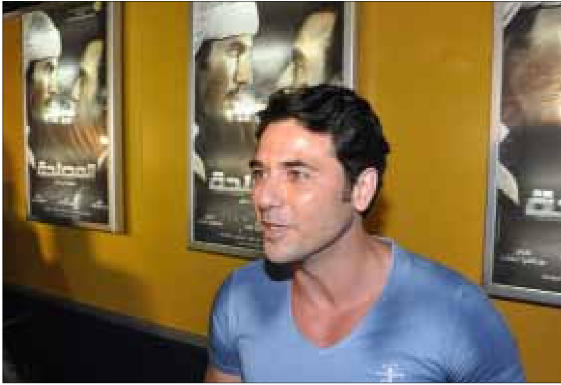
أحمد عز خلال اطلاق الفيلم قبل اسبوعين

وبينما أعلن عواد الجبالي النائب في مجلس الشورى عن جنوب سيناء «أننا سننتفك كجنوب سيناء شمالاً وجنوباً على اتخاذ موقف تجاه التنازل الدرامي للمنطقة»، يتوقع أن تشهد القضية منحى تصاعدياً في الأيام المقبلة... فهل يؤدي ذلك إلى سحب «المصلحة» من الصالات المصرية؟