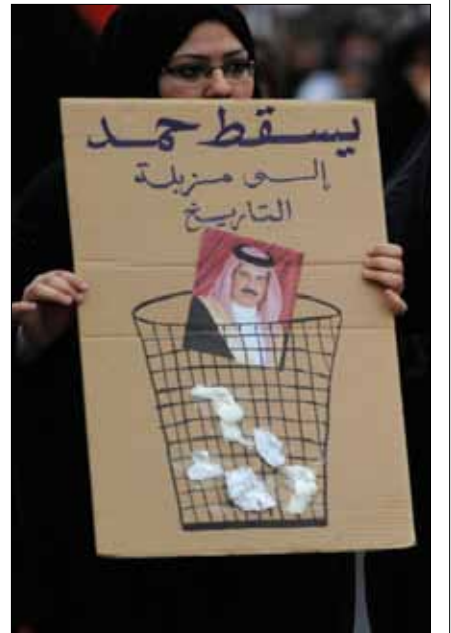
متظاهرة بحرينية مناهضة لمشروع الوحدة الخليجية

يقول مارك أوين جونز، مقيم سابق في البحرين وباحث دكتوراه، بأن «سيطرة الحكومة على الأماكن العامة - التي تدل على سلطة الأسرة الحاكمة الذكورية. كانت جزءاً من استراتيجية أساسية للنوليبيرالية، إذ إنّها في المساحات العامة يتم خلق صورة ايجابية لمكان جدير بالاستثمار».