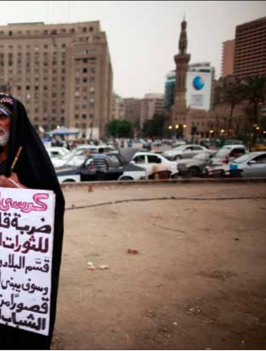
مسن مصري يرفع لافتة تنتقد السباق على كرسي الرئاسة في ميدان التحرير أول من أمس

لم تكذ النتائج الأولية للدورة الأولى من الانتخابات الرئاسية المصرية تظهر، حتى سارع المرشحان المنتقلان إلى الدورة الثانية: محمد مرسي وأحمد شفيق، إلى محاولة استقطاب مؤيدي كل من حمدين صباحي وعبد المنعم أبو الفتوح بعد حلولهما في المركزين الثالث والرابع