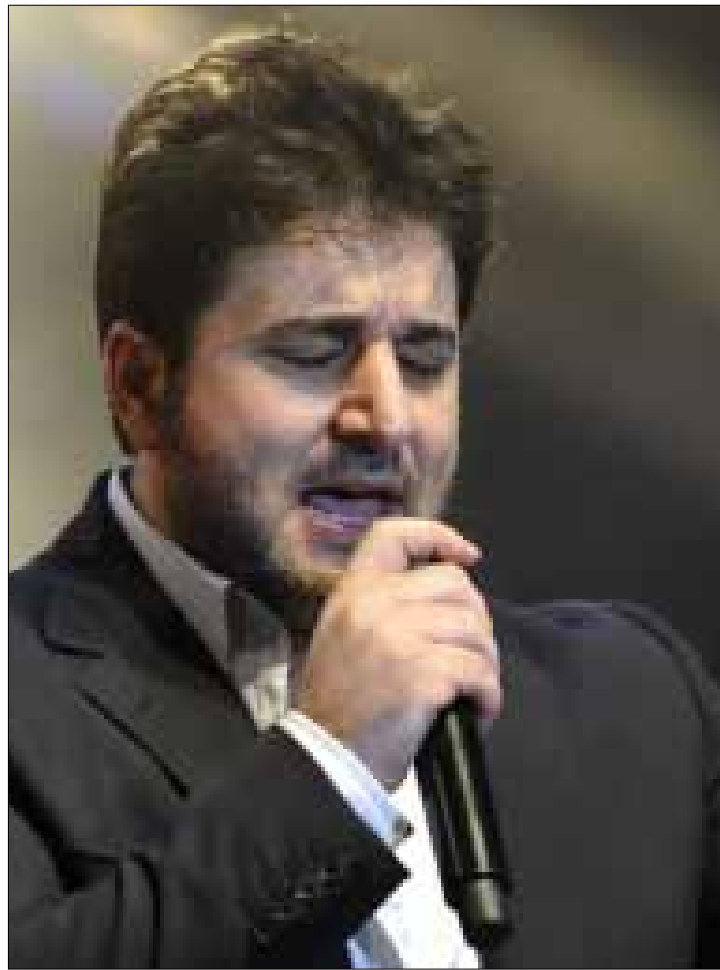
ملحم زين خلال حفلته في «موازين»

مفاجآت «مهرجان موازين» في الرباط استمرت حتى ليلته الأخيرة مساء السبت الماضي، عندما أخذ ملحم زين على عاتقه الرد على أصالة نصري والدفاع عن لبنان، رافضاً أن يتناوله أي كان بطريقة «غير لائقة»، ومعرباً أيضاً عن أسفه لمنعه من دخول قطر بسبب موافقه السياسية المؤيدة للنظام السوري. كل ذلك جاء خلال المؤتمر الصحافي الذي أقامه نجم «سوبر ستار» على هامش المهرجان. في هذا اللقاء، حكى الفنان اللبناني عن مسألة تطرق فضل شاكور وأصالة نصري إلى مواضيع سياسية في حفلاتهما، وسأل «ألبيس هناك من منابر سياسية للكلام في السياسة إلا «مهرجان موازين»؟»، واصفاً هذا التصرف بأنه يجرح «الدولة المغربية ونظامها». وهذا ما حصل بالفعل حين أعلنت إدارة «موازين» أنها تتبرأ من مواقف الفنانين السياسية (راجع المقال أدناه). مع ذلك، استغل ملحم زين المؤتمر الصحافي، ليبدأ الصاع صاعين لأصالة، التي كانت قد صرّحت بأن «تفتها بلبنان مهزوزة»، كاشفة أنها لن تغني في هذا البلد مجدداً، ولمحة إلى تورط أجهزة الأمن اللبنانية في اختطاف معارضين سوريين. ورغم أن زين حاول التهرب من التصريحات السياسية خلال إجاباته