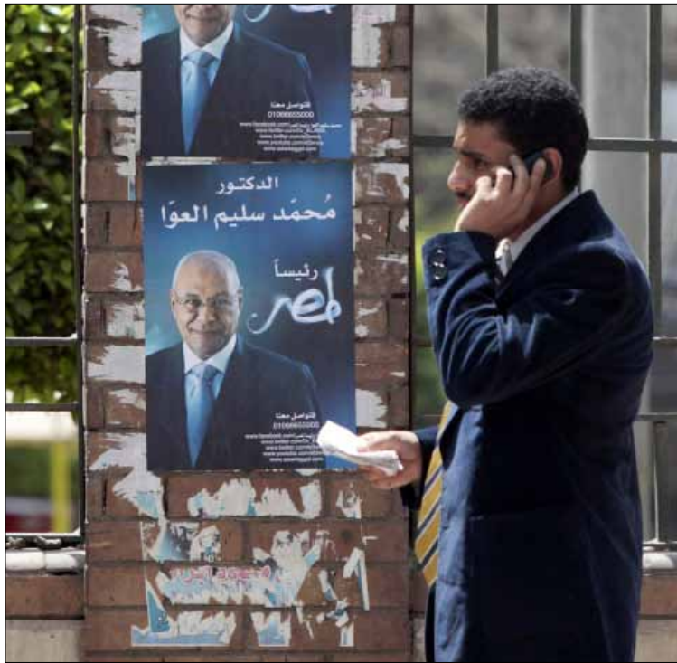
يسير بجوار ملصق للعوا في القاهرة

فشل المرشح الرئاسي سليم العوا في نيل دعم الإسلاميين بالرغم من علاقته الوطيدة بمعظم تيارات الحركة، إلى جانب ريبة الثوار من مواقفه بما يقلل من حظوظه في الوصول إلى قصر العروبة