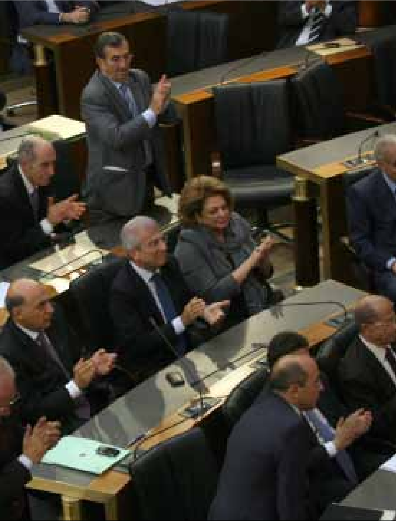
رواتب الرؤساء والنواب تستمر حتى بعد انتهاء ولايتهم وحتى بعد وفاتهم (هيثم الموسوي)

المسؤولون عن غلاء المعيشة وسوء «العيشة». فلنكتشف ماذا يدفع اللبنانيون للمسؤولين، لكي يقوم هؤلاء بـ«تسويد» عيشتهم. تشير جداول وزارة المال الى أن رئيس الجمهورية يتقاضى 18 مليوناً و750 ألف ليرة شهرياً، أي 225 مليون ليرة سنوياً. ويتقاضى كل من رئيس مجلس النواب ورئيس مجلس الوزراء 17 مليوناً و737 ألف ليرة شهرياً، أي 212 مليوناً و844 ألف ليرة سنوياً. أما الوزير فراتبه الشهري 12 مليوناً و937 ألف ليرة، أو ما يعادل 155 مليوناً و244 ألف ليرة سنوياً، فيما يتقاضى النائب 12 مليوناً و750 ألف ليرة شهرياً أي 153 مليون ليرة