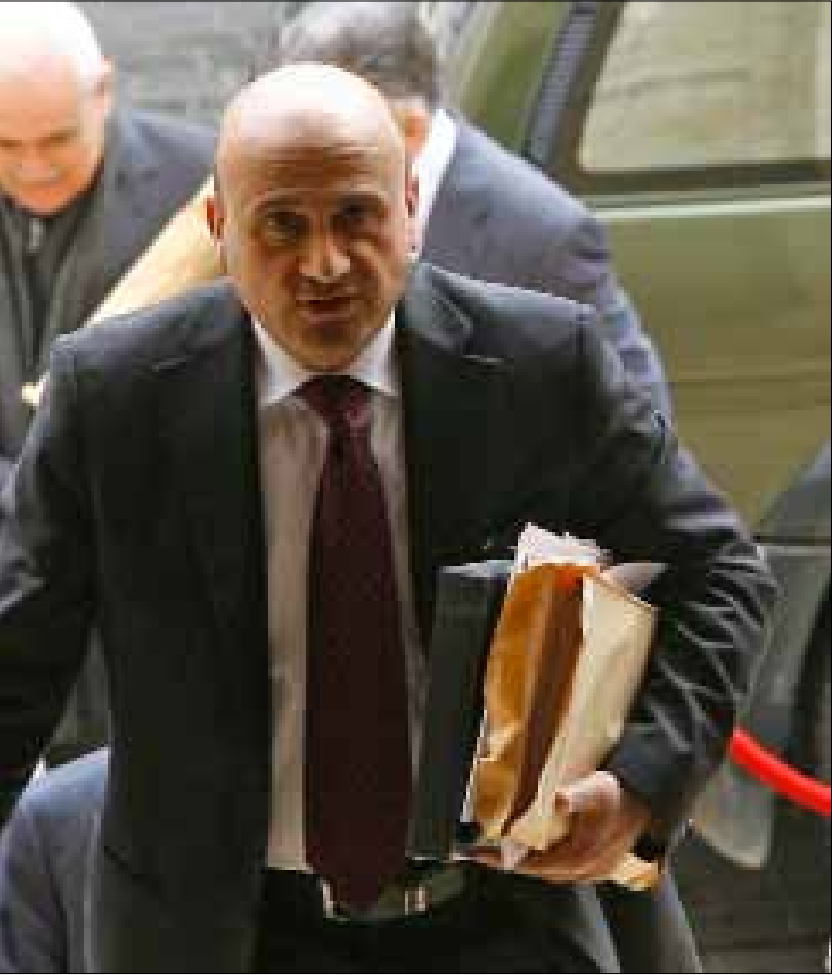
نظم نواب كتل التغيير والإصلاح حصرياً علاقة وزارة الأشغال بهم في الجبل

يدفع العونيون يومياً كلاً من الشتائم وأكثر ثمن بقائهم في حكومة الرئيس نجيب ميقاتي. لكن التجوال في أفضية جبل لبنان تكشف الوجه الآخر للمشاركة العونية في الحكومة: عادت الدولة بزفتها إلى جبل لبنان، أو الأصح، هي في طريق عودتها إلى الأفضية التي حرمها نوابها السابقون المشاريع العامة لمصلحة المشاريع الخاصة الأربح في نظرهم انتخابياً