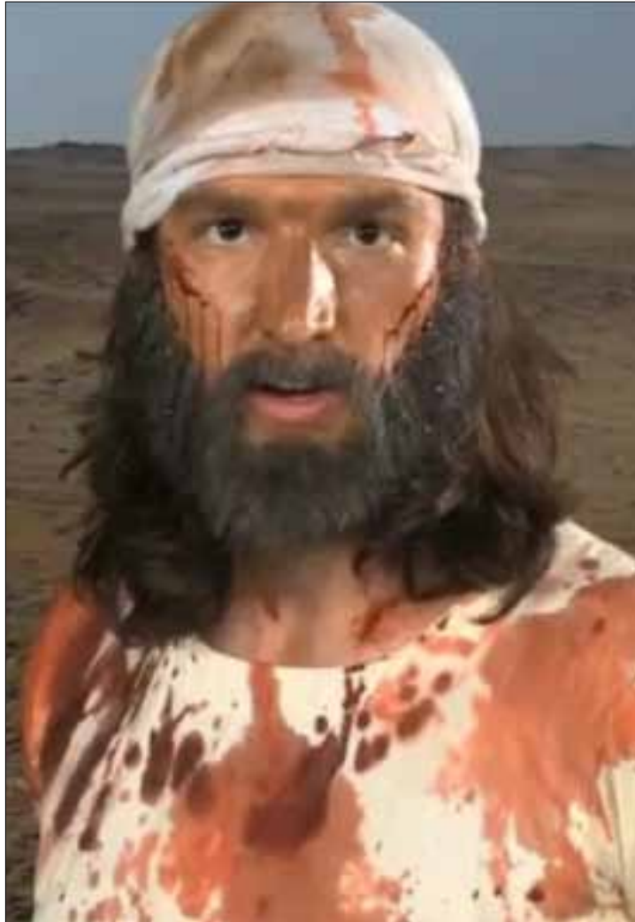
مشهد من «براءة المسلمين»

كان موقع «المرصد الإسلامي» وراء سرعة انتشار الفيلم الفضيحة