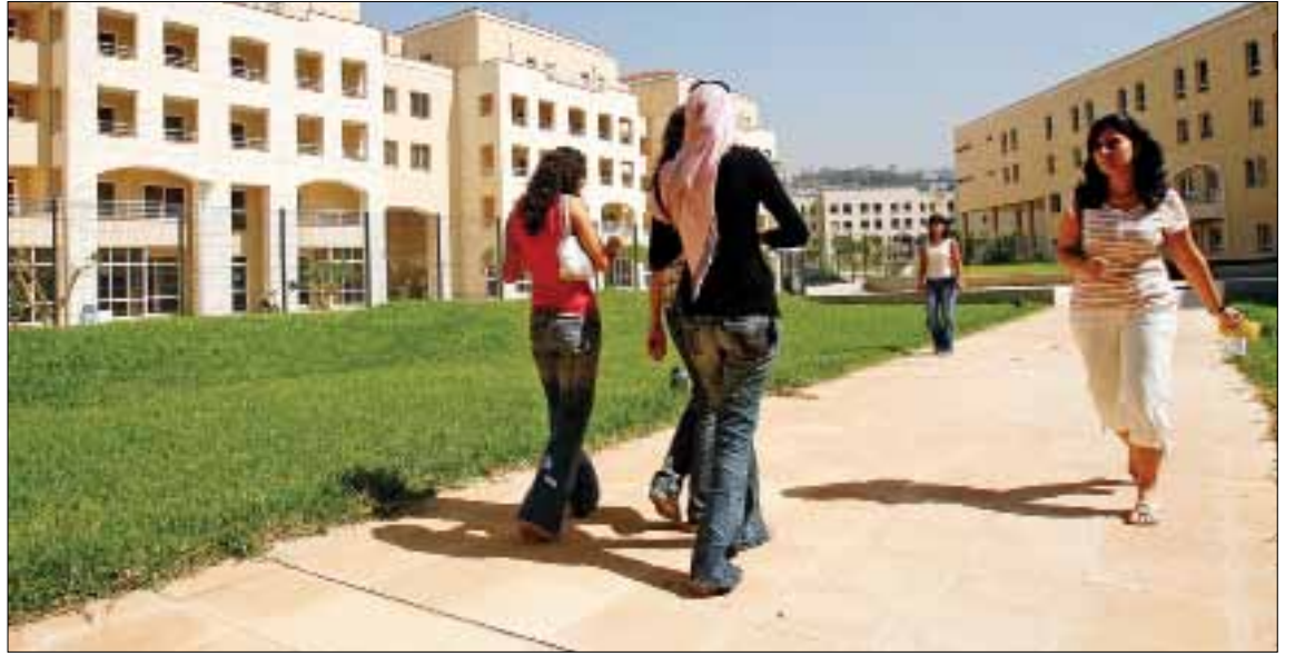
ينزح الكثيرون إلى المدينة في ظل عدم توافر وسائل عامة للنقل (أرشيف)