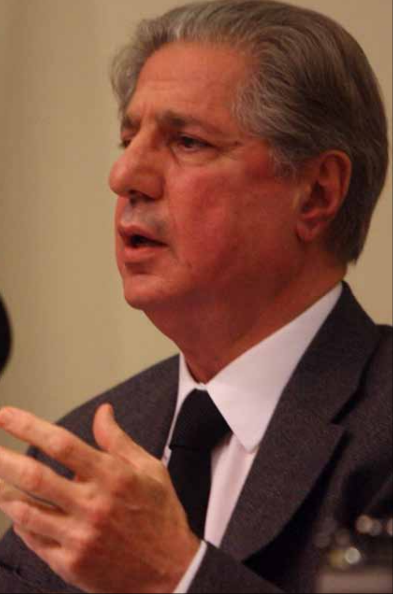
لم يعد النزاع المسلح في سوريا إقليمياً، بل اضحى جزءاً من لعبة دولية

1 - لا يستطيع الأسد الاستمرار في السلطة بعد الخراب الهائل الذي ضرب بلاده، ولم يعد في وسعه بعد الآن ترؤس سوريا موحدة ومستقرة، فضلاً عن اهتراء عام على كل الصعيد أنهك النظام والجيش معاً.