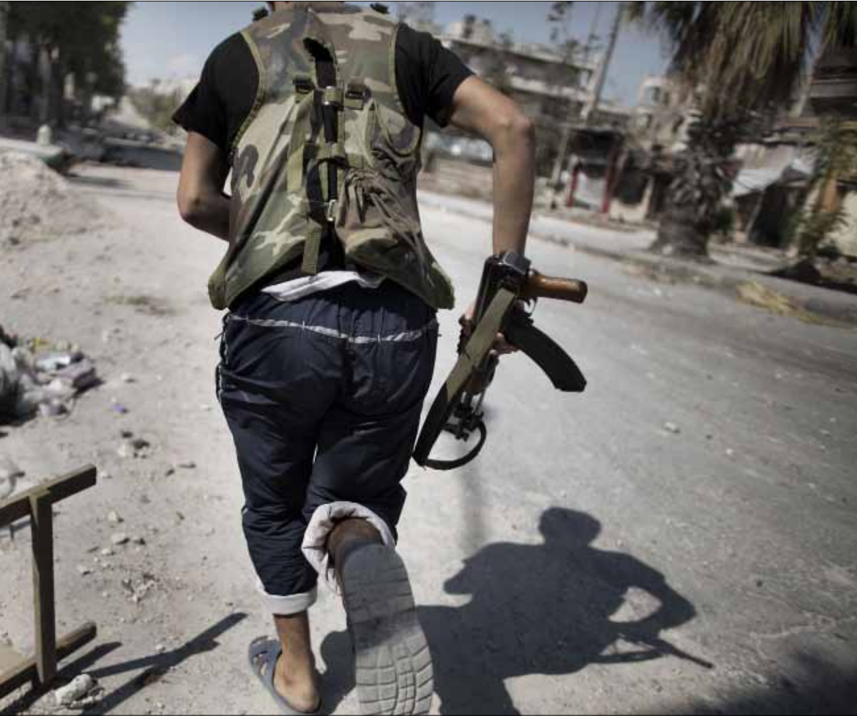
في جنّ سيف الدولة في حلب، امس

تشافيز «يقيم» المقترح الإيراني بالانضمام إلى «المجموعة الرباعية»... ولندن تستبعد التدخل الع