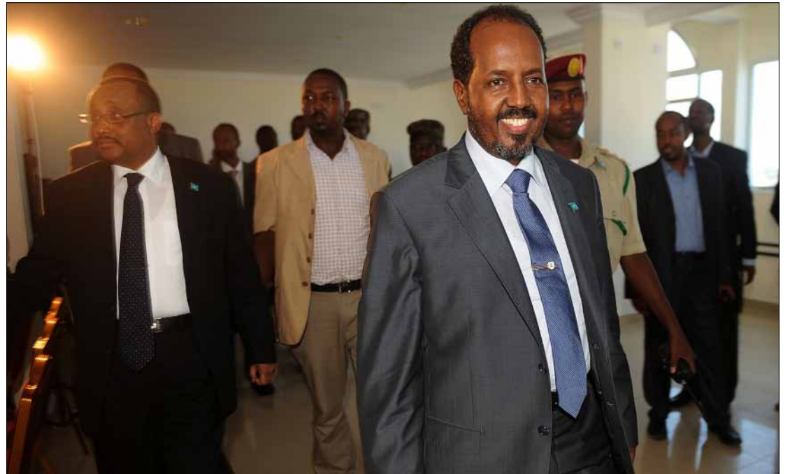
الرئيس الجديد خلال تواجده في فندق «الجزيرة» في مقديشو امس

نجا الرئيس الصومالي الجديد، حسن شيخ محمود، أمس، من أولى محاولات اغتياله على يد حركة «الشباب». وبانتظار انتقاله إلى مقره الرئاسي، يأمل الصوماليون أن ينجح الأستاذ الجامعي في العبور بهم إلى مزيد من الاستقرار السياسي والأمني