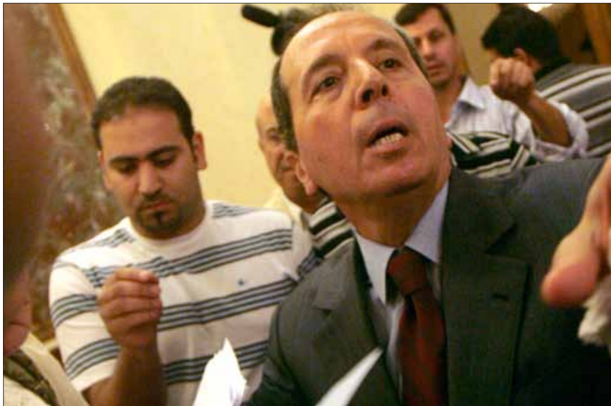
المشوق: السيد قال إنه يجب وضع جن بلاط على لافتة الاغتيالات (هينم الموسوي)