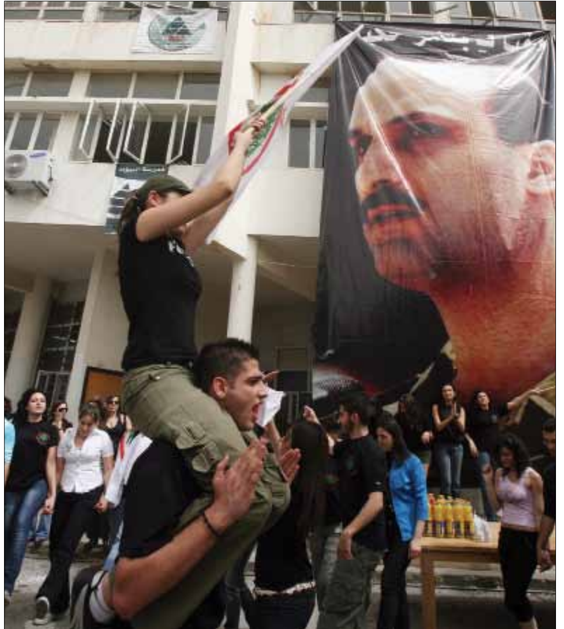
دخل طلاب القوات اللبنانية حرم الجامعة لمساعدة طلابهم

نفي رحباني، يقابله نفي آخر من مصلحة طلاب القوات، إذ يشير رئيس دائرة الجامعة اللبنانية في المصلحة إليي جعجع إلى أنه «لم يتعرّض أحد