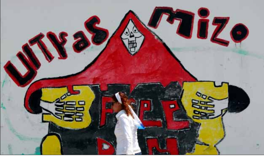
شعار التراس الأهلي على أحد جدران الأسكندرية

والوحيد كما كان قانون الطوارئ لا بديل عنه والرئيس لا يمكن المساس به و هيبة الشرطة اساس الامن. مفاهيم سلطوية تتسرب عبر اجهزة الدعاية للنظام في المدارس والتلفزيونات والصحف إلى درجة لا تجعلها مجرد مفاهيم يمكن تغييرها... لكنها اقدار او حقائق مطلقة. ماذا تعني هيبة الدولة؟ هل تعني ان العامري وزير الرياضة يقول ان الرئيس المرسي يريد عودة النشاط الرياضي.. فيعود من دون اي اعتبارات اخرى؟ هل تعني ان ينفذ القرار ولو كان خطأ او اعتداءً على دماء لم تجف بعد؟ هل تعني ان الدولة لا تلوى ذراعها، كما قال مستشار الرئيس للشؤون القانونية في حوار تلفزيوني؟ المستشار والوزير والرئيس.. كلهم يرددون مقولات قالها مبارك واباطرته في كل مكان، وهم جميعا ابناء هذا الخطاب السلطوي الذي انقرض من الدول المحترمة التي تجعل هيبة المواطن هي المحترمة.