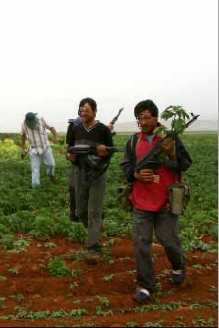
الدولة ذات بنفسها عن الاهتمام بمزارعيها