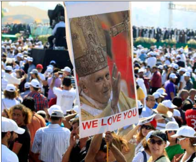
فضية القوات: حرية أهل السنة في الشرق بدل حرية المسيحيين فيه (هينم الموسوي)

الإنتاجية الكبيرة في بلدات الريف المسيحي تحذ من الهجرة الاقتصادية المسيحية؟ أم ماذا؟ طغى استحداث كنيسة في القصر الجمهوري على صلاحيات هذا القصر، وصورة الزعماء مع نيافته على مضمون ما يقولونه له. وفي غمرة الكذب، تجاهل المعنيون الإضاءة حتى على مشاريعهم الصغيرة الخاصة. لم يقل المسيحيون للبابا ماذا يريدون منه، غير الصلاة لأجل لبنان. ليغادر بذلك البابا بنديكتوس السادس عشر العاصمة الحريية ومطار رفيق الحريري الدولي من دون أن يصفح مارونياً واحداً، في جيبه مشروع قبيل مغادرته، كانت ابتسامته المودعة تعرف كل شيء؛ هو يعلم أن الإحباط سيتفاقم والهروب سيزداد حين يأتي البابا بشحمه ولحمه ولا يتغير في واقع المسيحيين بالمنطقة شيء.