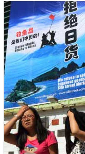
ملصق يدعو لحظر بيع السلع اليابانية في بكين أمس

وكانت بكين قد تعهدت أمس بحماية المواطنين اليابانيين والممتلكات وحث المحتجين المعادين لليابان على التعبير عن أنفسهم «بطريقة منظمة وعقلانية وقانونية». وقال المتحدث باسم وزارة الخارجية الصينية هونغ لي للصحافيين في إفادة يومية إن الأمر متروك لليابان لتصحیح سبلها وإن اتجاه التطورات في أيدي اليابان الآن. ويتخذ البلدان منذ أسابيع عدة مواقف