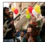
فرقة «نشان» 10:10 ■ 9/18