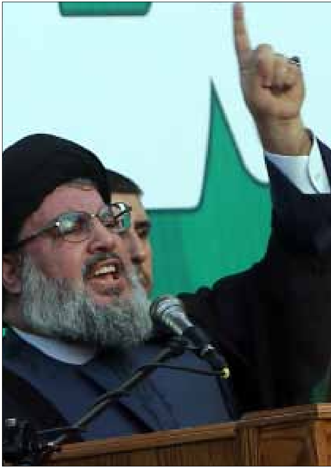
رات القناة الأولى أن الفيلم المسيء للنبي أجبر نصر الله على الخروج العلني (هينم الموسوي)