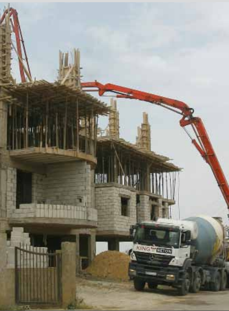
زيادة عامل الاستثمار ترفع الاسعار

بصيص: أسعار الوحدات السكنية لم تنخفض مع «طابق المر»