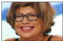
أرزة وعلي عند البارود... LBCI 21:30