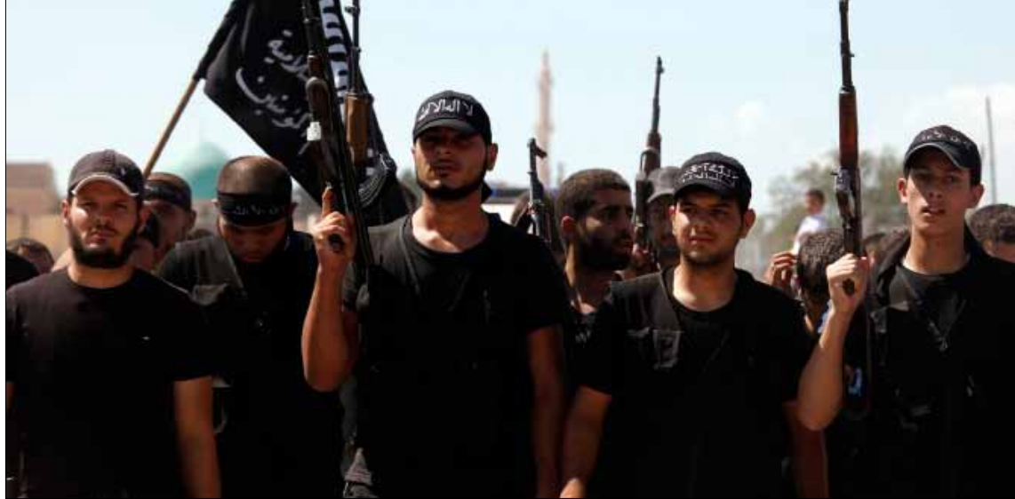
خلال تشييع أحد عناصر «الجيش السوري الحر» في ريف حلب، أمس

واصل الموفد العربي والدولي الأخضر الإبراهيمي مهمته، ليحظ في القاهرة، بالالتزام مع اجتماع «مجموعة الاتصال الرباعية» على المستوى الوزاري، بغياب السعودية «لارتباطات طارئة»