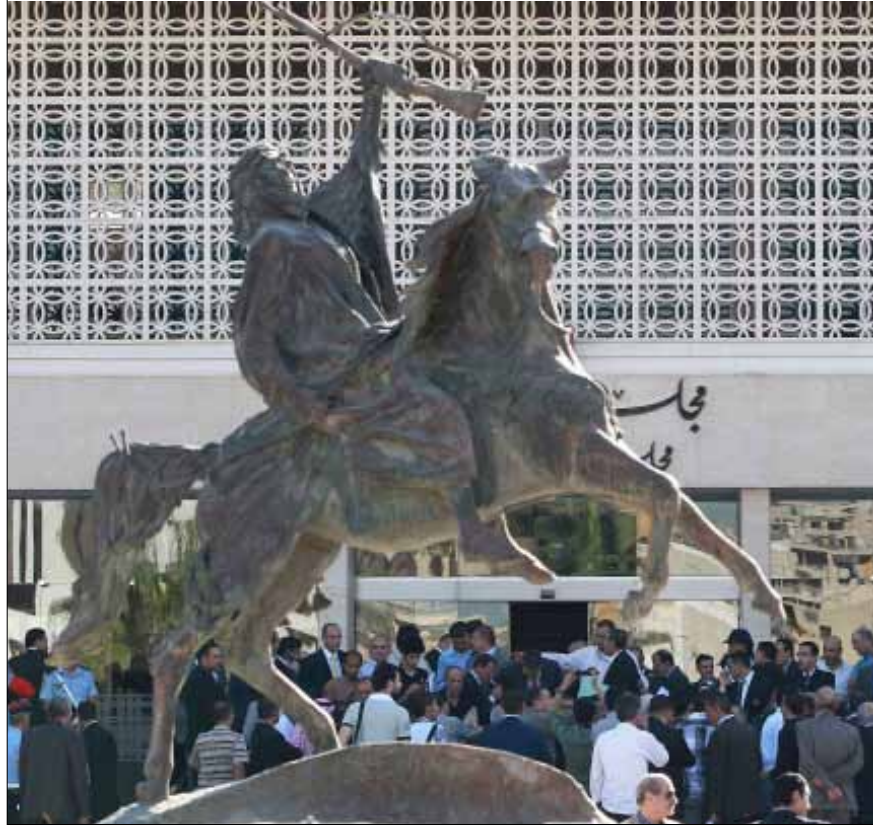
نواب ينتظرون امام مبنى البرلمان الأردني في عمان

بماليزيا المتخلفة إلى موقع الاقتصاد رقم 14 على المستوى العالمي.