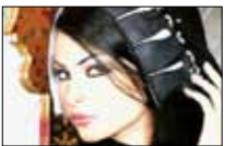
في «عباءة» الإمارات «دبي» 21:30