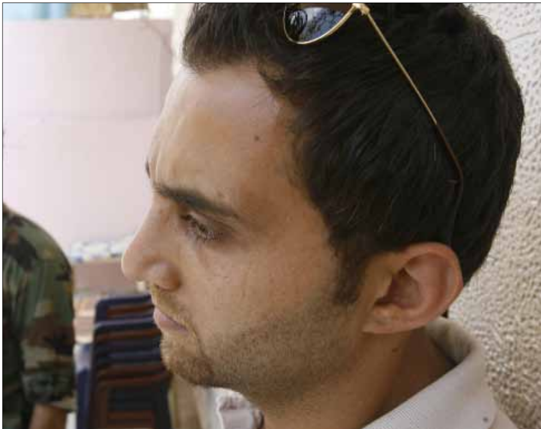
تُبِت محكمة التمييز اليوم في طلب إخلاء سبيل الصحافي الموقوف (أرشيف - مروان طحطح)

«لم يكن مدير مكتب محلة التابم الأميركية في بيروت يعلم كل هذه الخلفية»، بحسب بعض عارفيه، «إذ كان فقط يبحث عن فرصة إعلامية تُتيح له تغطية عملية التفاوض والبيع والشراء، وصولاً إلى تصوير عملية نقل السلاح من الضاحية الجنوبية إلى المعارضة السورية في سوريا لتحصيل السبق الذي يسعى إليه أي صحافي». وصل الثلاثة إلى المكان المحدد، فنزل رامي من السيارة ليختبئ بعيداً عن عيني تاجر السلاح المفترض. إثر ذلك، وصلت سيارة ترجل منها عدد من