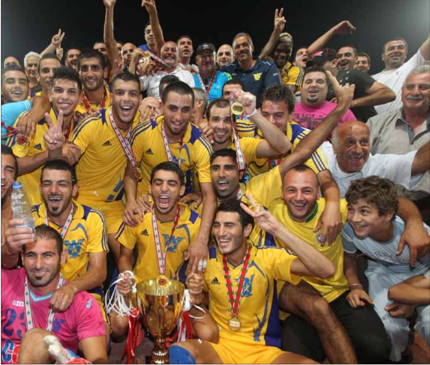
لاعبو فريق الصفاء مع كأس النخبة (عدنان الحاج علي)

وقف فريق الصفاء مرة جديدة على منصة التتويج، وهذه المرة رافعاً كأس النخبة لكرة القدم، بعد أن توج بلقب الدوري قبل أشهر. وجرّد الصفاويون العهد من لقبه بفوزهم عليه بجدارة 2 - 0 بعد التمديد، فهل يضيف الكأس السوبر السبت المقبل؟