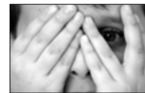
فوبيا Si belle «الجديد» 21:30