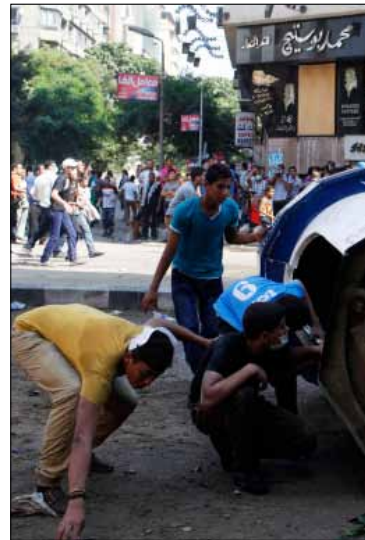
من الاشتباكات قرب السفارة الأميركية في القاهرة الأسبوع الماضي

تخصهم أو قضيتهم. من جهة ثانية، باتت الاشتباكات «سبوية» اقتصادية. فأي مكان تحدث فيه اشتباكات، سواء في وسط القاهرة أو في الإسكندرية، يشهد انتعاشاً اقتصادياً. المشتبكون في حاجة دائمة إلى المياه وبعض الحلوى التي تعطي الطاقة وبطاقات شحن الهواتف للتواصل أو الاطمئنان على ذويهم وأصدقائهم في الاشتباك، فضلاً عن الإعلام التي تعبر عن أطراف الاشتباك. وعندما يطول وقت الاشتباك وتهدك القوى يكون الجميع بحاجة إلى الطعام. هذا بخلاف أدوات مواجهة الشرطة من أقنعة ومياه غازية أو بنزين أو أي شيء