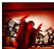
جريمة في المستشفى 8:08 ■ 9/19