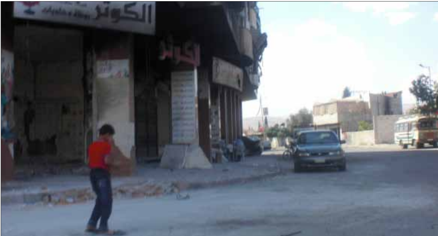
في شوارع داريا حيث جالت «الأخبار»

هنا أسبوع فقط أتت الجرافات لتنظيف المدينة وبدأت عمليات إعادة الخطوط الهاتفية