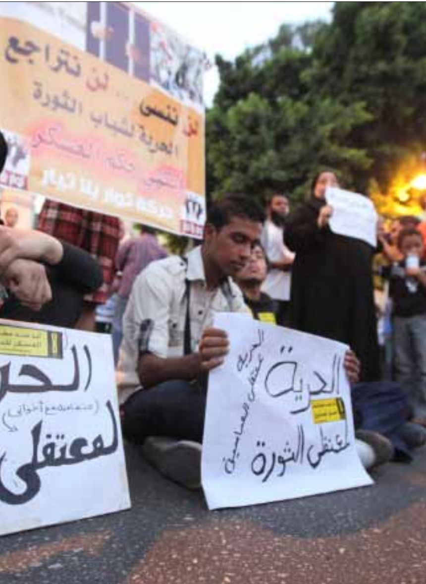
من أحد الاعتصامات المطالبة بالافراج عن معتقلي الثورة

ما سمي «أحداث العباسية». محمود كان مشاركاً في اعتصام العباسية مع جماعة «حازمون»، الحركة التابعة للمرشح المستبعد من انتخابات الرئاسة حازم صلاح أبو إسماعيل. وكان ضمن الفريق المسؤول عن تأمين الميدان، عندما