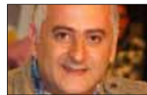
كل شي (مش) «معقول» otv 20:30