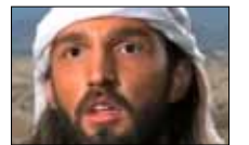
الفيلم المسيء... من المسؤول؟ NBN 20:30

ينطلق برنامج «عباءة» في حلقاته الأولى الليلة، مسلطاً الضوء على حياة مصممي الأزياء الإماراتيين بأبعادها كافة. يتميز البرنامج بنمطه السريع وأفكاره المتنوعة واعتماده على برامج التواصل الاجتماعي، كما يقدم نصائح خاصة بالموضة للمشاهدين.