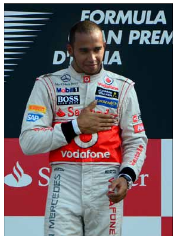
البريطاني لويس هاميلتون

دعا فلافيو برياتوري إلى تجديد عقد فيليبي ماسا