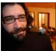
غرافيتي سمعان خوام 6:36 ■ 9/21