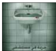
نساء في الحرب 8:08 ■ 9/20