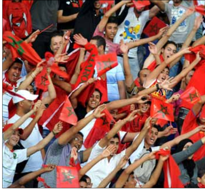
مطالب شعبية كبيرة بتعيين بادو الزاكي مدرباً للمنتخب المغربي (أرشيف)

الأخير، هو الخيار الأول بالنسبة إلى الحكومة المغربية، كما أن هناك مطالب شعبية كبيرة تضغط للتعاقد مع الزاكي، ويعدّ الطاوسي مدرب الجيش الملكي خياراً ثانياً، ومن المرجح في حالة عدم قيادته