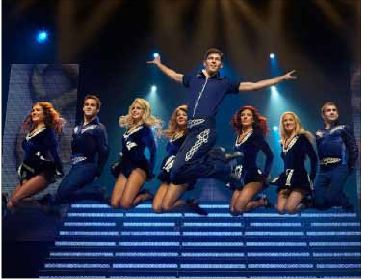
Lord of the Dance

Lord Of The Dance: 9:00 مساءً اليوم - «بلاتيا» (جنوبية، شمالي بيروت). للاستعلام: 09/831666