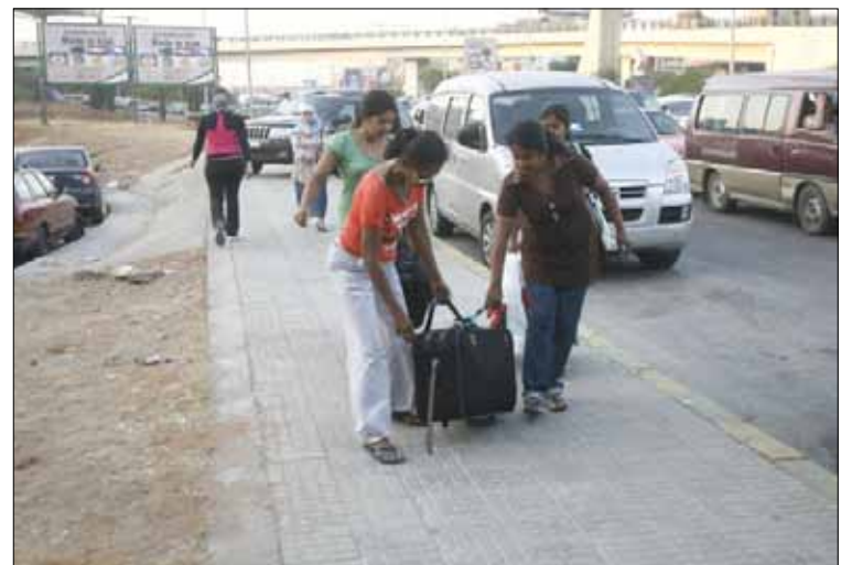
العقد الثلاثي يسهل على الأجهزة الأمنية تحديد المسؤوليات

خصوصاً أن المادة 7 من قانون العمل اللبناني (الصادر بتاريخ 1946/9/23) استثنيت من أحكامه الخدم في بيوت الأفراد. وفي ظل غياب أي مظلة قانونية ترعاهن، يبقى الإطار القانوني الوحيد الذي يرعى عملهن في المنازل عقداً ثلاثي الأطراف (بين العاملة ومكتب الخدمات وربّة/رب المنزل)، والذي لا يقف عائقاً أمام هذا الواقع، بدأت أعداد غير قليلة من العاملات الأجنبات بالتفتيش عن مصادر للرزق خارج المنازل التي استقدموا للعمل فيها. فهناك من هرب من الخدمة في البيت لأسباب عديدة، مثل الحبس القسري والتجويع والتعرض للضرر الجسدي أو الاغتصاب. وهناك أيضاً من استقدم للعمل في لبنان، لكنهن لم يحظين برضا كفلأتهن الذين أعادوهن إلى مكاتب الاستخدام،