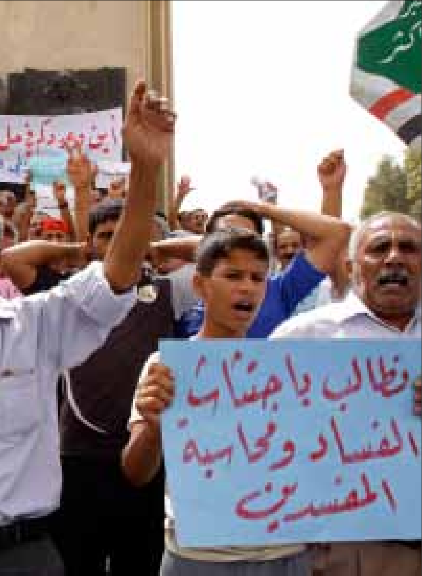
من إحدى التظاهرات المطالبة بالكهرباء والإصلاح في البصرة العام الماضي

عضو لجنة النفط والطاقة في مجلس النواب، فرهاد الاتروشي، أوضح أن هناك الكثير من الأسباب التي حالت دون الوصول إلى معدلات الاكتفاء الذاتي من إنتاج الطاقة الكهربائية. وأوضح النائب عن التحالف الكردستاني أن «العقود التي أبرمتها وزارة الكهرباء الاتحادية بشأن إنشاء محطات جديدة، لم تنجز بسبب تلك وتسويق تحمّلها الجهات المنقذة لهذه المشاريع». ورأى أن الذي زاد