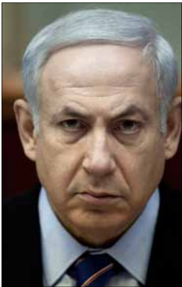
نتيهاهو خلال مشاركته في الجلسة الوزارية قبل أيام

رغم عدم الإعلان الرسمي لإجراء انتخابات مبكرة، باتت الساحة الإسرائيلية تعيش أجواء الانتخابات، وهو ما انعكس في مواقف القيادات السياسية وتعليقات الصحاف. ومن المؤشرات التي تتوالى تباعاً على أرجحية هذا السيناريو موقف وزير الخارجية، أفيغور ليرمان، خلال لقائه مع رئيس الوزراء بنيامين نغناهو، الذي أكد فيه أنّ من الصعب التوصل إلى موازنة تحظى باتفاق من جميع الكتل التي تتشكل منها الحكومة. هذا إلى جانب انضمام رئيس الكنيست، القيادي في حزب الليكود، رؤوفين ريفلين، إلى