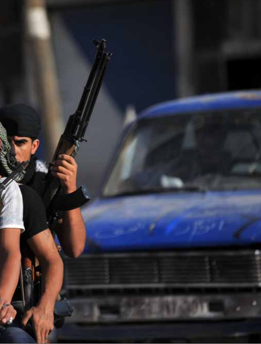
عناصر من الجيش الحر في بلدة تل أبيض الحدودية، أمس

طلّوت صفحة «التوتر الحدودي» تصريحات أنقرة الرفضة للحرب، وعزّزها تعويل موسكو على هذه التصريحات وزيارة النائب الأول للرئيس الإيراني لتركيا. في وقت دان فيه مجلس الأمن هجمات حلب «الإرهابية»