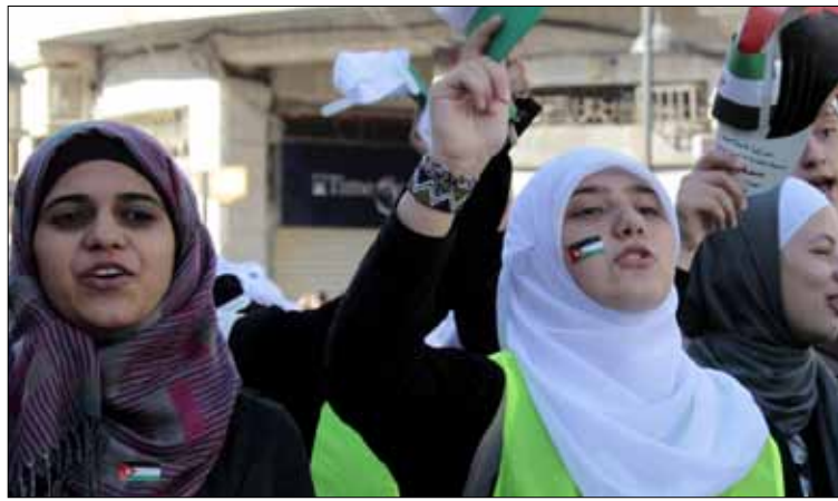
عشرات الآلاف شاركوا في التظاهرة

قد وصلت هذا الرقم (10 آلاف)، فهذه رسالة لهم بضرورة أن يخرجوا من الشارع إلى المؤسسات الدستورية من خلال المشاركة في الانتخابات». وأضاف: «بعد التضخيم الكبير الذي مارسوه، نراها مسيرة عادية ككل المسيرات، وعلى الإخوان مراجعة منهجهم السياسي في التعامل مع قضية الإصلاح». وأكد أن «عليهم أن يدركوا أن لا سبيل للإصلاح والتغيير إلا من خلال المؤسسات الدستورية والدخول إلى مجلس النواب القادم عبر المشاركة في الانتخابات».