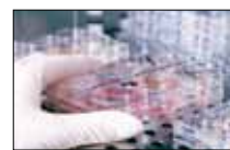
المستقبل في الخلايا الجذعية MTV ■ 22:00