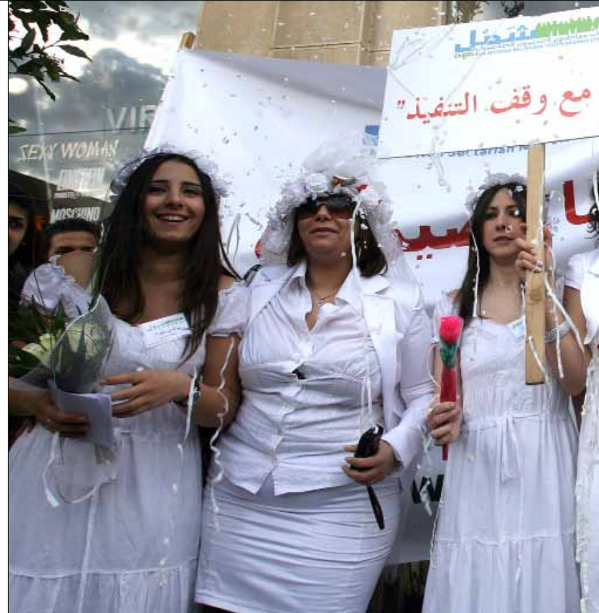
لا شيء سيوقف حملة الضغط لإقرار «القانون اللبناني للأحوال الشخصية»