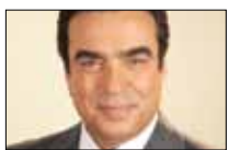
جورج والنساء «الجديد» ■ 20:40