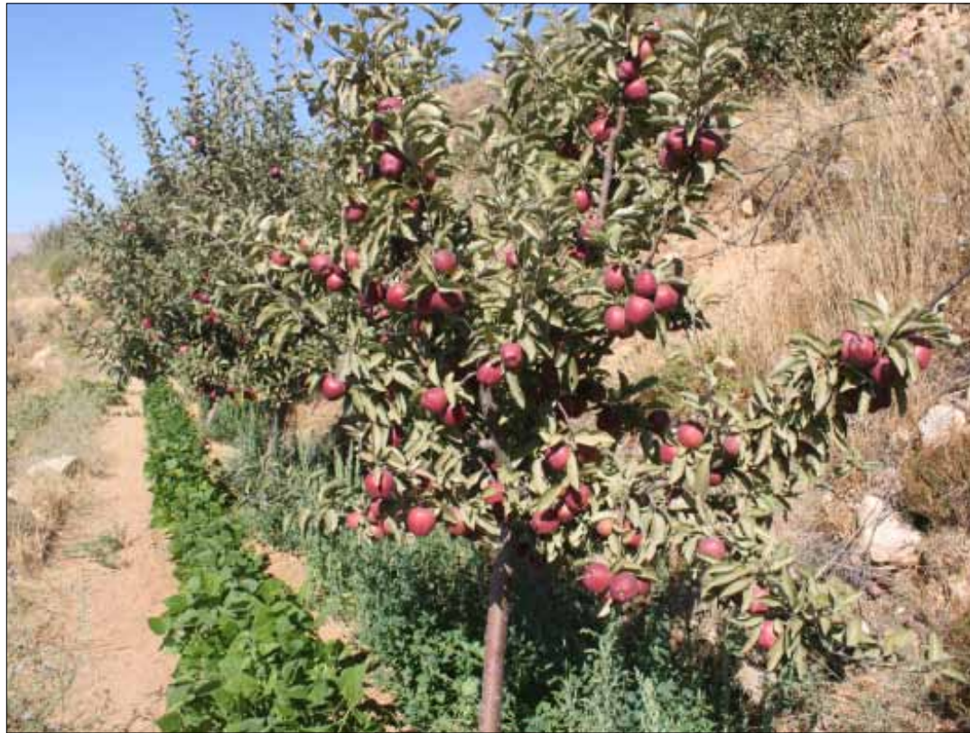
أغلب مزارعي جرد الضنية مشغولون بتوضيب موسم التفاح