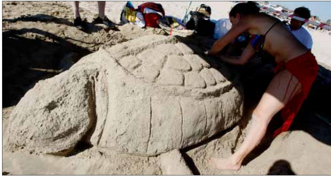
قلة عدد الأعشاش ليست مؤشراً يدل على خطر يدهم السلاحف

لهم إلى مقرهم على شاطئ القليلة. ومن تدابير الحماية التي اتخذتها المحمية للبيوض وتأمين حركة مريحة للسلاحف، عقدها اتفاقية مع مستثمري الخيم البحرية على شاطئ المحمية بالتزامن مع موسم وضع البيوض. هؤلاء خضعوا لعشرات محاضرات التوعية والإرشاد حول أهمية السلاحف وضرورة حمايتها. وذلك من خلال المحافظة على النظافة وتخفيف الأضواء والأصوات التي تشكل مانعاً للسلاحف من ارتياد الشاطئ، إذ تشتت السكينة والعتمة للتزاوج والوضع. كذلك، فإن الصيادين قد خضعوا لدورات مماثلة للحفاظ على نظافة البحر وعدم رمي الزيوت وأكياس النايلون التي تبتلعها السلاحف لظنها بأنها قناديل البحر، ما يؤدي إلى اختناقها ونفوقها. فضلاً عن حوادث اصطدامها بالقوارب، فيما يعمد بعض الصيادين إلى التخلص منها إذا ما علقت بشباكهم وخزبتهم. وقد سجل لأكثر من مرة خلال الصيف المنصرم نفوق عدد من السلاحف على مختلف شواطئ المدينة، ما قد يؤدي