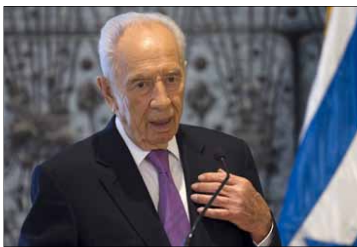
الموقوف كُلف جمع معلومات عن بيريز (أرشيف)

السنوات القليلة الماضية، في دول أوروبية، آخرها في تموز الماضي في تركيا، وسلّمهم معلومات استخباراتية حساسة عن مواقع استراتيجية داخل إسرائيل، جرى تحديدها كي تكون اهدافاً للقصف الصاروخي، في حال نشوب حرب بين إسرائيل وحزب الله. وقال قائد اللواء الشمالي في الشرطة الاسرائيلية ميخائيل شفشك إن «الخطيب اعترف باتصاله بحزب الله، وبمعظم الوقائع الواردة في لائحة الاتهام»، مشيراً الى ان «هذه الحادثة دليل على تطور لافت لأنشطة الحزب في شمال إسرائيل»، و اضاف إن «اسلوب التجنيد، وطريقة الاتصال التي كانت تحكم اللقاءات، وايصال المعلومات الاستخباراتية، مختلفة عما كان يحصل في الماضي».