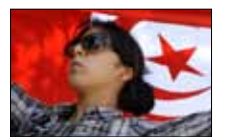
نورة بوك «الميدان» ■ 21:30

في ثاني ظهور إعلامي له خلال شهر، يطل العالم المصري أحمد زويل (الصورة) اليوم في برنامج «آخر النهار»، مع تزايد الانتقادات الموجهة له بسبب الخلاف بين جامعة «النيل» ومدينته العلمية. ويتحدث مع محمود سعد عن النهضة العلمية في مصر.