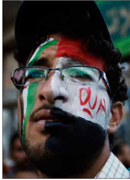
يمني يطالب بمحاكمة صالح

وفي الوقت الذي كانت فيه هذه المناطق تحت سيطرة الإصلاح، كان التحالف قوياً جداً بين الإصلاح و«صالح»، برغم الخلاف السياسي الظاهر. إلا أن تركيبة اليمن القبلية تحتم بقاء نفوذ الإصلاح في مناطق حاشد، للسيطرة على بكيل. لماذا؟ لأن «صالح» أيضاً من قبيلة حاشد.