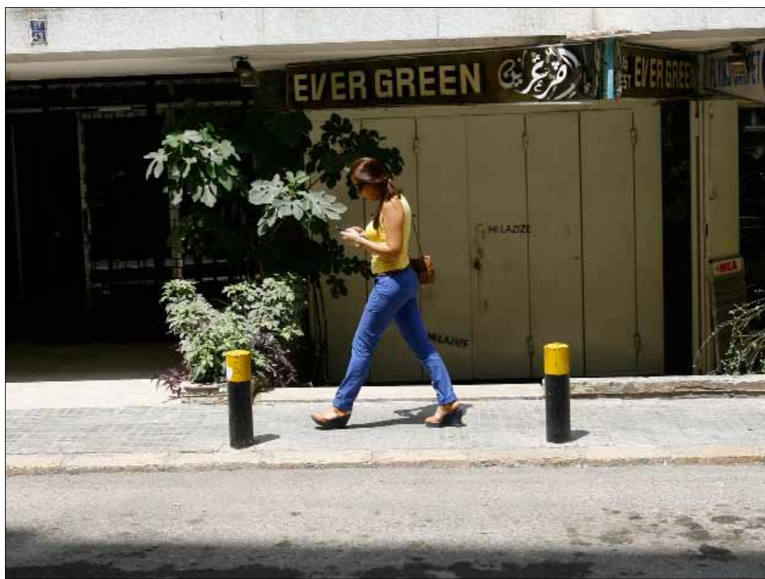
تضاعف عدد المشتركين بالإنترنت على الخليوي منذ نيسان الماضي (مروان طحطح)

وفيما يبقى هاجس نوعية الخدمة قائماً مع ازدياد الطلب في مجال الإنترنت الجوال، يبدو مجدداً مع قراءة هذه الأرقام البحث في كيفية