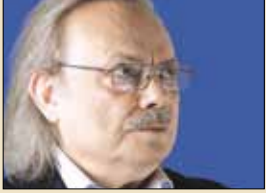
انسي الحاج يكتب