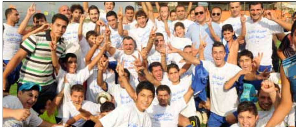
إدارة الشباب الغازية لا ترغب باستمرار مسلسل الصعود والهبوط (أرشيف)