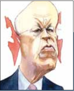
وزير خارجية هولندا يطارد حزب الله