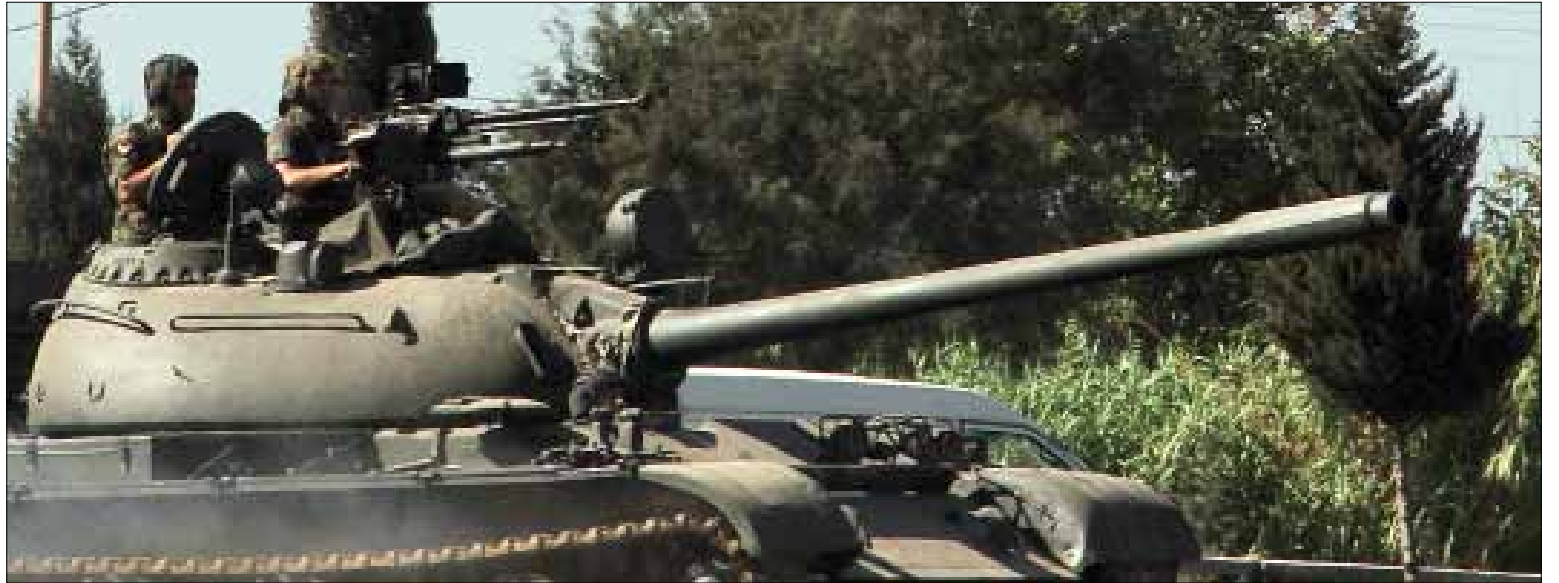
الجيش ينتظر أوامر الحكومة، والحكومة تكلف ضابط الارتباط التنسيق

ولدى البلدين سفيرين يفترض ان يتوليا تنسيق الامور المشتركة، وخصوصاً الأمنية فيها.