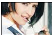
ليه تغيري... والغيرة نار؟ «المستقبل» ■ 20:30