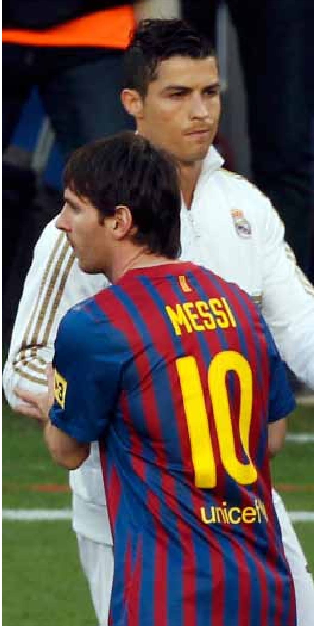
تتجدد المواجهة بين كريستيانو رونالدو وليونيل ميسي (أرشيف)

أفادت «ميديا برو»، الشركة المسؤولة عن إنتاج وتوزيع إشارة البث التلفزيوني لموقعة «كلاسيكو» الدوري الإسباني، بأنها تتوقع وصول عدد متابعي هذه المباراة إلى 400 مليون مشاهد حول العالم. وسيحضر في ملعب «كامب نو» نحو 500 شخص لتغطية المباراة، بين منتج وفني ومعلق، يعملون لأكثر من 30 محطة تلفزيونية.