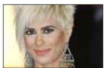
العاب مع جوزيان LBCI ■ 21:30