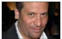
ماجد المصري... مزواج «المحور» ■ 21:30