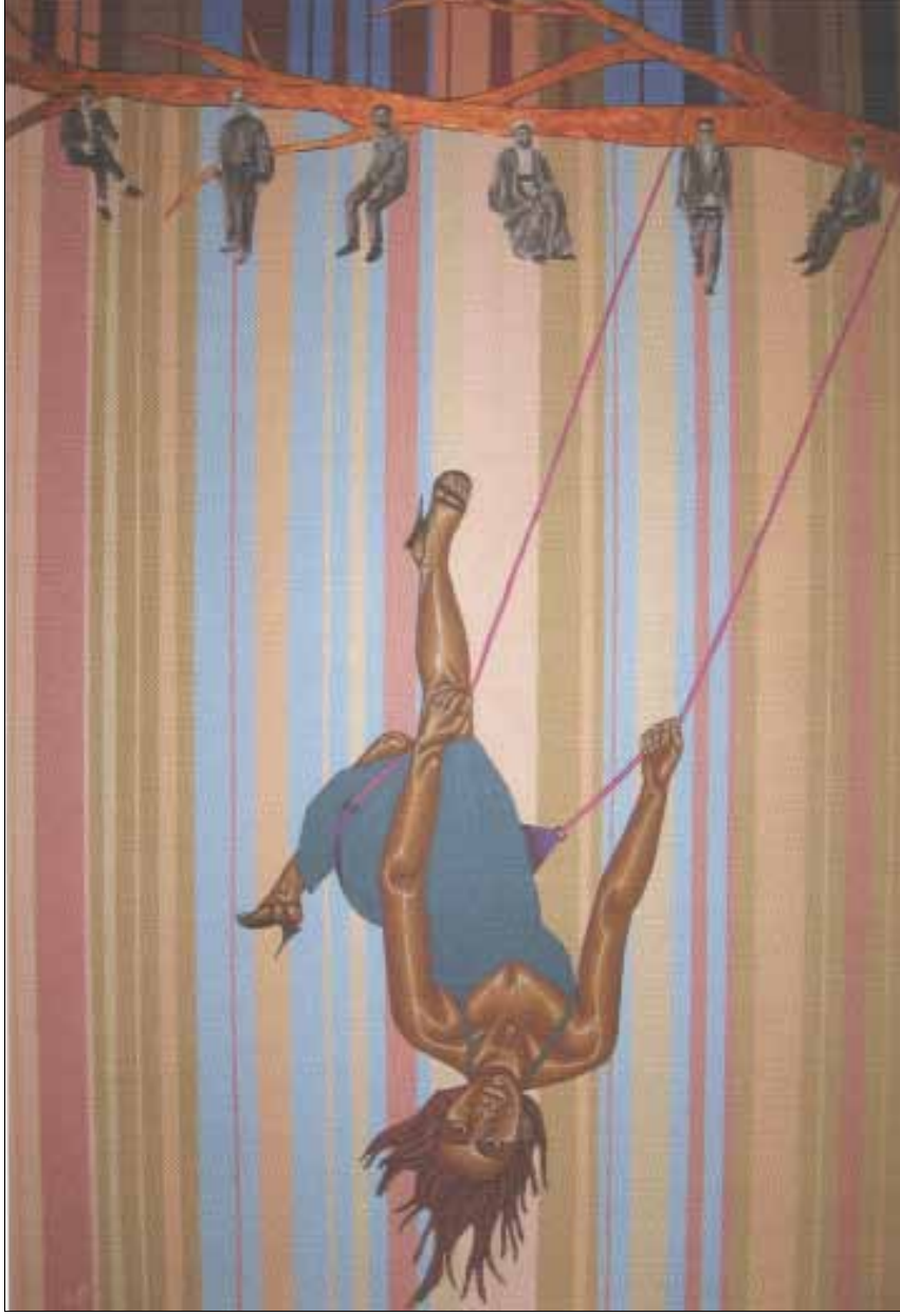
«أرجوحة» (مواد مختلفة على كانفاس - 130 x 90 سنتم - 2011)