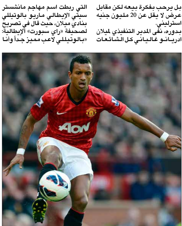
يسعى ميلان إلى ضم البرتغالي لويس ناني من مانشستر يونايتد

ذكرت صحيفة «توتوسبورت» الإيطالية أن يوفنتوس حصل على الضوء الأخضر من مهاجم شنغهاي شينوا الصيني، العاجي ديديه دروغبا للعمل على التعاقد معه خلال كانون الثاني المقبل. وأوردت الصحيفة أن دروغبا الذي انتقل لصفوف شنغهاي بداية الموسم الحالي مقابل حصوله على 10 ملايين يورو سنوياً بدأ يفكر جدياً بالرحيل عن ناديه لوجود مشاكل إدارية تؤخر حصوله على مستحقاته المالية، ولذا منح يوفنتوس موافقته على اللعب له لكن بشرط حصوله على نفس الراتب والذي يعد بعيداً جداً عن سقف الرواتب في النادي الإيطالي. وفي السياق، يسعى ميلان إلى تقديم عرض بقيمة 12 مليون جنيه استرليني للاعب مانشستر يونايتد البرتغالي لويس ناني الذي يخوض موسماً صعباً مع فريقه وخاصة المدير الفني الاسكتلندي «السير» الكيس فيرغيسون الذي انتقده كثيراً هذا الموسم، حسب ما ذكرت صحيفة «مترو» الإنكليزية. وأوضحت الصحيفة أن يونايتد لا يبدو مصراً على الحفاظ على ناني