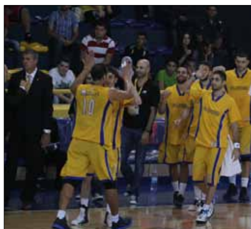
يرتاح الرياضي اليوم قبل لقاء مهرام غداً (عدنان الحاج علي)

حافظ فريق الرياضي على وتيرته المتصاعدة في المباريات، وحقق فوزه الثالث ضمن بطولة الأندية الآسيوية لكرة السلة المقامة على أرضه، وكان على حساب دهوك العراقي بنتيجة 96-51 تحت أنظار منافسه الوحيد مهرام الإيراني الذي ارتاح أمس