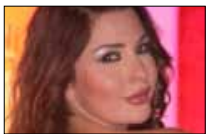
لاميتا «زهرة الخليج»؟ أبو ظبي ■ 20:00