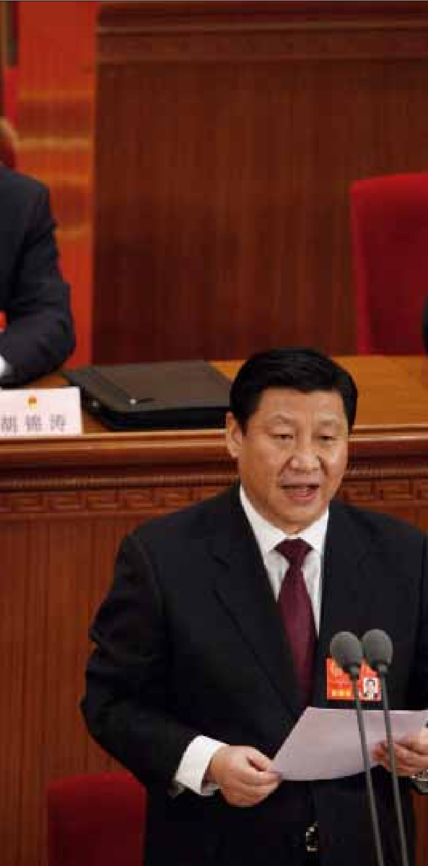
الرئيس الحالي يستمع إلى الرئيس القادم (أرشيف)

انضمّ تشي جينغ بينغ إلى الحزب الشيوعي الصيني عام 1974، وتدرج في مناصب حزبية مختلفة في مقاطعة زينغدينغ إلى أن أصبح الأمين العام للحزب الشيوعي فيها عام 1983. وبين عامي 1983 و2007 تولى مناصب رفيعة في مقاطعات شانغشي وهبياي وفوجيان وزيجيانغ. لكن ما سمح بوصول تشي جينغ بينغ إلى القمة هو براعته في معالجة قضية فساد هزت الصين عام 2000 وأدت إلى إعدام 14 مسؤولاً صينياً وإلى ملاحقة 300 آخرين أمام القضاء. عرفت القضية باسم فضيحة «يوانهوا» وهي الشركة التي كان يديرها رجل الأعمال لاي تشانغشنغ الذي هرب إلى كندا ولم تتمكن السلطات الصينية من استرجاعه حتى العام الفائت (2011)، فحكم عليه بالسجن المؤبد. أدلى تشي، بصفته محافظ مقاطعة فوجيان، بشهادته بشأن عمليات فساد واسعة النطاق بلغت قيمتها عشرات المليارات من الدولارات أمام المكتب السياسي للحزب بحضور الأمين العام جيانغ زيمين آنذاك ونائبه (الرئيس الحالي) هو جنتاو. بعد ذلك، تولى تشي محافظة زيجيانغ الصناعية حيث تمكن من رفع مستوى نموها الاقتصادي إلى 14 بالمئة. وفي آذار 2007، عين تشي جينغ بينغ أميناً عاماً للحزب الشيوعي في شانغهاي بعد تنحية سلفه بسبب ضلوعه في عمليات فساد إداري. وانتخب نائباً لرئيس الجمهورية في 15 آذار 2008.