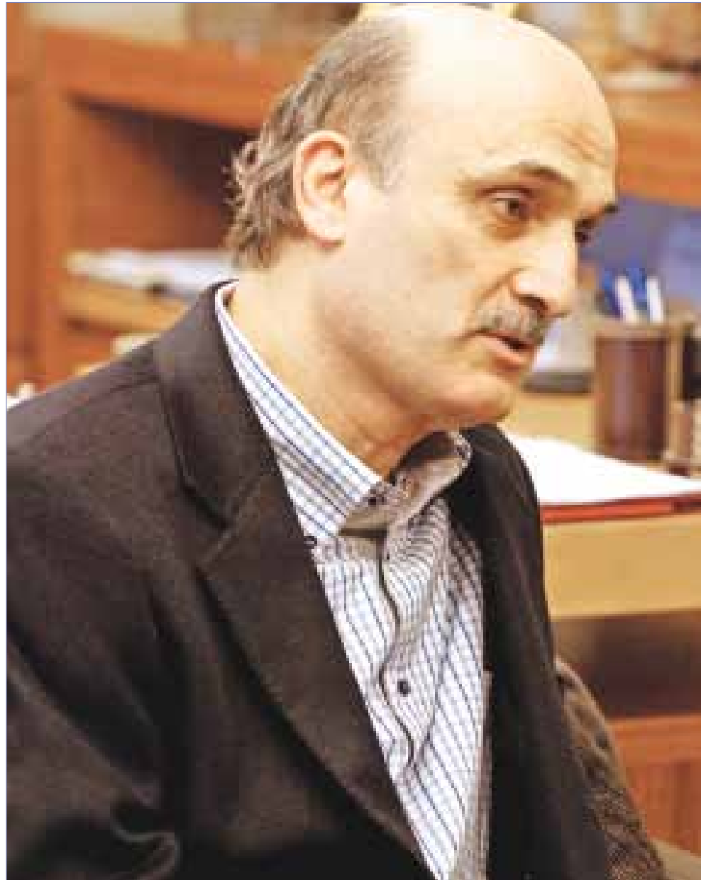
الحريري ليس بعيداً عن رأيي تجاه بري (ارشييف)

ويصف ما حصل في سجن رومية بأنه «غير مقبول على الإطلاق، ولا سيما أنها ليست المرة الأولى، ولا يمكن إعطاء أسباب تخفيفية، وكنت أفترض أن وزارة الداخلية محتاطة، لكن أن يكون أمر السجن من أصحاب السوابق، فهذه لامبالاة وإهمال فاضحان. فهل سجن رومية هو صحراء نيفادا حتى لا يمكن اتخاذ إجراءات فيه. من ناحية أخرى، لا يجب قضائياً أن يبقى فيه متهمون من دون