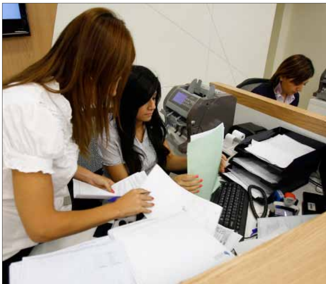
حوافز تمكين المرأة تريحها وتزيل العنصرية التي تحيط بوجودها الاقتصادي

9 آلاف كيلومتر تقريباً هي المسافة بين لبنان واليابان. البلدان يختلفان على نحو هائل، ولكن كلاهما يشتركان في ميزة هي أساسية لتحديد مستقبلهما. المجتمعان يشيخان ويحتاجان إلى إشراك المرأة أكثر في النشاط الاقتصادي