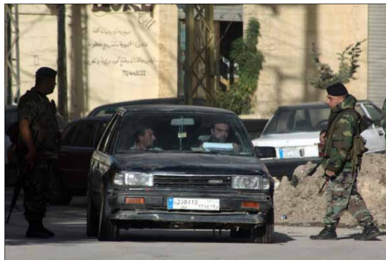
انتشرت الحواجز على الطريق الدولية وداخل الأحياء (الأخبار)

لم يكن توقيت انطلاقاً الخطة الأمنية في بعلبك - الهرمل خفياً على أحد، ذلك أن الملامح السياسية والأمنية لتلك العملية ارتسمت قبل أيام. فمن تلبية المجالس البلدية والاختيارية وعدد من الفاعليات البقاعية دعوة الرئيس نبيه بري إلى عين التينة، إلى العملية الأمنية التي نفذتها مديرية استخبارات الجيش في بريتال وبيروت، وتمكنت خلالها من توقيف المدعو محمد. م، المطلوب بعدة مذكرات توقيف. وفي وقت ساد فيه الهدوء العملية الأمنية، التي خلت من أية طلقة نار أو ضربة كف، رصدت حالة ترقب لتحديد جدوى العملية، وما إذا كانت «شكلية» كما سابقاتها من العمليات الأمنية، أو أنها ستنفذ «بحزم ودقة».