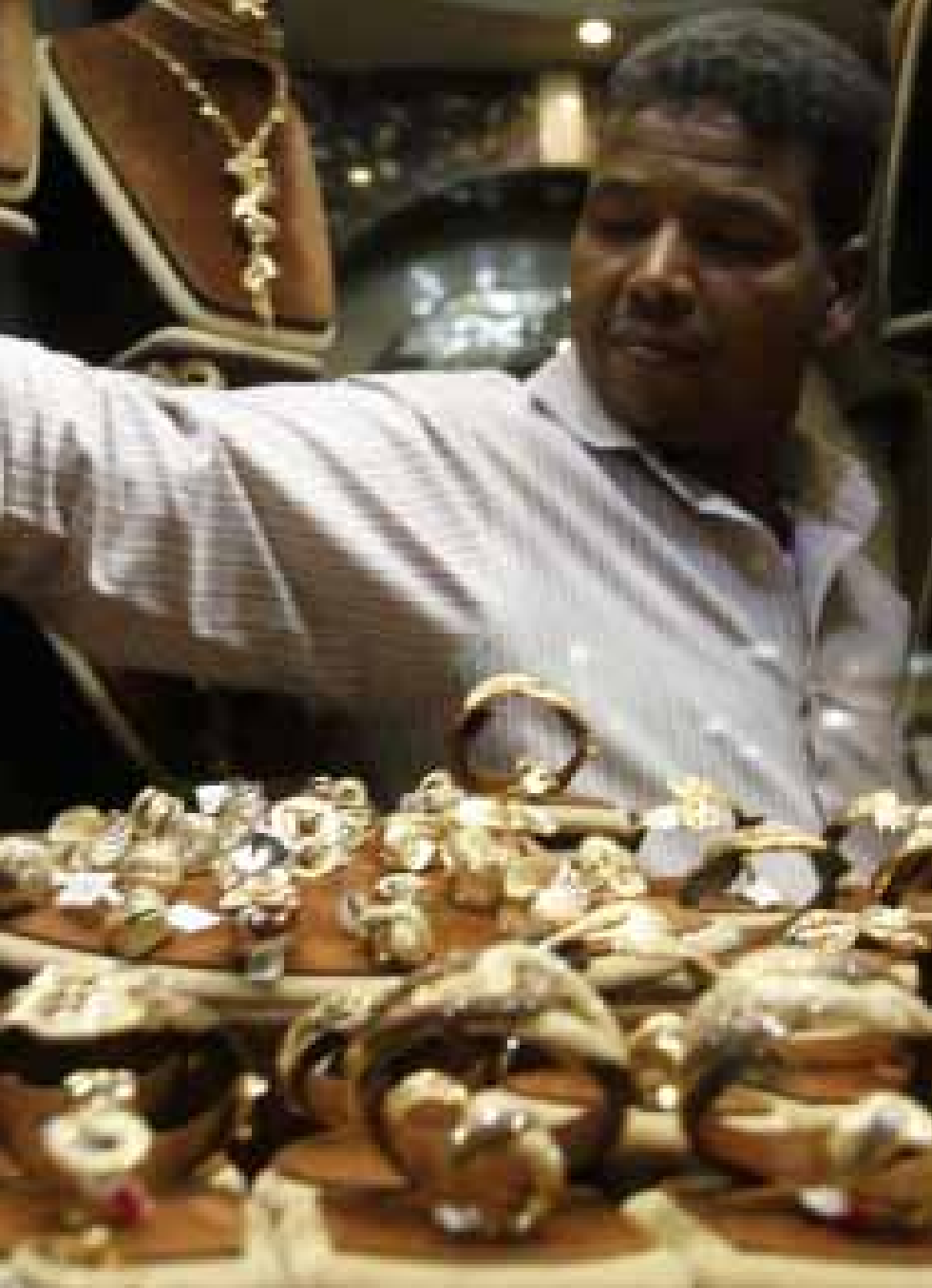
في خان الخليلي