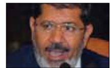
مرسي «بيوجيني»! «المنار» ■ 21:30