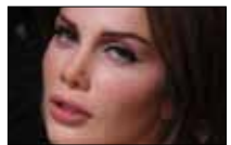
نيكول... عم تحلمي OTV ■ 20:30