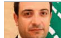
مأساة اسمها «اللاجئون» LBCI ■ 21:30

تطل الفنانة اللبنانية لاميتا فرنجية (الصورة) في برنامج «زهرة الخليج» اليوم لتناقش تفاصيل جديدة عن حياتها الخاصة وأحدث أعمالها. ويتخلل الحلقة تعريف بنوع جديد من رياضة «البيلاتيس» ومعلومات عن اتيكيت التصرف في الحدائق العامة.