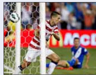
ديميسي مسجلاً