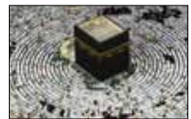
ثقافة الإسلام «الميادين» ■ 21:30