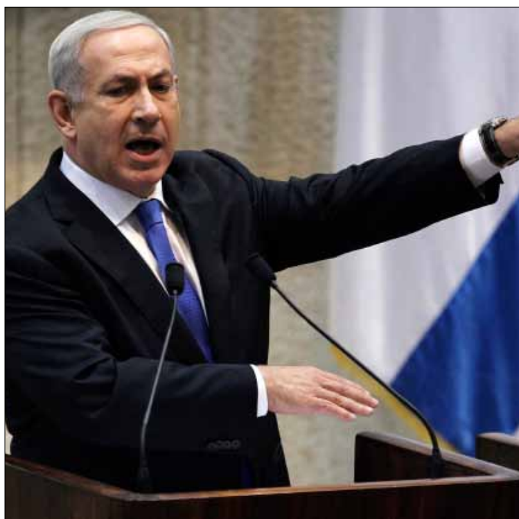
نتنياهو يخطب أمام الكنيست في القدس المحتلة أول من أمس

وتناول خلال لقائه مع السفراء الأوروبيين، الموضوع الفلسطيني، واعتبر أن المسار الفلسطيني الأحادي في الأمم المتحدة، للمطالبة بقبول فلسطين دولة غير عضو، سيضع عقبات أمام التوصل إلى حل. ودعا الدول الأوروبية