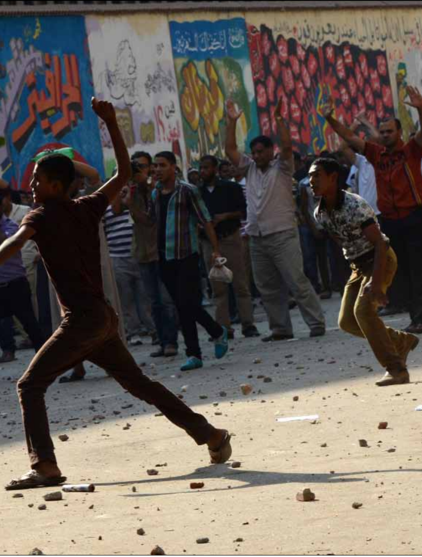
شباب الإخوان يعدون مشروع لائحة داخلية جديدة للعرض على مكتب الإرشاد

حالة الاستياء بين شباب الإخوان المسلمين من أداء الجماعة أخذة في التصاعد، وآخر فصولها الكشف عن انشقاق 600 شاب بالتزامن مع استعداد العشرات من أبناء قيادات بارزة في الإخوان للانضمام إلى حزب عبد المنعم أبو الفتوح