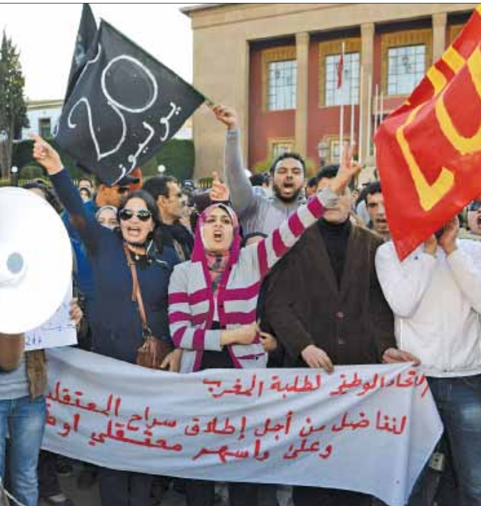
من التظاهرات الشبابية في المغرب (فاصل سينا - اف ب)

الحلم والواقع، الأول يحتاج إلى الكثير من