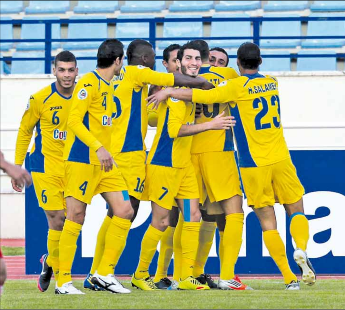
سكنون مهمة الصفاء صعبة في الكويت (عدنان الحاج علي)

يسعى ممثلا لبنان الأنصار والصفاء إلى تعويض الانطلاقة المخيبة في الجولة الأولى لكأس الاتحاد الآسيوي لكرة القدم، رغم صعوبة المهمة في الجولة الثانية، حيث يستضيف الأنصار فريق أربيل العراقي، فيما يحل الصفاء ضيفاً على الكويت الكويتي