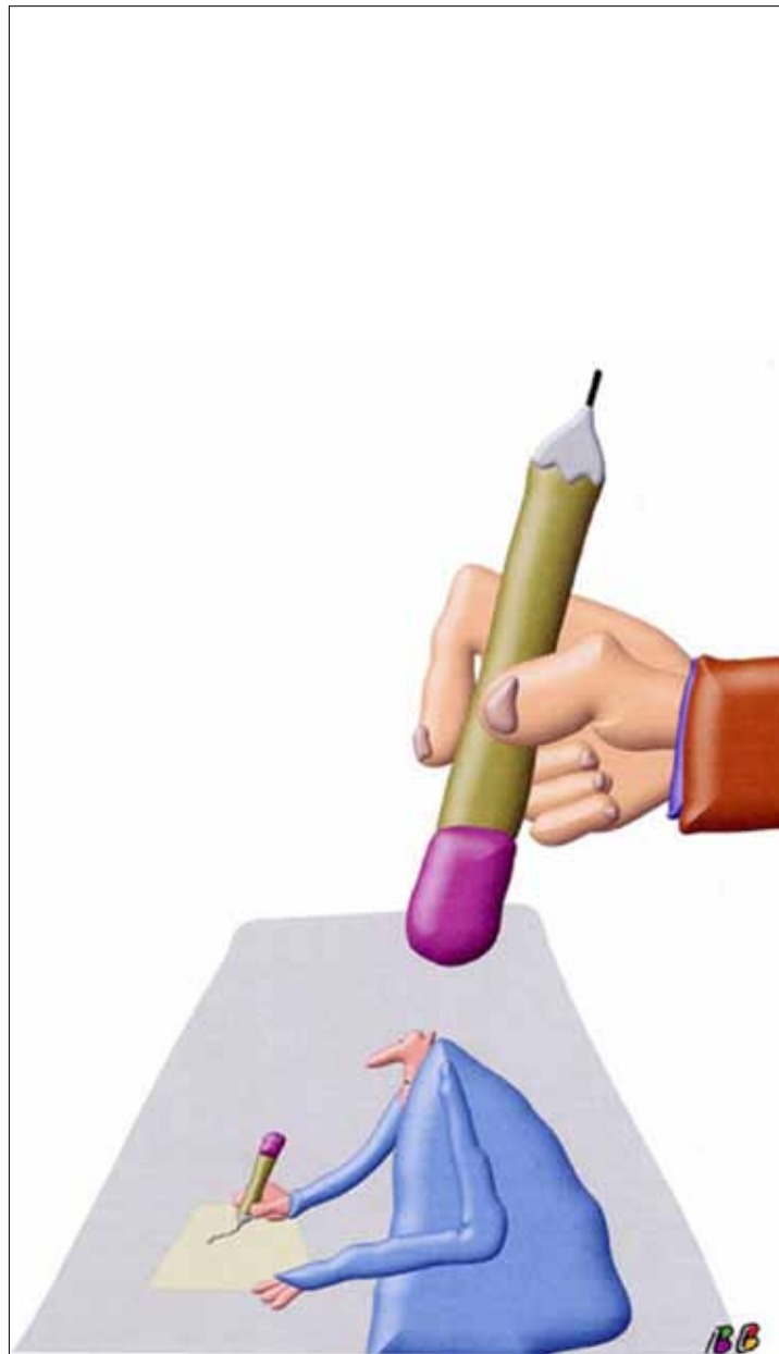
برنار بوتون - فرنسا

هذه الحرب الإعلانية - كما تُخاض حتى الآن - هي بوضوح لمصلحة إسرائيل. ليس فقط بسبب الشعبية التي تتمتع بها الحليفة التاريخية في الشارع الأميركي، ولا بسبب حرب «العقول والقلوب» المستمرة على «الإرهاب» منذ ثلاث عشرة سنة، بل أيضاً بسبب ضياع (بل قل سذاجة) الطرف الآخر ووقوعه في الفخ المحكم. في حربها الإعلانية على الأراضي الأميركية، حوّلت إسرائيل المعادلة من محاربة الفلسطينيين ومن صورتها ككيان محتل لا يختلف عن نظام الأبارتايد في ممارساته وسلوكه، إلى محاربة «الجهاد». باختصار، لقد أدركت المجموعات الساهرة على مصالح إسرائيل في أميركا سريعاً أنّ «الجهاد» بات منذ عام 2001 أشبه بـ «بضاعة رتيحة» أكثر من شعاري «حق اليهود بدولة» و«حق إسرائيل في الدفاع عن وجودها». في