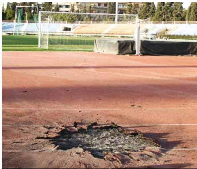
آثار إحدى القذائف على ملعب تشرين

مع الطليعة دون اهداف ليرفع الاول رصيده الى 7 نقاط في المركز الثالث مقابل نقطتين للثاني في المركز السادس.