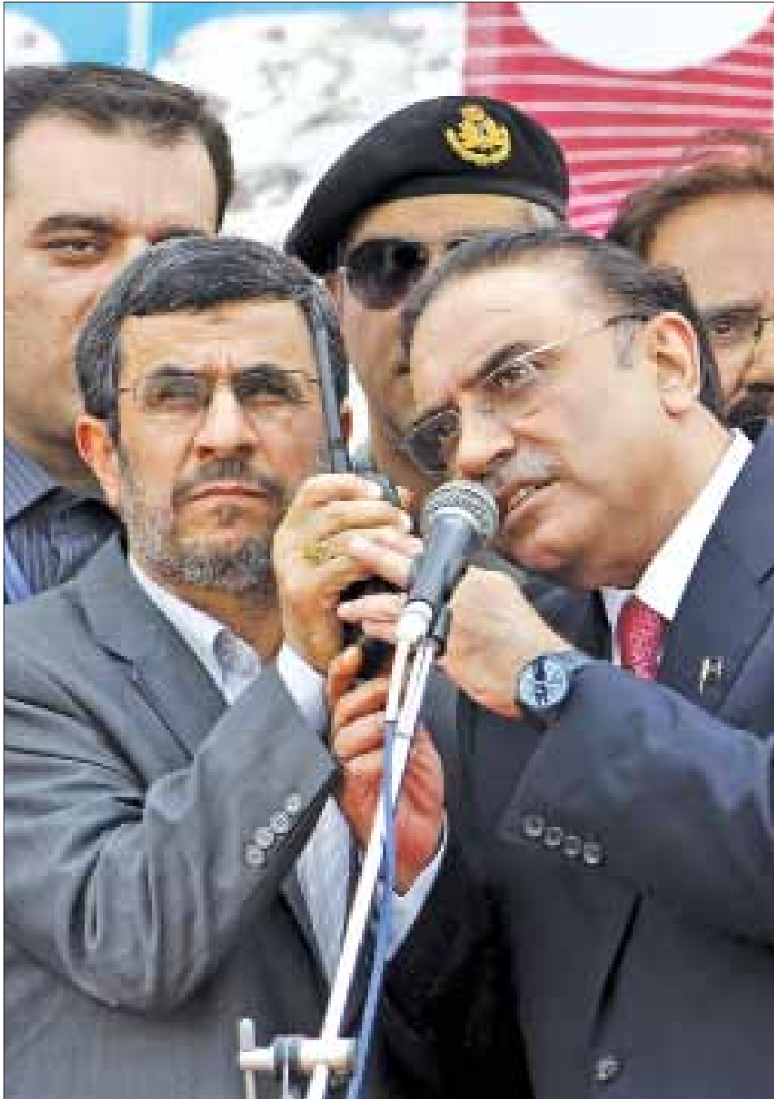
نجاد وزردي يدشان خط الجديد لنقل الغاز

لكن الأهداف البعيدة المدى تبدو أكثر تجديراً: ربط المنطقة بشبكة من المصالح الاقتصادية، بما يدفع بها نحو وحدة عضوية محورها إيران والعراق. اليس هذا ما حصل في ما يعرف حالياً بالاتحاد الأوروبي في خمسينيات القرن الماضي. ألم تؤد اتفاقية الحديد والصلب وشبكات