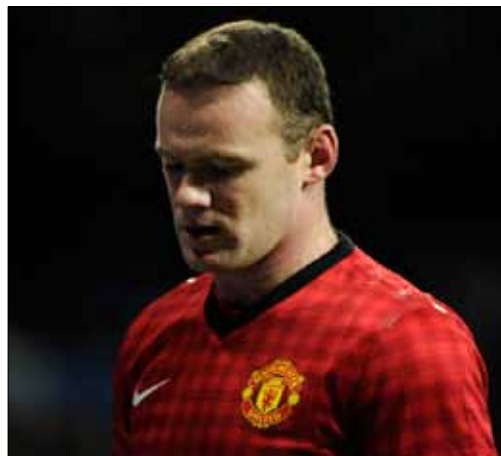
واين روني

بايرن ميونيخ كان محور الاهتمام أمس، حيث اعتبر «القيصر» فرانتس بكنباور، أنه سيكون سعيداً جداً في حال انضمام واين روني إلى البافاري، أما الرئيس أولي هونيس فكشف أن النادي حاول مراراً التعاقد مع أرسين فينغر