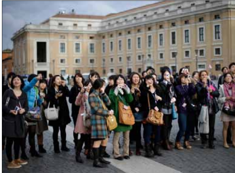
سينعزل الكرادلة عن العالم لمدة 4 أيام تقريباً قبل إعلان النتائج

115 كاردينالاً يبدأون اليوم عملية معقدة لانتخاب البابا، وسط انقسامات بين كتل إصلاحية وأخرى يقودها «الرومانيون»، ومع انحسار المنافسة بين مرشحين اثنين