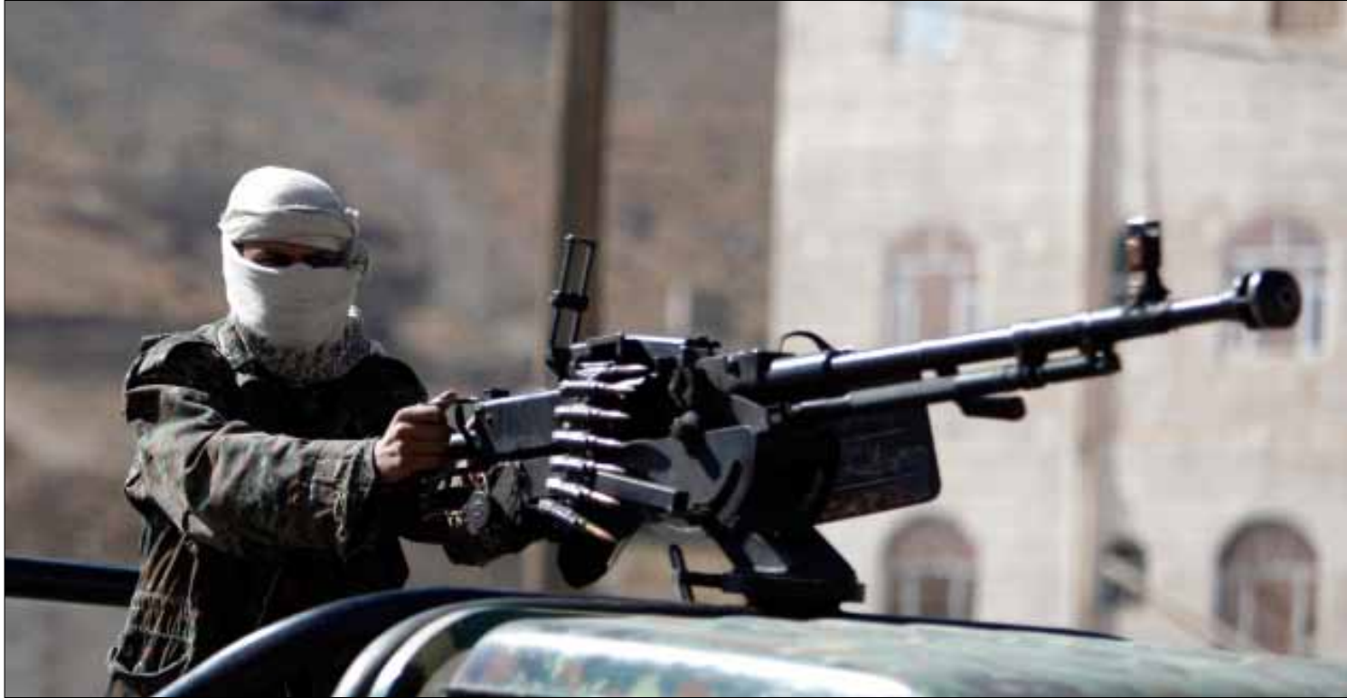
الاجراءات الأمنية لم تحل دون اغتيال عدد من كبار الضباط اليمنيين

فتاوى باستهداف ضباط الأمن القومي والسياسي