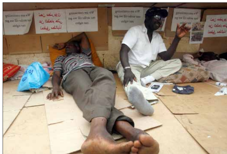
طالب المعتصمون بالإفراج عن زميلهم وإعادة فتح ملفاتهم

أن «ميزانيتها لا تسمح». في المقابل، يشكك مصدر في الأمن العام في كون اسحق «لاجئاً» لدى المفوضية، لأنه حين اعتقل لم يكن يحمل بطاقة لجوء. ويضيف إن الأمن العام سيبحث موضوع اسحق مع المفوضية. إلى موضوع اسحق، رفع المعتصمون السودانيون لافتات تطالب بإعادة فتح الملفات المغلقة، الأمر الذي تراه المفوضية «صعباً» كما أنّ هذا الموضوع يناقش مع كل لاجئ على حدة بما أنّ كل واحد منهم لديه وضع خاص، وإذا لم يكن هناك من تغير جوهر في وضع اللاجئين فلن يفتح ملفه مرة أخرى» بحسب سليمان. كما سجّل المعتصمون اعتراضهم على المساعدات التي تقدّمها مؤسسة مخزومي، والتي يقولون إن وجدت فإنها شحيحة.