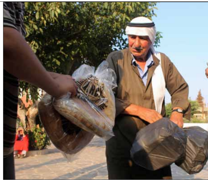
الحدود بين لبنان وسوريا هي المعبر الوحيد للصادرات اللبنانية