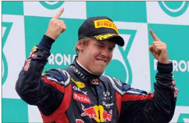
سيباستيان فيتيل