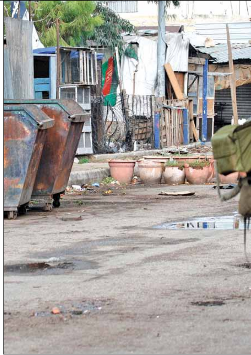
تؤكد المعطيات الأمنية وجود مئات المسلحين السوريين الذين ينتقلون بحرية على الأراضي اللبنانية (أرشيف)