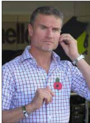
ديفيد كولتارد (أرشيف)

«هذا الامر لن يحدث وأنا غير متحمس لاكون ناقداً في الفورمولا 1». وأضاف: «أريد أن أكون قريباً من أسرتي فقط ولا أريد شيئاً آخر». من جهة أخرى، لم يخف البريطاني لويس هاميلتون، سائق «مرسيديس جي بي»، أن ألونسو سيكون الغريم الذي يود التغلب عليه أكثر من أي سائق آخر في بطولة العالم، معتبراً أن الإسباني هو السائق الأسرع بين جميع سائقي الفئة الأولى وبأنه يريد الحكم على مستواه مقارنة به.