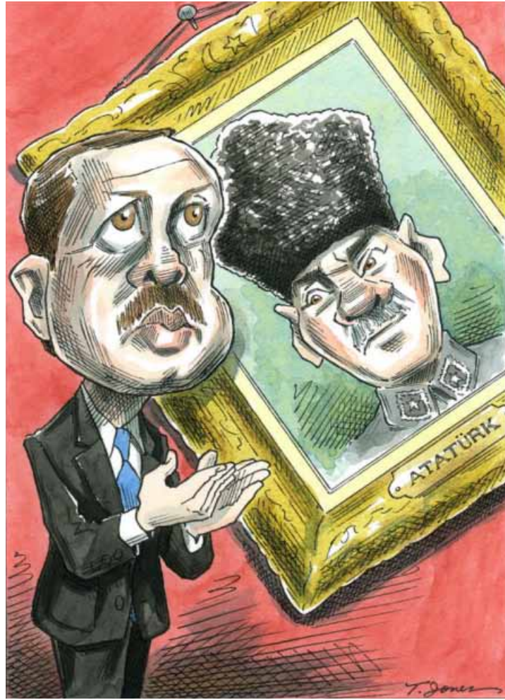
تاييلور جونز - الولايات المتحدة

طبعاً تكرر بعض الجمل التي أطلقها أردوغان بحق الرئيس السوري بشار الأسد عند اندلاع الانتفاضة السورية، جعل الإعلام السوري الرسمي يكشف عن رغبته بالتشقي من «حزب التنمية والعدالة» الإسلامي لكن بطريقة مراهقة تعتمد إعادة نفس الجمل التي سبق أن قالها رئيس الوزراء التركي، ثم بفتحه استديو البث المباشر للفضائية السورية لانتقاد فتح خراطيم المياه على المتظاهرين ورشهم بمادة الفلفل! في السياق نفسه، كانت الإخبارية السورية على وشك وضع فواصل من ديكات شعبية احتفاءً بهبوب رياح «الربيع التركي»، فيما فتحت «الميادين» بثها المباشر لتغطية ميدان «تقسيم» مع وجود فريقها هناك، وهو ما فعله تلفزيون «العالم». لكن النكتة الأكثر مدعاة للضحك كانت تلك التي نسبها التلفزيون السوري لوزارة الخارجية والمغتربين التي نصحت مواطنيها السوريين بعدم السفر إلى تركيا حفاظاً على سلامتهم بسبب تردي الأوضاع الأمنية هناك! ربما لم تسمع بعد وزارة الخارجية بملايين النازحين السوريين وأوضاعهم المساوية كل هذه الشماتة والسخرية في وسائل الإعلام الداعمة للنظام السوري، تعاطت «الجزيرة» و«العربية» بخفر مع التظاهرات، كأننا بهما تقولان: «بلاش إحراج»!