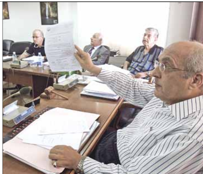
الاشتباك حول تأليف وفد لم يكن الأول في الضمان (هيثم الموسوي)

الشركة ووزارة الطاقة والمياه اللبنانية. وتؤكد مصادر مؤسسة كهرباء لبنان أن الباخرة الثانية يُفترض أن تبدأ الإنتاج في 12 حزيران، وقد اتخذ مجلس الإدارة قراراً في هذا الشأن؛ (إذا تأخرت عن هذا الموعد تكون قد أخلت بالعقد وتُطبق البنود الجزائية). تفيد غير أن معلومات «الأخبار» تفيد بأن الشركة التركية أبلغت الجانب اللبناني أن الباخرة الثانية لن تحترق