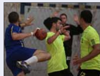
من مباراة حارة صيدا والإطفاء