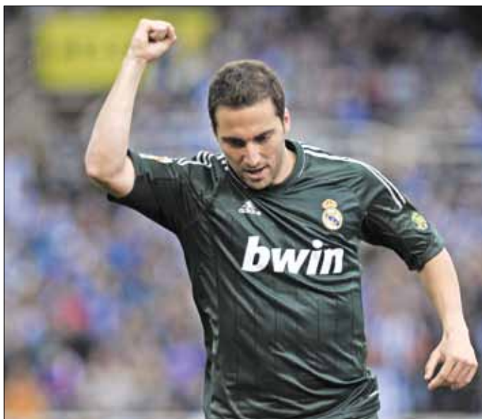
الأرجنتيني غونزالو هيغواين

اهتمامه بالدولي الألماني أيضاً. وأفادت «ذا صن» أن بودولسكي يشعر بالراحة في لندن، إلا أن أرسنال قد لا يمانع في التخلي عن خدماته في حال حصوله على عرض ضخم مقابل المهاجم الذي لمع في موسمه