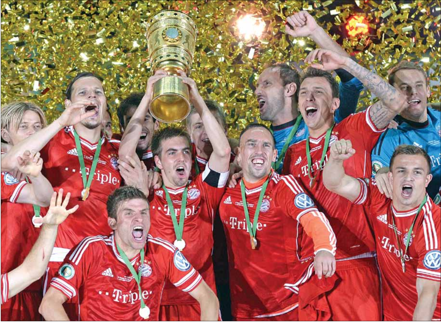
اصبح بايرن ميونيخ سابق فريق في التاريخ يحرز الثلاثية في موسم واحد