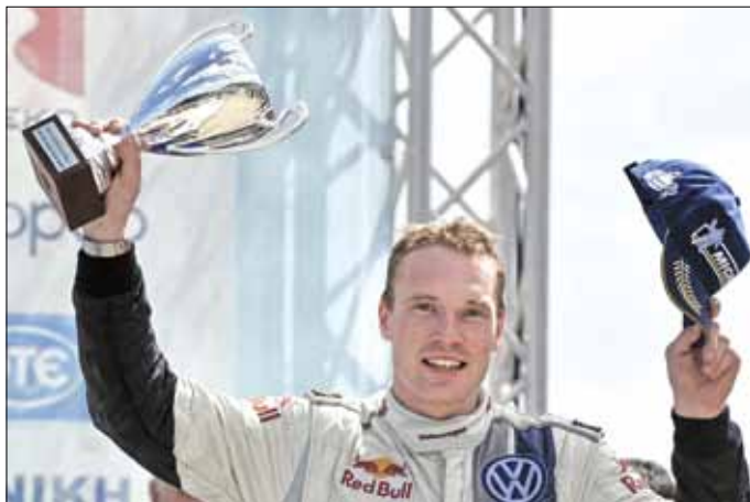
لاتفالا بعد تنويجه بالمركز الأول في رالي أكروبوليس

وجاء البلجيكي تيبيري نوفيل (فوردي فيستا آر أس) ثالثاً أمام النروجي اندرياس نيكلسن (فولكسفاغن بولو آر أس) والقطري ناصر العطية (فوردي فيستا آر أس) الذي حل خامساً للمرة الثالثة هذا الموسم،