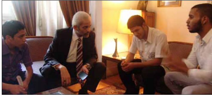
الوزير خلال لقاء مع شباب من حزب «التوحيد العربي»

درجة دفعت القوى الأمنية إلى تهريبه عبر مرأب المبنى، كما رصد عدد من المتظاهرين قيام أفراد من داخل نوافذ وسطوح مقر الوزارة بتدوين أسماء المشاركين في الوقفة، ما عده البعض «عودة إلى النظام الأمني القديم»، هاتفين ضده «صور صور يا صفرورة». احنا الأصل وانتو الصورة»، على خط مواز، لعل أبرز ما شغل الرأي العام هو الكلام الذي وجهه الفنان عادل إمام إلى وزير الثقافة، خلال مداخلة هاتفية في برنامج «مصر الجديدة» على قناة «الحياة 2» أول من أمس. رسالة شديدة اللهجة توجه بها «الزعيم» إلى الحكومة المصرية، قائلاً: «هاتوا لنا حد يفهم في الثقافة»، مضيفاً «مين اللي جابه ده؟ نحن نفهم في الفن والثقافة أكثر منه». ودعا إمام وزير الثقافة إلى الابتعاد «عن الثقافة وسيبنا في حالنا، أو خذ القطار من الإسكندرية إلى أسوان وانزل القرى والنجوع والمدن وشوف إزاي الشعب المصري الفن مزروع فيه».