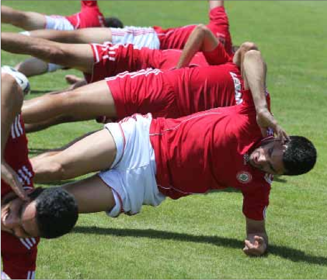
لاعبو المنتخب خلال التمرين (عدنان الحاج علي)

خاض منتخب لبنان تمرينه قبل الأخير استعداداً للقاء كوريا الجنوبية غداً عند الساعة 20,30 على ملعب المدينة الرياضية، ضمن تصفيات كأس العالم. ويستعيد الكوريون ذكريات 15 تشرين الثاني 2011 حين خسروا في بيروت، فيما الأمور مختلفة تماماً لبنانياً