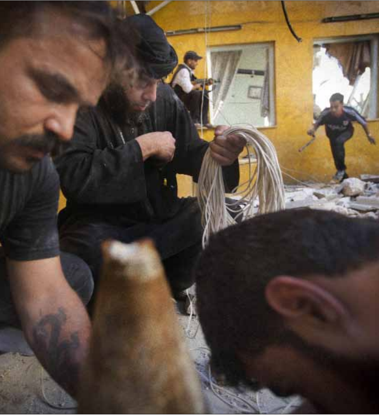
«سمعنا صيحات التكبير من جي جوبر القريب، قبيل الانفجار وبعده» (أ ف ب)