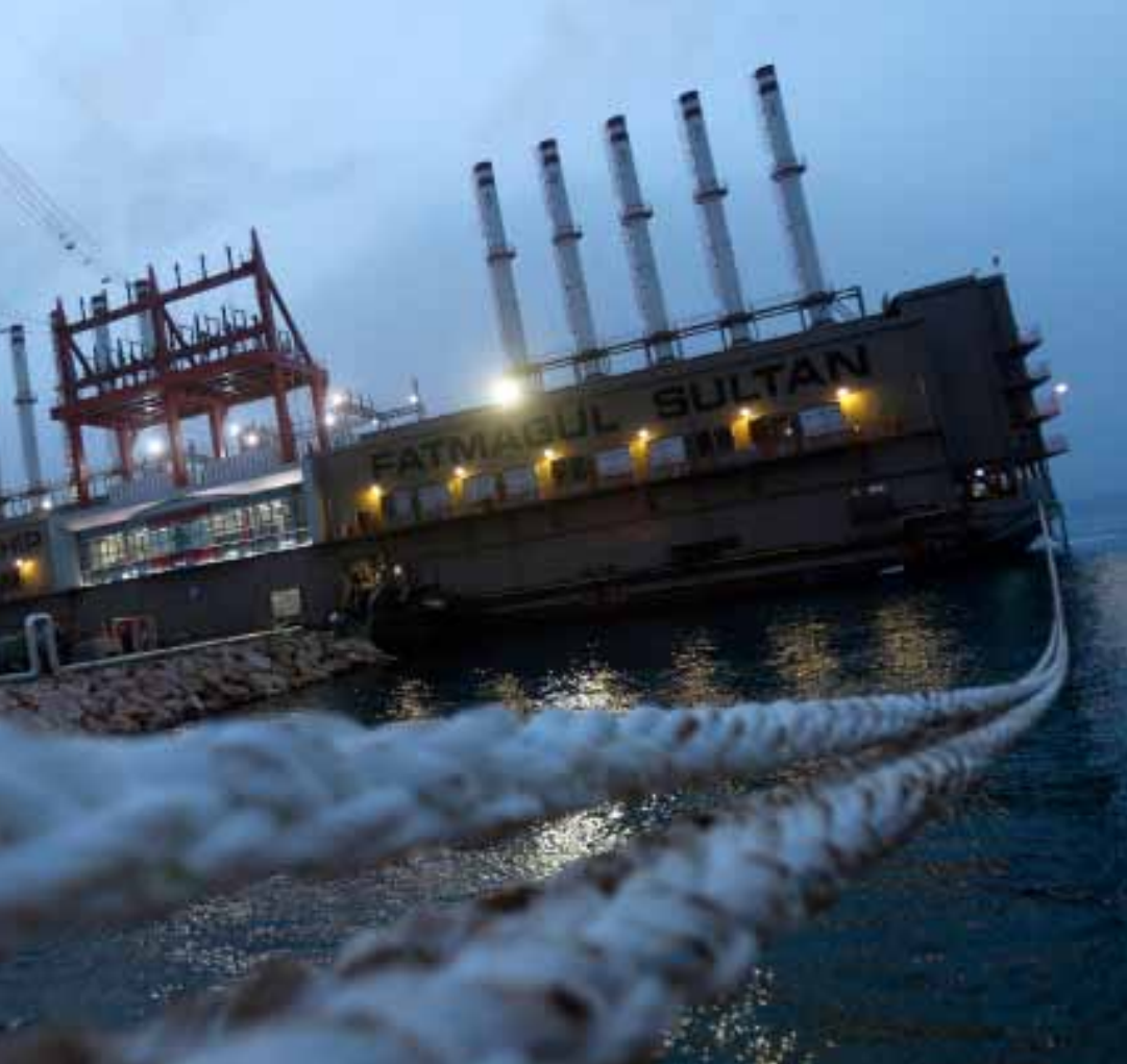
عانت باكستان مع «كارادينيز»، وتطلب الشركة اليوم تعويضاً بقيمة 600 مليون دولار في إطار تحكيم دولي

آخر مرة تحدّثت فيها «كارادينيز» عن تفاصيل مغامرتها اللبنانية كانت في منتصف أيار الماضي. حينها، والمناسبة إعلان انتهاء إصلاح مولدات «فاطمة»، قالت: إنّ باخرة الطاقة الثانية التابعة لشركة كارادينيز تُعتبر قيد الإنشاء حالياً وهي ستبحر باتجاه السواحل اللبنانية حيث سترسو قبالة معمل الجبّة للبدء بإنتاج الطاقة بدورها وفق الموعد المحدد في العقد الموقع بين