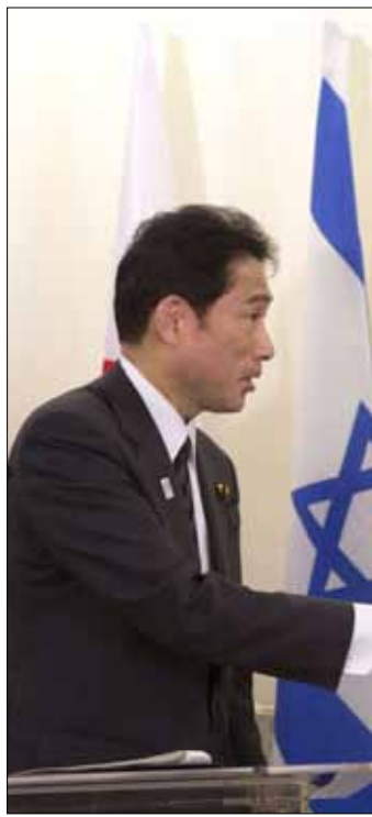
نتنياهو هو خلال لقائه وزير الخارجية الياباني في القدس المحتلة أمس