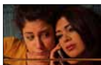
الدراما «محلقة» Ibci ■ 20:30