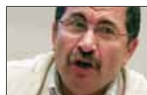
انتصار المقاومة تحت مجهر أمين حطيط «المنار» ■ 21:30