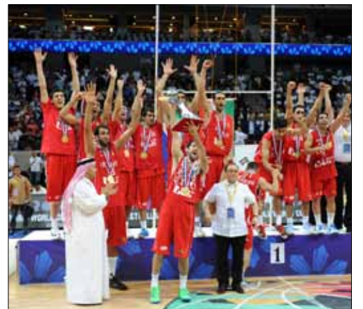
لاعبو منتخب إيران مع كأس آسيا

توج المنتخب الإيراني بطلاً لآسيا على وقع احتفالات جمهوره وحسرة الجمهور اللبناني، الذي تابع البطولة السلوية، التي كشفت مستوياتها قدرة لبنان على التأهل الى كأس العالم وحتى احراز اللقب القاري