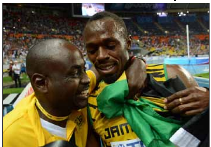
مشجع جامايكي يحتضن بولت بعد فوزه بسباق 100 متر

وشغرت الكرواتية ساندر بركوفيتش بذهبية رمي القرص محققة 67,99 م، ومتفوقة على الفرنسية ميلينا روبر - ميشون (2,01 دقيقة).