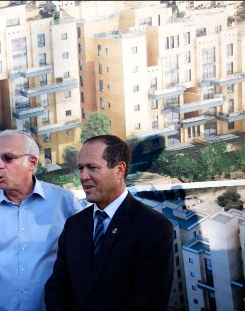
وزير الإسكان ورئيس بلدية القدس المحتلة خلال الإعلان عن البناء الاستيطاني

بالتزامن مع قرار تحرير 26 أسيراً فلسطينياً اليوم وعشية اللقاء التفاوضي بين الوفدين الاسرائيلي والفلسطيني في القدس المحتلة الأربعاء، أعلنت اسرائيل البناء الفوري لـ1200 وحدة سكنية، في الاحياء اليهودية في القدس الشرقية والكتل الاستيطانية