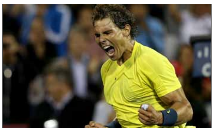
نادال مطلقاً فرحته بعد إقصائه ديوكوفيتش

نادال الموقف في الشوط الفاصل للمجموعة الثالثة فتقدم 0-6، ثم أنهاه 7-2. وحرّم الإسباني بالتالي منافسه من لقبه الثالث على التوالي، والرابع في مونتريال بعد 2007، وأوقف أيضاً انتصاراته المتتالية فيها عند 13. ولن تكون مهمة راونيتش سهلة لإيقاف نادال الذي سبق أن تغلب عليه في المواجهات الثلاث التي جمعت بينهما حتى الآن. دورة تورونتو بلغت الأميركية سيرينا وليامس