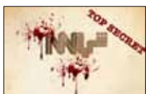
استوديو يا محسنين «الجديد» ■ 22:00