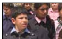
إرادة الحياة مباشرة على الهواء «المباشرين» ■ 20:30