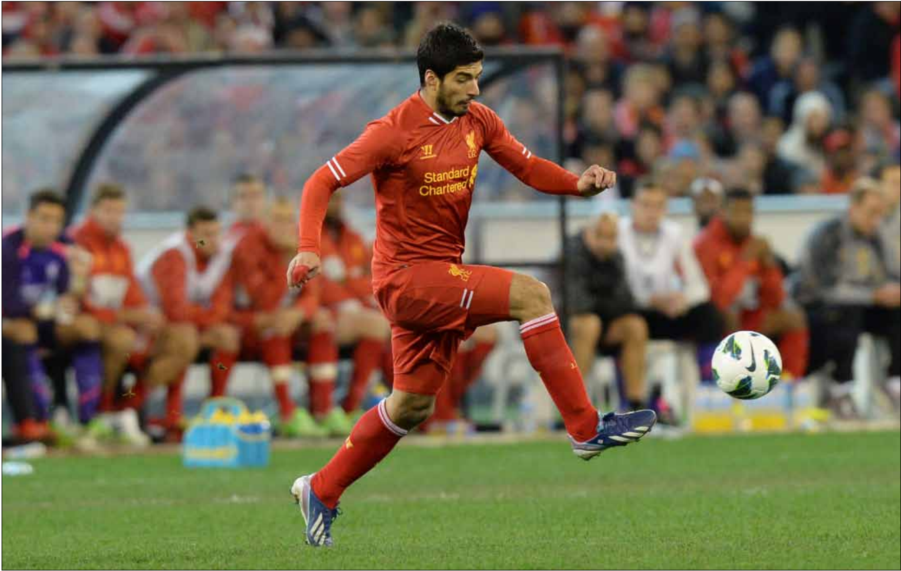
وقف ليفربول داعماً لسواريز في كل مشكلاته العنصرية والمسلكية

تفتح قضية لويس سواريز وغاريث بايل وكيفية تعاظيها مع نادييهما الباب على معادلة جديدة في كرة القدم، لكن المعادلة الأهم هي في إصرار نادييهما على عدم السماح لهما بالرحيل الا بقرارهما