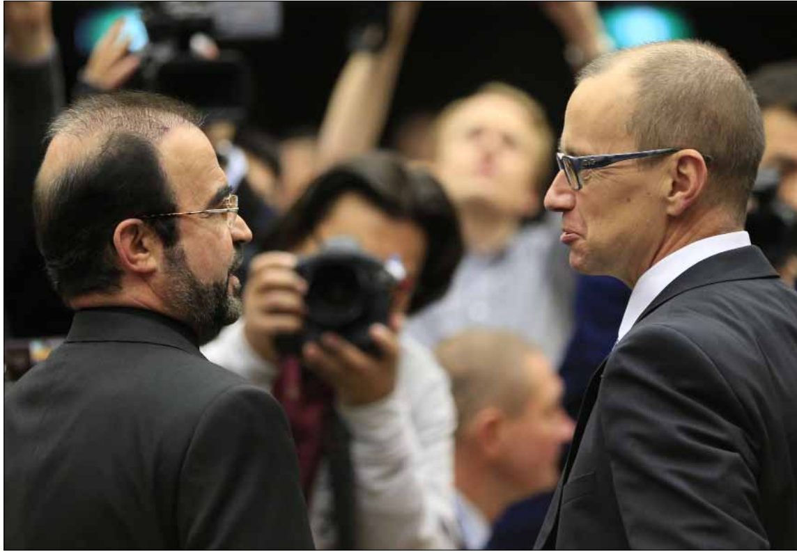
دعت إيران مفتشي الوكالة إلى زيارة منشأة «أراك» في 8 كانون الأول المقبل

سياسة المرونة الإيرانية تؤتي ثمارها داخليا وخارجيا