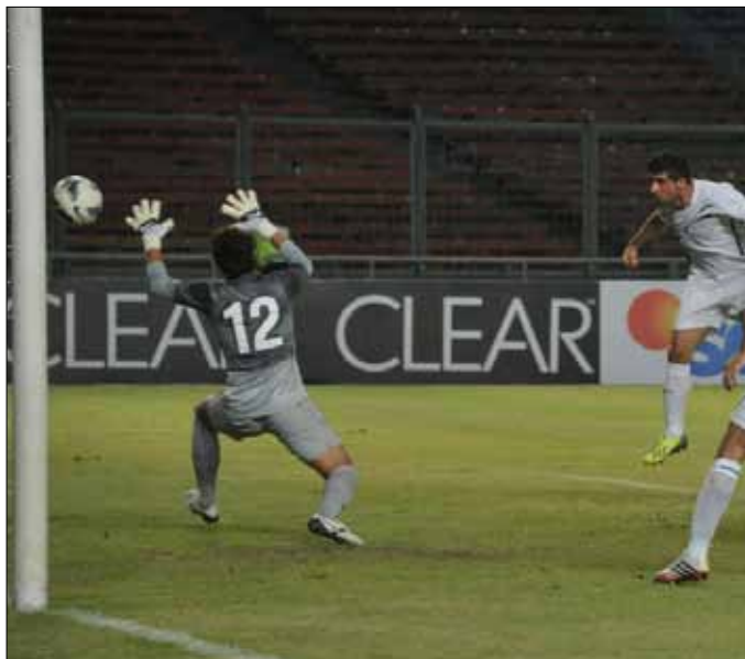
الصراع مستمر رغم سعي منتخب العراق للناهل إلى كأس آسيا

مسؤولية النادي صاحب الأرض والملاعب. فمباراة أمس يكون فيها المسؤول عن هذا الأمر إدارة الزوراء، وعلى الوزارة أن تطالب الأخير بهذه العائدات، لكن هذا الأمر له دوافع واضحة، وستتوضح أكثر فاكتر».