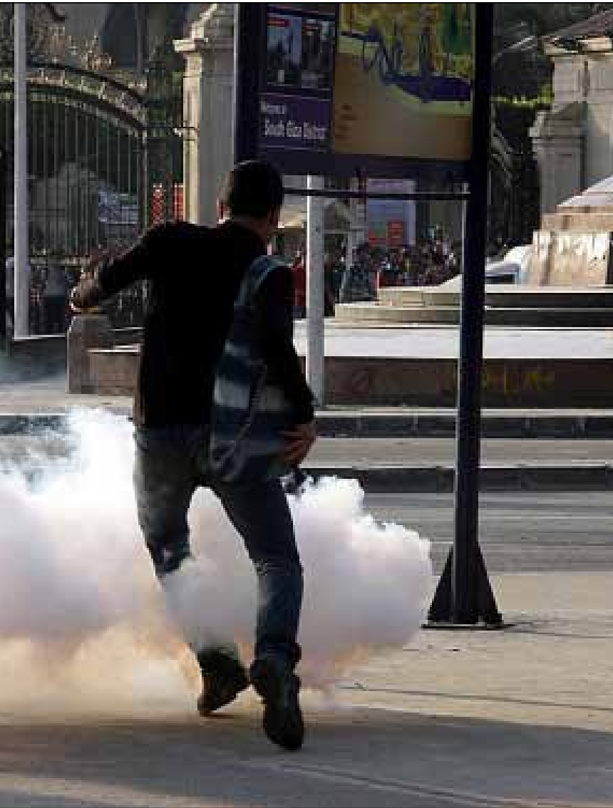
مقتل أول ضحية بعد اقرار قانون التظاهر في اشتباكات في جامعة القاهرة

قياديو «الإخوان» يحالون على المحكمة، والسلطات المصرية تتفنن في استهداف الجماعة المحظورة التي ما زالت ترفع مستوى تحديها للدولة وتطلق تظاهرات «غير مرخصة» وسط أنباء متضاربة حول مقتل أحد الطلاب