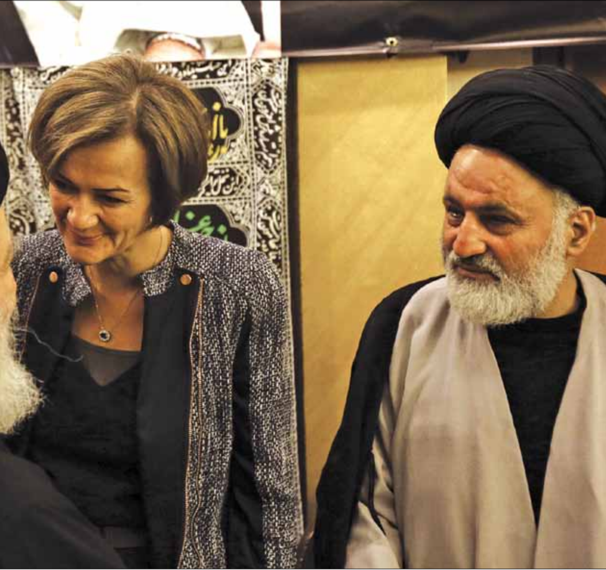
هل أعطت زيارات إيخورست لحزب إشارات عن رغبة أوروبية في التواصل معه؟ (مروان بوحميد)

لحقيقة ما يجري فعلياً، ومن أن تكون الدبلوماسية الغربية تسيير على إيقاع المفاوضات ورؤية واشنطن لدور إيران المحوري في الشرق الأوسط، بما ينتج في مرحلة لاحقة تطبيعاً للعلاقات الأميركية - الغربية مع حزب الله المدرج على لائحة الإرهاب.