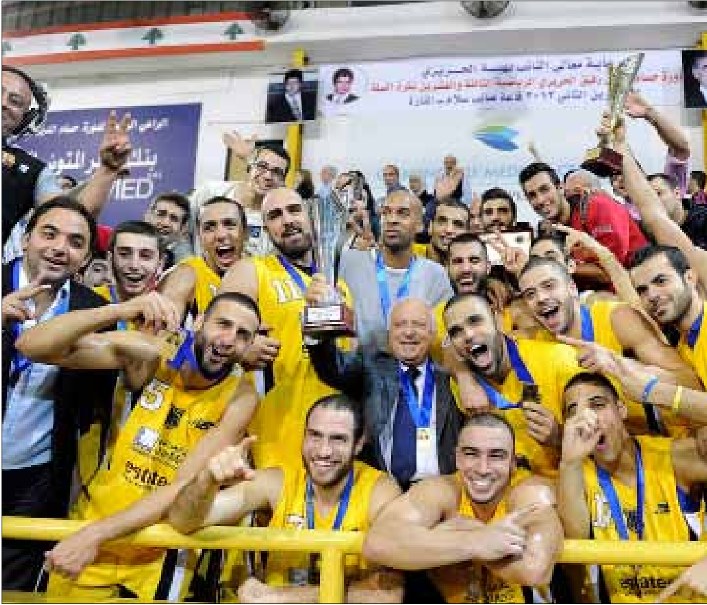
فريق الرياضي مع كأس الحريري

أحرز فريق الرياضي لقب دورة حسام الدين الحريري لكرة السلة للمرة الـ 13 بعد فوزه على المتحد في النهائي، في وقت يعيش الجمهور اللبناني حالة ترقب بانتظار ما ستؤول إليه أزمة ناديهم اليوم. فإما أن تحل أو تنفجر بشكل غير مسبوق