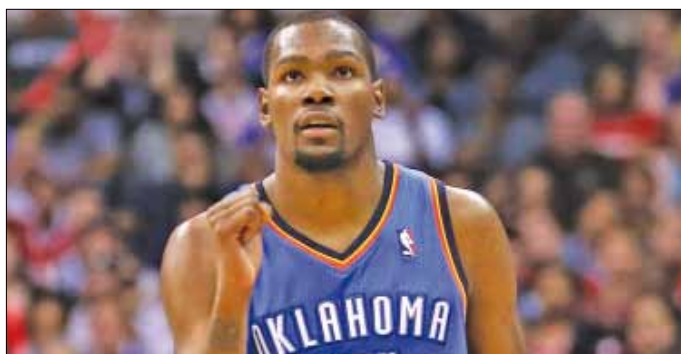
تالق دورانت امام سان انطونيو

وتابع انديانا بايسرز عروضه القوية وحقق فوزه الرابع عشر في 15 مباراة بفوزه على تشارلوت بوبكاتس 99-74.