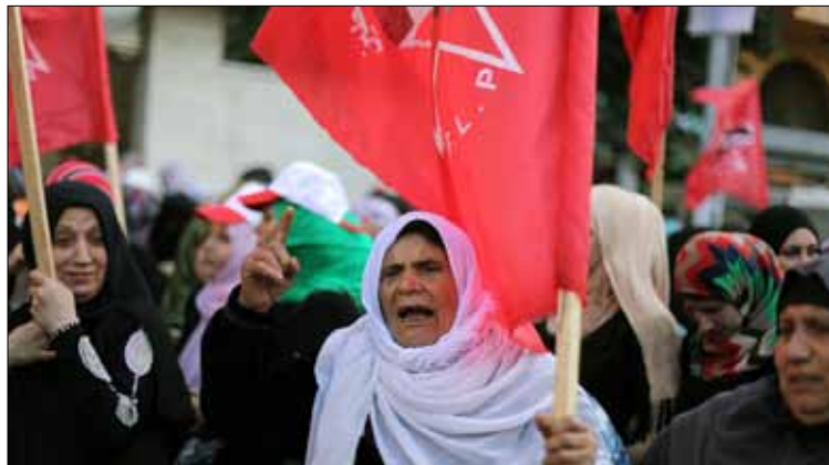
نظم أنصار الجبهة الديمقراطية لتحرير فلسطين تظاهرة في غزة رفضاً للمفاوضات

قتلت الثلاثاء ثلاثة متشددين فلسطينيين ينتمون إلى شبكة في الضفة الغربية مرتبطة بتنظيم القاعدة. ونفذت السلطة الفلسطينية التي تدير الضفة الغربية أن يكون للثلاثة أي صلة بالقاعدة، متهمه الإسرائيليين بالتخطيط لقتلهم. وقال مسؤول في جهاز الأمن الداخلي الإسرائيلي إن الجهاز علم من خلال عدد من الاعتقالات في وقت سابق أن الشبكة كانت تعتزم شن هجمات في الأيام المقبلة ضد أهداف إسرائيلية وضد السلطة الفلسطينية المدعومة من الغرب.