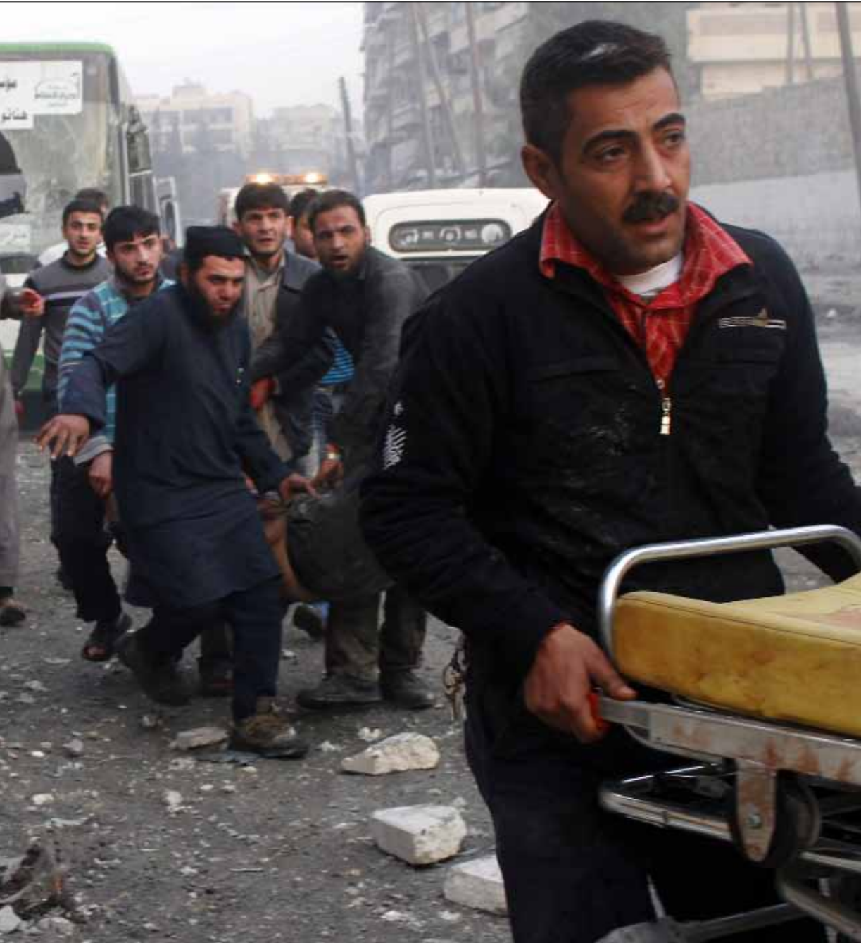
بعد غارة جوية على مناطق المعارضة في حلب أمس

يستمر التحرك الأميركي - الروسي - الأممي (الأخضر الإبراهيمي)، كل على حدة، مع أفرقاء المعارضة السورية والدول الداعمة لها، للحصول على التزامها غير المشروط بحضور مؤتمر «جنيف 2» في 22 كانون الثاني المقبل. وتكشف مصادر دبلوماسية أن تحديد موعد المؤتمر لم يأت نتيجة استطلاع رأي الدول الإقليمية المعنية بالملف السوري، بل نتيجة شعور الشريكين الروسي والأميركي بوجوب استغلال مناخ الاندفاع الدولية لحل الملفات الساخنة في المنطقة، وهو المناخ الذي