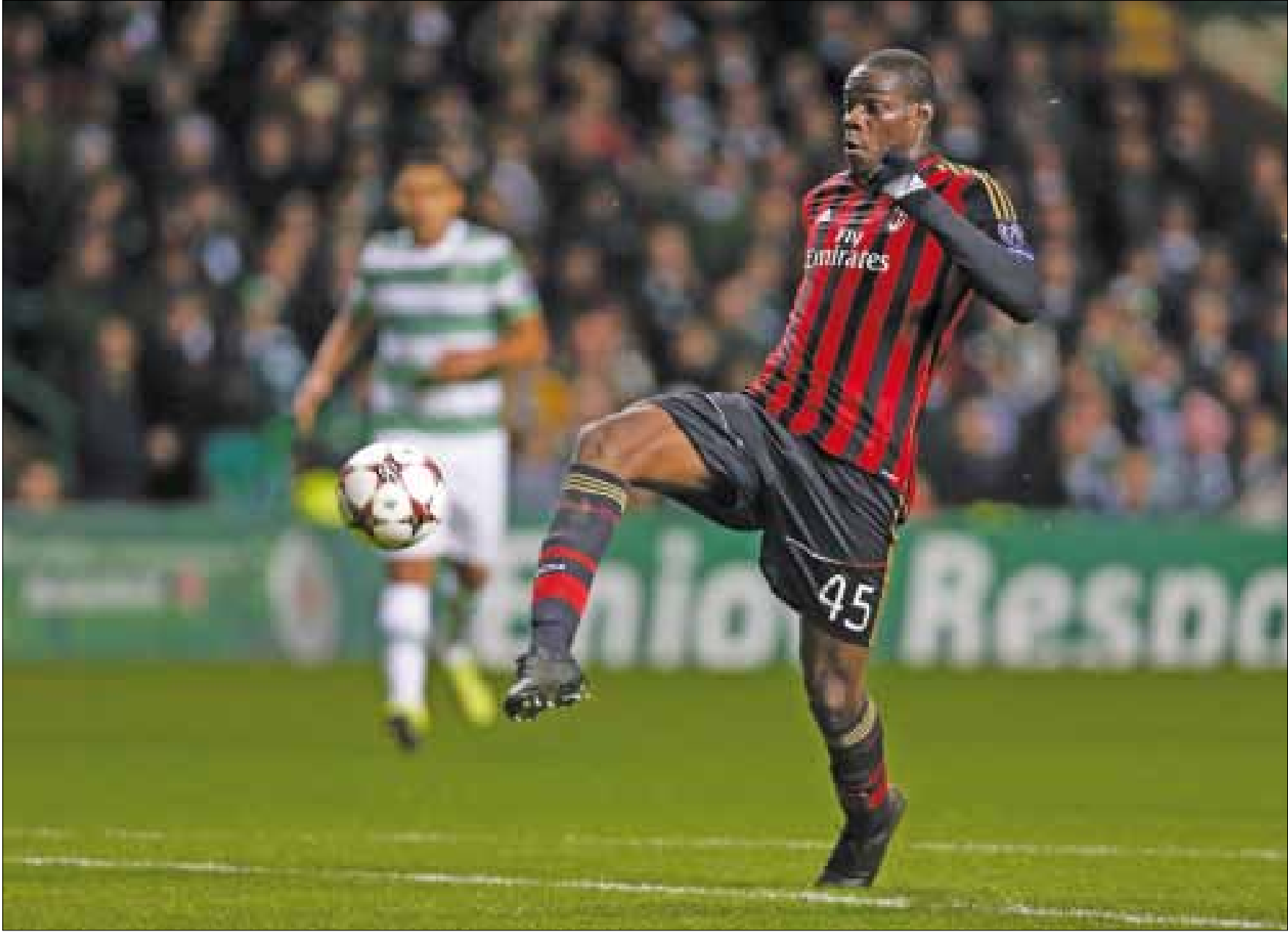
ماريو بالوتيلي