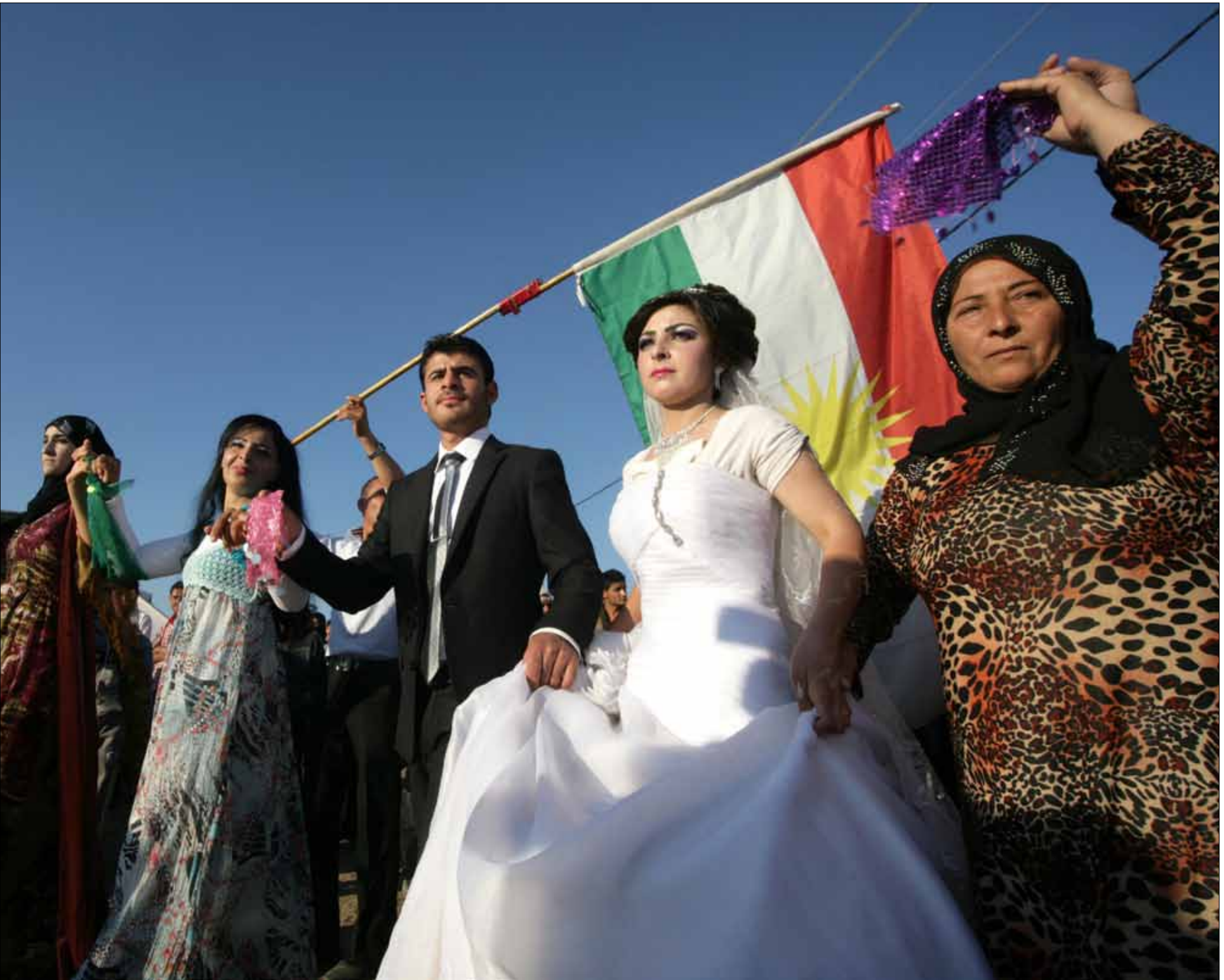
حتى منتصف القرن الماضي، كان يطلق على حي ركن الدين اسم حارة الأكراد (أ ف ب)

لا يقتصر الانتشار الكردي في سوريا على المناطق الشمالية الشرقية منها. إذ امتدّ تاريخياً، وبالتدريج، حتى وصل إلى مناطق في أقصى الشمال الغربي عند مدينة عفرين الحلبية. وفي الجنوب، كان للأكراد الدمشقيين وضعهم الخاص الذي جعل منهم «أكراداً من نوع آخر»