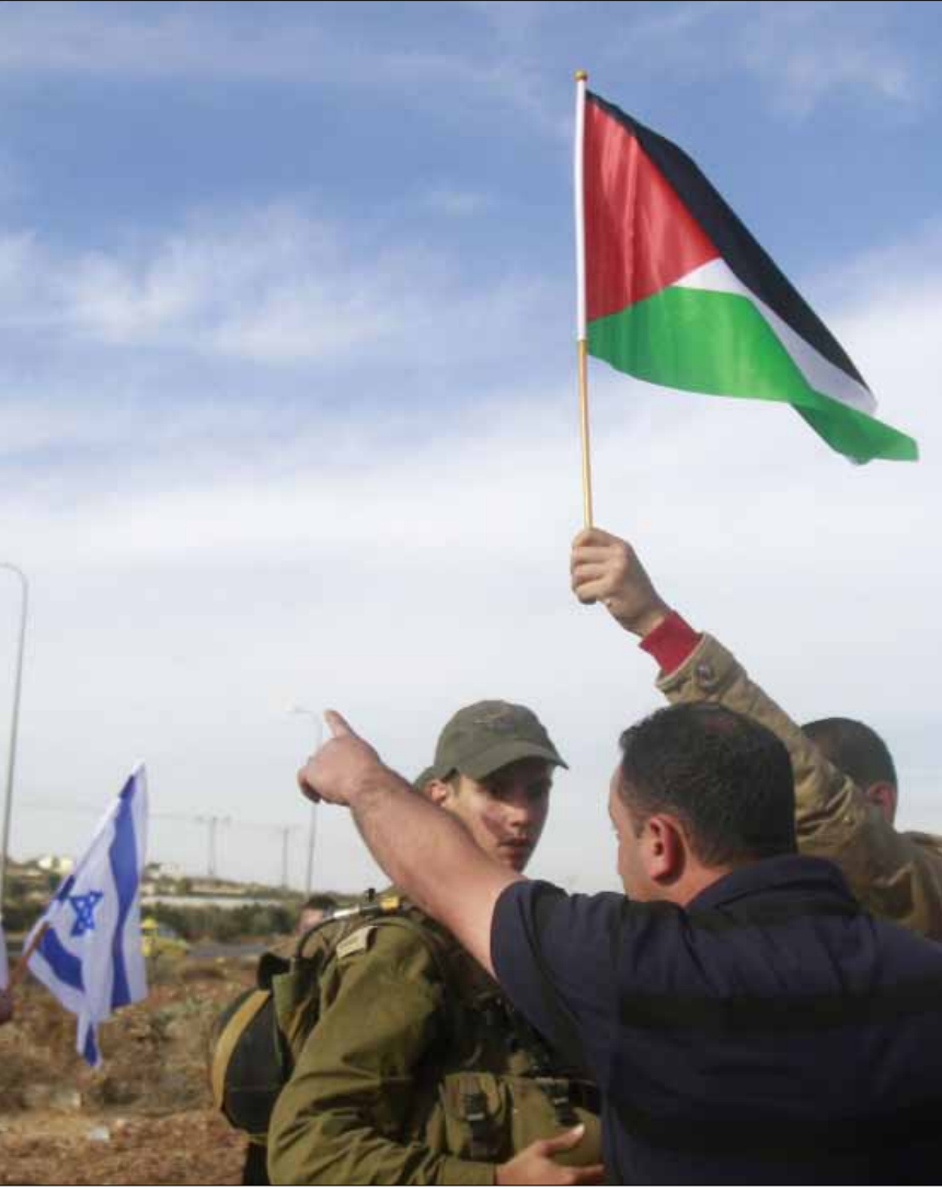
كثف فريق العمل هجومه على الفلسطينيين الذين يؤيدون قيام دولة واحدة ديموقراطية