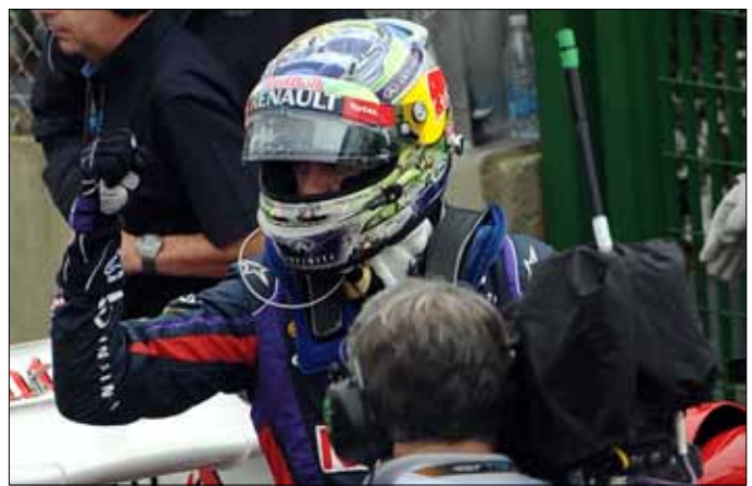
ارتدى فيتيل خوذة في سباق جائزة ألمانيا الكبرى

وجاء السائق الالماني في المركز الاول بحصوله على 248 نقطة متقدماً على الاسباني فرناندو الونسو، سائق فيراري، الذي جمع 213 نقطة، فيما