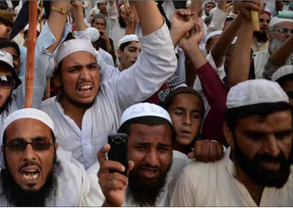
البرقاوي كان يعلم بسلام الشيوخ السلفيين الذي أوردته الزرقاوي ولكنه كان يرفضه