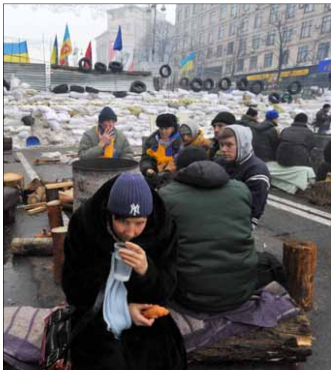
متظاهرون بالقرب من المناريس التي صنعوها

من جهة أخرى، أعلن المفوض الأوروبي المكلف بسياسة الجوار ستيفان فولي أن الاتحاد الأوروبي عرض أكس على