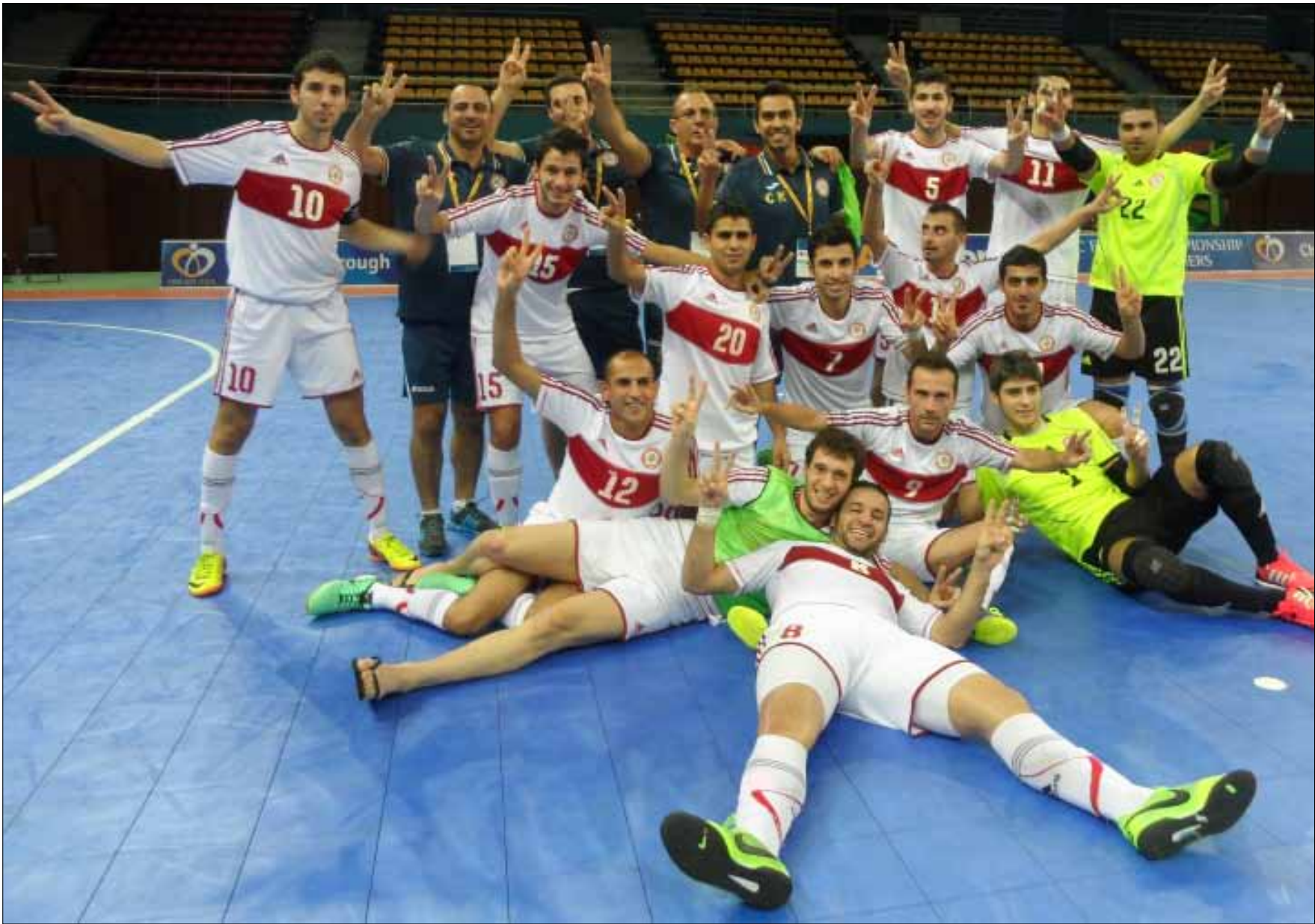
لاعبو منتخب لبنان وأفراد الجهاز الفني والاداري يرفعون شارات النصر احتفالاً بإنجازهم في تصفيات غرب آسيا