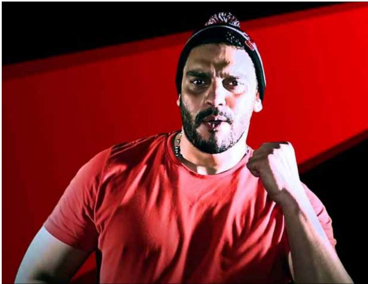
استعمل بلطي في أغنيته Pampam كلمات جنسية يستعملها التونسيون في الحياة اليومية