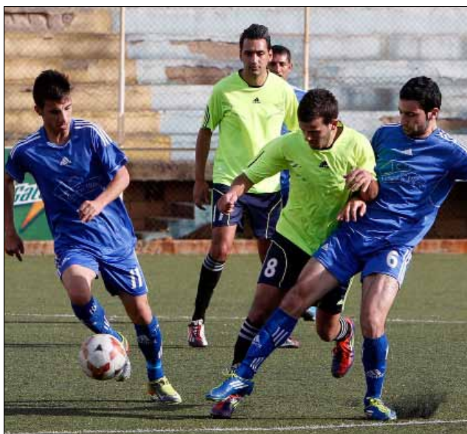
صراع في لقاء الخيول والأهلي النبطية (هيثم الموسوي)

زغرنا التاسع بـ 11 نقطة على ملعب الصفاء، وطرابلس، الثامن بـ 13 نقطة، مع العهد المتصدر بـ 24 نقطة في زغرنا عند الساعة 14، 15، والنجمة، الخامس بعشرين نقطة، مع الإخاء الأهلي عاليه، السابع بـ 15