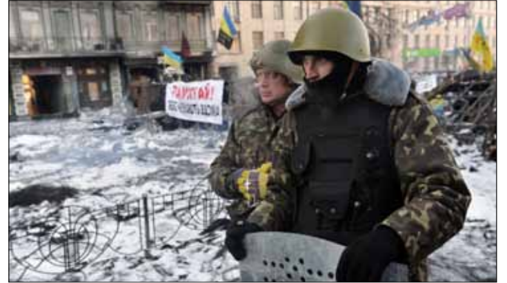
سفر نائب رئيس الوزراء الروسي من اجتماع كيري بالـ«ملاكم» والـ«مغنية»