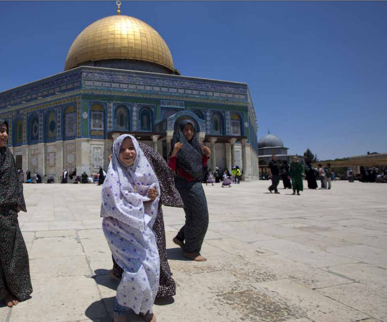
لم يتناول طرفا المفاوضات لحد الآن مسألة الحرم، التي تعتبر حساسة للغاية (أرشيف)

في المقابل، ذكرت صحيفة «يديعوت احرونوت» أن الأقوال التي نسبت إلى ننتياهو، تتعارض ليس فقط مع الكثيرين في الليكود، بل مع نفسه، عندما أعلن خلال الحملة الانتخابية على منصب رئاسة الوزراء عام 1999، في مقابلة مع القناة السابعة، «لن نقتلع مستوطنات، سنكافح من أجل كل قطعة