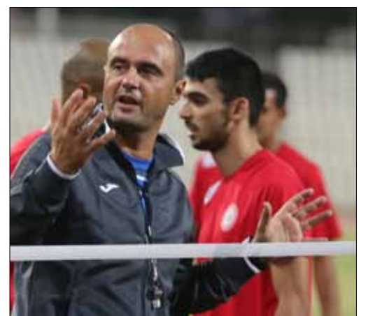
مدرب المنتخب جوسيب جيانيني

استمع الاتحاد اللبناني لكرة القدم إلى مدرب المنتخب اللبناني الإيطالي جوسيب جيانيني، بطلب من الأخير، بشأن قضية التلاعب في إيطاليا التي ورد اسمه فيها، حيث تقرر مراسلة الاتحاد الإيطالي