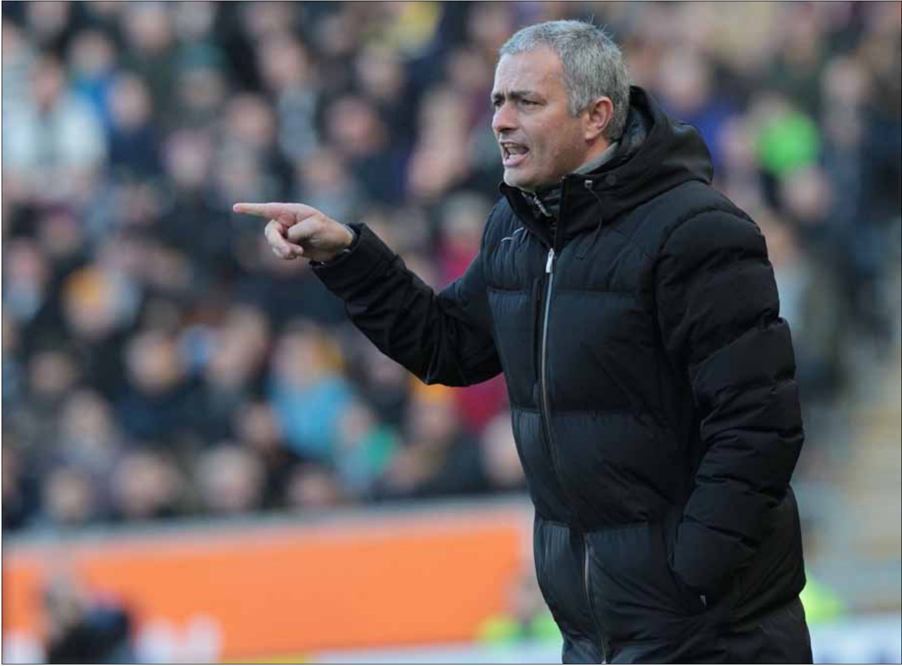
جوزيه مورينيو

لم يكذ جوزيه مورينيو يُنهي تصريحه حول المباراة أمام وست هام، في الدوري الإنكليزي، الأربعاء الماضي، الذي انتقد فيه أسلوب لعب الأخير، معتبراً «أنه يعود للقرن الـ 19»، حتى استلقت الصحافة الإنكليزية سيوفها لتعلن الحرب على الـ «سبشيل وان». بدا كأن هذه الأخيرة تنتظر أي زلّة لـ «مو» حتى تعاقبه، فكيف سيكون رد البرتغالي؟