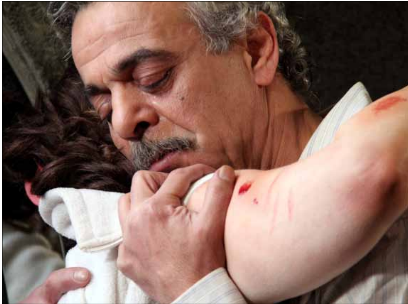
فايز فرق في مشهد من «قربان»

تدور الكاميرا في ستة مسلسلات في دمشق هي: «باب الحارة 6» (إخراج بسام الملا وعزّام فوق العادة)، و«بواب الريح» للمثنى صبح (الصورة)، و«قربان» لعلاء الدين كوكش، و«سوبر فاميلي 2» لفادي سليم، و«رقص الأفاعي»، و«صرخة روح 2» لمخرجين عدة. كما يواصل المخرج حاتم علي تصوير مسلسل «قلم حمرة» في مدينة جبيل اللبنانية، بينما انتهى أربعة مخرجين سوريين من تصوير أعمالهم قبل نهاية 2013، تمهيداً لعرضها في السباق الرمضاني في 2014. هذه الأعمال هي: «نساء هذا الزمان» للمخرج أحمد إبراهيم أحمد، «خواتم» لناجي طعمي، «زنود الست 3» لتامر اسحاق و«خان الدراويش» لسالم سويد.