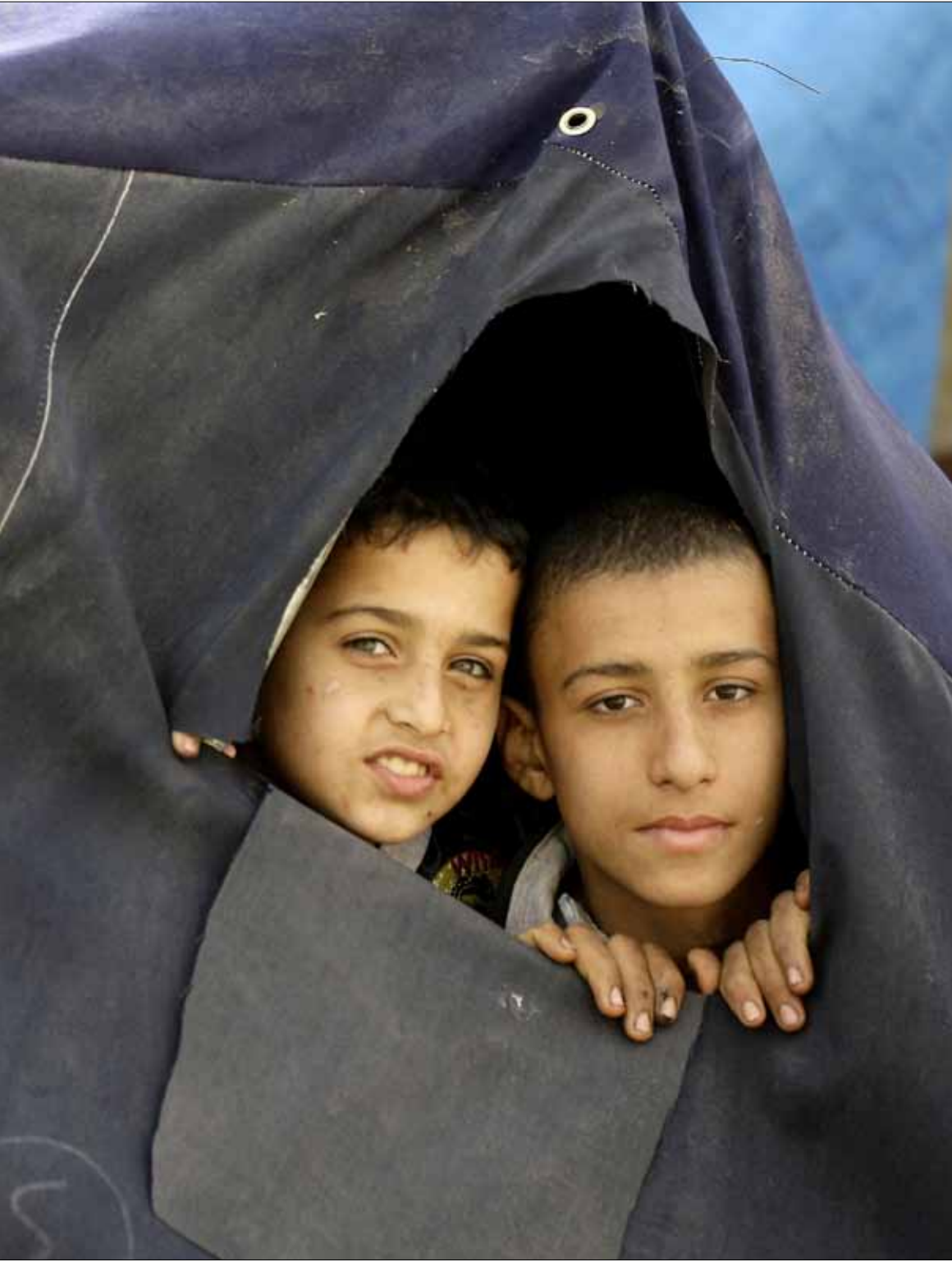
اطفال نازحون من مخيم اليرموك السوري إلى مخيم عين الحلوة اللبناني

انتهت الجولة الأولى من «جنيف 2»، من دون أي ضمانات بعقد جولة ثانية بعد 10 أيام. ما كان يجب أن يتحول إلى مؤتمر للسلام، انتهى بإعلان الطرفين الذهاب إلى الحرب. الحكومة السورية التي لا تعترف بتمثيل «الائتلاف»، تنوي الاستمرار في «محاربة الإرهاب». أما الوفد المعارض، فلم يجد في نهاية «مفاوضات السلام» ما يعلنه سوى الاحتفاء بالمساعدات العسكرية الأميركية. في ختام أسبوع من المفاوضات، أعلن الطرفان تزخيم عملهما العسكري. كاد وليد المعلم واحمد الجربا أن يقولا أمس: حي على الجهاد!