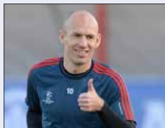
آرين روبن