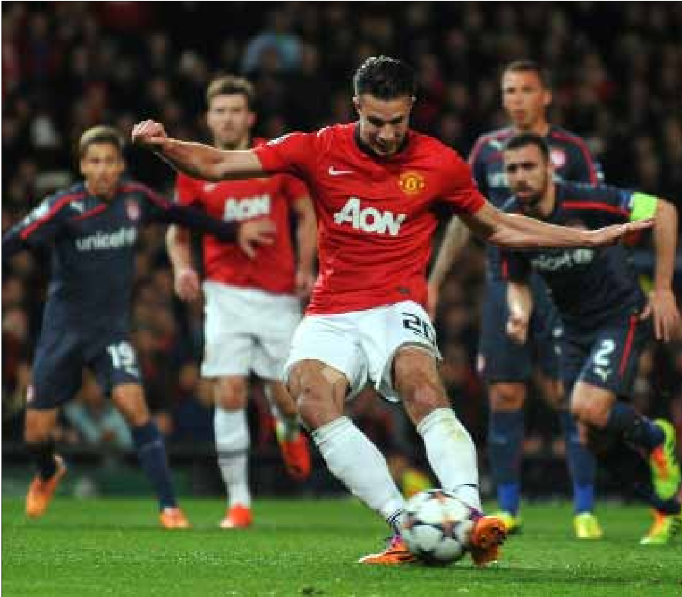
روبن فان بيرسي يسجل هدفه الأول

حجز مانشستر يونايتد وبوروسيا دورتموند مقعدين بين الثمانية الكبار المتأهلين إلى الدور ربع النهائي من دوري أبطال أوروبا، بعد تغلب الأول على أولمبيكوس اليوناني، والثاني على زينيت الروسي