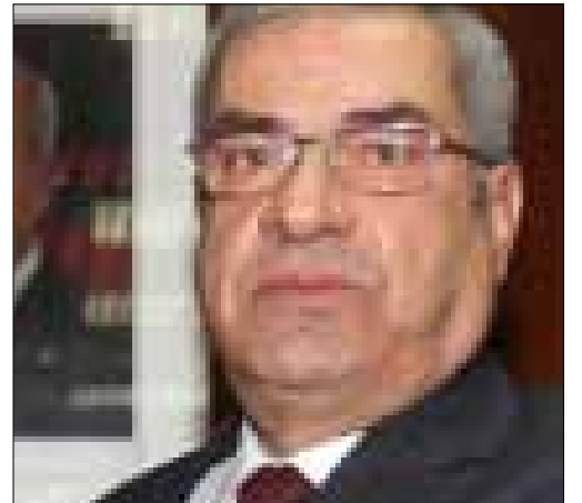
أول حضور خارجي للحناوي

بدأ نقاش جدي حول امكانية تأجيل دورة الألعاب العربية التي من المفترض أن تقام في لبنان عام 2015 نتيجة الأوضاع في الدول العربية والانقسام الحاصل الذي قد ينعكس على البطولة