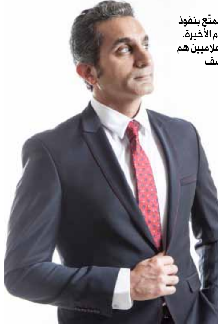
أصبح هاشتاغ «باسم طلع حرامي» الأكثر انتشاراً

البداية كانت مع الإعلامي تامر أمين الذي أدان الفتاة ضحية التحرش في «جامعة القاهرة» (الأخبار 2014/3/18) عبر قناة «روتانا مصرية». ورغم أن أمين ليس من الإعلاميين أصحاب نسب المشاهدة المرتفعة، إلا أن المقطع الذي هاجم فيه ملابس الفتاة بالفاظ حادة كان الأكثر انتشاراً عبر مواقع التواصل صباح الثلاثاء. طوال اليوم، تداول الناشطون هاشتاقات مثل «تامر أمين متحرش» و«قاطعوا روتانا مصرية». وكما هي الحال في مصر منذ «ثورة يناير»، فكل سقطة جديدة تجر الجمهور على استعادة سقطات الإعلامي القديمة، وأمين اشتهر بانتمائه إلى نظام مبارك وهجومه على الشباب في ميدان التحرير قبل انهيار النظام في شباط (فبراير) 2011. بعد هذه الحملة الافتراضية العنيفة،