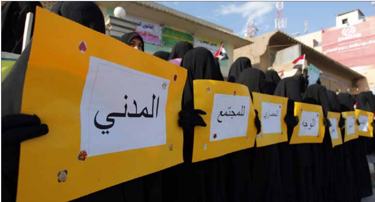
حظيت مسودة القانون بمباركة المرجع محمد اليقوبي

رجحت أدور أن «يكون الموضوع هنا أساسه سلطة استهلاكية انتخابية»