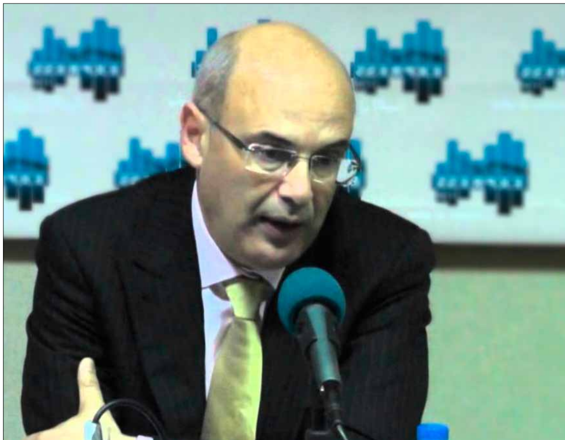
تونس - نورالدين بالطيب

إن الجولة الخليجية تبقى من بين عناصر الأمل الكبرى التي تعول عليها حكومة التكنولوجيا لخلق منح ومساعدات وقروض جديدة تمكن الحكومة من تجاوز مرحلة الخطر، إذ إن رواتب شهر نيسان القادم بالنسبة إلى موظفي الدولة غير مضمونة لحد الآن، وهو ما سيرتبط عليه احتقان اجتماعي لم تعد البلاد قادرة على مواجهته مع تواصل تحدي المجموعات الإرهابية.