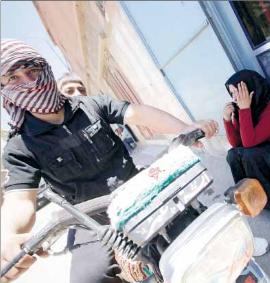
انتشرت قوة من الفوج الموقفل في جرود عرسال