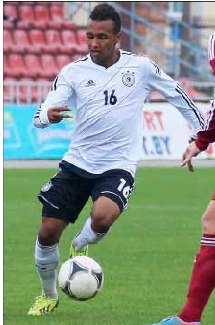
أفغ كلينسمان النجم الصاعد غرين بتفضيل الولايات المتحدة على ألمانيا (أرشيف)

داب كلينسمان على خطف كل موهبة أميركية - ألمانية للعب تحت قيادته