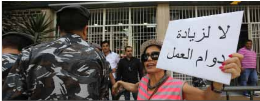
خلال اعتصام الموظفين الإداريين أمام وزارة الصناعة (مروان طحطح)