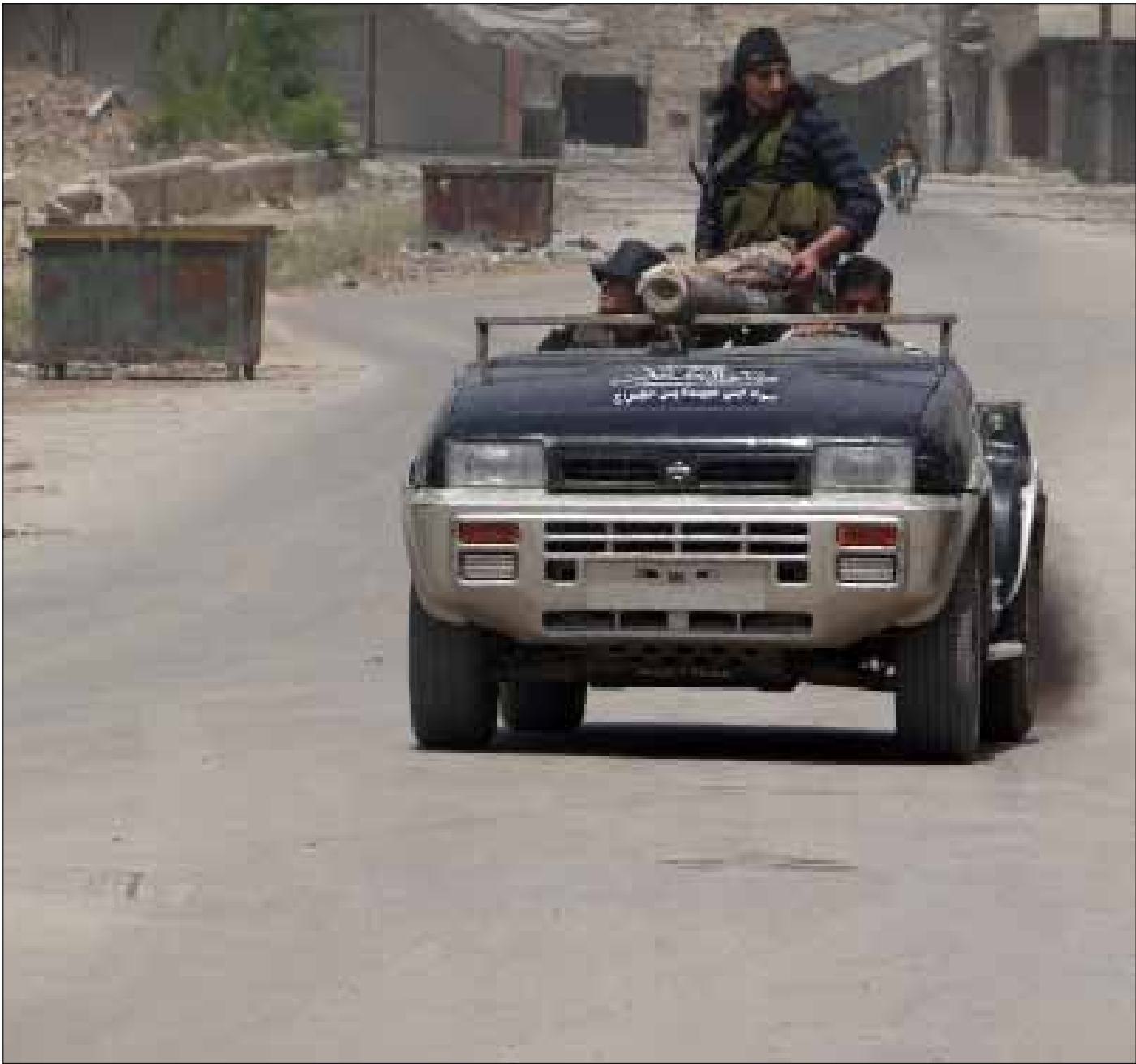
تسعى المعارضة إلى تنظيم تراجعها وتثبيت وجودها في الأحياء الوسطى والجنوبية لنوى

وفي ظل التقدم الحالي للجيش على المحاور الثلاثة للمحافظة، ألقت طائرات تابعة للجيش مناشير فوق أحياء نوى وجاسم فجر أمس، تقول: «ماذا حققتم من تدمير وتخريب التحصينات التي بناها الشعب والجيش لمواجهة الكيان الصهيوني وصد عدوانه عن أرضنا وشعبنا؟ ندعوكم إلى ترك السلاح والعودة إلى حضن الوطن. لا يزال لدى الشعب السوري القدرة على التسامح واستيعاب من تاه عن جادة الصواب». ليختم المنشور: «لديكم مهلة عشر ساعات لتقررُوا... إما ترك السلاح والعودة