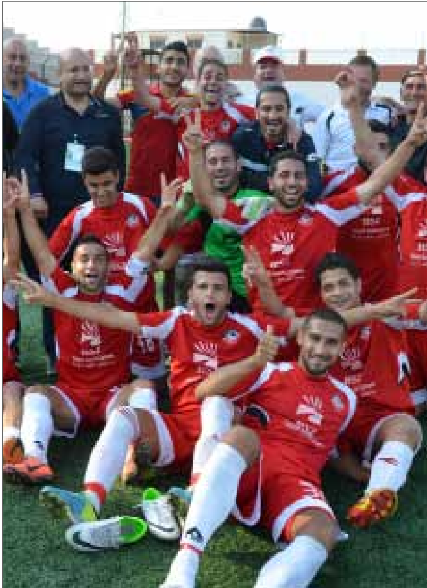
اللقب الأول للسلام أو طرابلس سيكون تاريخياً (ارشيف)