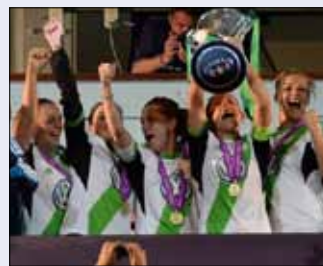
سيدات فولسبورغ خلال التتويج (أ ف ب)