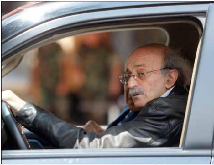
جنبلاط: التحرير ذكرى وطنية وقومية واسلامية كبرى (هيثم الموسوي)

المرة أن «يعوم» العريضي في مستنقع اشتراكي شرس، وفي مواجهة من النذ الى النذ مع الوزير اكرم شهيب. أما عنوان الخلاف الاثني: عيد المقاومة والتحرير.