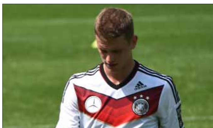
انسحب بيندر من تشكيلة ألمانيا بسبب الإصابة

الأوروغوياني لكرة القدم قد أعلن أن الأهداف التاريخية لـ«السيلبستي» (غير مستبعد من المونديال)، وذلك رغم خضوعه الخميس لجراحة ناجحة في غضروف الركبة اليسرى.