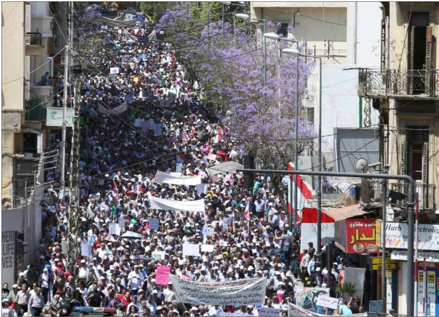
شارك عشرات الآلاف في التظاهرة الحاشدة في الأخيرة