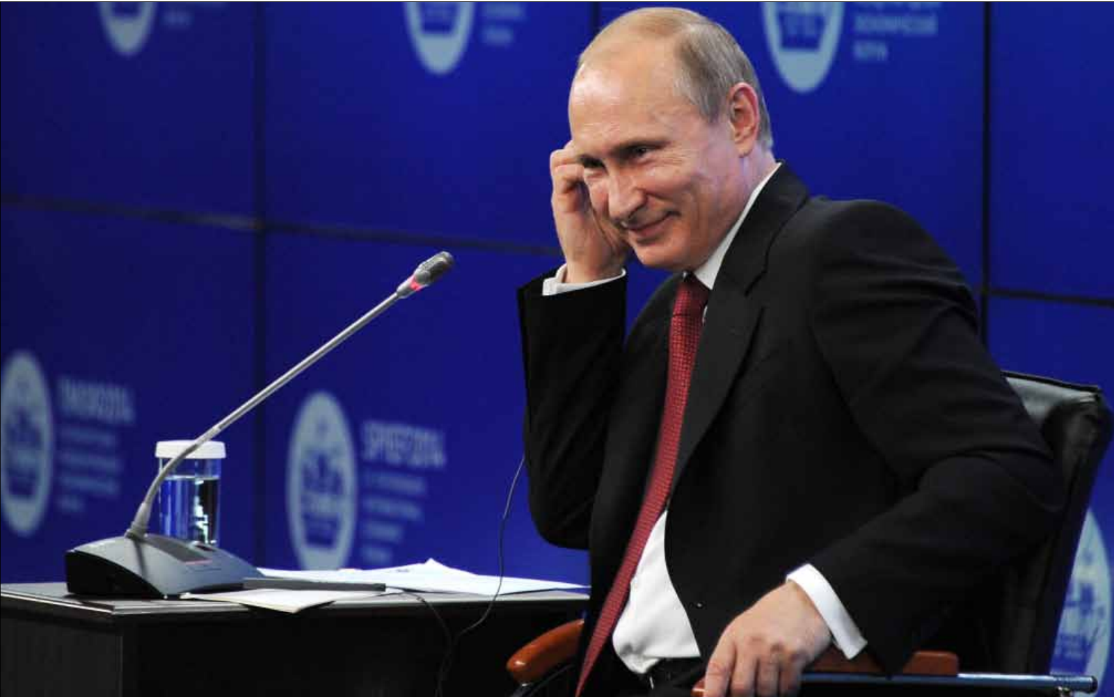
رئيس الأركان الروسي: موسكو تتخذ إجراءات رداً على زيادة قوات «الأطلسي» بالقرب من حدودها

وفي سياق رده على سؤال عن اتهامات وجهها الرئيس الأميركي باراك أوباما واصفاً إياه بأنه غير صادق، قال بوتين «هو ليس قاضياً ليتهم، إن كان كذلك فليعمل إذاً في المؤسسات القضائية». وأعرب بوتين عن ثقته بأن السؤال عن علاقة أوباما به طرح على نحو غير دقيق، مضيفاً «لا أعتقد أن باراك يتهمني بأي شيء، لديه وجهة نظر خاصة حيال أمور، وأنا لذي نظرتي الخاصة». من