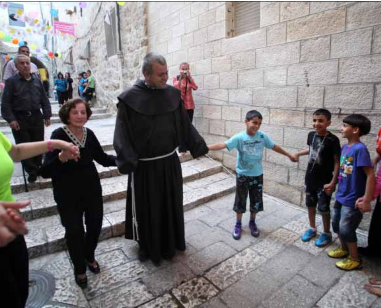
يتحسر الفلسطينيون المسيحيون على قصر مدة الزيارة لكنهم ياملون في رؤية البابا ومصافحته

ما عزز الحديث عن الدلالات السياسية التي لم يقر بها البابا، إعلان أمين السر وزير خارجية الفاتيكان الكاردينال بيترو بارولين أول من أمس أن «الزيارة لها بطريقة ما طابع سياسي، حتى وإن كان الحبر الأعظم نفسه قد أكد أنها زيارة دينية بحتة». وقال إن هذه الزيارة يمكن أن تساعد المسؤولين المحليين (الفلسطينيين والإسرائيليين) على أخذ قرارات شجاعة على طريق السلام. وأوضح بارولين أن إحدى هذه النقاط