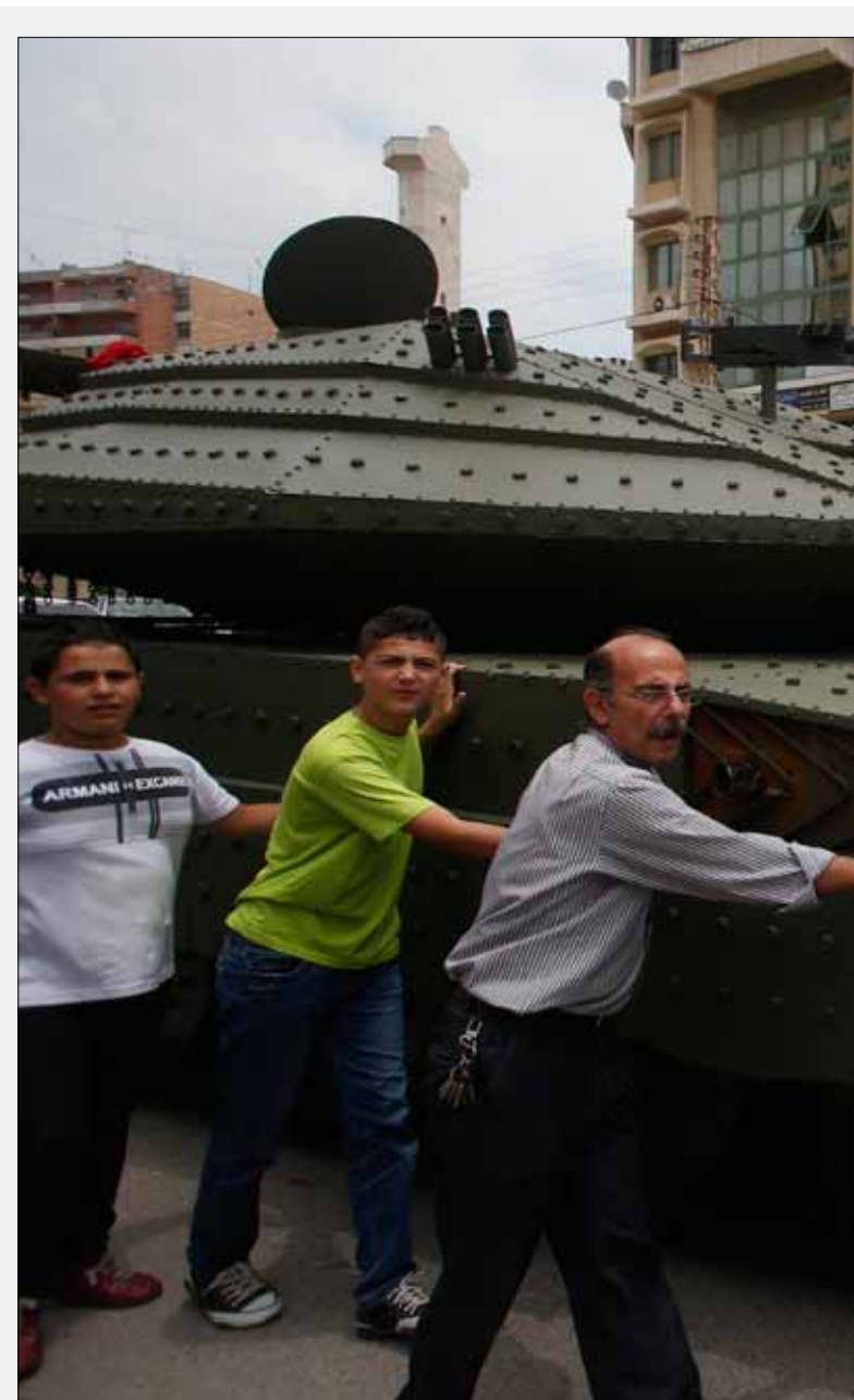
الشعبي مهرجاناً يتخلله تدمير مجسم لدبابة ميركافا 4 جرى تصنيعه خلال الأشهر الثلاثة الماضية من قبل أفراد في الحزب.

مرت السنوات الـ 14، ولا يزال العدو يريد سلاح المقاومة. العدو لا يتعب، واجبه ألا يتعب. وسوف يفاجئنا إن هو استسلم