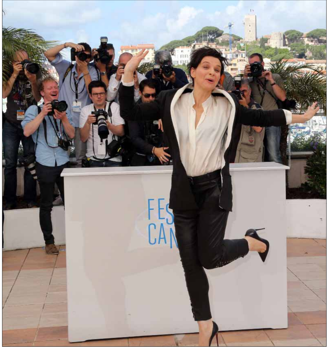
تألفت جوليت بينوش أمام عدسات المصورين، قبل عرض فيلم Clouds of Sils Maria أمس خلال الدورة الـ67 من «مهرجان كان السينمائي». في شريط الفرنسي أوليفييه آسايس، تتقاسم بينوش البطولة مع الأميركين كلوي غرايس موريتز وكريستين ستيوارت (مقال موسع على موقعنا)

أما المحطة الأخيرة، فستتمثل في حفلة تحييها صاحبة أغنية «إنت فين Again» في 8 حزيران (يونيو) المقبل في «ميوزك هول» («ستاركو» - بيروت) تقدم خلالها أغنيات اليوم «يا ناس». تعتبر ياسمين حمدان من أول الوجوه الغنائية