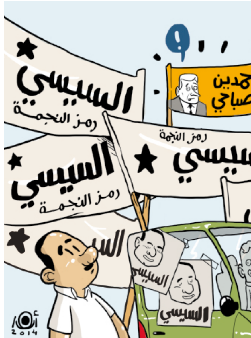
(محمد أنور - مصر)

وصفه بـ«الرئيس». وكان لقاء حمدين قد شهد نقاشات تفصيلية حول خطط مستقبلية في التعااطي مع أمور فنية تخص عملية إعادة هيكلة مؤسسات وزارة الثقافة، إلى جانب وسائل دعم المجتمع المدني الثقافي. وخلال اللقاء من نبرة التوجيه والإرشاد التي غلبت على لغة السيسي خلال اللقاء بأنصاره. وبعيداً عن الفروق بين اللقاءين، يبقى الجانب الأهم متعلقاً بالكيفية التي يمكن لداعمي المرشحين عبرها تجنب الانزلاق إلى خطاب فاشي يقوم على تخوين أنصار كليهما والحط من قدره، وهو أمر لن يجيب عنه سوى المستقبل.