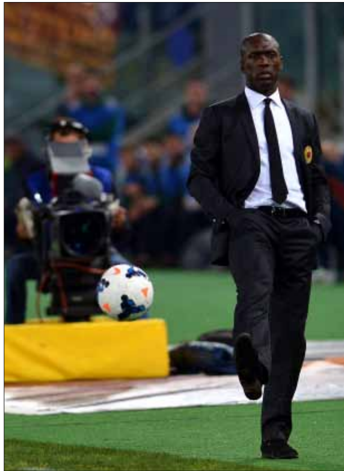
يحاول ميلان حل مشكلة المدرب (البرتو بيتزولي - أ ف ب)

سابعاً في الدوري الإنكليزي. ومن المعروف أن الحلول في المراكز الأولى، للتاهل إلى دوري الأبطال أو إلى «يوروبا ليغ» يمنح جوائز مالية تساعد في الـ«ميركانو». ويبدو من التعاقدات التي يطلبها المدرب الهولندي لويس فان غال أن لا مشكلة يعاني منها. مانشستر لا هم لديه بذلك. يرى فيها أنها «كجوة جواد» فقط سببها الاسكتلندي ديفيد مويز. سيعود أفضل مما كان، بعد الهولندي الجديد.