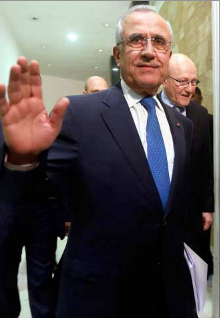
سابقة سليمان: لم يتسلم الرئاسة من احد ولن يسلمها لأحد (هيثم الموسوي)

في سنة الـ66 لم يقل الرئيس بعد من اين يريد أن يبدأ ومع من؟