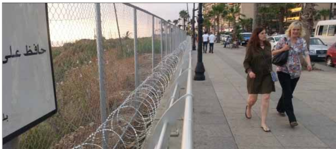
لا تستغربوا، غداً أو بعد غد، أن يمنعكم حارس ما من الدخول إلى الدالية وإلى شاطئ الرملة البيضاء