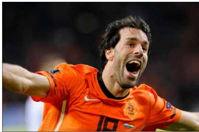
رود فان نيستلروي (أرشيف)

بات النجم السابق رود فان نيستلروي، ضمن الجهاز الفني لمنتخب هولندا، بحسب ما أعلن الاتحاد الهولندي لكرة القدم. وسجل نيستلروي 35 هدفاً في 70 مباراة دولية بقميص «الطواحين»، وهو سيعمل إلى جانب داني بليند كمساعد للمدرب غوس هيدينك. وقرر الاتحاد الهولندي تعيين باتريك لودفيكس مدرباً لحراس المرمى خلفاً لفرانز هوك الذي اتجه إلى مانشستر يونايتد الإنكليزي للعمل مع مواطنه لويس فان غال. واستعان الاتحاد الهولندي باللاعبين الدوليين السابقين