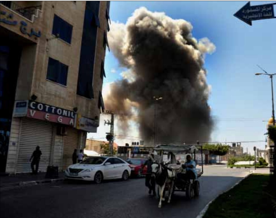
لا أهمية لتحرير فلسطين، ما لم تقم دولة الخلافة في محيطه

جوهر المنهج، فـ«لا أهمية لتحرير فلسطين، ما لم تقم دولة الخلافة في محيط فلسطين». تقول مصادر من «الدولة» لـ«الأخبار»: «الحرب النهائية التي تُحرّر فلسطين هي التي تقودها دولة الخلافة، وعلامة هذه الدولة أن تقوم في الشام والعراق»، وفقاً للأحاديث المروية عن النبي محمد. ويضيف المصدر نفسه: «الله وحده يعلم شوق جنود الخلافة لحرق المراحل لمواجهة اليهود في فلسطين، لكن من استعجل أمراً قبل أوانه عوقب بحرمانه». يعدد المصدر الموجود في «ولاية الرقعة» المراحل قائلًا: «الأولوية تقضي بتحرير بغداد، ثم التوجه إلى دمشق، وتحرير كل بلاد الشام، قبل تحرير فلسطين». هكذا، يستعيد جنود «الدولة» قاعدتهم الشهيرة: «قتال المرتد القريب أولى من قتال الكافر البعيد». ويعتمدون في ذلك على واقعة حروب الردة التي بدأها الخليفة الراشدي أبو بكر الصديق (ضد المسلمين الذين ارتدوا عن دينهم بعد وفاة النبي)، والتي جعلها أولوية على قتال الكفار واستكمال الفتوحات. وبحسب مقاتلي «الدولة»، فإن اتباع جميع الفرق الإسلامية غير