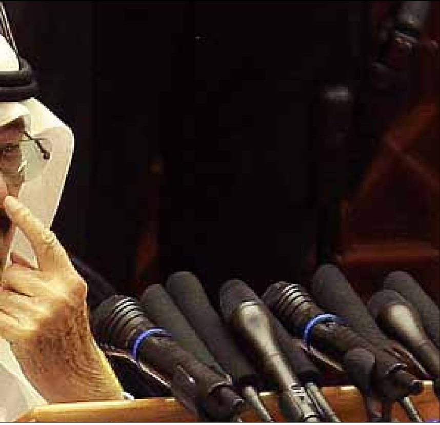
جاء العدوان الإسرائيلي على قطاع غزة ومعاناة أهله في مرتبة ثانية في خطاب الملك (أرشيف)

نشرت وكالة الأنباء السعودية (واس) نص كلمة الملك عبد الله أمس، وقد تليت بالنيابة عنه. كان ينطلق من هواجس ذاتية ومحلية، وإن وجهه خطاب «إلى الأمة العربية والإسلامية». بدأ الملك خطابه عن الفتنة، وكان الأجدر والأولى أن تكون البداية عن غزة المغدورة، والمهشمة، والصامدة والشاهدة على عار الصمت والتآمر العربي