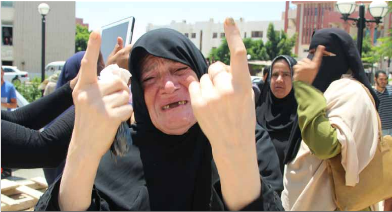
أثار الحادث حالة من الحزن الشديد والاستياء خيما على الأهالي في مناطق الشيخ زويد وفي رفح

ظلت الجثث 6 ساعات في المشرحة لرفض النيابة تسليم تصاريح الدفن