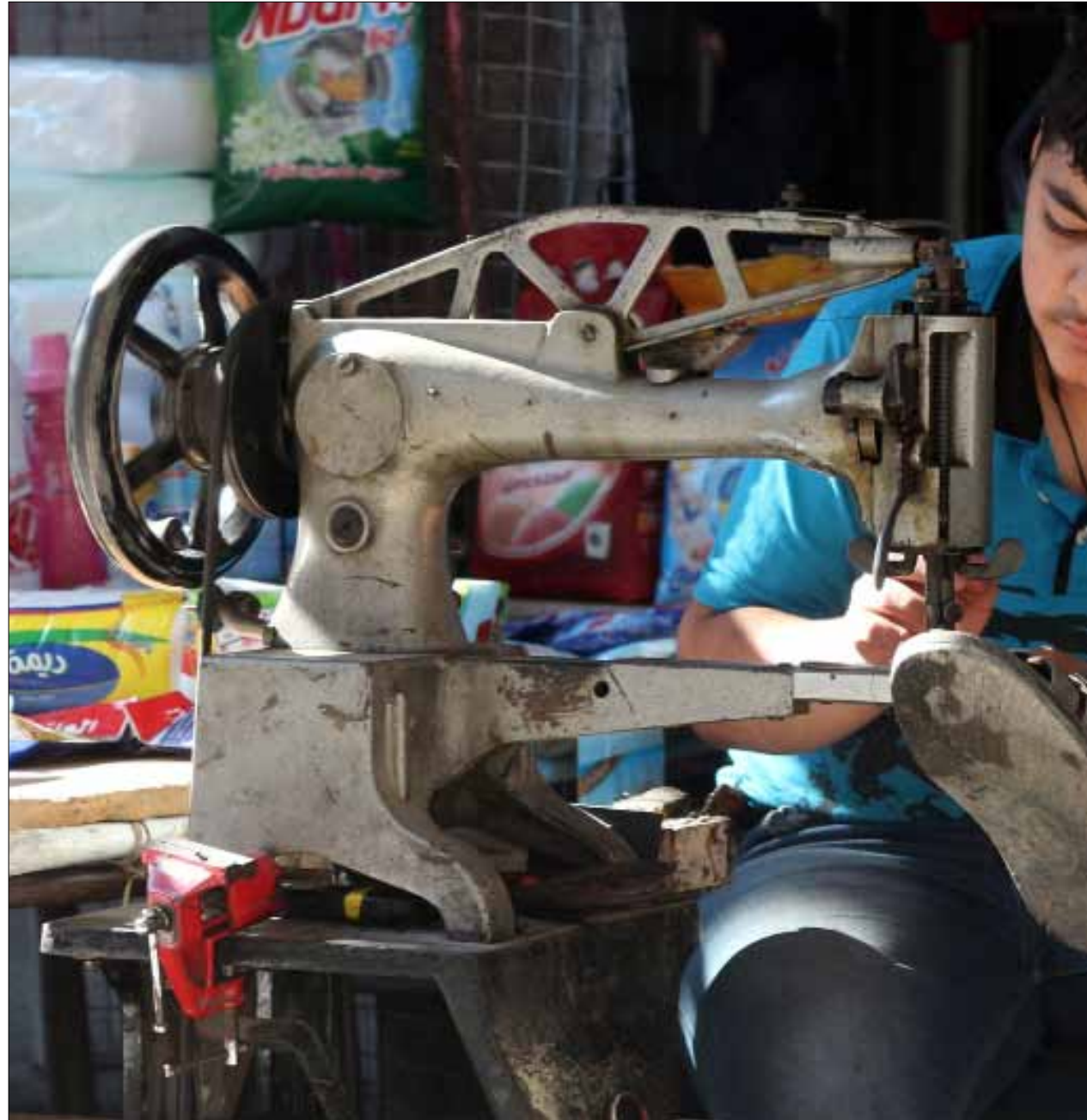
يتصدر ريف حلب قائمة المناطق السورية في نسبة الأمية

- بقاء مدينة حلب بثقلها السكاني والاقتصادي الكبيرين هادئة