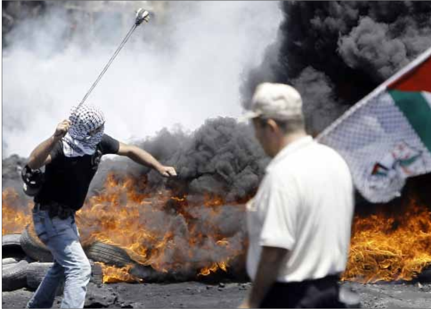
لم تعد صورة العدو على ما كانت عليه من قبل

متخاذل أو متعامل في دول الطوق وما بعدها: هناك مقاومة في لبنان، وحرب أهلية ضروس في سوريا وهناك النظام الهاشمي الذليل الذي لا تزال أميركا مصممة على المحافظة عليه كرمي لعيون العدو بكل الأثمان. لكن التغييرات قد تأتي بحكومات ذات مشاريع تحريرية ومقاومة - وهذا لم يحدث بعد لكن الحركات السياسية لا تزال في بداياتها. قد يستغرق التحول العربي سنوات وقد يستغرق عقود، والعدو لا يدري ما سيطالعه.