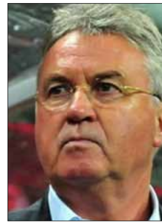
غوس هيدينك