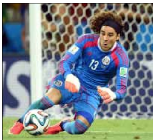
غييرمو أوتشوا (أرشيف)

وعلى صعيد الحراس أيضاً، كشفت صحيفة «ماركا» الإسبانية أمس أن حارس مرمى ريال مدريد، ديبغو لوبيز، سيغادر صفوف الفريق في