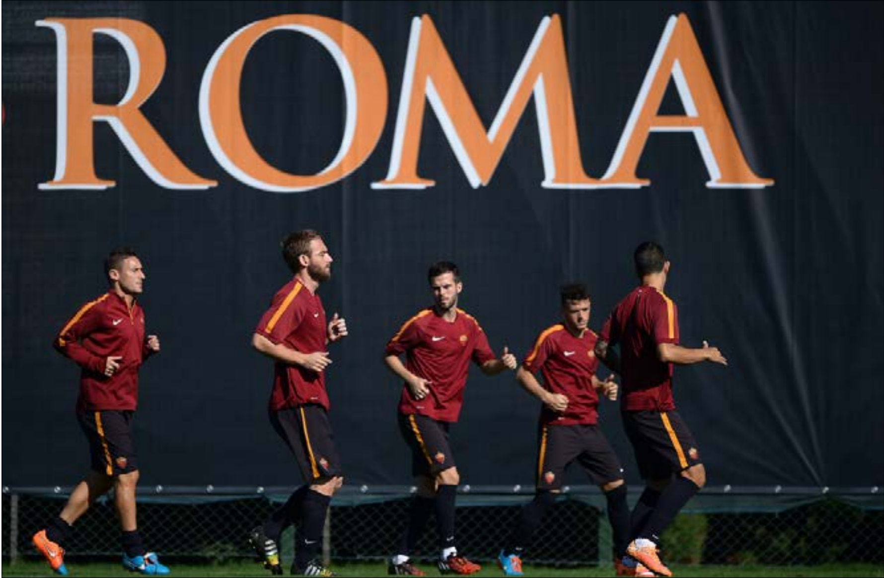
سار روما في مستوى تصاعدي منذ الموسم الماضي

روبن اللذين اعتادا صناعة الأهداف وتسجيلها بوفرة. وعند هذه النقطة يمكن الذهاب للحديث عن روما الذي أصبح أقوى في هذه الناحية منذ انطلاق الموسم الجديد، فالعاجي جرفينو سرق النجومية من الجميع وحتى من «الملك» توتي في مباريات عدة بفعل رسم غارسيا خطة تخلق له مساحات للتحرك. وتزداد فعالية روما على هذا الصعيد بوجود الأرجنتيني إيمانويل إيتوربي هذا الموسم، وهو بسرعه الفاتكة أصبح يحمل لقب «إيتوربي».