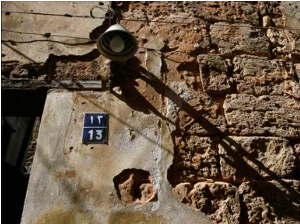
«الداون تاون» «ويبروت سوكس» أصبحنا أقرب