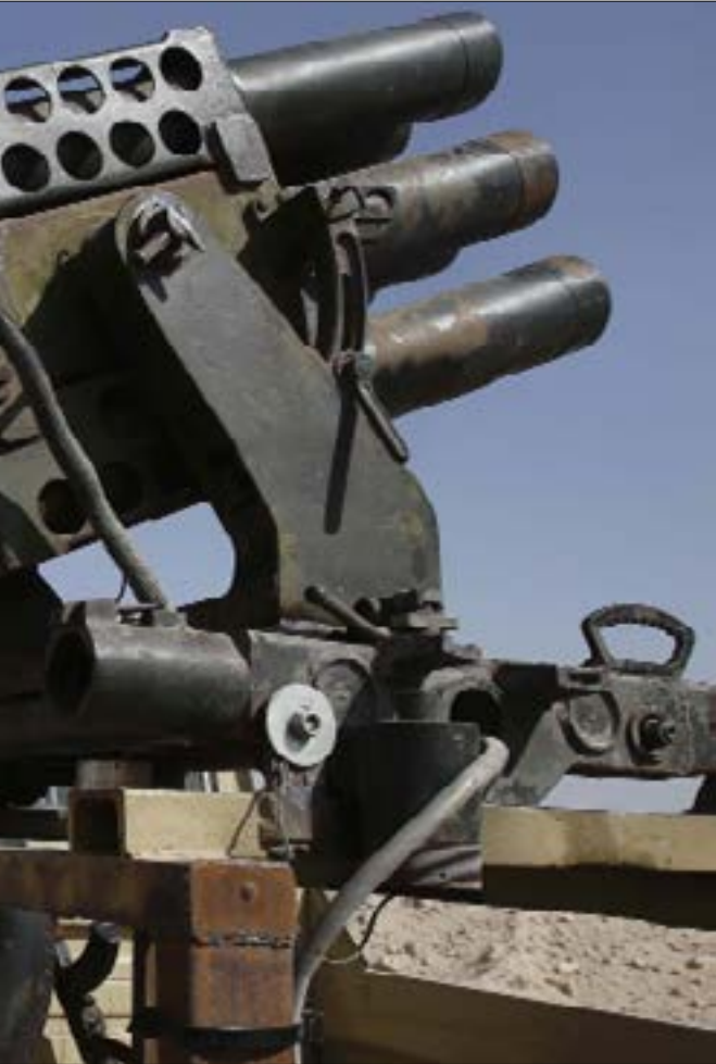
لنجاحات مهمة تحرزها القوات الامنية والقوات المدنية التي تدعمها في العراق

وانسحبت بسرعة أثارت دهشة المحللين من مدينة سنجار وسهل نينوى، تاركة مئات الآلاف من أبناء الأقليات وخصوصاً البيزيديين والمسيحيين لقمة سائغة لأشد المجموعات التكفيرية المسلحة وحشية ودموية وهمجية أعادت العالمين العربي والإسلامي إلى زمن بيع الجوارح السبائياً والقتل الجماعي لمجرد التشفي والترجيع. وإذا ما تفحصنا تفاصيل ما حدث ومقدماته القريبة نجد أن العقيدة القتالية لـ«داعش» كانت جديدة في دمجها لمكونات حربية قديمة وتطويرها لتراث سلفها العقيدي والحربي أي تنظيم «القاعدة».