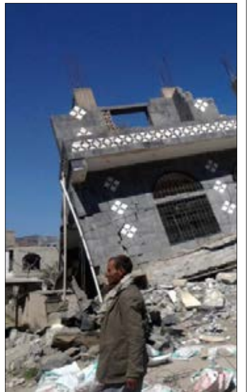
أين يرى أوباما نجاحاً في استراتيجية بلاده تجاه اليمن؟

غير أن استناد أوباما إلى نموذج اليمن تحديداً في خطاب يحدد معالم مرحلة بات اسمها «الحرب على داعش»، كان أمراً مثيراً للاستغراب والتساؤل والسخرية أيضاً. سؤال واحد تمحورت حوله التعليقات في الصحافة الغربية آنذاك: أين يرى أوباما نجاحاً يُحتذى به في استراتيجية بلاده تجاه اليمن؟