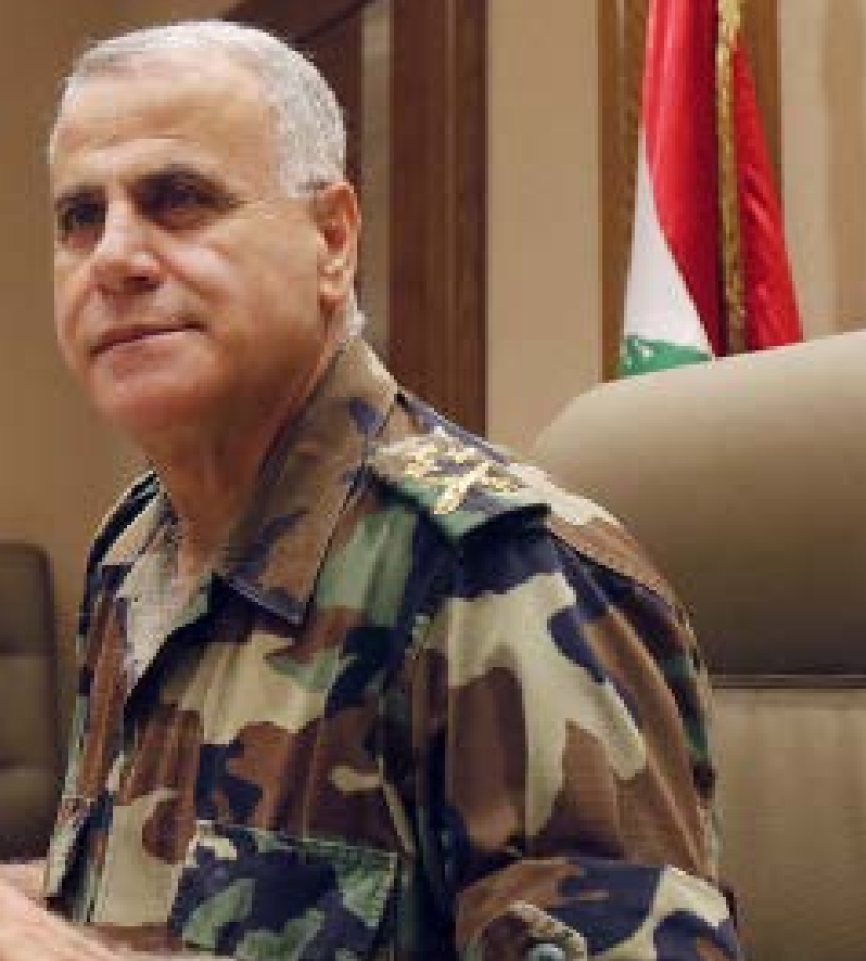
تدرك قيادة الجيش أن السلطة السياسية لن تمنحها غطاء كاملاً لتنفيذ عملية عسكرية (هيلم الموسوي)

لم تكن حرب 1975 . 1990 السابقة. قبل ذلك في «ثورة 1958»، فرّ عسكريون من قطعهم، بينهم من التحق بـ«المقاومة الشعبية». معظمهم رجال درك، والغالبية شرطيون.