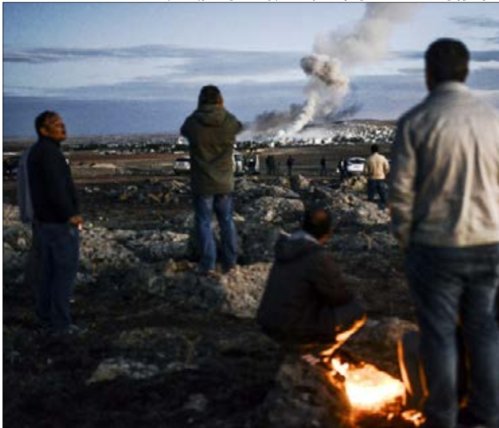
طائرة أميركية نفذت «عدة» عمليات القاء مؤن من الجو على عين العرب

العمليات العسكرية ضد داعش، وما زلنا نأمل المزيد»، مؤكداً أن هذا الدعم «سيساعد كثيراً».