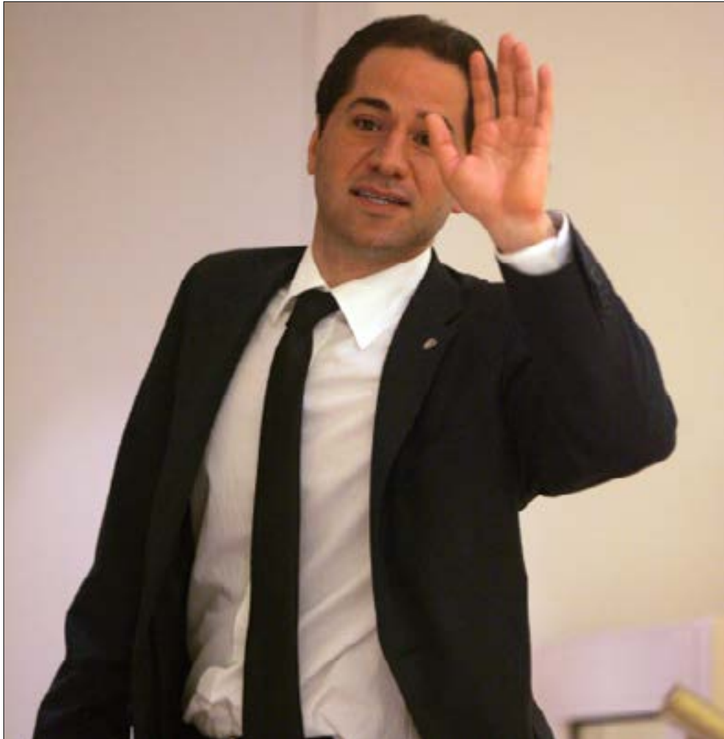
ساد التضارب في اوساط حزب الكتائب بين النفي والتأكيد والدلا تعليقاً،

بعد صدور قرار ملكي سعودي بضرورة التمديد للمجلس النيابي، استدعت الرياض أمس رئيس حزب القوات اللبنانية سمير جعجع والنائب سامي الجميل لضمان تصويت حلفاء المستقبل المسيحيين إلى جانب إطالة عمر المجلس النيابي الحالي. مصادر 14 آذار متفائلة باستجابة حلفاء الحريري