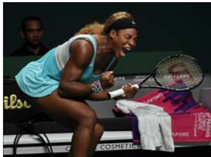
سيرينا تفجر فرحتها بعد فوزها على إيفانوفيتش

وفي المجموعة الحمراء نفسها، تغلبت الرومانية سيمونا هاليب (23 عاماً) المصنفة رابعة على