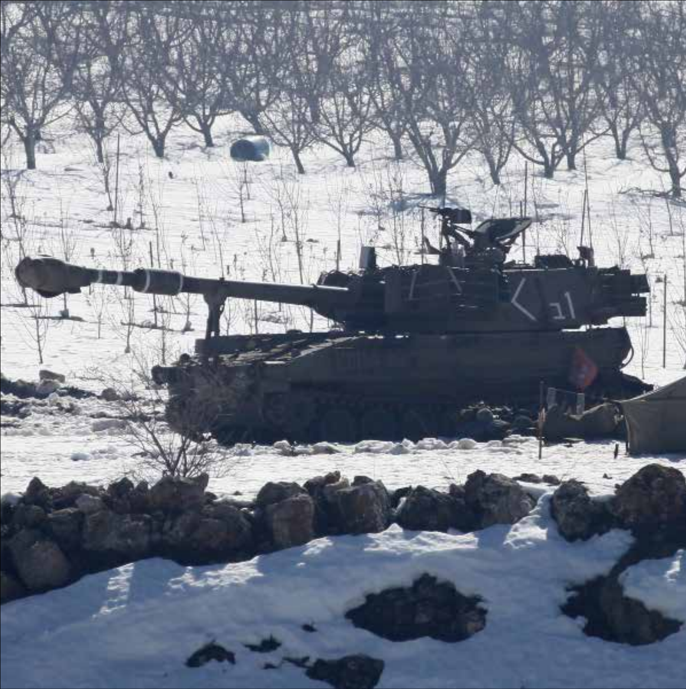
دبابات اسرائيلية في الجولان السوري المحتل

- أثبت الاعتداء وجود تدخل اسرائيلي مباشر وعلني في الجولان بعدما كان الأمر يقتصر على تقارير عن تدخل غير مباشر ودعم لوجستي ومعلوماتي