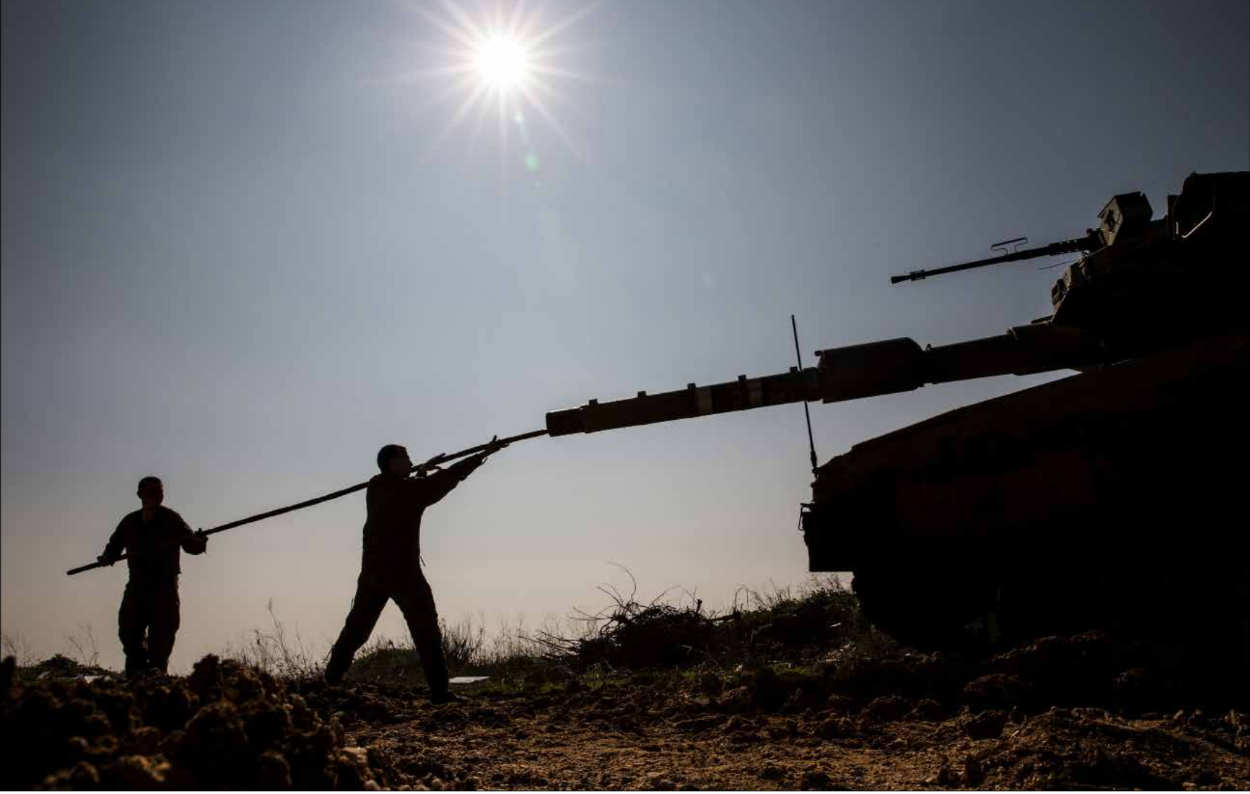
على الحدود مع لبنان أمس