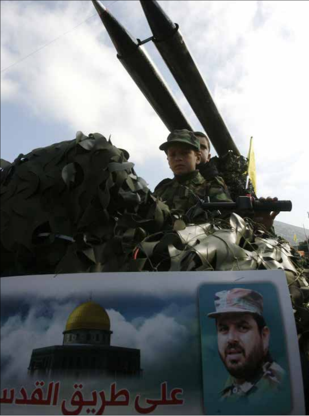
طفلات مع مجسم للصواريخ في تشييع الشهيد عيسى في عربصالح امس

ليست المرة الأولى التي تتدخل فيها إسرائيل في مسار الحرب الدائرة في سوريا، من دون أن يكون لدخولها في السنوات الثلاث الماضية تأثير كبير في مجريات الحرب السورية وترجيح كفة الميزان لمصلحة أي من أطراف الصراع. وكذلك فهي ليست المرة الأولى التي تقصف الطائرات الإسرائيلية أهدافاً تقول إنها إما