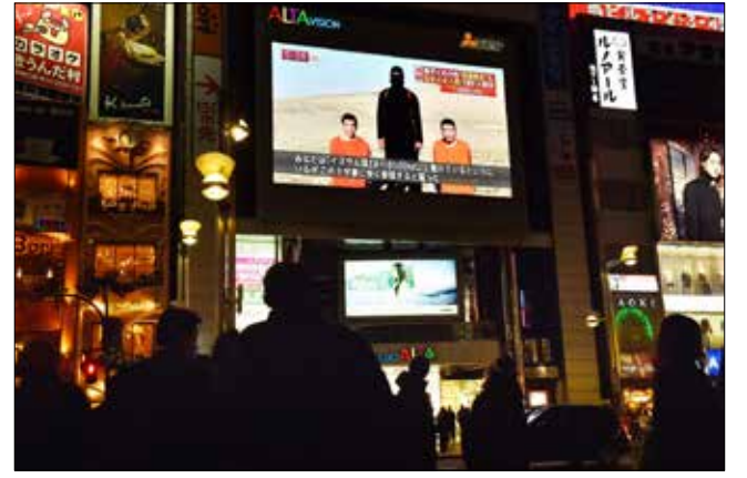
يابانيون يتابعون تسجيل الفيديو في طوكيو أمس