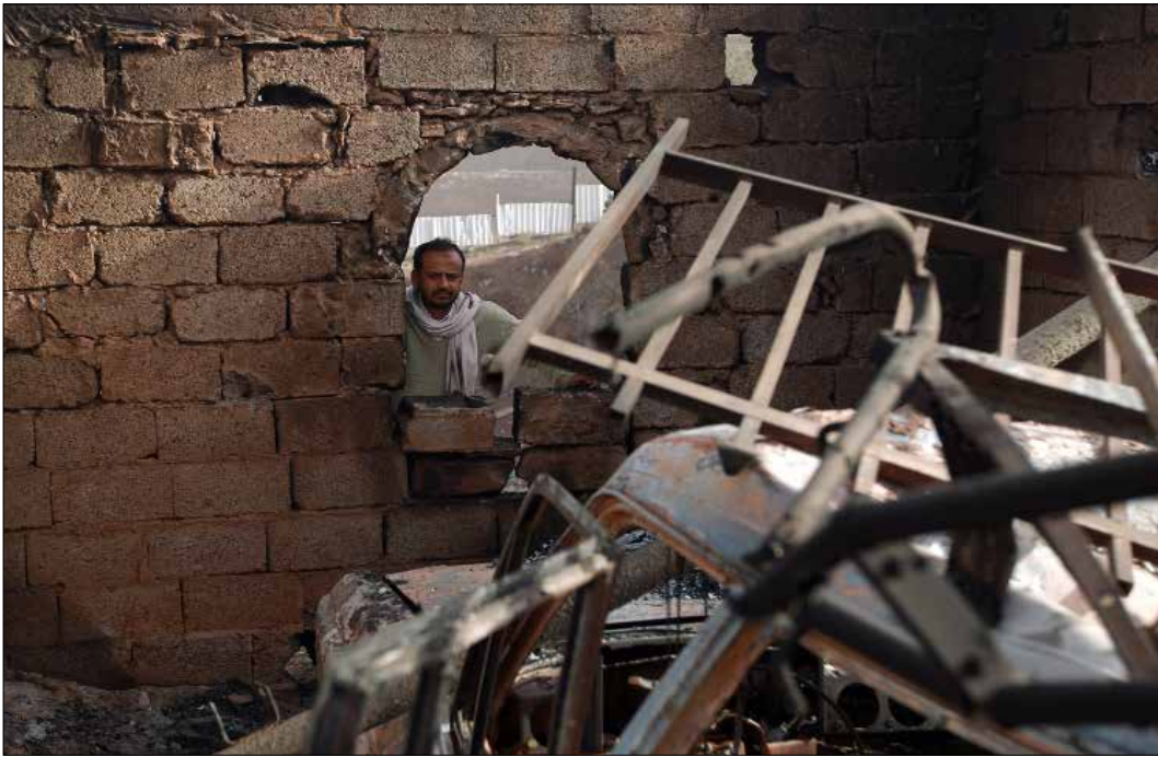
اشترط الحوثي 4 نقاط لتنفيذها سريعاً من أجل حل الأزمة المتفاقمة منذ يومين في صنعاء

شراكة لا انقلاب، هي باختصار ما جدد زعيم جماعة «أنصار الله» عبد الملك الحوثي تأكيد، ليل أمس، حين خرج ليعلم أن ما شهدته صنعاء في اليومين الماضيين ناتج من انقلاب بعض القوى، ومن بينها الرئيس عبد ربه منصور هادي، على اتفاق «الشراكة». 4 نقاط، اشترط الحوثي تنفيذها «سريعاً» لحل الأزمة المتفاقمة منذ يومين في صنعاء. أولاً تصحيح وضع الهيئة الوطنية لصياغة الدستور الجديد، ثانياً تصحيح المخالفات الواردة في مسودة الدستور، ثالثاً تنفيذ اتفاق «السلم والشراكة»، رابعاً حل الوضع الأمني، وخصوصاً معالجة الوضع في مارب. الحوثي كان حريصاً على توجيه «النصح» لهادي بتنفيذ اتفاق «الشراكة»، من دون الاستماع إلى قوى خارجية، مرجعاً المواجهات المسلحة المتقطعة بين «اللجان الشعبية» التابعة للجماعة و«حماية الرئاسة» في صنعاء، إلى إصرار قوى داخلية وخارجية على «المؤامرة» التي تتمثل في تمرير مسودة الدستور والتمسك بالأقاليم الستة. ومع تنويبه بدور الجيش الذي لزم الحياد في المعارك الأخيرة، حرص الحوثي أيضاً على توجيه رسالة إلى الخارج بأن جماعته «ستضمن المصالح المشروعة» لدول الإقليم في اليمن، وستواجه «المؤامرات»، مشيراً إلى «مشاريع تتحرك على الأرض لتمزيق اليمن والانقلاب على اتفاق