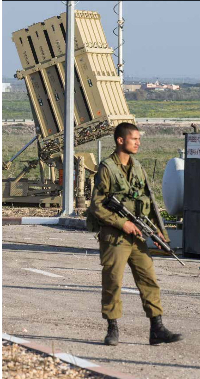
بطاريات صواريخ «القبة الحديدية» في الجولان المحتل

هرئيل تقديرات الاستخبارات العسكرية الإسرائيلية بأن حزب الله ليس معنيا بتصعيد، لكنه حذر من أن تقديرات مشابهة كانت موجودة عشية حرب لبنان الثانية عام 2006. وانطلاقاً من هذه التقديرات، توقع هرئيل بأن يبادر الحزب بنوجيه ضربة لاسرائيل في دولة اجنبية من دون أن يعلن مسؤوليته عنها.