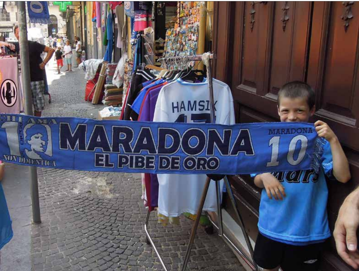
توارث الاجيال «الحب المقدس» لنابولي ولاسطورته الازلية دييغو ارماندو مارادونا

مدينة متوسطة ساحرة في الجنوب الإيطالي. هي نابولي التي تليق بها تلك الكلمة الإيطالية الشهيرة «Grande»، أقله في كرة القدم؛ فهي عظيمة بشغف سكانها بفريقها الأزرق. ذاك الفريق الذي تعبق منه رائحة التاريخ والذكريات المجيدة التي خطها مارادونا. نابولي هي ربما المدينة الوحيدة في العالم التي تتخطى فيها الكرة مسألة الحياة والموت لتصبح أسلوب عيش