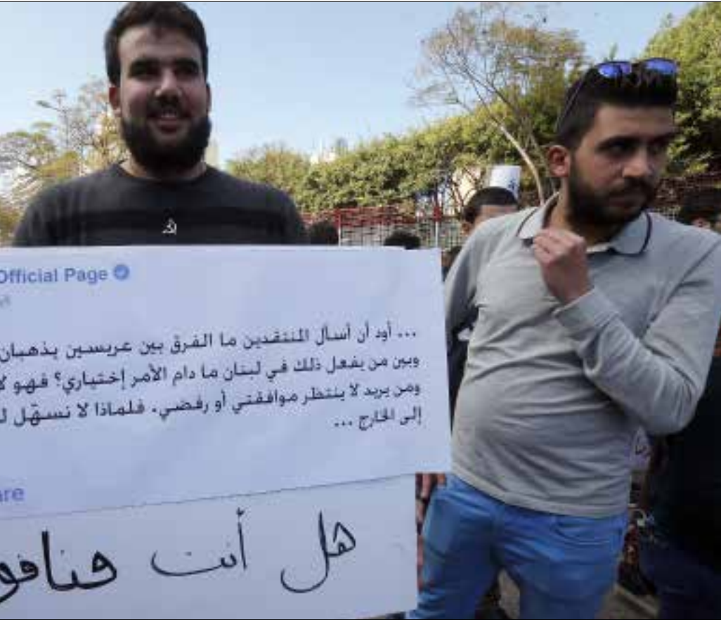
بارود: القضية ليست قانونية، إنمائية بالهناج (هيلم الموسوي)