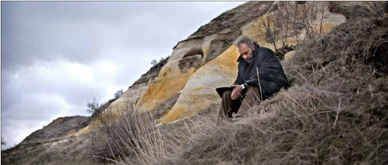
مشهد من «سبات شتوي»

هذا بيان شعري ساحر عن جدوى الفرد والكون، الشعور بالذنب والرضى، ازدواجية البرجوازية ومثقف البرج العاجي. في اتكائه على تشيخوف والرافقة، يعيد المخرج التركي نوري بيلج جيلان هيئة الحوار في شريطه «سبات شتوي» الذي طرح أخيراً في الصالات اللبنانية. بعدهما انتزم سعة «مهرجانات كان»