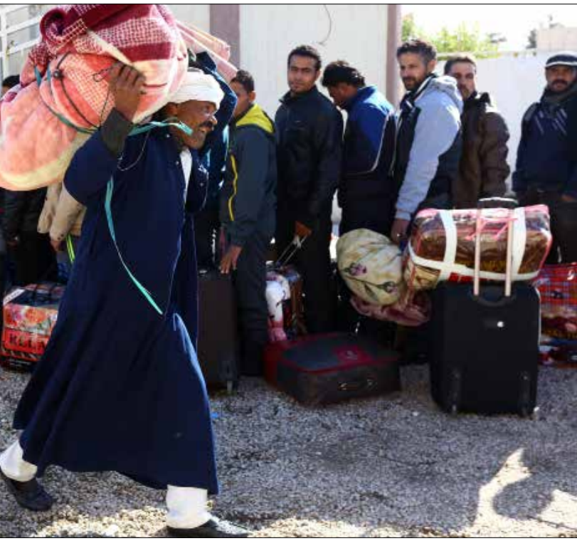
احتلت النزاعات الإقليمية التي تخوضها مصر حالياً واجهة الأحداث

وتوفر سياقاً لعملية سياسية قائمة وان تكن صورية الطابع، والأهم أنها تدير عبر مؤسساتها اقتصاداً يعيل عشرات الملايين من المصريين ويمنع انزلاقهم إلى الحضيض الذي انزلت إليه دول أخرى مثل سوريا وليبيا واليمن... الخ. وهي فوق كل ذلك طرف أساسي في التحالفات الإقليمية التي تحاول حماية الحدود ومنع التكفيريين والدواعش من عبورها لتحطيم ما تبقى من «الدول الوطنية» في المنطقة، وفي هذا السياق يمكن الحديث بإسهاب عن التحالف مع الحكومة الليبية التي يترأسها عبد الله الثني ويقود قواتها الجوية العقيد خليفة حفتر. كل ذلك يضيف «شرعية» إضافية على عمل «الأجهزة السيادية المصرية» ويجعل من التشكيك فيها أمراً نافلاً وغير ذي صلة، على الأقل في هذه المرحلة التي لم يعد فيها وجود الدول في المنطقة هو القاعدة، وإنما جديدة على السلطة الحالية، فقد حظي بها