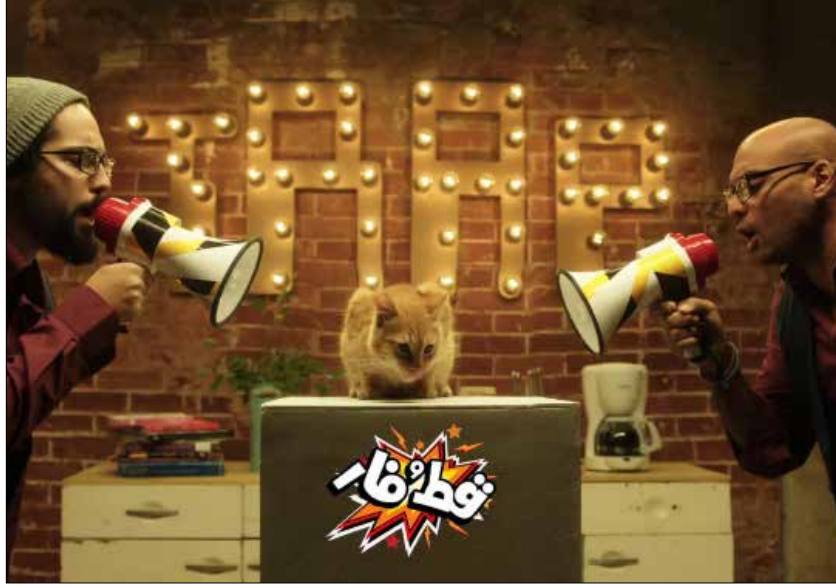
ينتمي فيلم «قط وفار» إلى الكوميديا السياسية