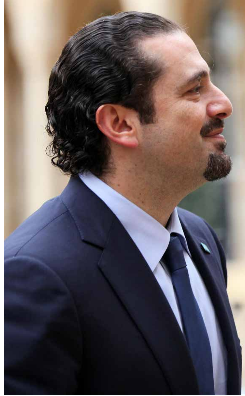
الحريري أنا موجود (أرشيف)

يأمل سلمان، قبل كل شيء، بإرضاء واشنطن، من خلال تنفيذ مطلبها الجيوسياسي بإنشاء «حلف سني» متراض، وموحد السياسات والخطط والأدوات. وهو ما يفتح، بحد ذاته، الباب أمام استيعاب الخلافات مع قطر وتركيا والإخوان المسلمين، وانخراط الأطراف في (1) تشكيل صيغة سياسية جامعة ومقبولة لسنة العراق، تتيح للحلف ذلك، الحصول على مقعد رئيسي في التسوية العراقية، و(2) إعادة تأهيل المنظمات الإرهابية في سوريا، كمعارضة سياسية - عسكرية «معتدلة»، بما يسمح بمشاركتها في التسوية السورية؛ أقله وفق المثال اللبناني. لم يترك النظام المصري أي شك في رفضه الدخول طرفاً في حلف طائفي يضم تركيا، أو يشتمل على حركات ومعارضات، أو يسمح بإعادة تأهيل الإخوان المسلمين. ويقترح، في المقابل، حلفاً عريضاً بين دول (السعودية والإمارات والأردن، في مرحلة أولى)، وليس مغلماً أمام العراق؛ بل أن سوريا ليست مستبعدة من ذلك الحلف، في خطة السيسي؛ يعني ذلك أن القاهرة تتجه إلى إحياء صيغة من التضامن العربي - غير الطائفي، في مواجهة الأزمات والحركات الإرهابية.