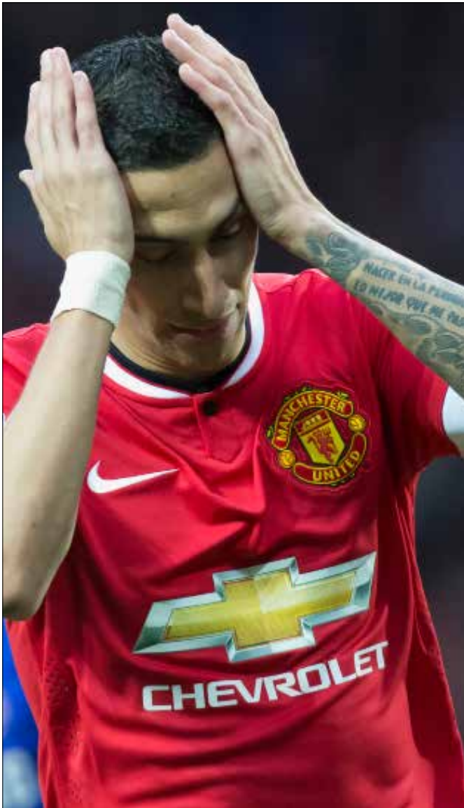
هبط مستواه دي ماريا بعد رحيله الى مانشستر يونايتد (الرياض)

اليوم، يبدو جلياً لأعين الجميع تقهقر أداء دي ماريا مع «الشياطين الحمر»، وسابقاً، حصلت الحادثة ذاتها مع عدد من اللاعبين: الألماني مسعود أوزيل، البرازيلي ريكاردو كاكّا، الإسباني فرناندو توريس والإنكليزي مايكل أوين. أوزيل مثل