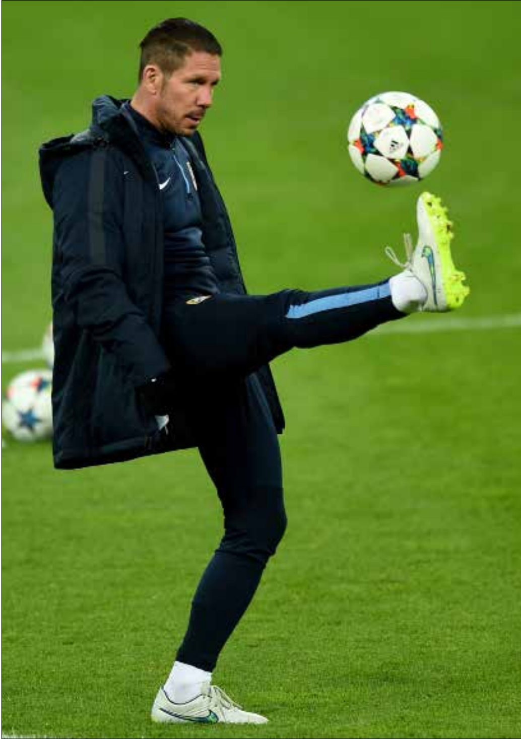
اشتهر سيميوني بلقب «البلطجي» الذي استمده من أسلوب لعبه القاسي

لكن كل هذه الألقاب في كفة واللقب الذي أطلق على المهاجم البرازيلي السابق إدموندو، في كفة أخرى، إذ ببساطة فقد اشتهر بلقب «الحيوان» نظراً لعنفه وعدم انضباطه.