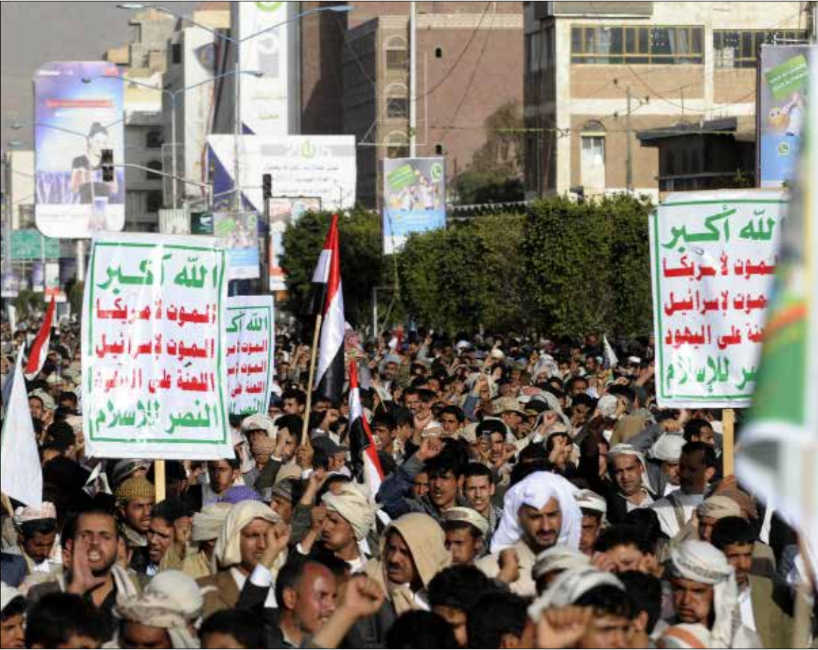
وصف هادي السلطة في صنعاء بانقلاب مكتمل الأركان

في محاولة لرسم واقع مختلف عن الذي يريده الخليج والغرب في اليمن، وفي ترجمة عملية لإعلان زعيم «أنصار الله»، عبد الملك الحوثي، انتهاج سياسية «البدائل» في العلاقات الإقليمية والدولية، بدأت الجماعة باتخاذ خطوات مهمة تكسّر مكانها في قلب الصراع الدائر في المنطقة، وفي حوثي برئاسة رئيس المجلس السياسي في الجماعة، صالح الصماد، في طهران، ووفد آخر في موسكو. خطوات كافية لتحدي مشيخة دول الخليج وبلورة آليات لمواجهة دول الخليج وبلورة آليات إزاء التطورات اليمنية، في الأسبوعين الأخيرين، كأنه يقول ضمناً: «الوصاية الخليجية أو الخراب».