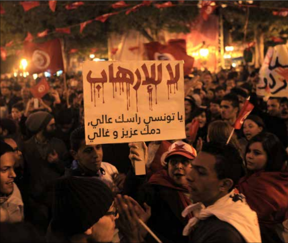
تونسيون يشاركون في التجمع في شارع الحبيب بورقيبة أمس

عاصمة عربية جديدة تقع في مرمى العمليات الإرهابية. ليكون واقم عايشته خلاله تونس. أمس، قدرة تلك التنظيمات على فرض مساراتها. ويأتي ذلك لي طرح أمام السلطات الجديدة جملة من التحديات، قد يكون من الصعب مواجهتها من دون تعزيز «الوحدة الوطنية»... وهو شعار يملك في الوقت نفسه كل مقومات السقوط في اللغة الخشبية