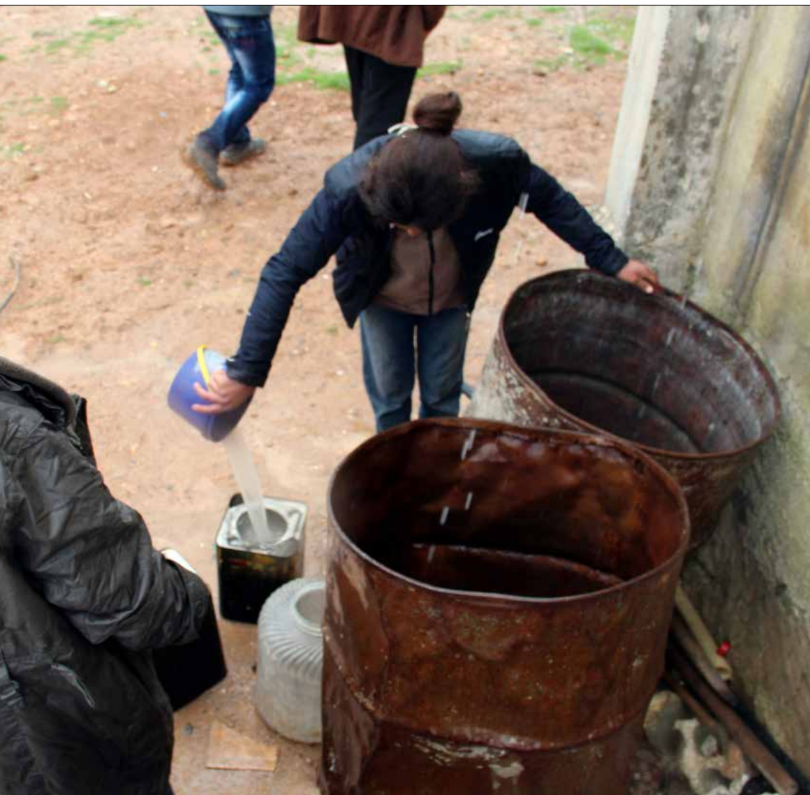
في عين العرب