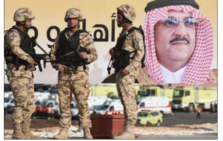
انهت قوات سعودية، يوم امس، التمارين العسكرية على الحدود العراقية

الطابق الاول: مؤلف من ثلاث شقق: كل شقة مؤلفة من صالون وغرفة جلوس وغرفة نوم وهول ومطبخ وحمام ويوجد فرندا كبيرة للشقق الثلاث 40 م x 3 م مسقوفة أما الشقة الثالثة لجهة الشرق فيوجد فيها تدفة مركزية. وعلى سطح البناء يوجد غرفة من الباطون كبيرة. خلف البناء من جهة الجنوب يوجد فسحة سماوية من الباطون ومن جهة الشرق خلف