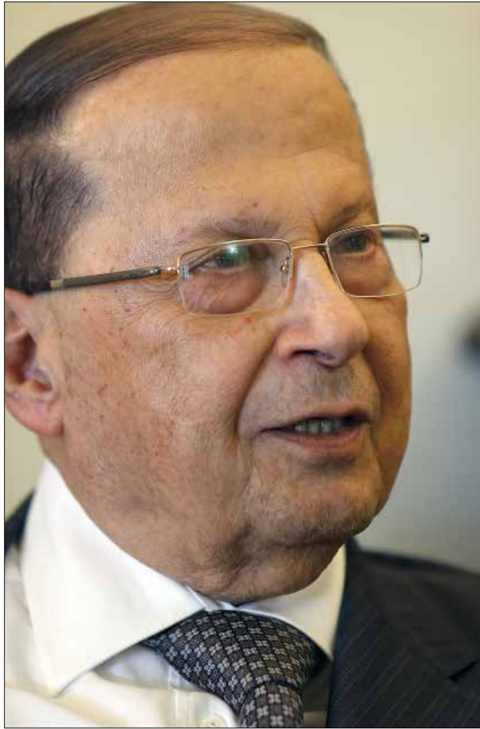
عون لن ينتظر الخارج ولن يجاربه في رئيس على صورة ما حدث عام 2008 (هيلم الموسوي)

4. اولى فوائد الحوار الماروني - الماروني، اعتقاد عون انه اجتذب جعجع الى ملعبه بمناداته هو الآخر، في «ورقة النيات» في الظاهر على الاقل، برئيس قوي يمثل بيئته الشعبية القوية. ما يعني بالنسبة الى رئيس تكتل التغيير والإصلاح تخلي محاوره سلفا عن فكرة المرشح التوافقي او الثالث. ما يصحح على عون في السورقة، يطابق مواصفات جعجع ايضا. الا ان البارز ايضا في تفاهمهما الاخير - وهو ما يزال تفاهما على الورق ليس الا - تأكيد جعجع بعبارة اضافها الى مسودة الورقة هي ان على الرئيس «ان يمثل العيش المشترك». لا تعني هذه العبارة في تفسير عون سوى تركيته هو. لا احد سواه بين المرشحين الموارنة المعلنين يصح فيه هذا الوصف.