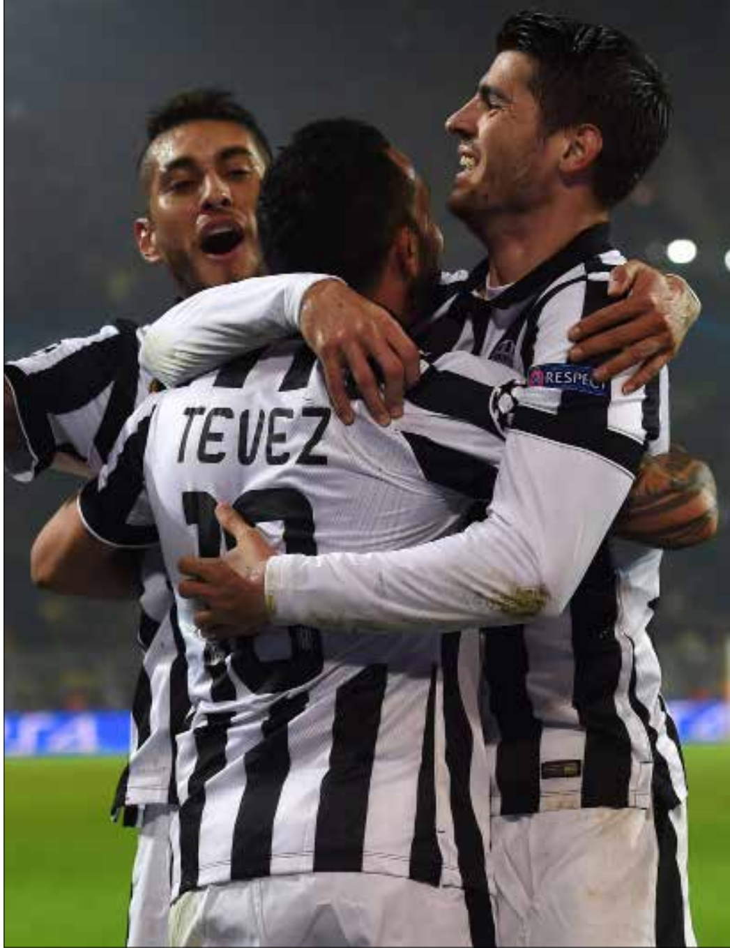
سلك تيفيز هدفين وصنع هدفاً لمورانا

وشهدت الدقيقتين 15 و27 ركلتين حرتين متشابھتين من ميسي مرّتا