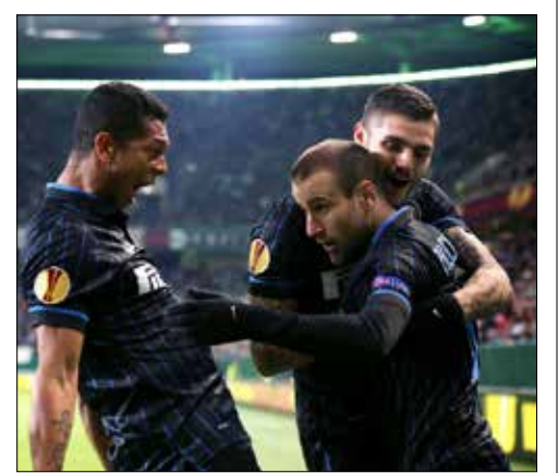
لم يذق انتر طعم الهزيمة قارياً في مبارياته الـ11 الأخيرة على أرضه

في مهمة صعبة جداً، يسعى انتر ميلانو الإيطالي بين جماهيره على ملعب «سان سيرو» لتعويض خسارته ذهاباً أمام فولسبورغ 1-3، في إياب الدور الـ16 من «يوروبا ليغ». ولم يذق انتر طعم الهزيمة قارياً في مبارياته الـ11 الأخيرة على أرضه كما حافظ على نظافة شبكاته في أربع من المباريات الخمس التي خاضها على أرضه في المسابقة هذا الموسم، لكن مهمته في إنقاذ موسمه، بعد أن خرج من مسابقة الكأس المحلية وفقد الأمل منطقياً باحتلال أحد المراكز الثلاثة الأولى المؤهلة إلى دوري الأبطال في الدوري، لن تكون سهلة أمام فريق لم يخسر في أي من مبارياته الثلاث