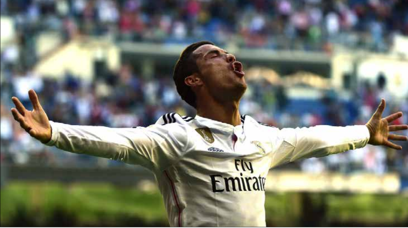
رونالدو محتفلاً بأحد أهدافه الخمسة في مرمره غرناطة

أصاب كريم بنزيما بإطلاقه وصف «ظاهرة» على زميله كريستيانو رونالدو عقب خماسية البرتغالي في مباراة ريال مدريد أمام غرناطة في الدوري الإسباني. سابقاً كان البرازيلي رونالدو «الظاهرة». والآن رونالدو آخر يبدو أنه يسير لخطف الصفة ذاتها