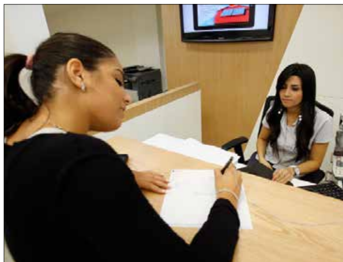
تعتبر مستويات الثقة تجاه الإدارة منخفضة بشكل عام (مروان طحطح)

ويعبر 42% عن رضاهم بوظائفهم الحالية، حيث إن 14% منهم "راضون جداً" بوظائفهم. ويرى 31% من المجيبين أنفسهم يعملون في الشركة عينها في خلال العامين المقبلين، في حين يحاول 55% الانتقال إلى شركة أخرى بشكل ناشط. ويعتقد 37% من المجيبين أنهم قادرين على إيجاد وظيفة جديدة بسهولة في شركة أخرى. وتبرز عوامل مثل نقص فرص التطور الوظيفي (74%) والراتب الأساسي المنخفض (67%)،