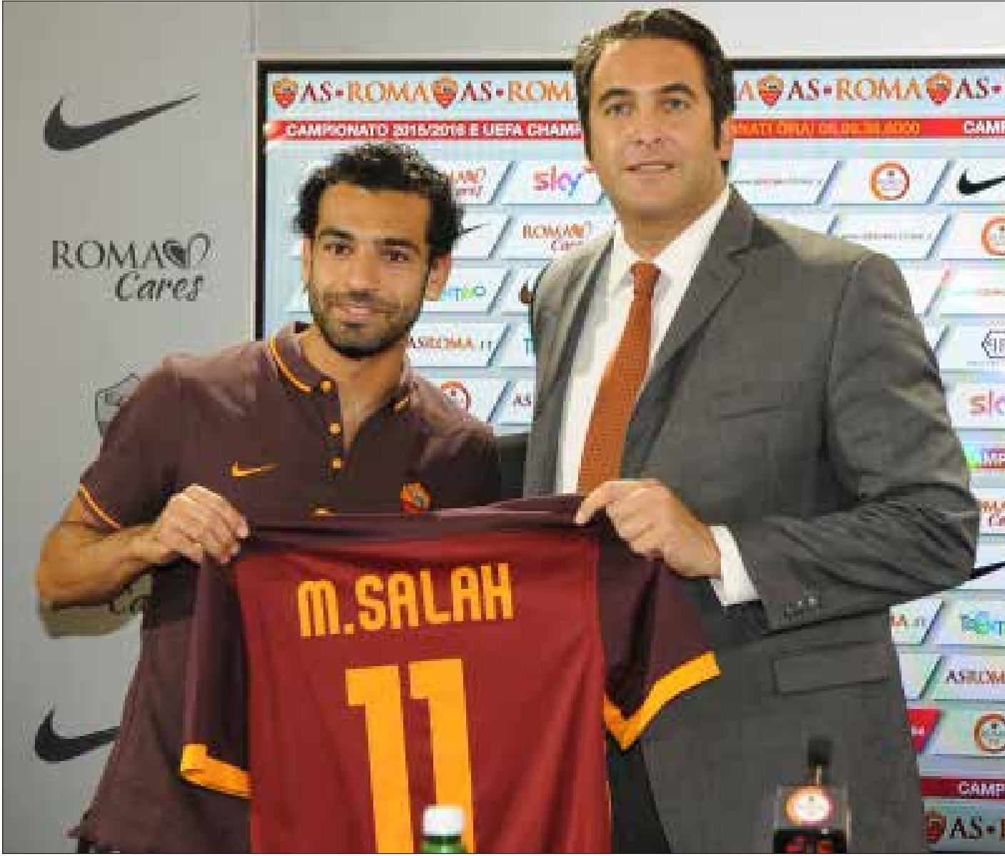
أضر روما على شرط افضلية الشراء في عقد إعاره صلاح مع تشلسي (ارشيف)

يتجه روما في موسمه الجديد نحو رفع مستواه التحدي في الدوري الإيطالي أمام يوفنتوس البطل الاوحد في المواسم الأخيرة. ما قدمه المدرب رودي غارسيا حتى الآن من نتائج وتعاقدات هو ثمار مشروع بناء فريق جديد أمام مهمات غير مستحيلة