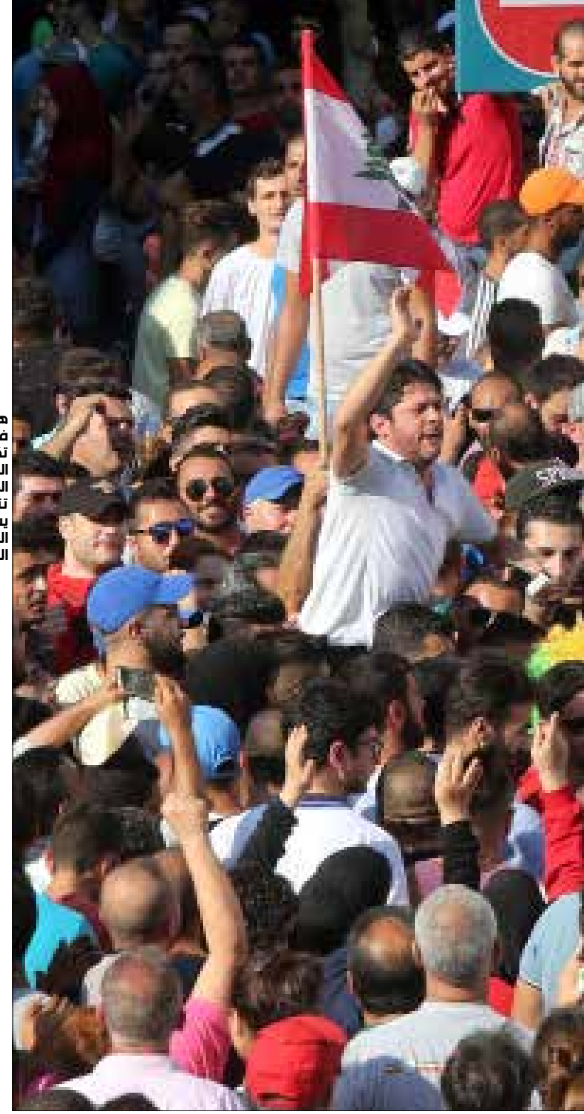
هيئة التنسيق فضلت ان تكون في الصفوف الخلفية وان تترك الشعب يسبقها الى الشارع