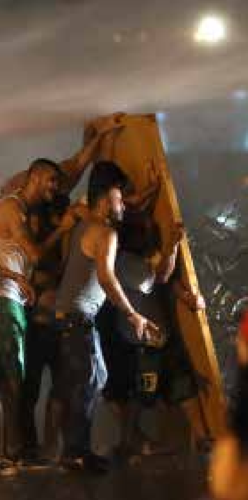
اعتبرت حملة «طلعت ريحتكم» أعمال العنف لا تمكّل ما تصبو إليه