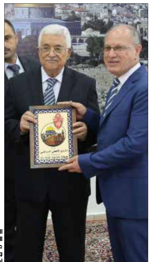
الخطة ان تبقّى الساحة لمن «يمون» عليهم «أبو مازن» ويسيطر على أصواتهم

حصلت «الأخبار» على محضر اجتماع مسرّب من مكتب رئيس «المخابرات العامة» اللواء ماجد فرج. قبل في اجتماع خصص لإحكام سيطرة محمود عباس على «منظمة التحرير» و«فتح»