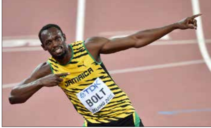
استقبل بولت بحفاوة من قبل الجمهور في ملعب «عش الطائر» (أ ف ب)

واستقبل بولت بحفاوة من قبل الجمهور الغير الذي احتشد في ملعب «عش الطائر»، فيما كان استقبال غاتلين خجولاً لدى تقديم المتبارين قبيل انطلاق السباق، وذلك لإيقافه مرتين بداعي تناوله المنشطات.