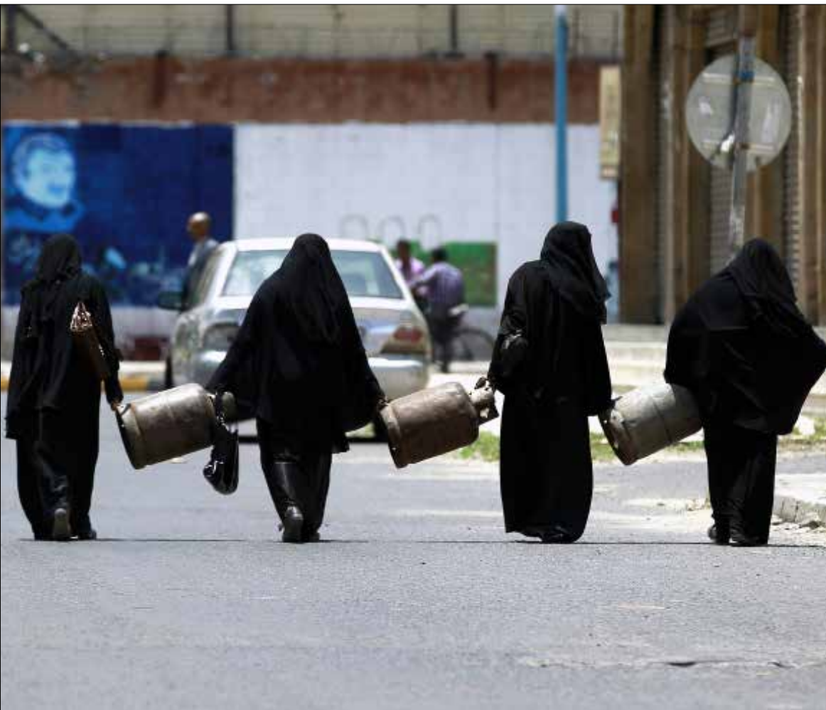
مؤشرات على فشل مفاوضات مسقط سببها تعنت السعودية وإصرارها على الدفع بحكومة هادي إلى صدارة الموقف (أ ب ب)

رفع تنظيم «القاعدة» أعلامه على المرافقة العامة في عدن بعدما سيطر على أجزاء واسعة من المدينة التي تمثل محور الصراع بين «الحلفاء»، في وقتٍ بدت فيه مفاوضات مسقط أقرب إلى إعلان الفشل بعد الكشف عن المطالب الجديدة للرياض، التي دعت هذه المرة إلى حل الجيش اليمني