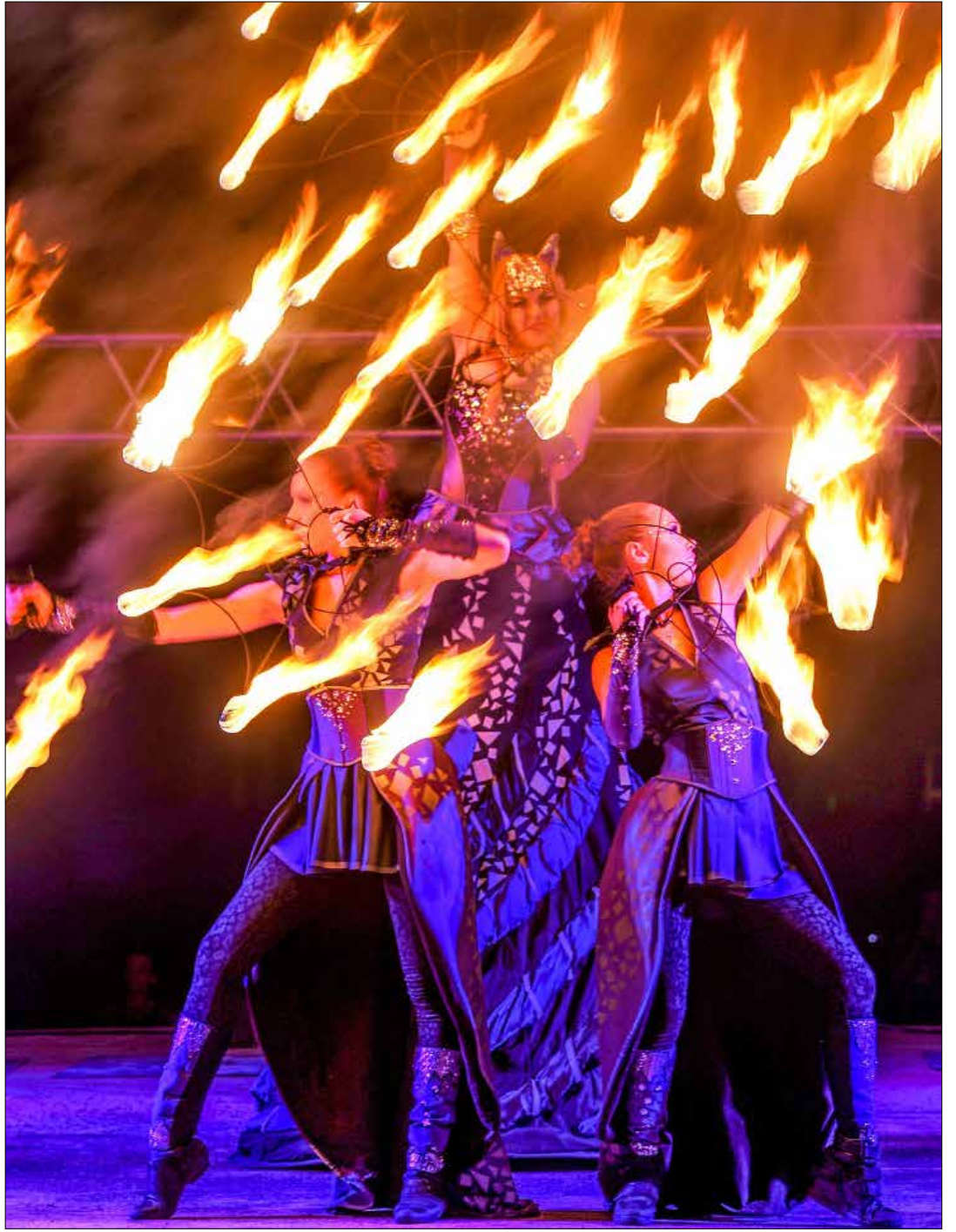
اختتم أخيراً «المهرجانات الدولية للنار» في مينسك. استمرت فعاليات MIFF-2015 على مدى يومين، وجمعت فرقاً محلية وأخرى من أوكرانيا وروسيا وأستراليا، قدمت عروضاً فنية مذهلة بواسطة النار. (ماكسيم هالينوفسكي - أ ف ب)