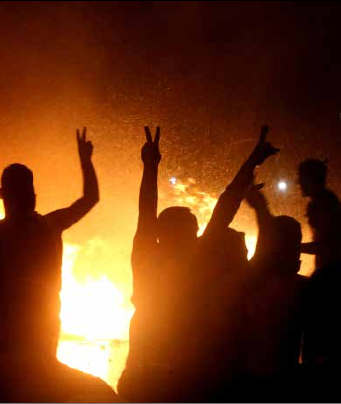
يكتفي المجتمع الاهلي حتى الان بالنفخ على النفايات وهي تحاصره