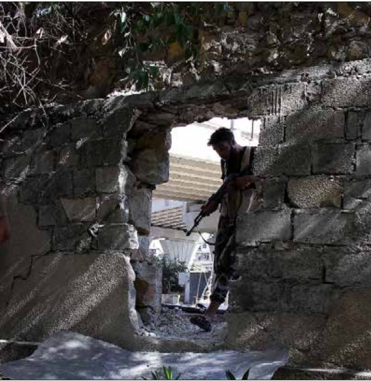
العملية لت تكون سهلة لوجود مقاومة عنيفة من المسلحين

وحاول مسلحو «جيش الفتح» و«جيش النصر»، فتح جبهتين في ريف حماة، لتخفيف الضغط على جبهة ريف اللاذقية الشرقي، بتنفيذهما هجمات على نقاط