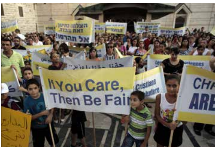
نظم أهالي الطلاب عدة مظاهرات في الناصرة والقدس المحتلة

تحصل على دعم مالي كامل إلى 100%، وتحافظ على استقلاليتها من حيث المضامين والتعليم». وكانت «التعليم» الإسرائيلية قد قلصت في السنوات الأخيرة الميزانيات للمدارس الأهلية إلى 29% من أصل ما تستحقه، وهو ما رأى فيه فهم استهدافاً لمدارسهم بسبب تميزها وتفوق طلابها، مضيفاً: «مشكلة إسرائيل مع مدارسنا ليست في أنها مسيحية، فأصلاً ليس هناك برامج تبشيرية تقريباً، كذلك من ضمن طلابنا مسلمون». وتابع: «مشكلتهم أننا نرفض سياسة التدرج التي تنتهجها الوزارة في المدارس الرسمية، فعند محاولتها فرض أي موقف، سياسي بالغالب، تجد أن الأبواب لدينا موصدة وغير مناحة لها». كذلك شدد الأب على أن مجمل المطالب للأمانة العامة هي «مستحقات تحصل عليها المدارس الأخرى، خاصة التابعة للمتدينيين»، نافية وجود أي مطلب برفع أقساط التعليم للطلاب كما تشيع الوزارة. ويرى القائمون على هذه المدارس أن قيمتها راسخة في اتفاق مبدئي بين الكرسي الرسولي وإسرائيل، جرى توقيعه عام 1993. وينص الاتفاق