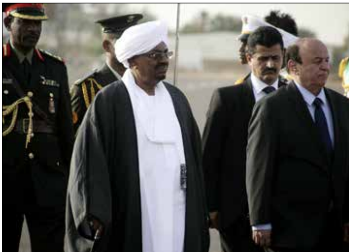
هادي، يحاول إقناع البشير بنقل كتيبة من الجيش السوداني إلى عدن (الناضول)

أسلحة إلى مدرسة الطبري في المدينة القديمة». ونفى قائد اللواء، العميد فؤاد العماد، في حديث إلى «الأخبار»، صحة الخبر الذي بثته القناة، فيما أكد أن عقيدة الجيش لا تسمح له بتخزين الأسلحة في المناطق السكنية، مشيراً إلى أن ذلك تبرير استباقي لنيات سعودية تستهدف المدنيين والتاريخ اليمني. في الأثناء، أكدت لـ«الأخبار» مصادر قريبة من الحكومة السودانية أن الرئيس اليمني الفاز، عبد ربه منصور هادي، يتصل يومياً بمسؤولين سودانيين رفيعي المستوى، وذلك