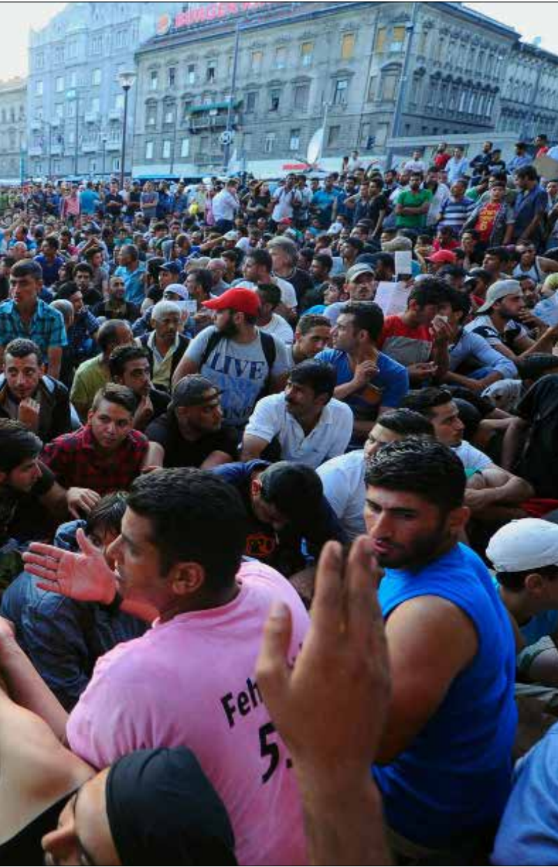
لاجئون سوريون وافغان في العاصمة المنغارية بودابست