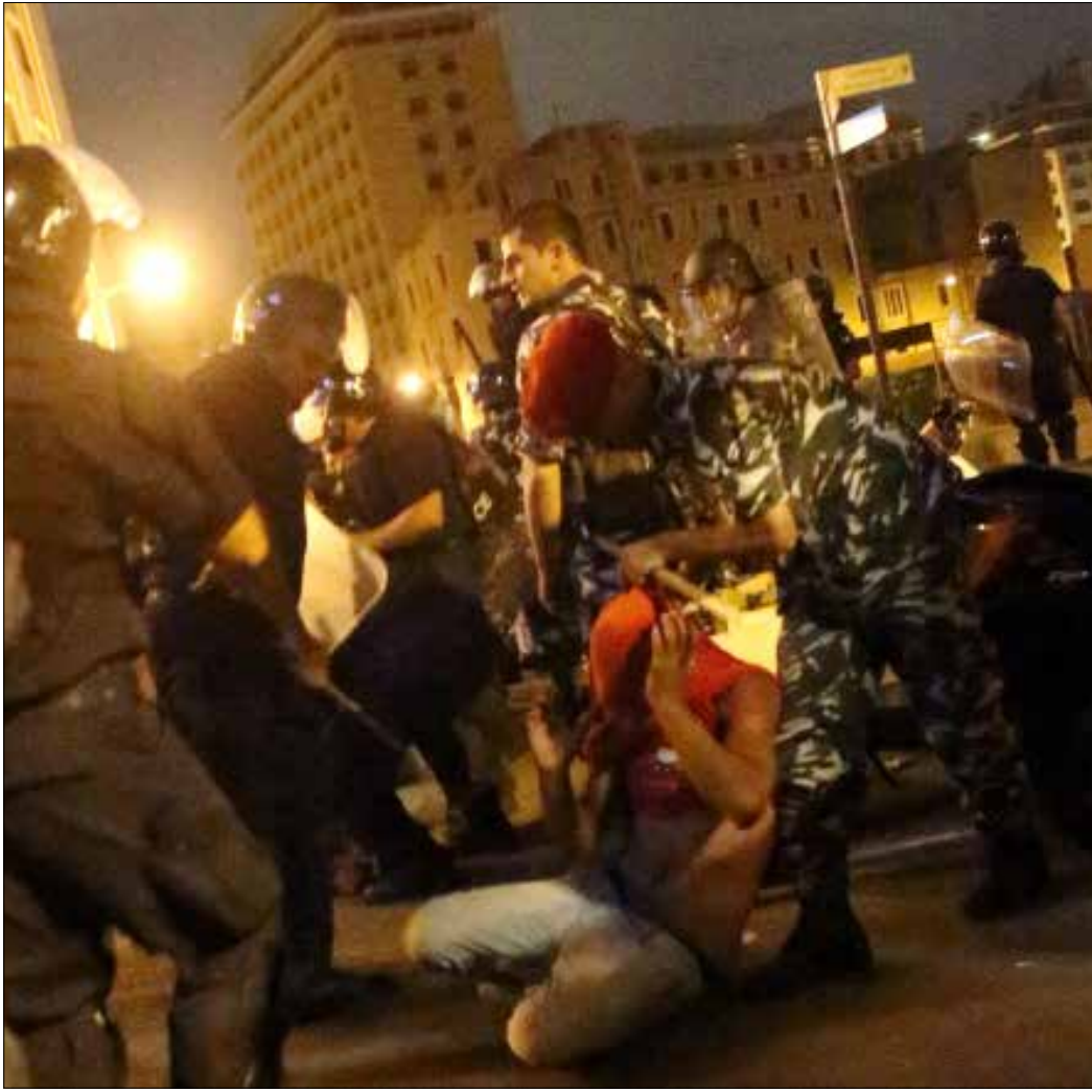
ترجع المشنوق عن «اتهام دولة عربية صغيرة بأنها تقف خلف ما حصل في شوارع بيروت»