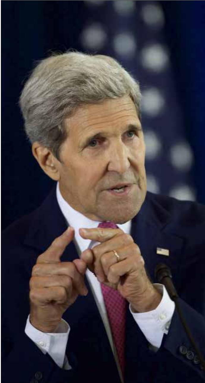
كبير: المقوبات لم تمنع إيران من تطوير برنامجها النووي (اف ب)

بفتح الباب على طموح آخر قد تسعى إليه الإدارة الأميركية، خلال الأسبوع المقبل، قبل عودة الكونغرس من عطلة، من خلال استغلال وجود 10 ديموقراطيين لم يتضح موقفهم بعد. فإذا ما قام 7 من هؤلاء بتأييد الاتفاق، لن يضطر أوباما إلى استخدام قلمه لتوقيع الفيتو، ذلك أنه في حال حصوله على دعم 41 عضواً للاتفاق من أصل 100 في مجلس الشيوخ، يصبح بإمكان داعمي الاتفاق تعطيل قرار الرفض، ففي مجلس الشيوخ، يجب أن يحشد الجمهوريون تأييد 60 صوتاً للانتقال بالقرار، بموجب النظام الإجرائي المعمول به، إلى المرحلة التالية، وإذا نجحوا سيحتاجون حينئذ إلى الغالبية البسيطة في المجلس، وهي 51 صوتاً للموافقة على القرار. ولا يوجد حاجز إجرائي مماثل في مجلس النواب، إذ من المتوقع أن يحصل القرار بسهولة على الموافقة هناك، حيث يشغل الجمهوريون 246 مقعداً في المجلس المؤلف من 435 عضواً. وإذا وافق المجلسان كلاهما على القرار، فإنه يرسل إلى مكتب الرئيس أوباما لمراجعته. ولكن مساعدين لرؤساء مجلس الشيوخ من المؤيدين والرافضين للاتفاق صرحوا بأنه ما زال من السابق لأوانه القول إن كان المؤيدون سيتمكنون من حشد الهدف المقبل، المتمثل بالرقم السحري (41 صوتاً). في هذه الأثناء، قام وزير الخارجية الأميركي، جون كيري، بمجهوده الخاص الهادف إلى توسيع الدعم للاتفاق النووي. قال من مدينة فلادلفيا إن الاتفاق يمنح إيران من الحصول على أسلحة نووية، مشدداً على أن «العقوبات لم تمنع إيران من تطوير برنامجها النووي، على مدار