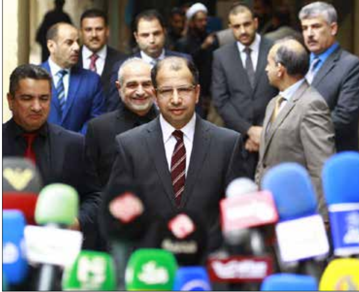
الجبوري: قانون الحرس الوطني هو اللبنة الأساس للشروع في عملية التحرير (الريف)

المصدر قال لـ «الأخبار» إن حفل الافتتاح جرى بحضور قائد عمليات نينوى، اللواء الركن نجم عبد الله الجبوري، وممثلين عن قوات «التحالف الدولي»، وضباط كبار من الجيش العراقي وقوات «البشمركة». إلى ذلك، دعا زعيم «التيار الصدري»، السيد مقتدى الصدر، أمس، إلى استمرار التظاهرات والمطالبة بإرجاع «الهاربين» بهدف محاكمتهم، مشيراً إلى أن استمرار التظاهر «يعني وجود بصيص أمل للوصول إلى إصلاحات حقيقية لا خجولة ولا وهمية، والوصول إلى إصلاح القضاء والتشكيل الوزاري المتهاكك ومفوضية الانتخابات والهيئات الوزارية واللجان التي باتت نائمة وغير فعالة».