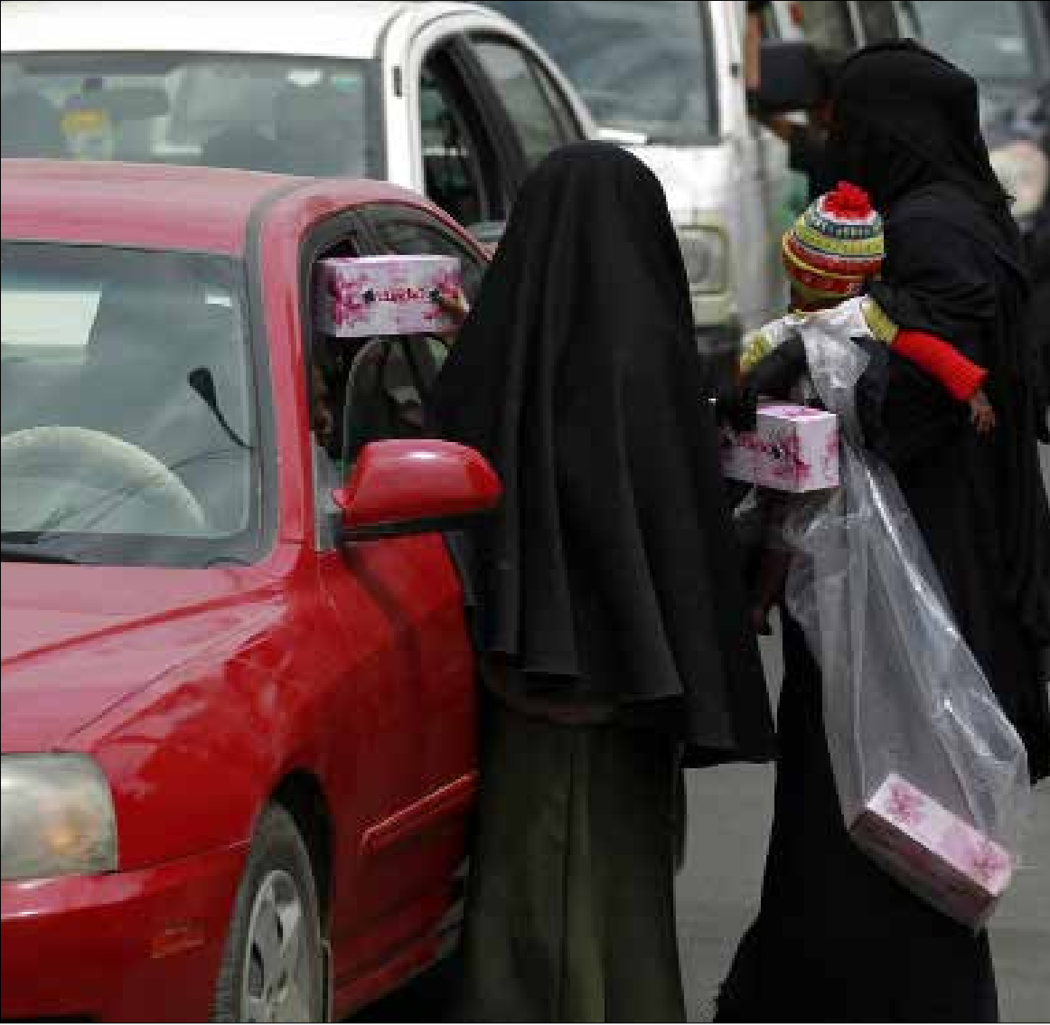
رافق الفورة النفطية انتعاش للفكر الوهابي وانتشاره

جاءت الفورة النفطية الخليجية، ولا سيما السعودية، لتمثل حجر عثرة في درب تطور المجتمع في اليمن؛ فتلج الفورة لم تكن مجرد نقلة اقتصادية ريعية كبرى، إنما رافقها «انتعاش» للفكر الوهابي وانتشاره.