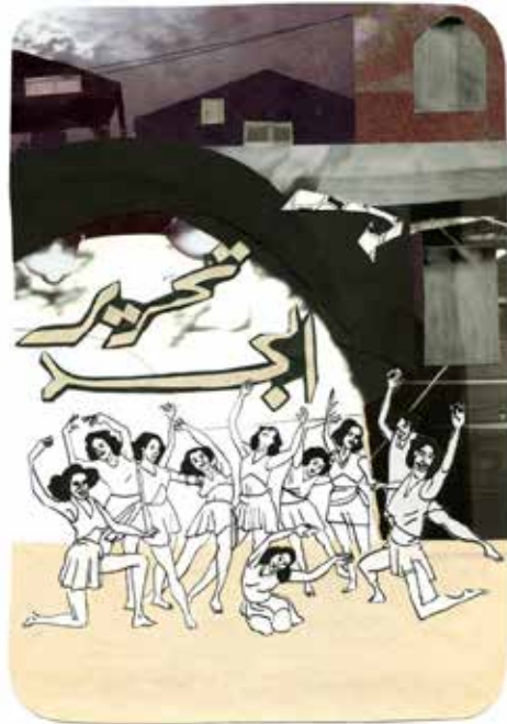
من «واجهة المصور»