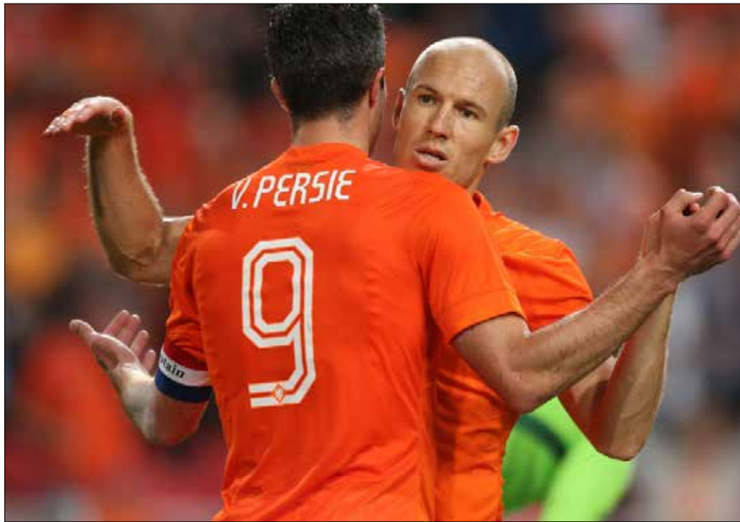
رضي فان بيرسي بان يكون القائد الثاني في المنتخب (ارشيف)