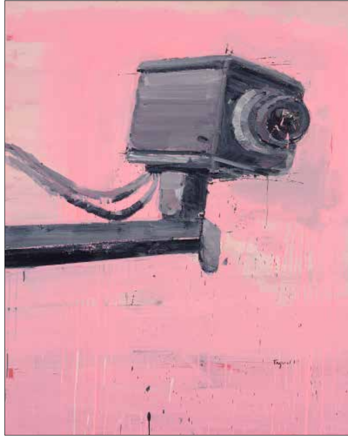
من سلسلة «آلات الرواية» (أكريليك على قماش - 120 x 100 سنتيم - 2015)

متهافتاً في ظل التطورات المتسارعة للفنون المعاصرة، وفي ظل الأسئلة الطليعية التي تطرحها التجارب الجديدة في المحترف اللبناني الذي بات معرضاً منذ أكثر من عقدين لتيارات وممارسات سوق الفن المعولة التي باتت النجاة من تأثيراتها القوية مسألة مستحيلة، إلى جانب أن أغلب التجارب اللبنانية الشابة تخترط طواعية في ممارسات هذه السوق، ولا تقاومها أصلاً.