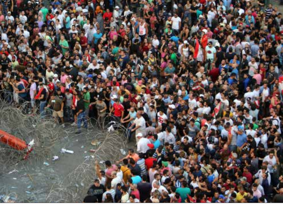
منظومة الفساد في لبنان تركت مسارب تغذية خارجية بعد أن سطت على الموارد المحلية

يتفق الجميع على أن الفساد متجذّر ومنتشر في لبنان. إلا أن اللبنانيين يختلفون في تقديم تعريف محدد للفساد. ففي المجتمع غالباً ما يكون التعريف بسيطاً يقترب من تعريف اللصوية، كالاختلاس والرشوة. أما التعريف لدى منظمات المجتمع المدني، فيعرف من ادبيات المنظمات الدولية التي تحصر الفساد في إطار سوء استغلال السلطة والتكسب الشخصي. إلا أن بعض الخبراء يرون أن الحالة اللبنانية تقدّم التعريف الحقيقي للفساد بوصفه «منظومة متكاملة» و«ظاهرة اقتصادية» تعمل من أجل السطو على أصول المجتمع وثروته