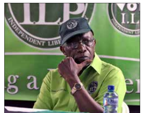
الترينيدادي جاك وارنر النائب السابق لرئيس «الفيفا»

تواصلت فصول مسلسل فضيحة الفساد التي ضربت الاتحاد الدولي لكرة القدم، وجديدها أمس قرار الغرفة القضائية في لجنة الأخلاقيات التابعة لـ«الفيفا» بمعاقبة الترنيديادي جاك وارنر، النائب السابق لرئيس الاتحاد الدولي، بالإيقاف مدى الحياة عن كل الأنشطة الكروية.