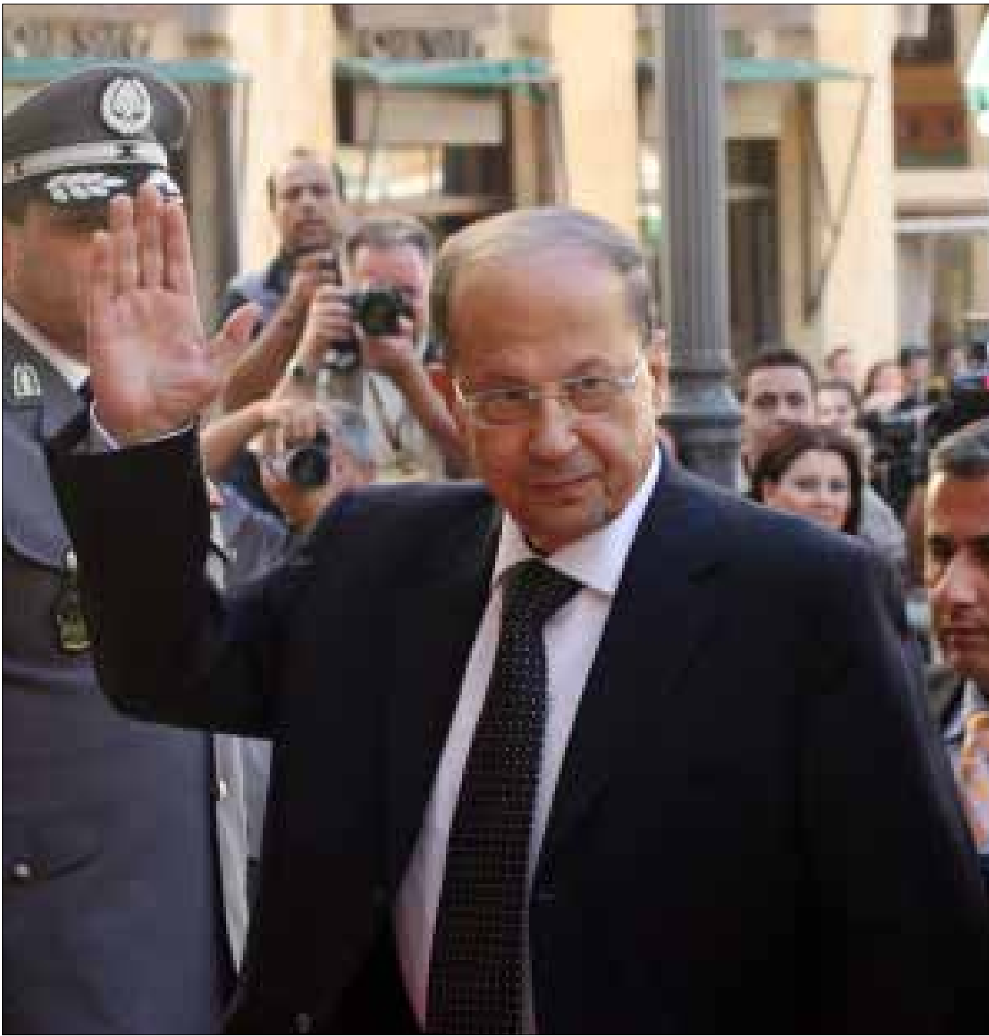
عون لوّح بالخروج من الحوار

نجح هن «دس» بند «تعيين مدير عام جديد لقوى الأمن الداخلي وتعيين مجلس قيادة قوى الأمن الداخلي» بين بنود «تسوية» الترتيبات الأمنية في إلقاء ظلال سوداء على التفاهم الذي كان يجري العمل على التوصل إليه لإعادة تفعيل العمل الحكومي، وفي إثارة حفيظة العماد ميشال عون الذي لوّح بالخروج من الحوار وقلب الطاولة