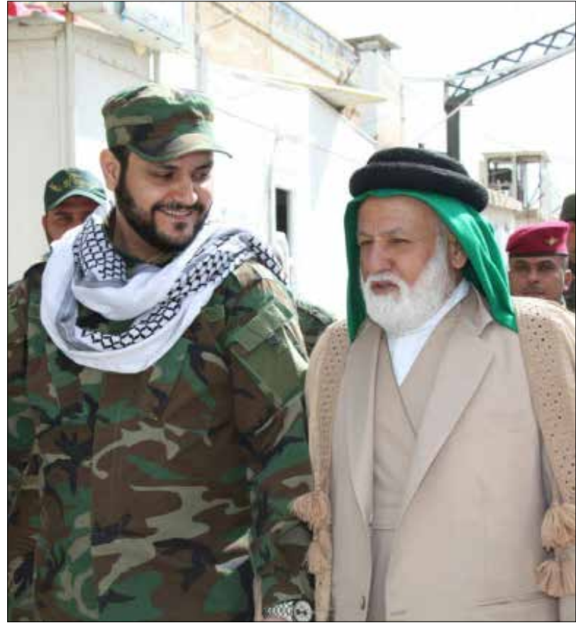
قواتنا في سوريا تفانك في حلب وسهل الغاب وأصبحت لنا مصانعنا الخاصة لإنتاج السلاح

أبطال قصة الشيخ أكرم، وشركائه ورفاقه. هم شخصيات تاريخية. كالشهيد عماد مغنية والسيد حسن نصر الله. الذين كان لهم دورٌ أساسي في إنشاء المقاومة العراقية. وقد لا يعرف الكثير من اللبنانيين اليوم الدور المحوري الذي أداه رجاله من «حزب الله» في العراق. كالشهيد إبراهيم مهدي حمد (ولاء)، الذي كان من أبرز مدربي حركة «النجباء». وقد استشهد في تدمير في ليلة القدر هذه السنة؛ أو الشهيد القائد محمد عيسى (أبو عيسى الأقليم)، العسكري الفذ في «حزب الله». وأحد أبطال حرب تموز 2006؛ وهو كان مستشاراً عسكرياً لـ«النجباء» واستشهد في القنيطرة. والشهيد إبراهيم مسلماني (عابس)، الذي كان قائد محور النجباء في حلب وقد استشهد فيها. عن هذا التاريخ، وهذا التراث الشخصي، والمعركة القائمة اليوم على طول المشرق العربي، يتحدث إلينا الشيخ أكرم الكبي