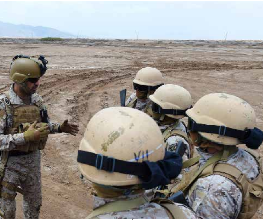
تتقدم حركة «انصار الله» حاملة مشروع دولة وطنية، فتُجند جماعات التكفير لكسر مشروعها

من القوميين العرب إلى هوياتها الطائفية والمذهبية والعشائرية. ومع ظهور بوارد سقوط نظام معاهدة وستفاليا الذي يحكم العالم منذ أكثر من ثلاثة قرون ونصف القرن، تشكلت في منطقة الشرق الأوسط ثلاث قوى سياسية أساسية جديدة خارج أطر الدول والحكومات، أو في موازاتها، وهي: