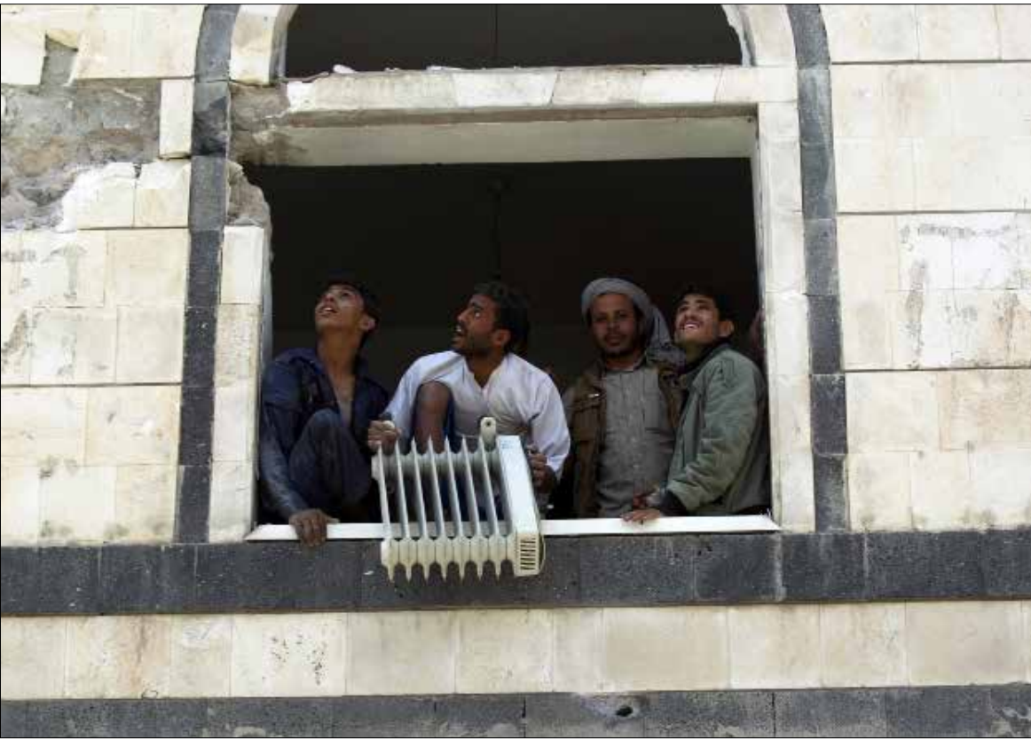
تواصلت المواجهات في الجهة الجنوبية الغربية لمدينة مارب

في صفوف الضباط والجنود السعوديين. في السياق نفسه، أكد مصدر في «الإعلام الحربي» أن الجيش و«اللجان» تقدموا خلف قرية حامضة في جيزان، وهي قرية قد سيطروا عليها سابقاً، مشيراً إلى أن القوة الصاروخية للجيش و«اللجان» تمكنت من السيطرة على قرية الكرعمي بعد قصفها بصواريخ من الصواريخ، ما دمر عدداً كبيراً من الآليات، إضافة إلى قصف متكرر استهدف موقع المصفق العسكري في جيزان.