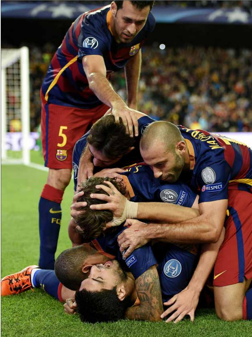
فرحة لاعبي برشلونه بهدف الفوز.

وتصدر برشلونه المجموعة ب 4 نقاط، يليه ليفركوزن ب 3، ثم باتي بروبسوف ب 3 أيضاً، وروما بنقطة واحدة. وفي المجموعة السادسة، سحق