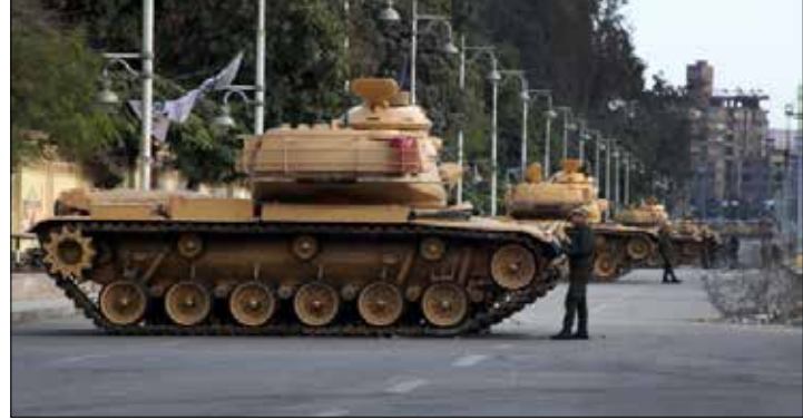
الجيش المصري خلال السنوات الأخيرة من عهد مبارك عانى بشأن تطوير ألياته (أي بي آيه)

صفقة بنحو مليار دولار بين مصر وروسيا أعلنت عنها أمس