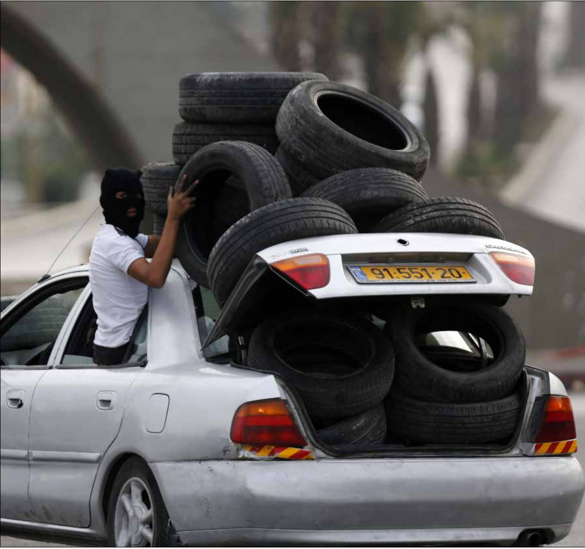
شارك فلسطينيو الـ48 في المواجهات التي اندلعت منذ أسبوعين

العملية التي أدت إلى قتل جندي ومستوطن إسرائيلي، واتضح استشهاده منقذها الذي لم يكن إلا من فلسطينيي الـ48. أعادت الجدار بين نواب الكنيست والجمهور حول سبل المقاومة المتاحة في فلسطين المحتلة