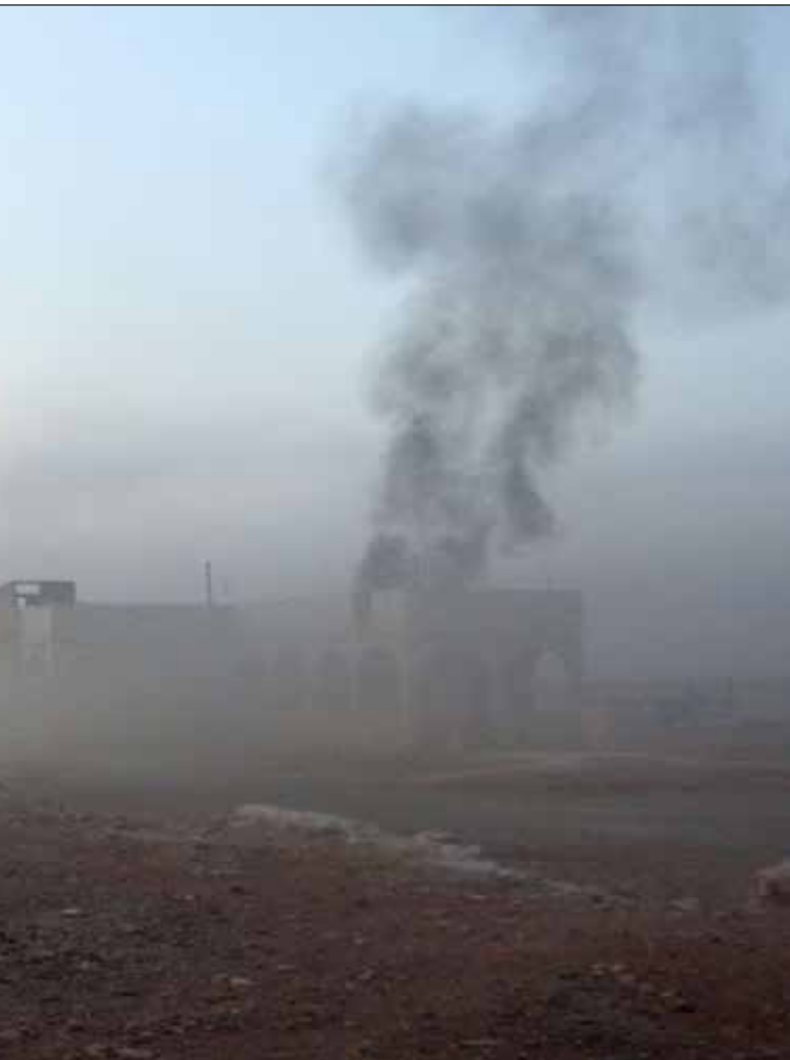
الحروب تنتهي حين تخرج بصريف متفكّ عليه للجبهات والمنتصرين والمنهزمين (أف.ب.ه)

الجوية» في نشرة الطقس في التلفزيون الروسي الرسمي، مع حديث «دبلوماسي» في الوقت نفسه عن «سوء الأحوال الجوية» التي تطيح أحياناً بطائرات السوخوي إلى داخل الحدود التركية - الأطلسية. مناخات الاطراف الأخرى بينما كان الجيش السوري يخسّر مطارات وقواعد دفاع جويّ من جهة وينفّذ على مدى أكثر من أربع سنوات سيناريوهات