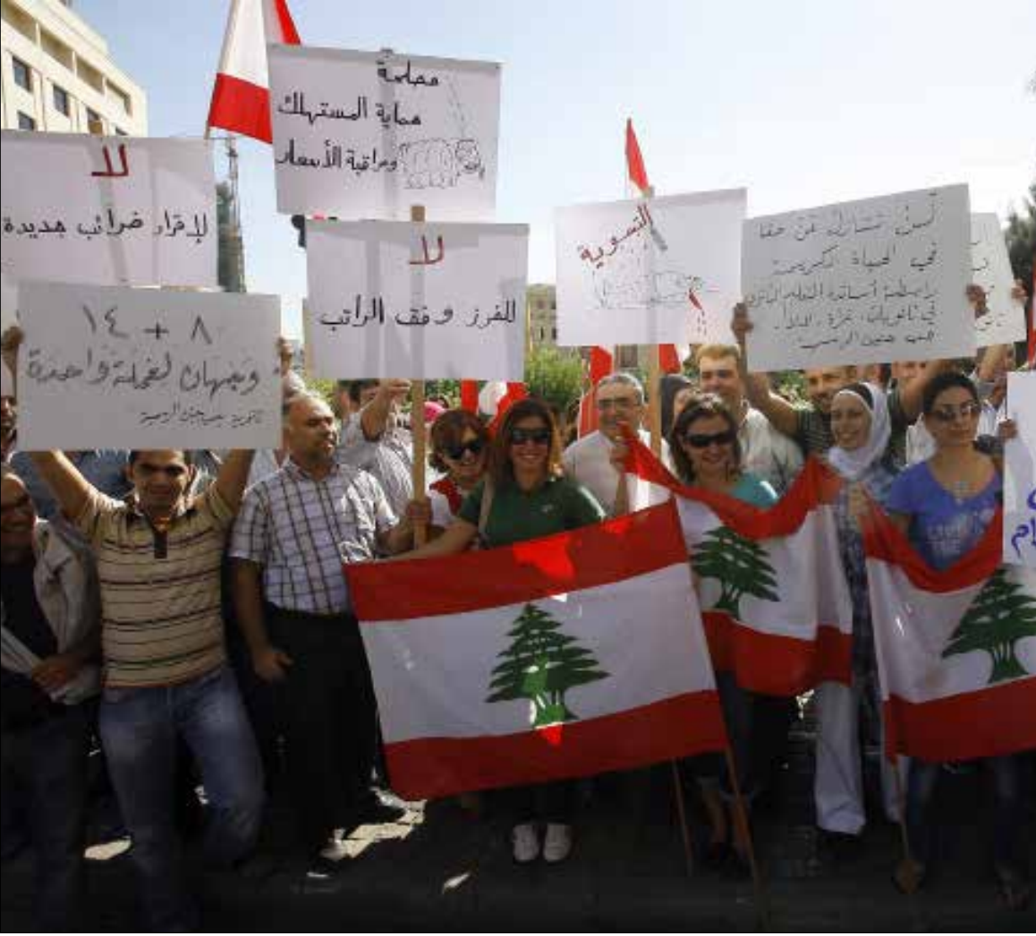
سالم بو صعب ما إذا كانت رابطة الثانوي ستنتفض عن هيئة التنسيق (مروان طحطح)