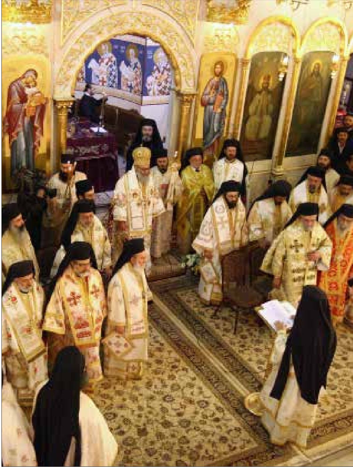
الفرزلي: القانون الأرثوذكسي داخل البيت الأرثوذكسي (أضرب)

رفع الصوت ضد خطف المطارنة والرهبان وتدمير الأديرة والكنائس. واللافت أن البطريرك اليازجي كان قد عقد قبل عام مؤتمراً يبحث «دور الشعب الأرثوذكسي في الحياة الكنسية»، إلا أن توصياته صُمت سريعاً إلى أرشيف الكنيسة الممتلئ بالتوصيات التي لا يُنفذ منها شيء. اقتصادياً، يبدو المشهد الأرثوذكسي اليوم على النحو التالي: الجمهور في عكار وطرابلس والكورة والأشرفية وزحلة ومرجعون وجبل لبنان في مكان، ورجال الأعمال المحيطون برجال الدين في مكان آخر. والهوة شاسعة بين رجال الأعمال الذين يريدون التوسع في أعمالهم ضمن نطاق الوقف الكنسي والمؤسسات الكنسية التربوية والاستشفائية، والجمهور. أما رجال الدين، فيفضلون حماسة رجال الأعمال ومشاريعهم المربحة على شكاوى المؤمنين واحتجاجهم الدائم على ارتفاع الأسعار وغيرها. أما سياسياً، فالناخبون الأرثوذكس في عكار وطرابلس والكورة والأشرفية وزحلة وجبل لبنان في مكان، وممثلوهم المغترضون في المجلس النيابي في مكان آخر. ويتطابق موقف النواب الحريري هنا مع غالبية رجال الدين. ومن تصدى لاقتراح القانون الأرثوذكسي بقوة سابقاً كان النواب الأرثوذكس أولاً الذين سيخسرون مقاعدهم إذا حظيت طائفتهم أخيراً بفرصة انتخاب ممثليها، بدل أن يواصل تيار المستقبل انتداب موظفيه لتمثيلها. والمطارنة ثانياً لخشيتهم على التقليد القائم بتزكيتهم فلاناً من موظفي المستقبل على غيره من الموظفين لدى القيادة الحريية. معلماً، يسال نائب رئيس مجلس النواب السابق إيلي الفرزلي عن الفائدة التي يجنيها المواطنون الأرثوذكس من «مستشفى الروم»، داعياً الكنيسة إلى نشر ميزانية توضح ما يتسبب بخسارة المستشفى عاماً تلو الآخر. والسؤال واجب، أيضاً، عما يدفع جامعة جامعة البلمند إلى