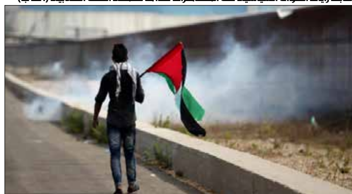
غابت رايات القوى السياسية عن المظاهرات عدا ما نظّمته الكتلة الطلابية

في الوقت نفسه، لوحظ خلال ثلاثة أسابيع من المواجهات أن المظاهرات حافظوا على رفع العلم الفلسطيني في نقاط المواجهة من دون رايات