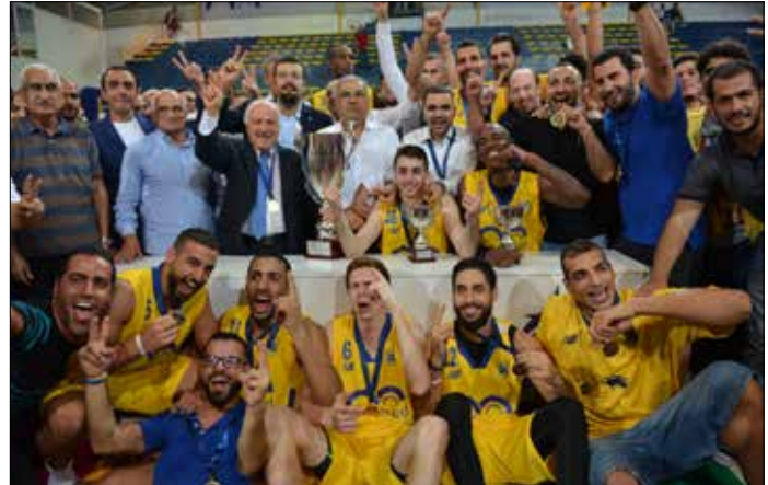
لاعبو فريق الرياضي مع كأس الدورة