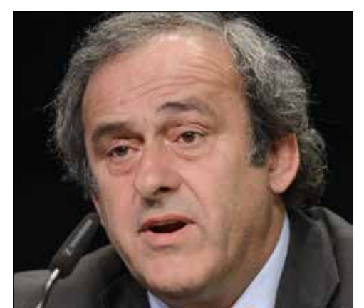
ميشال بلاتيني

وبخصوص الفضيحة كشف بلاتيني انه لا وجود لعقد مكتوب بشأن تحويل مبلغ مليون و800 ألف فرنك سويسري من قبل بلاتر الى حسابه الخاص، مشيراً الى ان اتفاق «جنترلان» حصل بينهما. وفي حديث لصحيفة «لو موند» الفرنسية أضاف نجم منتخب فرنسا السابق: «على أي حال،