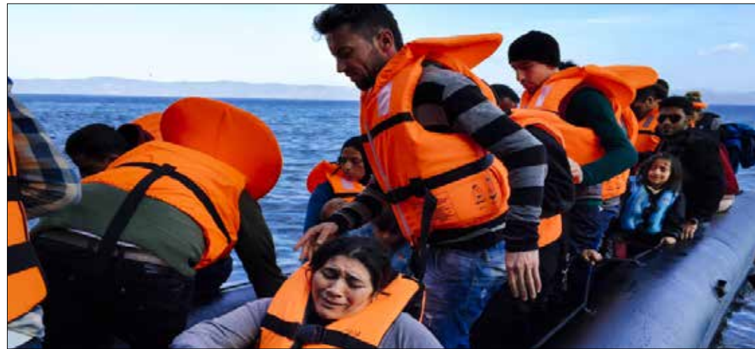
تطلب أنقرة من بروكسل ألمانيا خيالية مقابل احتجاز اللاجئين

تبدو شروط تركيا لتعاونها مع الاتحاد الأوروبي في الحد من تدفق اللاجئين إلى القارة صعبة أو حتى مستحيلة التحقق. فإذا ما وافقت بروكسل على المساعدات المالية التي تطلبها أنقرة، فإن مطالب الأخيرة بإدخالها منطقة «شغن» وتحقيق تقدم جدي في مفاوضات انضمامها إلى الاتحاد ستظل بعيدة المنال.