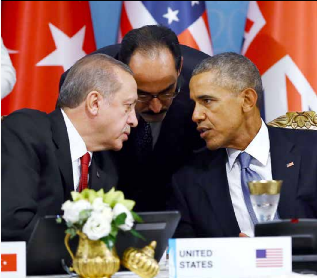
اتفق القادة على توليف التعاون الاستخباراتي ومراقبة الإنترنت

وقال رئيس الوزراء البريطاني، ديفيد كاميرون، إن «الهجمات المروعة في باريس (مساء يوم الجمعة الماضي)،» بعد وقت قصير من كارثة طائرة الركاب الروسية، وبعد تفجيرات أنقرة وهجمات تونس ولبنان، تؤكد الخطر الذي تواجهه»، مضيفاً أنه ونظراءه اتفقوا على «اتخاذ خطوات مهمة أخرى لقطع التمويل الذي يعتمد عليه الإرهابيون، ومواجهة الفكر المتطرف للدعاية الإرهابية، وتوفير