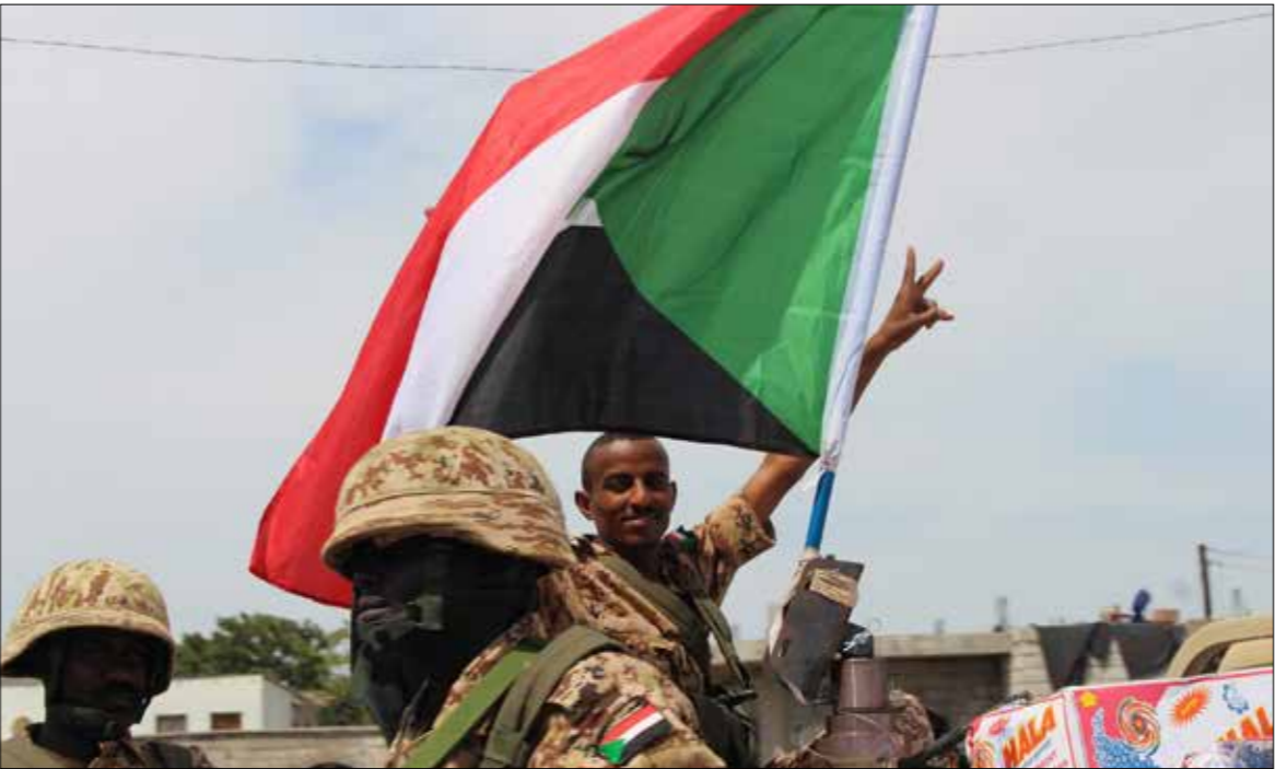
صدّ الجيش و«اللجان الشعبية»، أكبر هجوم على مواضعهم في محيط كوفل وكوفل وصرواح في حارب