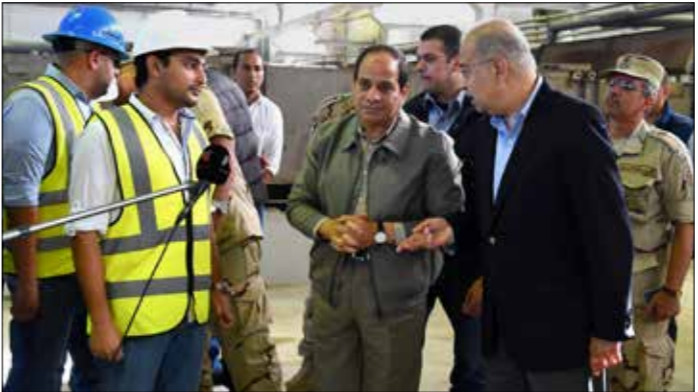
نيه السبسي إلى انه سيتابع ام قصور في إنشاء المحطة النووية (اي بي ايب)

«لجنة التحقيقات في الطائرة الروسية لم تتوصل إلى نتائج محددة بالنسبة إلى أسباب الحادث حتى الآن»، مشيراً إلى أنه «كُونت لجنة خماسية تجري التحقيق حالياً».