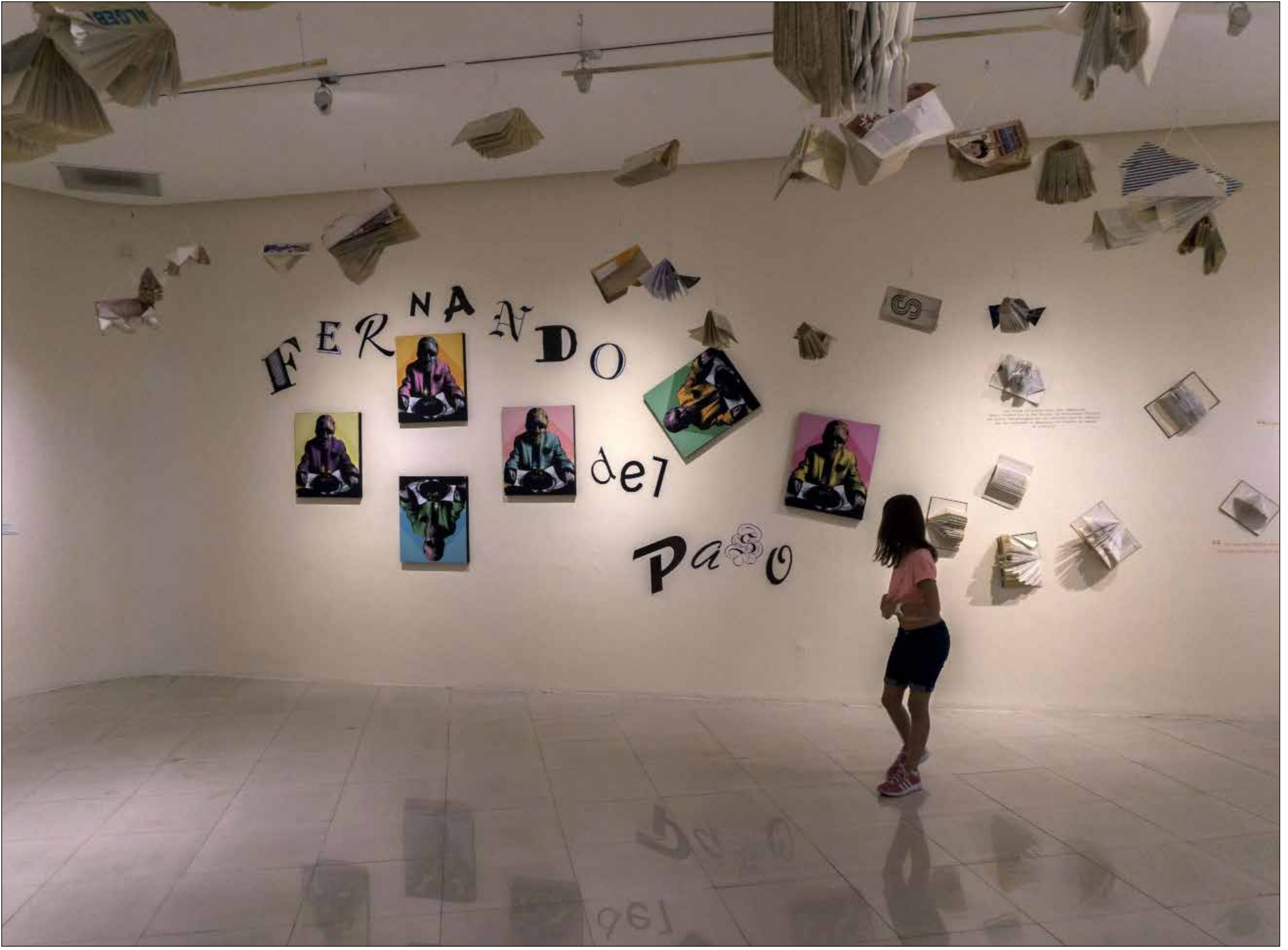
بعدهما حاز الكاتب المكسيكي فرناندو ديك باسو (1935) اخيرا جائزة «جائزة ثيربانتس للأدب» لعام 2015. يعرّض معرض «Drawing is the revenge of my left hand to the act of writing» في «متحف راوول انغابو» في غوادالاخارا بالزّوار. المعرض يهدف إلى تكريم باسو وتعريف الناس به أكثر. يذكر أنّ «جائزة ثيربانتس» التي تمنحها وزارة الثقافة الإسبانية، هي إحدى أهم الجوائز الأدبية في البلدان الناطقة باللغة الإسبانية.