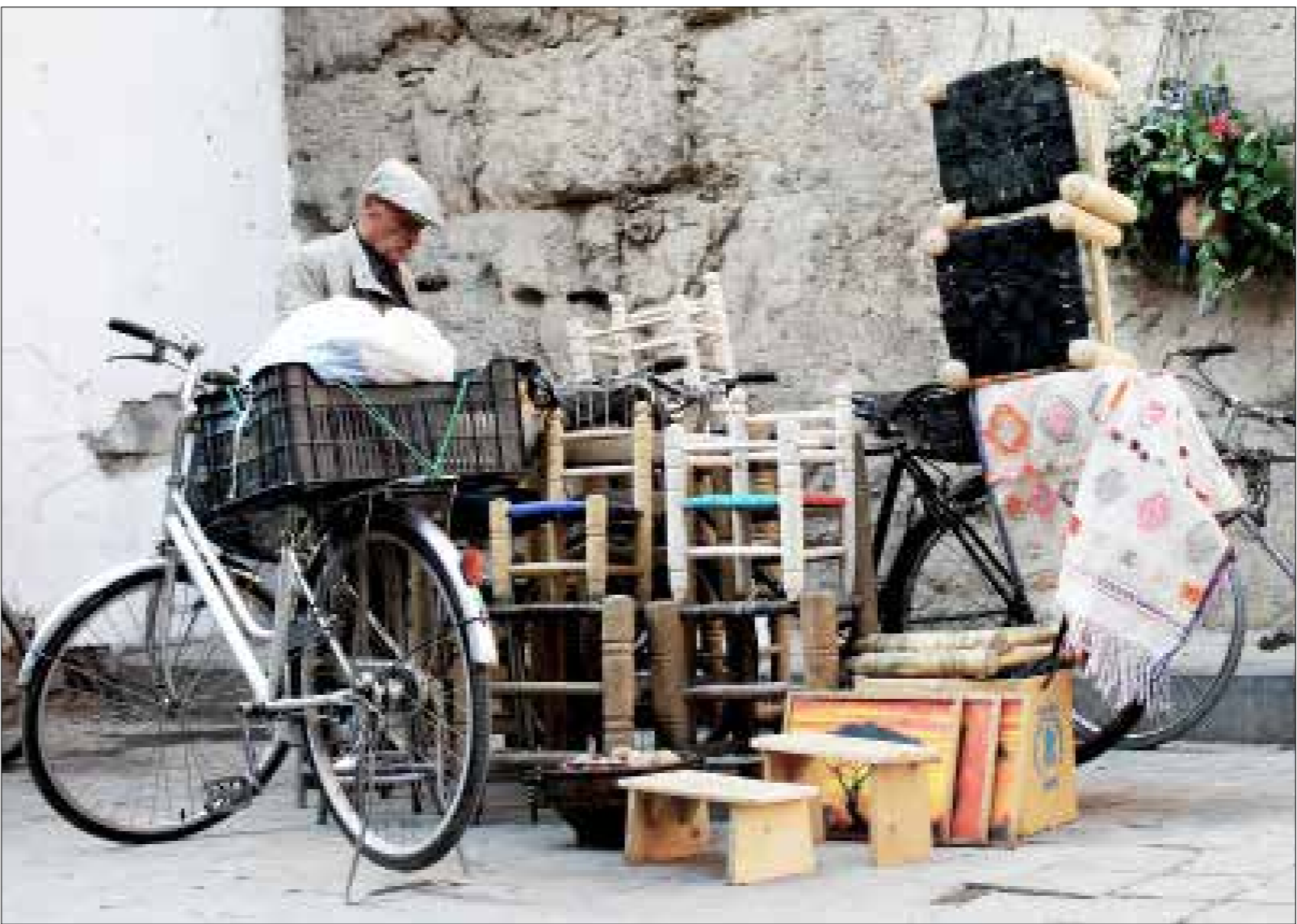
تنشر الطازمة في مدينتي عدرا وحسب، الصناعيين وفي حماه وحلب (هادي احمد)

وحول المناطق التي ينتشر فيها هذا الأمر، يضيف المهندس الشهابي أنّ «هذا يحدث في مدينتي عدرا وحسب».