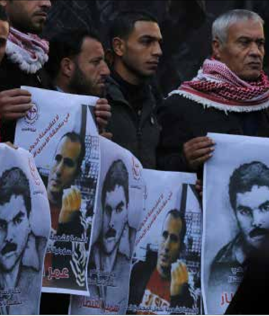
سجّل أسرى محررون همت عاشروا القنطار في السجن مواقف مشرفة