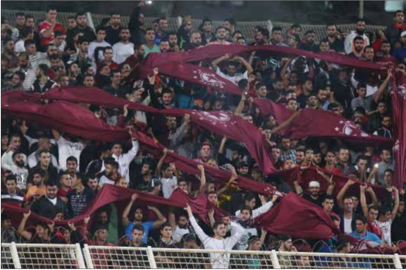
هل يُغلق ملعب آخر في وجه جمهور النجمة؟ (عدنان الحاج علي)

حتى يوم أمس كانت ارتدادات الضجة التي أثارها حرب البيانات النجموية - الزغرّتاوية لا تزال تترك صداها في الوسط الكروي. إذ إن ملعب المرداشية لم يسقط عن السنة الك. والسبب أن المسألة لم تنته. لأن النجمة ينتظر العودة إلى زغرّتا بعد أيام