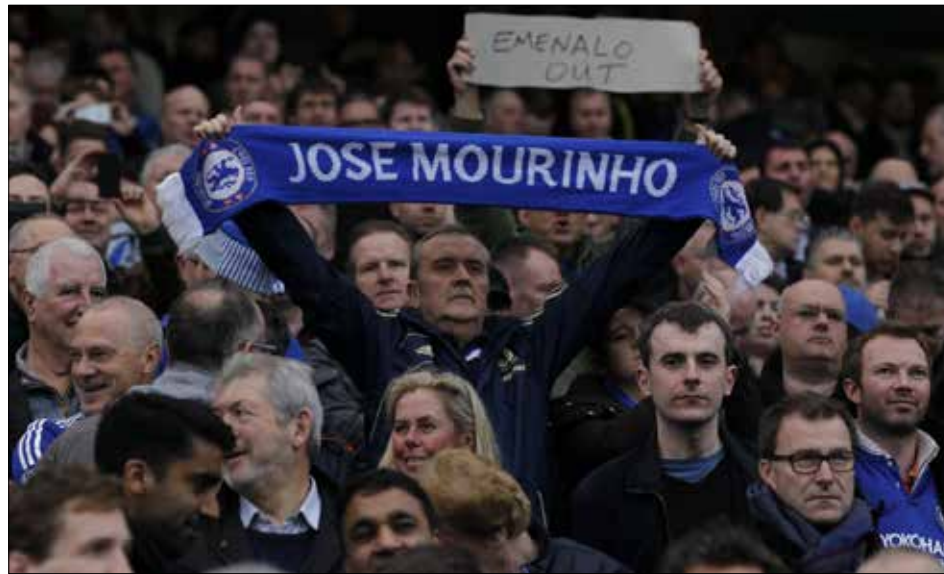
يستقبل المدرّب بحفاوة ويودّع بصافرات الاستهجان

المضحك المبكي أن المدرّب يُستقبل بحفاوة لا مثيل لها عند قدومه إلى الفريق، وتروح الجماهير تنثر الورود لحلولة عليها، لكنه يودّع بصفارات الاستهجان تماماً كما الحال مع الهولندي لويس فان غال، على سبيل المثال، عندما وصل إلى مدينة مانشستر الإنكليزية حين قامت الجماهير برسم صورته عبر باقات الزهور التي تشتهر بها بلاده، وإذا به لا يسلم الآن من الانتقادات والمطالبات بإقالته. الغريب في حالة فان غال أن هذه الهجمة التي طاولته