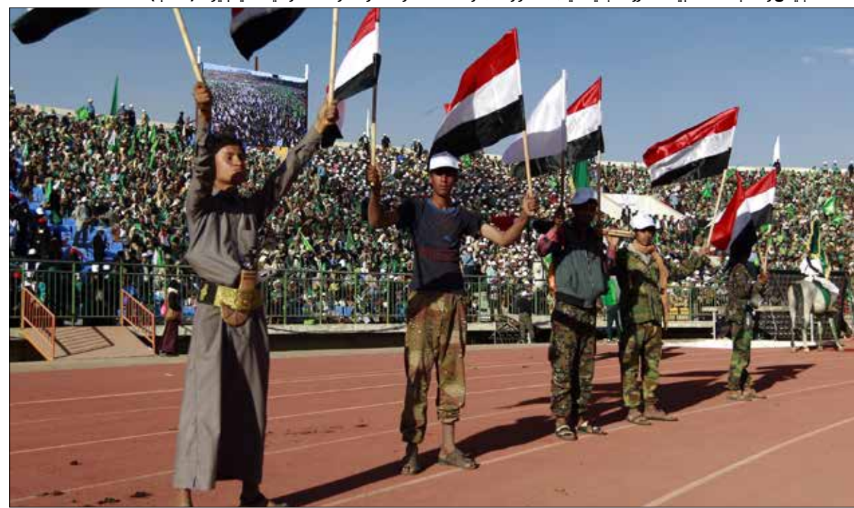
اطلق الجيش و«اللجان الشعبية» صاروخاً باليستياً من طراز «فاهر 1» على شركة «رامكو» السعودية في جيزان (أف ب)

لم يتمكن التحالف السعودي في اليمن من إحداث أي اختراق عسكري في محافظة تعز بعد أكثر من شهرين من إعلانه معركة «تحرير تعز» التي حشد لها إمكانيات عالية وتمويل كبير ومقاتلين من جنسيات مختلفة، بما فيهم مرتزقة من شركة «بلاك ووتر»، إلى جانب المجموعات المسلحة التابعة لحزب «الإصلاح» (الأخوان المسلمون) وتنظيم «القاعدة» والمقاتلين المواليين للرئيس الفار عبد ربه منصور هادي من الجنوب، في وقت حقق فيه الجيش و«اللجان الشعبية» تقدماً كبيراً في المحافظة، على وقع الضربات الموجعة التي سددها لقوات الغزو غربي تعز. عوامل عدة تسببت في فشل العدوان في السيطرة على المحافظة الاستراتيجية التي ربما كان وضع اليد عليها يمثل مرتكزاً لإعلان وقف الحرب. من هذه العوامل، النزاع السعودي الإماراتي حول هوية المجموعات المقاتلة على الأرض. ففيما تعدّ تعز حاضنة