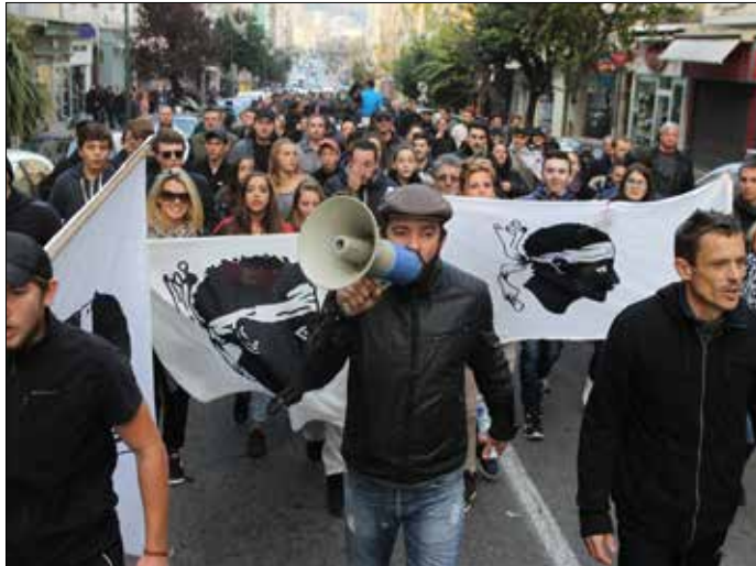
متظاهرون يحملون العلم الكورسيكي خلال تظاهرة مناهضة للعرب

ومن المقرر قريباً أن تغير فئة الـ 100 شيكل بنحويل لونها من البني إلى البرتقالي، وستحمل صورة الأديبة اليهودية ليئا جولديبرغ وكلمات من كتاباتها.