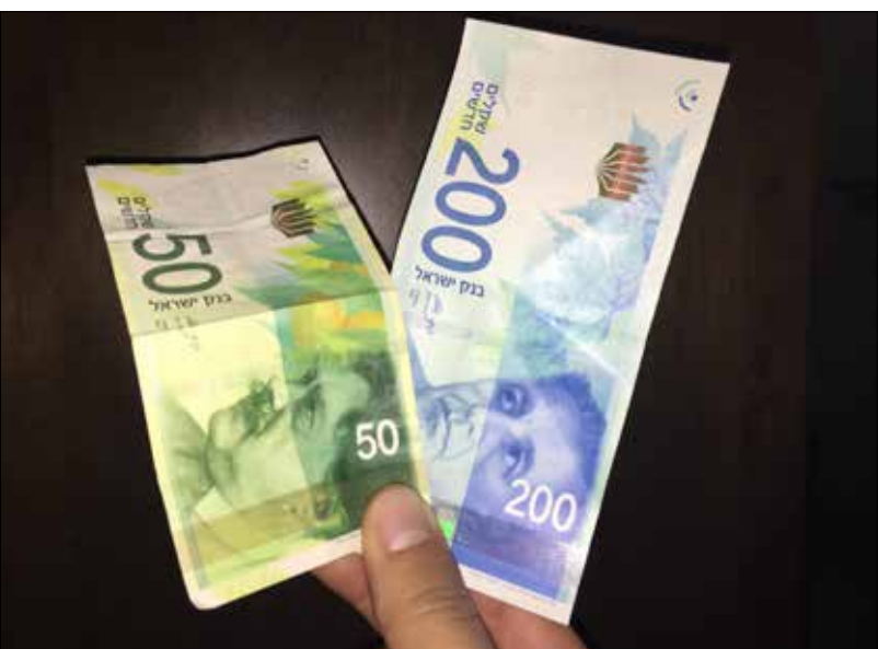
في آخر تبدلين وضمت صور شعراء بدلاً من القادة

ويرجع الريماوي السبب في ذلك إلى أن «الاحتلال الإسرائيلي 70%