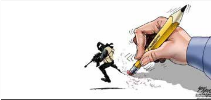
وَدَعَتْ فضاءات عراقية عاملة فيها الناء وجودهم في ميادين القتال (غاري فارفيك - الولايات المتحدة)