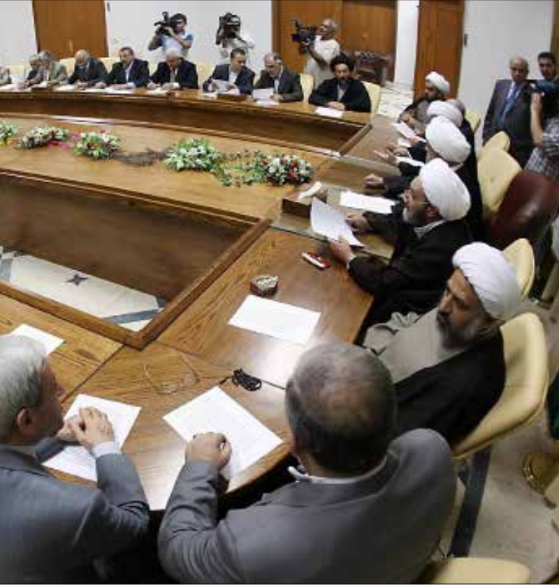
المجلس يعمل تحت شعار «تسيير المرقفة العام» (الرشيف)

المجلس الإسلامي الشيوعي الأعلى «غير مطابق للمواصفات». جمود وشغور يسيطران على كل هيكلية المجلس الذي «يمشي» اليوم تحت شعار «تسيير المرقفة العام»، فيما الانتخابات معاقبة على «شاعة» عودة النظام الى مجلسي الوزراء والنواب لاجراجه من «الكوما»