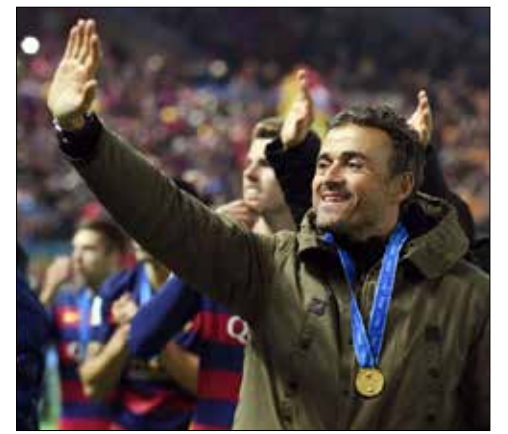
لم يستبعد أن يتركه إجراء تعاقدات في السوق الشتوية

تصدر برشلونة الإسباني العناوين أمس في ما يخص الانتقالات لمسالتين أو لاهما لحادثة شديدة الغرابة تمثلت بفسخ النادي عقد اللاعب سيرجي غوارديولا بعد ساعات من تعاقدته معه من ألكوركون لفريقه الريفيو وذلك بسبب مساندة لريال مدريد وتوجيهه إهانات لإقليم كاتالونيا. وقامت جماهير «البلاوغرانا» بإعادة نشر تغريدات للاعب تظهر تعاطفه مع الغريم ريال مدريد وتوجيهه إهانات لكاتالونيا وهذا ما أدى إلى قرار إقالته السريع. أما المسألة الثانية، فهي تأكيد مدرب الفريق، لويس إنريكة، أنه لا يستبعد