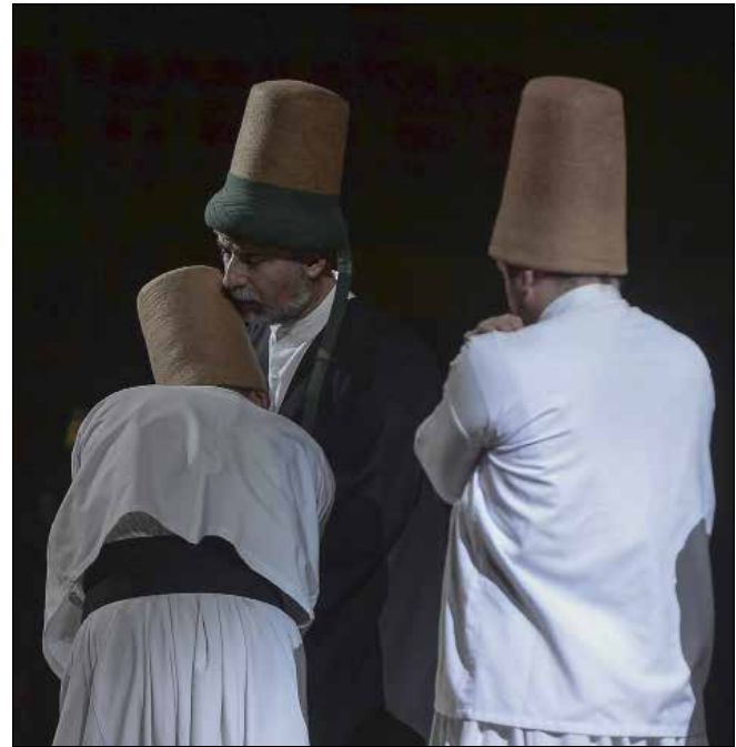
دراويش المولوية في قونيا

يعتري كثيرين، اليوم، حال من القلق الروحي والوجودي في عالمنا المضطرب بشور اهله. حال هؤلاء ليس خاصاً، بل اقرب الى كونه حالة تعم أكثر فأكثر، وتتسع دوائر المصابين بها باطراد. ولعل في مقارنة حالنا اليوم، بعصر التصوف الذهبي، القرن الثالث عشر، الذي شهد ولادة جلال الدين الرومي وبعض كبار المتصوفين كالعطار وابن عربي، تفسيراً لها يعترينا كجماعات تشتتها الايديولوجيات والتوترات المتخذة شكل الدين. فقد عُدَّ القرن الـ 13 قرن التصادم الديني والمذهبي بامتياز. وهو شهد الى سطوع نجم الصوفيين الكبار، صراعات متوحشة لم يكن أقلها اجتياح المغول بقيادة جنكيز خان للبلاد، وما ارتكبه من أفعال «تشيب لها الولدان» كما تفعل «داعش» اليوم. كان هذا القرن شبيهاً الى حد كبير بياامنا هذه (لكن من دون كهرباء وانترنت). كل ذلك في ظل تبوء الجهلة والمتطرفين سدة السلطات الدينية والدنيوية