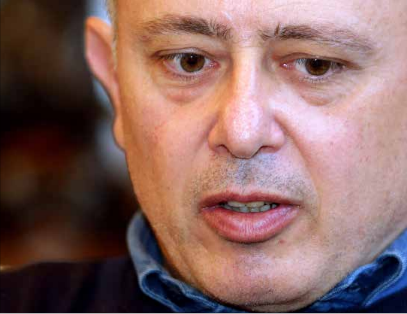
كلام السيد أثار استياء كبيراً في أوساط رئيس المردة (هيثم الموسوي)

من على منبر بكركي، أعلن حزب الله أكثر مواقفها وضوحاً لناحية دعم ترشيح العماد ميشال عون لرئاسة الجمهورية. بعد لقاء وفد من الحزب البطريرك الماروني بشارة الراعي، أعلنت الحزب بوضوح: «التزامنا بعون أخلاقي» ونقطة على السطر، «ولسنا معنيين بإقناعه بالتخلي عن ترشيحه»