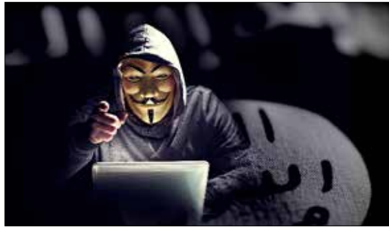
اعلنت «انونيموس» الحرب الإلكترونية على «داعش» بعد هجمات باريس