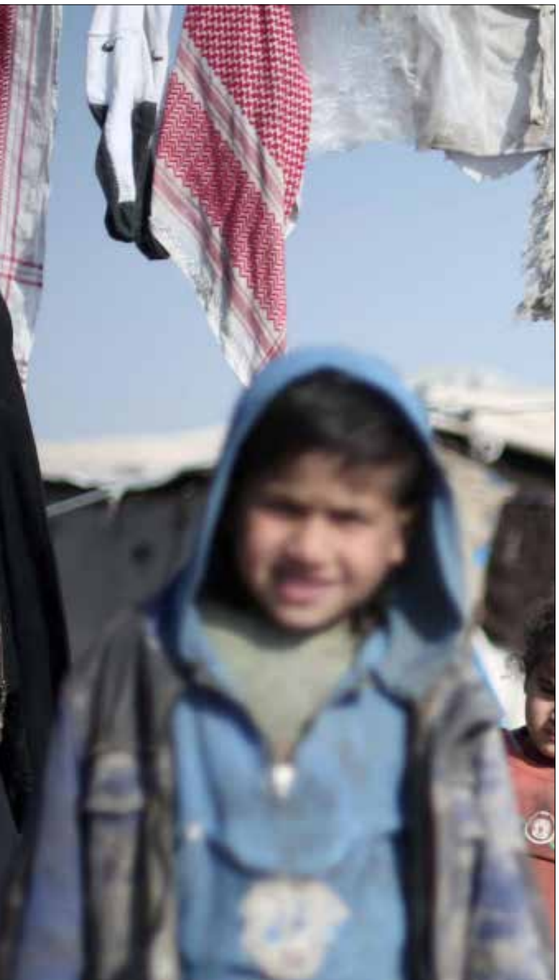
16% من السوريين غالباً ما يذهبون إلى النوم جائعين

أما في اللاذقية، فاستأنف الجيش السوري عملياته في الريف الشمالي بعد أيام من سيطرته على جبل النوبة وإنهائه عمليات تثبت قواعده النار فيه التي أسهمت في التمهيد باتجاه مرتفع جبل القصب الاستراتيجي. وبدأ الجيش والفصائل المؤازرة له التقدم باتجاه جبل القصب فجر الثلاثاء بعد