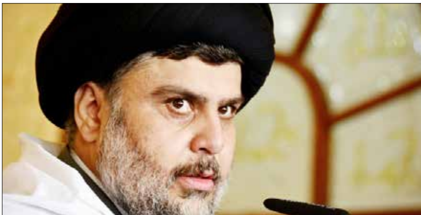
رأى الصدر أن حيدر العبادي فوّت فرصة كبيرة لأنه لم يستنصر دعم المرجعية (الرشيدة)

عراقية، نقلاً عن مسؤول أممي رفيع المستوى، بأن «4 مطلوبين اعتقلوا، بينهم أبو صفاء الدمشقي وهو سوري الجنسية ويشغل مهمة ما يسمى وزير المالية في تنظيم داعش»، كذلك أكدت أن السلطات تلقت عدة بلاغات من مواطنين عن اختبائه بين السكان. وأكد المسؤول أن «العمليات النوعية مستمرة لملاحقة عناصر التنظيم في مدينة الرمادي». كذلك، أعلنت وزارة الداخلية العراقية مقتل مسؤول المجلس العسكري لـ«داعش»، المدعو أبو أحمد العلواني، إلى جانب العشرات من الإرهابيين في الأنبار. على خط آخر، وفي ظل الاستعداد