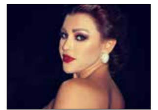
شعر لوركا سببتي في «الثقافي الجنوبي»

بعد الانتقادات التي وُجّهت إلى الأوسكار بسبب غياب السود والأقليات عن الترشيحات، برزت أخيراً حملة تدعو إلى مقاطعة الدورة الـ 88 من الاحتفال العريق، يقودها المخرج سبايك لي (الصورة)، وانضم المخرج الأميركي مايكل مور إلى الأسماء التي أعلنت مقاطعة السهرة التي ستجرى في 28 شباط (فبراير)، بينها الممثلة جادا بينكت سميث. في سياق متصل، ظهرت استنكارات جديدة لغياب التعددية عن هذه الجوائز، آخرها على لسان الممثلة لوبينا نيونج، والنجم جورج كلوني الذي أكد لحظة «فرايتي» أنّ «أكاديمية فنون وعلوم السينما» تراجعت على صعيد تمثيل الأقليات. وكان الجدل قد استعدى إصدار بيان من رئيسة الأكاديمية، شيريل بون أيزكس، تعهدت فيه بإجراء تغييرات كبيرة لم تحدّها، ومراجعة آلية تعيين الأعضاء المحكّمين.