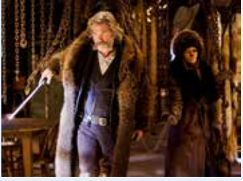
مشهد من «البيغوضون الثمانية»