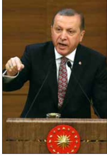
ضوء أخضر أميركي للتخلص من أردوغان أو تهويله (أضرب)

وترشح كل هذه المعطيات، على المستويين الداخلي والخارجي، أن تشهد تركيا قريباً سلسلة من التطورات المثيرة والمفاجئة، ما دام أردوغان ليس بالشخص الذي يستسلم بسهولة، فضلاً عن كونه براغماتياً يجيد اقتناص الفرص..