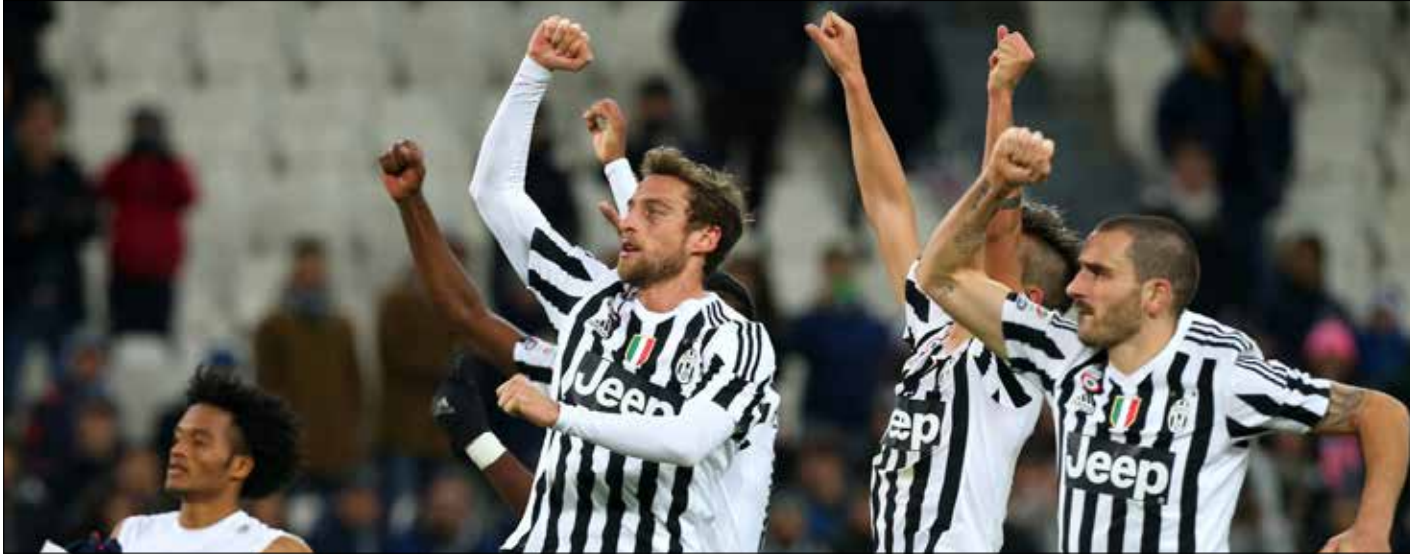
استقبلت شبكات يوفنتوس 15 هدفاً فقط منذ انطلاق البطولة

سيلتقي فريقاً يوفنتوس ونابولي مجدداً هذا الموسم، وهما في قمة الترتيب. عكس ما كانت الوضع عليه بداية الموسم. هذوقتها. حصل تغيير كبير لدى الفريقين. بتحولهما إلى خصمين. غير قادر على قهرهما أحد. والمواجهة الحالية التي تشبه الـ«ديربي» ستكون لحسم اللقب