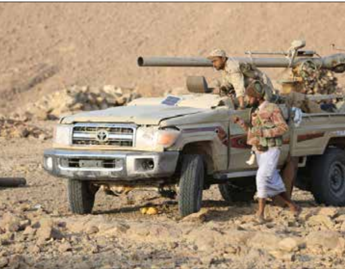
تقدم أمس الجيش واللجان الشعبية في مواقع جديدة

وبالتوتيرة نفسها في جبهة تعز، سقط قتلى وجرحى في صفوف قوات «التحالف» والمسلمين في مواجهات شهدتها أطراف مديرية حيفان جنوبي المحافظة. المصدر العسكري أكد فشل هجوم لقوات «التحالف» في حيفان بعد محاولة التقدم من ثلاث جهات، هي: بني علي والخبش ومن جهة ضبي. وفي الوقت نفسه، أكد «الإعلام الحربي» أن فراراً جماعياً تم رصد في أوساط قوات «التحالف» في مديرية المواسط على أثر استهداف معسكرهم من قبل القوة الصاروخية للجيش و«اللجان الشعبية» بصواريخ «الكتايوشا» مساء أمس.