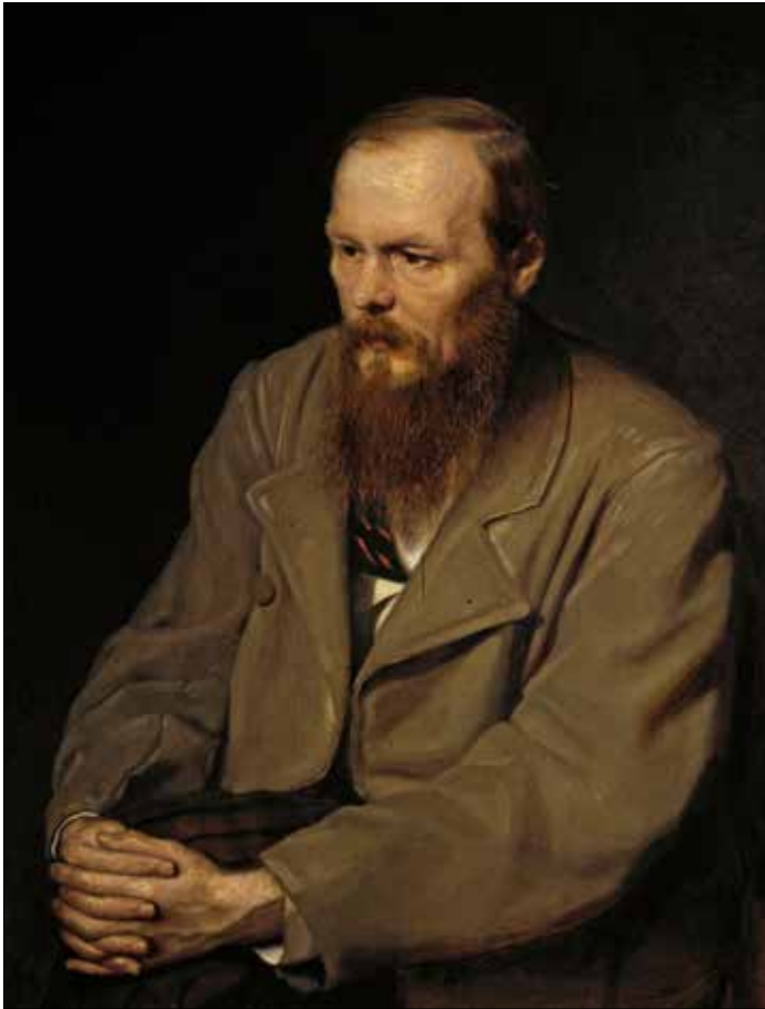
بدأت علاقته بدوستوفسكي عندما كان في الثامنة عشرة

وحين كان ينوي ترجمة رواية تولستوي «لحن كرويتزر»، قرر زيارة قرية تولستوي بغية التعرف عن كثب إلى البيئة التي كان يحيها صاحب «الحرب والسلام»، وعلى رغم مرضه الطويل، وعمله الدبلوماسي، إذ كان سفيراً لسوريا في القاهرة، والرباط، ومدريد، إلا أنه لم يتوقف عن الترجمة حتى آخر شهيق من حياته. فور انتهائه من ترجمة أعمال دوستوفسكي، قرر أن يترجم الأعمال الكاملة لتولستوي، غير أنه بالمرض. وتقول زوجته إنه نهض من السرير واتجه إلى غرفة مكتبه، ثم تناول الجزء الأول من أعمال تولستوي «الطفولة والمراهقة والشباب» وجلس إلى المكتب ليباشتر الترجمة. وحين اعترضت خوفاً على تدهور وضعه الصحي، أجابها بهدوء: «لا تتعبي نفسك، سأظل أعمل وأعمل، لأنني مؤمن بأن الحياة من دون عطاء لا قيمة لها والموت أشرف منها، وسأعمل حتى النسيمة الأخيرة من حياتي».