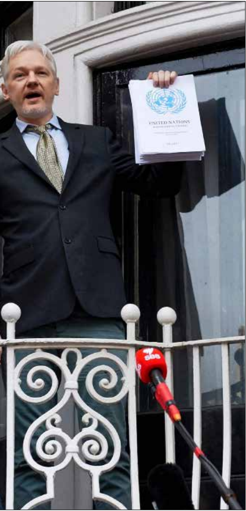
مطالبة السويد بتسليم أسانج ذات ابعاد سياسية ثلثة

ويقولون: إذا كانت الحكومة السويدية، تتحرك حقاً وفق الواجبات التي يملئها القانون والدستور عليها، فما سبب غياب هكذا حماسة قانونية بالعلاقة مع قضية أخطر بما لا يُقاس، أي تُعرّف هوية قتلة رئيس وزرائها المغدور أولوف بالمه، يوم 28 شباط 1986؟ وما سبب إغلاقها الملف بلا دعاء على مجهول!