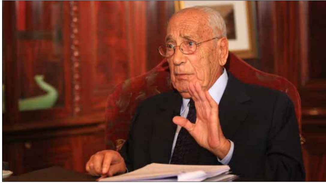
هيكل الشاهد الأكبر على تاريخ مصر الحديث

نظر إليه من داخل كواليس الذين صنعوه، وعبر كل الحقب والمراحل، والتحوّلات، والثورات... واكب الأحداث المفصّلة بوعيه المتوقّد، وثقافته الواسعة، وخبرة واسعة راكمتها عبر العهود، وحسنه السياسي المرهف، ورؤيته التحليلية، وقلمه المميز. من تأميم قناة السويس إلى محادثات الوحدة، من حرب الأيام الستة إلى حرب العصور، مروراً بكامب دايفيد وكل ما تلاها من تنازلات وانهيارات... ومن الحقبة الناصرية