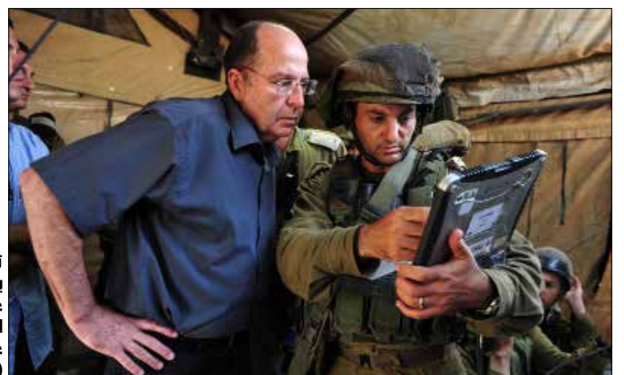
تحفظ بعلون بشدة على تخفيف الحصار البحري على غزة (الرسالة)

المقاومة، وهو أمر عبّر عنه قادتها في أكثر من مناسبة، بمن فيهم وزير الأمن موشيه بعلون. إلى ذلك، يحضر العامل الروسي في خلفية مواقف تل أبيب وأنقرة، بعدما بات جزءاً لا يتجزأ من المعادلة الإقليمية على المستويين السياسي وتوازنات القوى. فمن جهة، تحاول تل أبيب احتواء مفاعيل التدخل الروسي عبر نسج عمليات تنسيق بين الجيشين بحول دون اصطدام كل منهما بالآخر، وبما يسمح لإسرائيلي بمواصلة استهدافاته لعمليات نقل الأسلحة النوعية إلى حزب الله من سوريا وعبرها. وفي