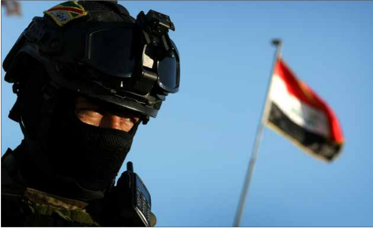
يأتي الإعلان تزامناً مع انباء عن عزم قوات اجنبية التدخل في معركة الموصل بزريعة «حماية السد» (اف ب)

وبما أن كلا الخيارين غير منطقيين، من وجهة نظر الحلف الغربي، ونظراً إلى كون أي محاولة أجنبية لضرب «داعش» والحلول مكانه كانت ستعطي نتيجة عكسية، بتقوية التنظيم الذي سيكون في هذه الحال يخوض حرباً دينية مشروعة في مواجهة «حملة صليبية» جديدة، كان العمل على ابتداء خيار ثالث، تمثل على ما تبين في وقت لاحق في تأسيس «حلف إسلامي» يتولى هذه المهمة: ضرب «داعش» وإحلال قوات