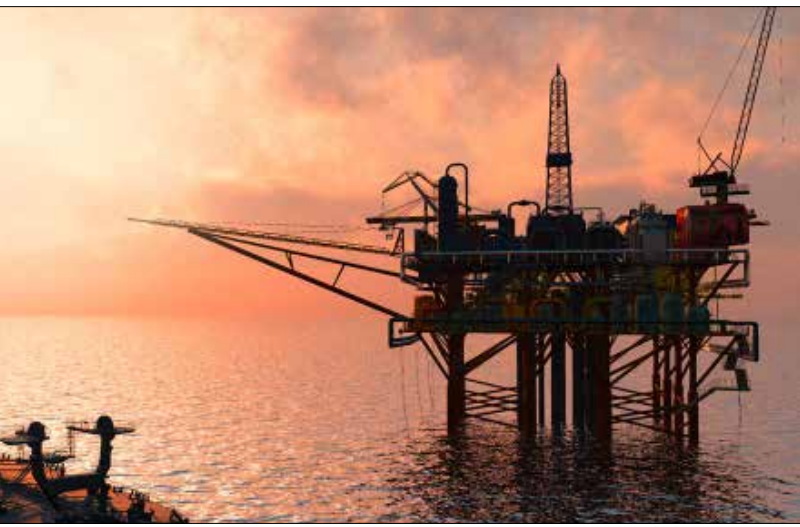
كلما تأخر لبنان في التلزيم التدريجي للبلوكات البحرية، كلما زاد احتمال خسارته للأسواق الأوروبية

تكون حصة الدولة الإجمالية من الأنشطة البترولية حوالي 65%. غير أن المشكلة الفعلية ليست في النظام الضريبي وحده بل في المرسومين العالقين للذين يؤخران عمليات البدء عن التنقيب وتجدر الإشارة إلى أنه كلما تأخر لبنان في التلزيم التدريجي للبلوكات البحرية، كلما زاد احتمال خسارته للأسواق الأوروبية التي تبحث عن مصدر غاز غير روسيا، خاصة بعد الاجتماع الثلاثي (الإسرائيلي-القبْرصي-اليوناني) الذي عقد نهاية الشهر المنصرم، والذي أدى إلى وضع أسس عملية لمُد أنبوب بحري لنقل الغاز من الشواطئ القبرصية والإسرائيلية إلى اليونان ومنها إلى باقي دول أوروبا. إلى ذلك تضاف إمكانية خسارة الأسواق الأردنية والمصرية لصالح إسرائيل التي سيفتح المجال أمامها لاستقطاب شركات لا يمكنها العمل لاحقاً في لبنان بسبب قانون المقاطعة» وأوضح الذهبي أن «النظام البترولي المالي الذي تم اعتماده في لبنان يجمع الإيجابيات الأساسية في كل من منظومة اتفاقية تقاسم الإنتاج ومنظومة الامتيازات ضمن ما عرف باتفاقية الاستكشاف والإنتاج، وتضمن هذا النظام ثلاثة مصادر عائدات للدولة من الأنشطة البترولية: الإتاوة، بترول الربح وضريبة الدخل التي تدفعها الشركات، وبهذا يكون قد جمع بين نظام الامتياز والنظام التعاقدية». وأضاف: «في مرحلة أولى، يتم تحصيل الإتاوة، كما هي الحال في نظام الامتيازات، وقبل تقاسم الإنتاج، تسترد الشركة التكاليف التي تكبدتها من كميات البترول المنتج ويشار إلى العائدات المتبقية، بعد تحصيل الإتاوة واسترداد التكاليف، بترول الربح الذي يتم تقاسمه بين الدولة والشركات. ويعتبر النظام المالي المعتمد تصاعدياً إذ أنه كلما