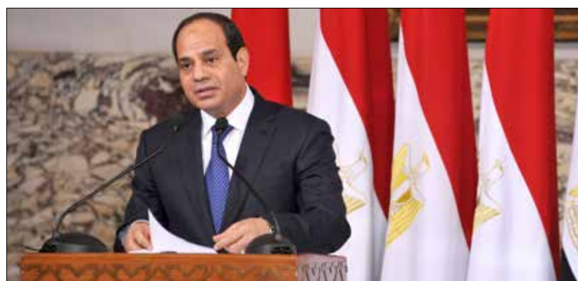
جلسة السبت هي خطاب للرئيس فقط