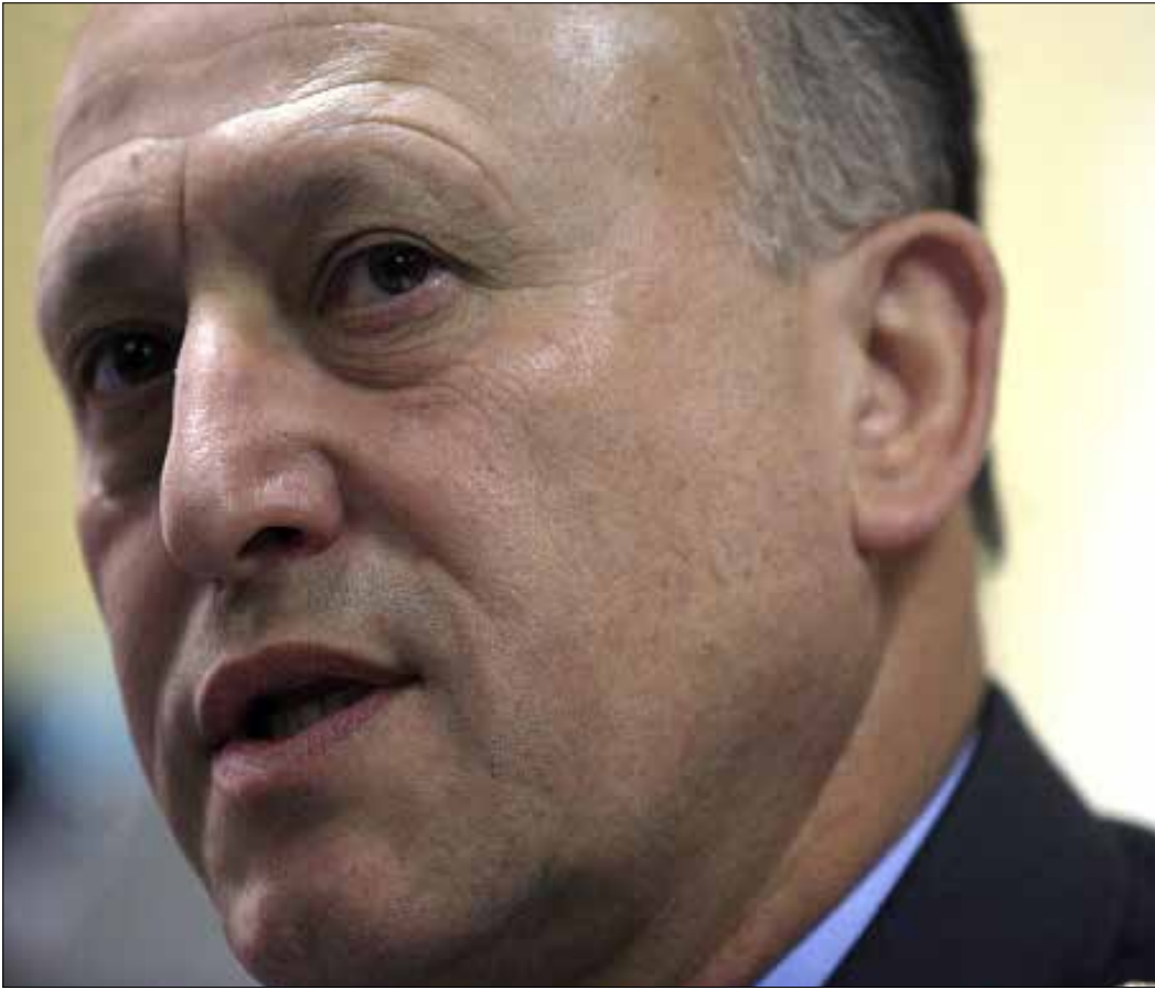
يقول مستقبليون إنه ليس من مصلحة الحريري فتح معركة مع ريفي قبل الانتخابات البلدية

ما إن تجاوز الرئيس سعد الحريري صفقة النائب خالد الظاهر له، حتى تمرد الوزير أشرف ريفي، ما دفع رئيس «المستقبل» إلى توبيخه علناً. تتعدّد القراءات في التيار الأزرق بشأن هذه المواجهة، ليزر سؤال رئيسي: هل قرر الرئيس المهاجر تحجيم وزيره علناً، تمهيداً لإبعاده على خطى الظاهر؟