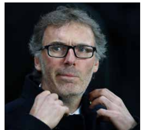
لوران بلان

مدد لوران بلان عقده في تدريب باريس سان جيرمان حتى 30 حزيران 2018، بحسب ما أعلن متصدر الدوري الفرنسي لكرة القدم وبطل المواسم الثلاثة الماضية. وقال سان جيرمان في بيان غداة الفوز على ليون 3-0 والتأهل إلى ربع نهائي مسابقة الكأس التي يحمل لقبها: «لوران بلان بات مرتبطاً ببنادي العاصمة حتى 30 حزيران 2018».